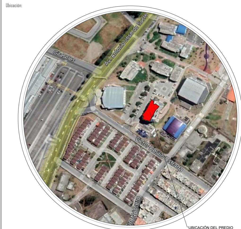
UBICACIÓN DEL PREDIO