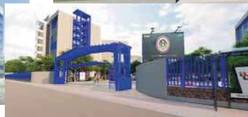
NUEVO CAMPUS GUANO