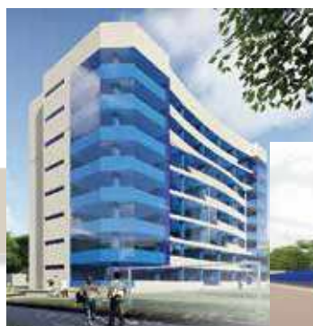
NUEVO EDIFICIO FACULTAD CIENCIAS DE LA EDUCACIÓN (AVANCE 78%)