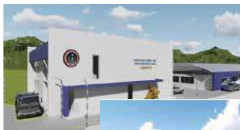
NUEVAS CLÍNICAS ODONTOLÓGICAS