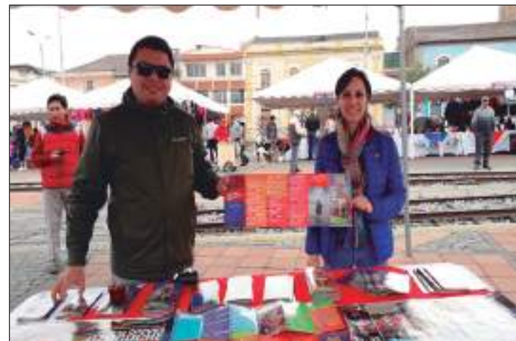
► Dirección de Turismo del GADPCH promocionó eventos turísticos.

de la Facultad de Agroindustrial de la Universidad Nacional de Chimborazo (Unach), participaron con varios stands en los cuales ofertaron una gran variedad de productos.