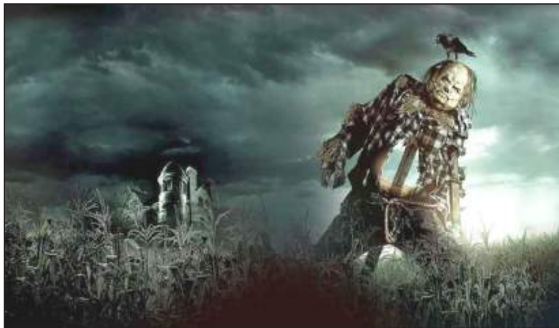
► En este filme, a través de una joven escritora de terror unos adolescentes se enfrentan a la idea de que todo lo que escriben se hace realidad.

Cuando estrenó el filme en Estados Unidos inauguró su estrella en el Paseo de la Fama de Hollywood, solo una