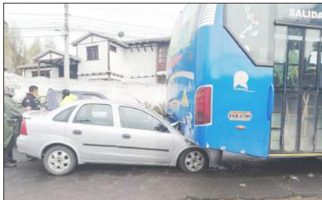
El siniestro no dejó personas heridas.