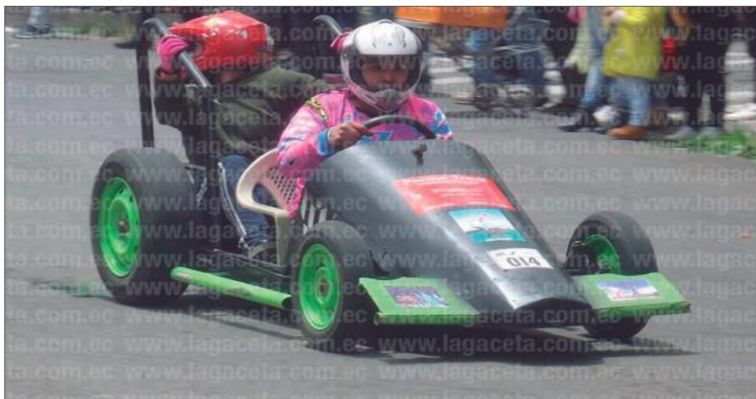
► Escenas de la competencia de 2018.