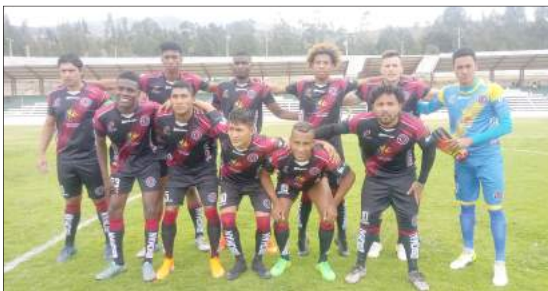
▶ San Francisco de Cañar jugará con la "radio en el oído".

El San Francisco, equipo campeón del Cañar, tendrá un difícil rival ante el elenco del Deportivo Guano, este domingo 22 de septiembre a las 13H00 en el Estadio Jorge Andrade.