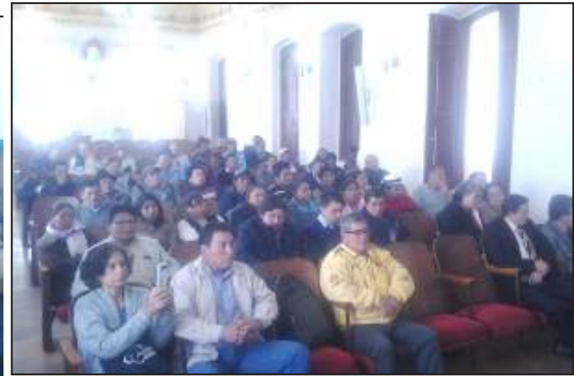
▶ Directivos y habitantes del cantón en el Municipio.

Con la finalidad de socializar el dar sentido a la investigación, definir la agenda del foro, y el criterio de la convocatoria, se cumplió ayer una reunión de trabajo al que asistieron los técnicos, autoridades del cantón Riobamba, concejales, técnicos, investigadores y los productores de la provincia.