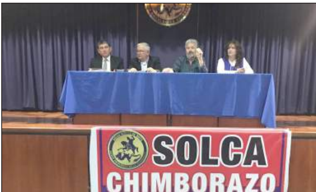
Los miembros de la Junta directiva y el director ejecutivo ofrecieron rueda de prensa

Este miércoles en horas de la mañana, en las instalaciones del Hospital de Solca Chimborazo, se registró malestar en los pacientes y personal del Hospital, por la presencia de representantes de la Junta directiva de Tungurahua, quienes presuntamente querían destituir al director de esta casa de salud.