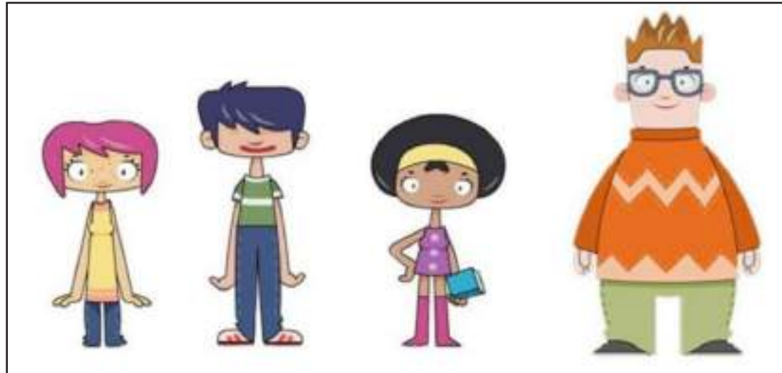
Imagen facilitada por el foro Cartoon Forum de Toulouse, donde ha sido presentada la primera serie infantil de animación en el mundo que aborda la sexualidad de manera educativa.