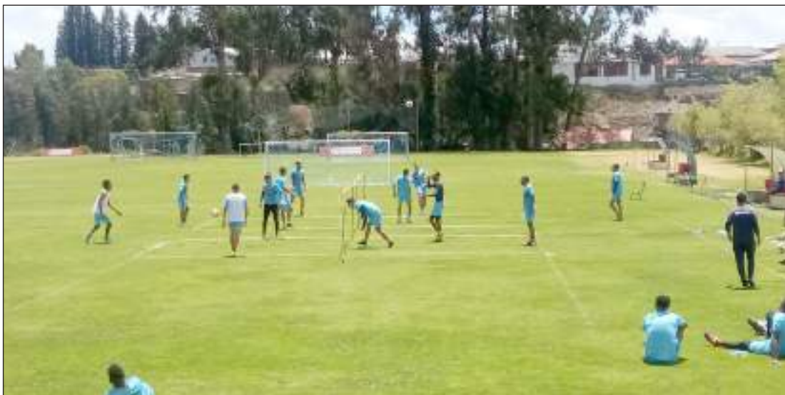
Entrenamientos del Olmedo en el Complejo Deportivo.