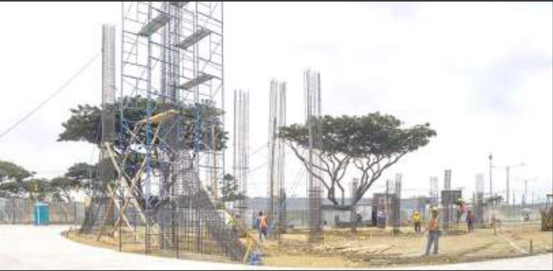
► El Monumento a Jaime y Martha incluye las estatuas del expresidente y su esposa, además de un complejo arquitectónico por donde se podrá caminar.