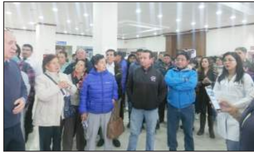
Pacientes y personal de Solca Chimborazo mostraron su malestar.

Una presunta confusión sobre brigadas de prevención contra el cáncer y un falso ofrecimiento de la creación de un núcleo de Solca, serían las causas por las que el personal de Solca Tungurahua solicitaría la destitución del director de Solca Chimborazo, y de un posible traslado del Hospital a Ambato.