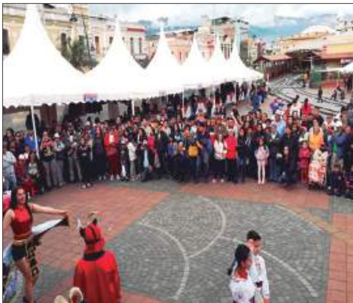
► Decenas de personas disfrutaron de la feria de emprendimientos.