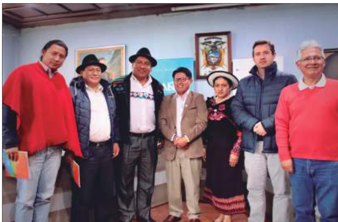
Las autoridades hablaron de diferentes temas en la reunión.