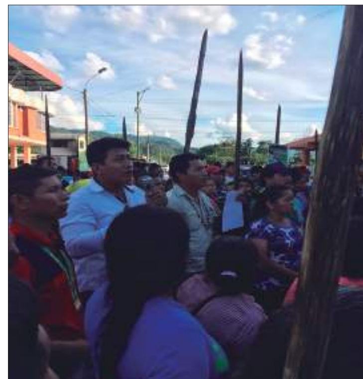
► Manifestación de las nacionalidades indígenas en el Municipio de Santa Clara.

Integrantes del Pueblo Kichwa de Santa Clara y con respaldo de las otras nacionalidades indígenas de Pastaza, hicieron un plantón frente al Municipio de este cantón para exigir la salida inmediata de la maquinaria de la empresa Genefran, constructora de la hidroeléctrica en el río Piatúa.