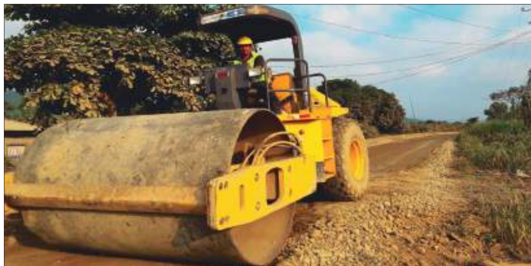
Trabajos de colocación de base el último tramo para la posterior colocación de carpeta asfáltica.