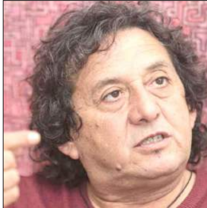
► El artista ya fue director del festival en su primera y segunda edición.

Para esta edición, la empresa Satre Comunicación Integral volverá a participar en la producción del FIAVL, esta vez en su totalidad. En 2017 y 2018 fue subcontratada por Ekos.