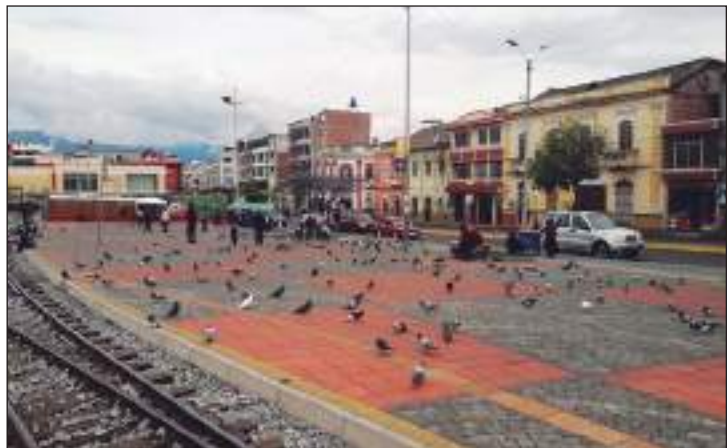
► Barrio La Estación, un atractivo en medio de la adversidad.