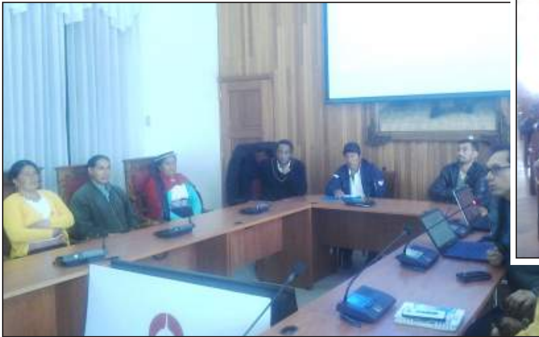
▶ Autoridades, dirigentes, técnicos y funcionarios en el salón municipal.

El foro se cumplió este miércoles desde las 10h00, con la presencia de los productores del cantón.