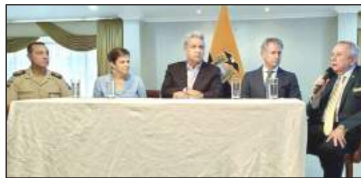
El presidente de la República, Lenín Moreno (c)

los jóvenes hoy en día y los problemas a los que se enfrentan. Los métodos contraceptivos, las erecciones o los cambios de un cuerpo de niño a uno de adulto centran algunas de sus dudas más frecuentes y protagonizan por separado cada capítulo donde son los propios órganos los encargados de explicárselas. La serie buscaba dar voz a una figura distinta a la paterna. Y, además de informar, quiere entretener: "Cuenta historias en forma de comedia y de manera natural, que es el lenguaje perfecto para llegar a los jóvenes", explica Mora, valenciana de 49 años. El capítulo piloto tiene como protagonistas a los ovarios, que explican el fenómeno de la menstruación de forma didáctica y en clave de humor. El proyecto, producido por TV On Producciones, costará 1,8 millones de euros (1,98 millones de dólares) y ya dispone de la mitad de la financiación, toda española. El objetivo de Mora es finalizar la serie a lo largo de 2020 y su presentación en el Cartoon Forum tuvo como objetivo intentar conseguir el presupuesto restante. (I)