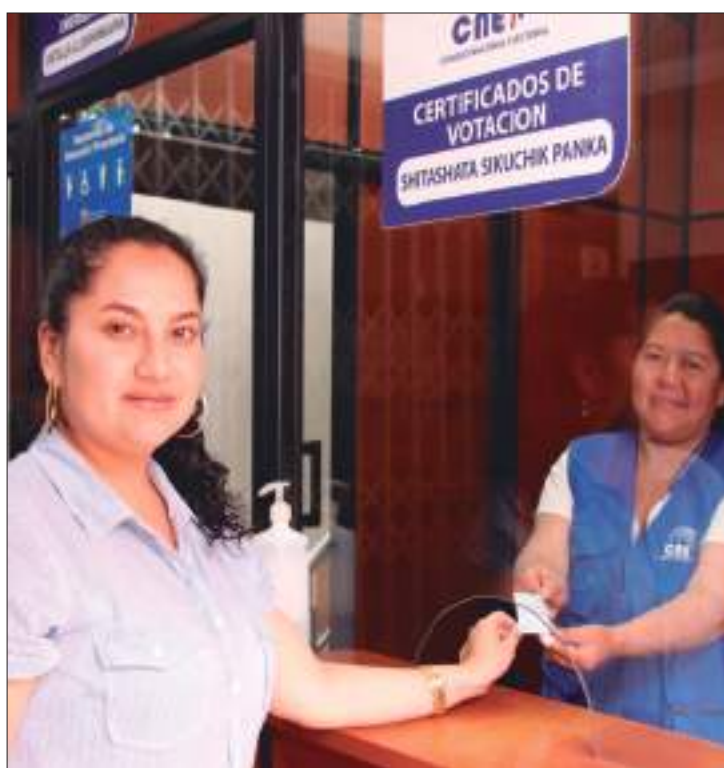
Hasta el momento se han entregado 1548 certificados de votación.

Asimismo, en el caso de las personas que fueron designados Miembros de las Juntas Receptoras del Voto y no asistieron a integrarla, deberán pagar una multa equivalente