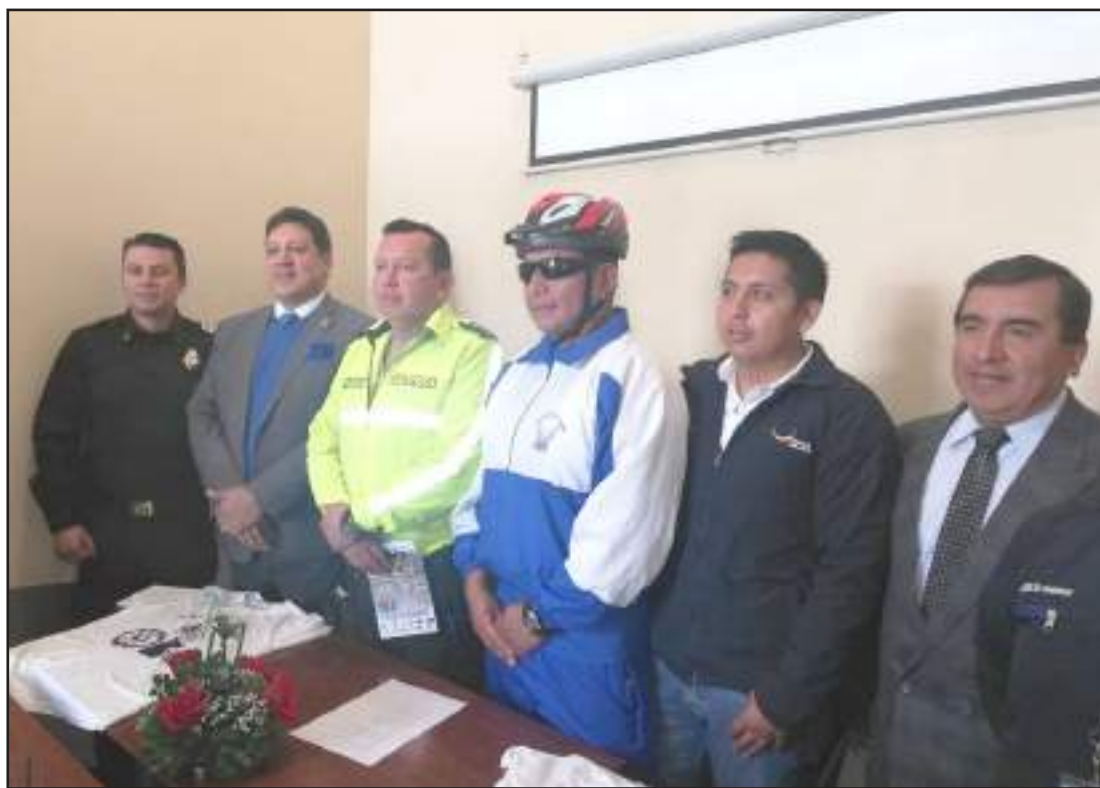
Teniente Político del cantón y representantes de instituciones de seguridad.