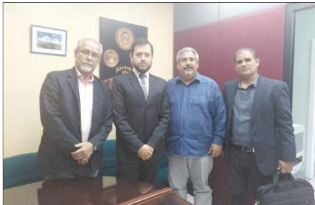
La Red Ecuatoriana de Pedagogía realizó la conferencia “Agenda 2030”.