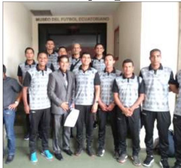
Árbitros ecuatorianos del fútbol profesional.

Los últimos acontecimientos en el arbitraje, donde en el cotejo entre El Nacional y Técnico Universitario, el árbitro de ese