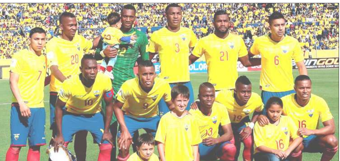
► Selección de Ecuador buscará "afinar" sus líneas ante México.