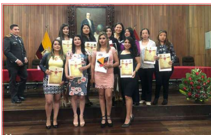
Las flamantes graduadas posando para Andes Social.