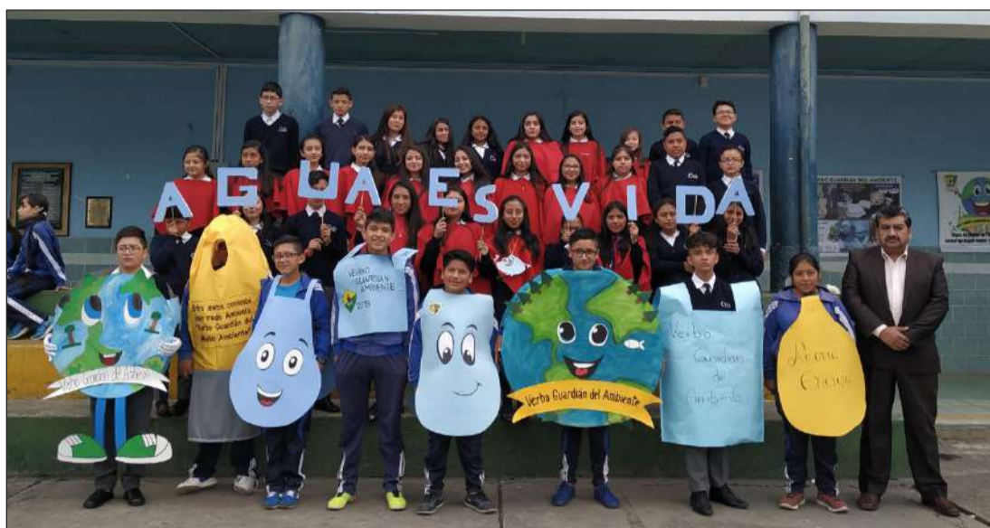
► Este es un proyecto que se viene desarrollando desde el año 2015.