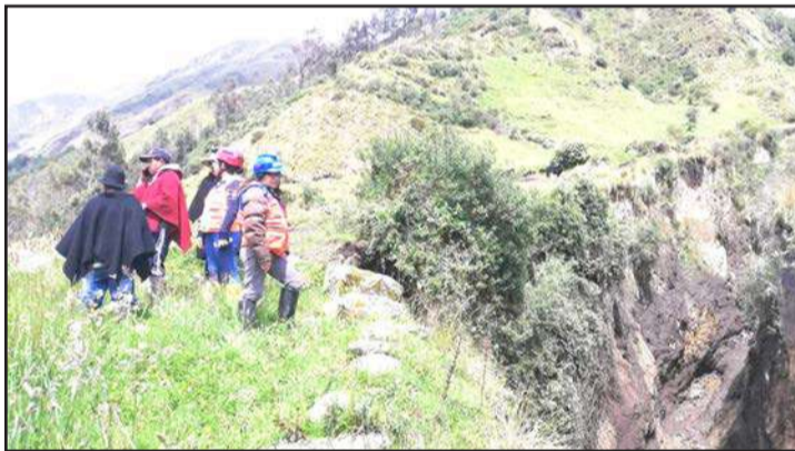
► Autoridades del SNGRE y Municipio de Riobamba atendieron emergencia.

Un aluvión de tierra y lodo se produjo la madrugada de este martes 5 de junio. El evento ocurrió en una comunidad de la parroquia Pungalá en Riobamba.