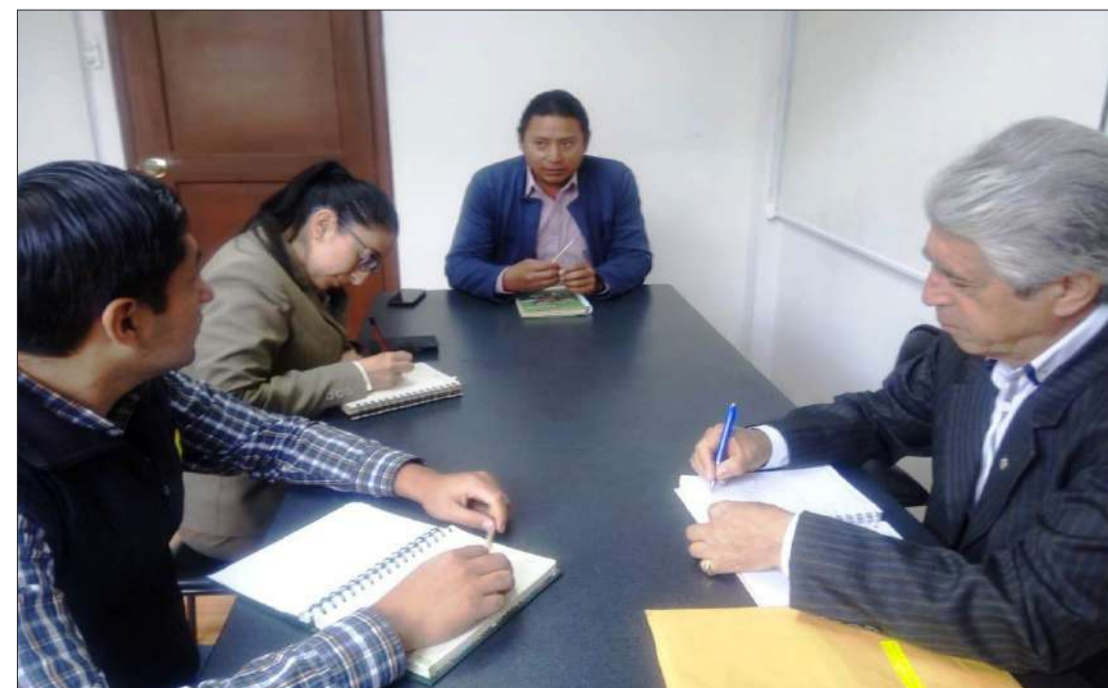
► Autoridades abordaron diferentes temas durante la reunión.