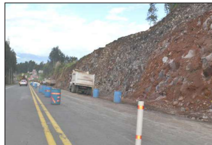
► El proyecto se ejecuta en la primera fase que comprende 18 Km de longitud.

Continúan los trabajos de ampliación en la vía Riobamba-Ambato. La primera fase del proyecto vial comprende 18 Km de longitud.