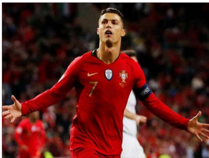
► Cristiano Ronaldo celebra uno de sus tres goles a Suiza.

El combinado portugués espera a Holanda o Inglaterra en la final de la competición tras sufrir para derrotar a Suiza en semifinales.