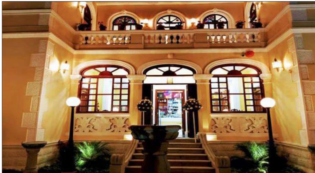
► Vista panorámica de las instalaciones de “Patrimonio” Restaurante.