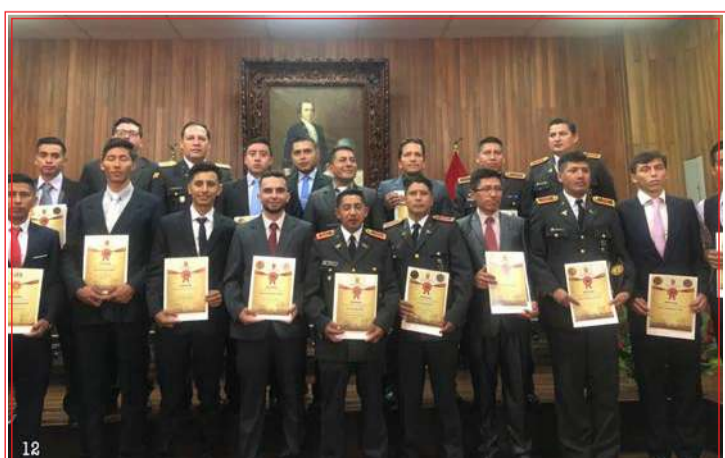
Los estudiantes certificados siendo parte de La foto oficial del evento.