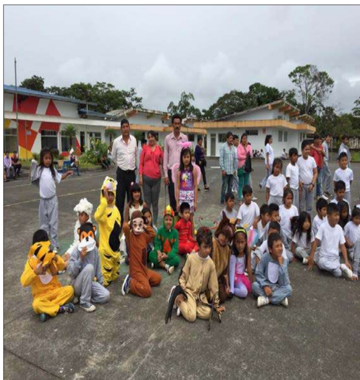
▶ Día del Ambiente en la Unidad del Milenio-Tarqui.

Las autoridades del Ejecutivo: Distrito de Educación, Dirección del Ambiente, GAD Provincial, entre otras, se concentraron en la Unidad del Milenio, parroquia Tarqui, para celebrar esta fecha importante y hacer conciencia sobre la urgencia de proteger la naturaleza y asegurar la vida de la presente y futuras generaciones.