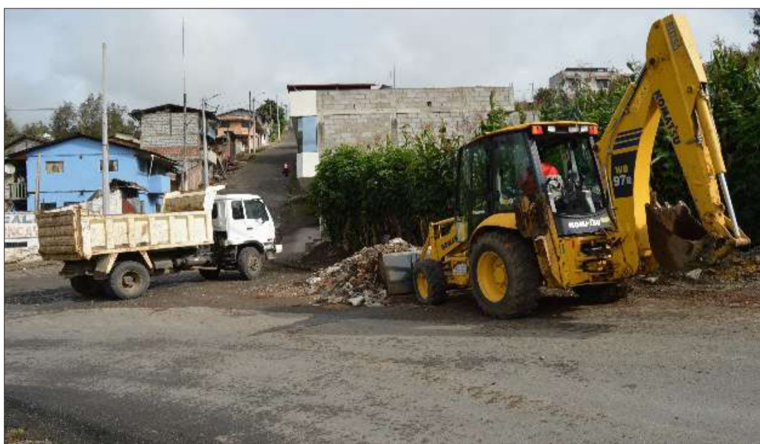
► En el caso que los propietarios hagan caso omiso a los avisos, se procede al retiro del material.