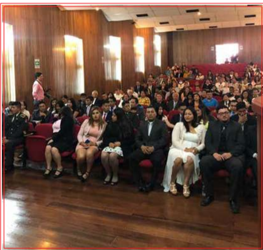
De distintas ciudades del Ecuador llegaron a Riobamba los flamantes estudiantes certificados.

El Salón de la ciudad recibió a los flamantes estudiantes certificados como APH Paramédicos 1 de Jatun Yachay Sovilex avalizado por la Universidad Católica de Cuenca. FN.