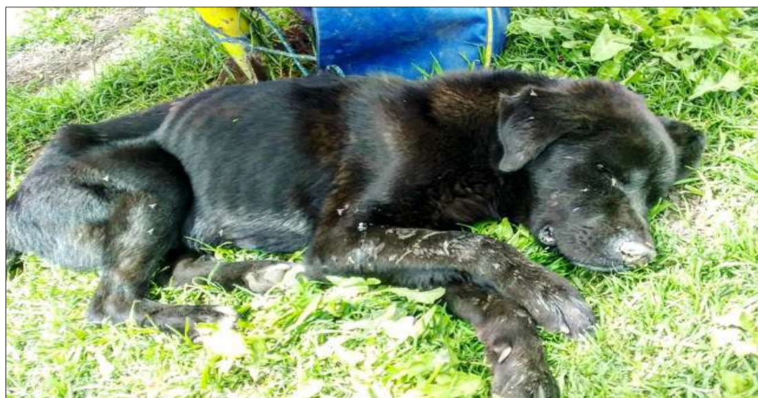
► La esterilización en las mascotas machos y hembras tiene varias ventajas.