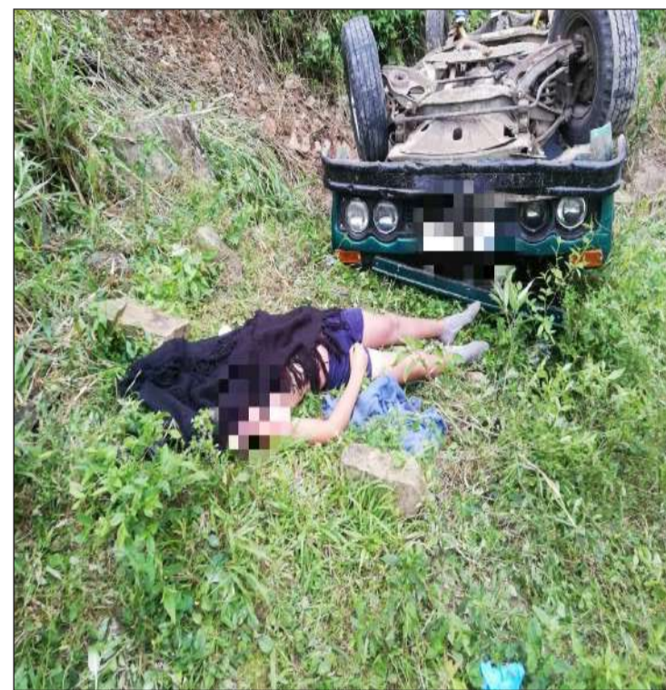
► El cuerpo del hoy occiso fue ingresado a la morgue.