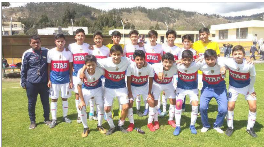
► Selección del Colegio Salesiano ganó a la Selección del Maldonado.

En la cancha de la Asociación de Fútbol No Aficionado de Chimborazo, empezó la mañana de ayer, el torneo de fútbol de la Segunda y Tercera categoría intercolegial, con la presencia de algunos estudiantes que acompañaron a su colegio.