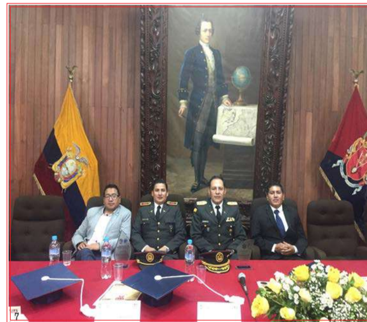
Autoridades de la mesa directiva.