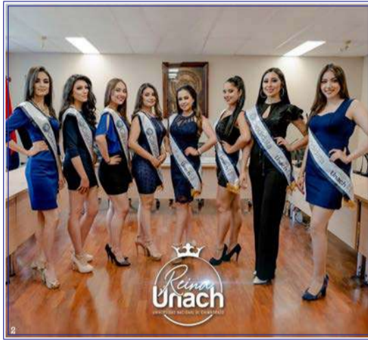
8 fueron las hermosas candidatas que representaron a las 4 facultades de la Unach.