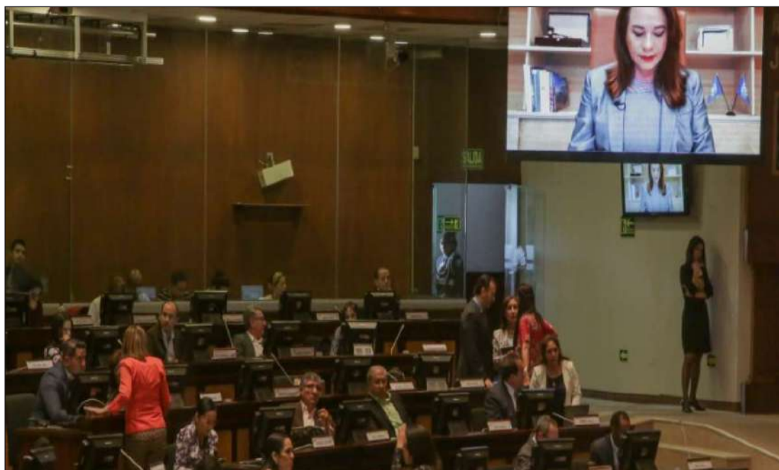
► La excanciller María Fernanda Espinosa ejerce su derecho a la defensa a través de videoconferencia.

El pleno de la Asamblea Nacional instaló este miércoles 5 de junio del 2019 la sesión en la que se realiza el juicio político contra la exministra de Relaciones Exteriores, María Fernanda Espinosa.