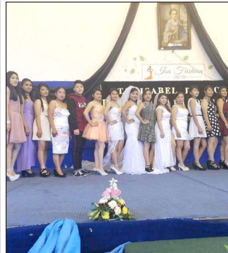
► Las alumnas lucieron sus trabajos.