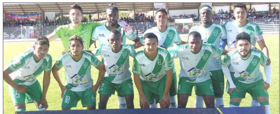
► Alianza de Guano juega ante el Darwin el sábado a las 14H00.

El torneo de la Segunda Categoría del Fútbol profesional de Chimborazo, que lo regenta la AFNACH, continúa este fin de semana con los cotejos entre el Darwin y el Alianza el sábado y el Independiente San Pedro vs Deportivo Guano, el domingo.