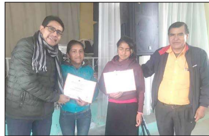
► La clausura del taller se desarrolló el 1 de junio.