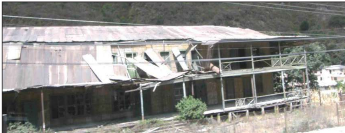
El antiguo edificio de la gerencia del ferrocarril en la parroquia Huigra.