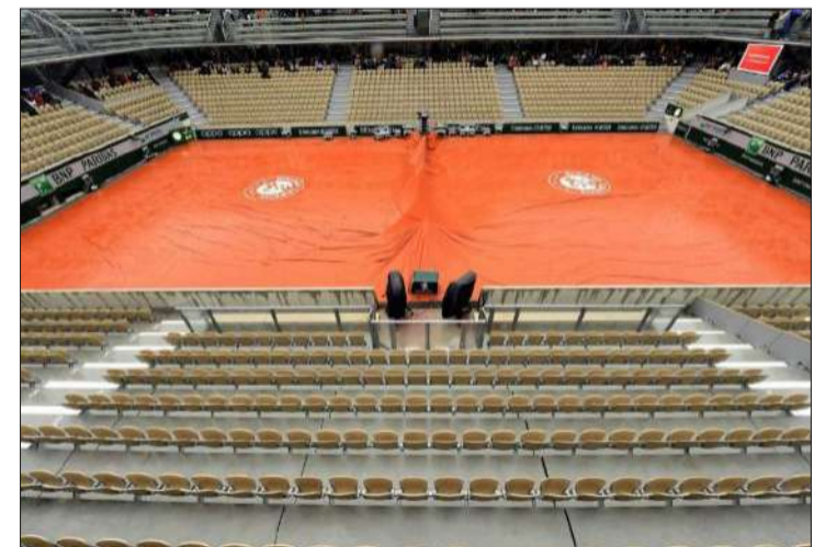
► La Central de Roland Garros, cubierta por la lluvia.

Los dos semifinalistas masculinos (Djokovic-Zverev y Thiem-Kachanov) jugarán jueves y viernes. Las del cuadro femenino buscarán sitio en la final el viernes y lucharán por el título el sábado.