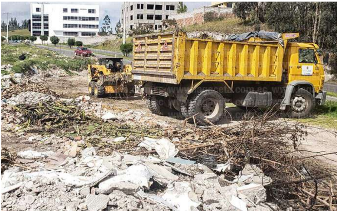
▶ Varias toneladas de basura fueron levantadas en cinco sitios de la ciudad por el Día del Ambiente.

Algunas toneladas de basura fueron levantadas en varios sitios de la ciudad con el apoyo de instituciones públicas y educativas, entre ellos las riveras del Cutuchi, los humedales en la vía San Buenaventura; asimismo uno de los objetivos para el presente año, es reducir el uso del plástico en la realización de las diferentes actividades.