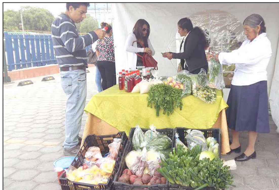
► La Feria Yo Prefiero se desarrollará hoy en la Plaza Alfaro.