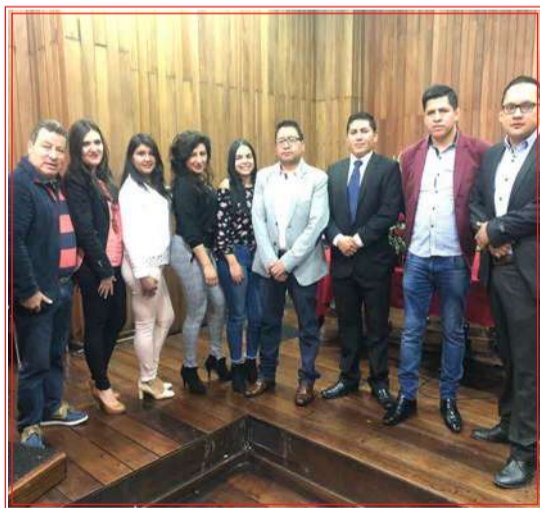
Directivos, docentes y representantes de Jatun Yachay Sovilex.