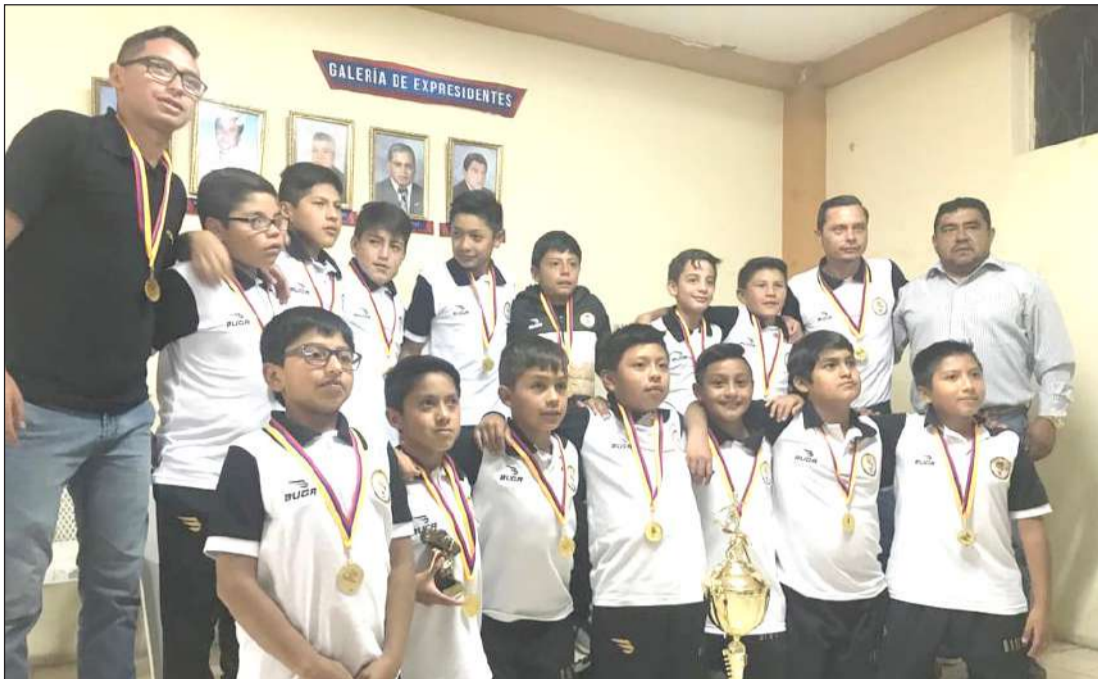
► Equipo de Los Dioses del Fútbol representa a Chimborazo.