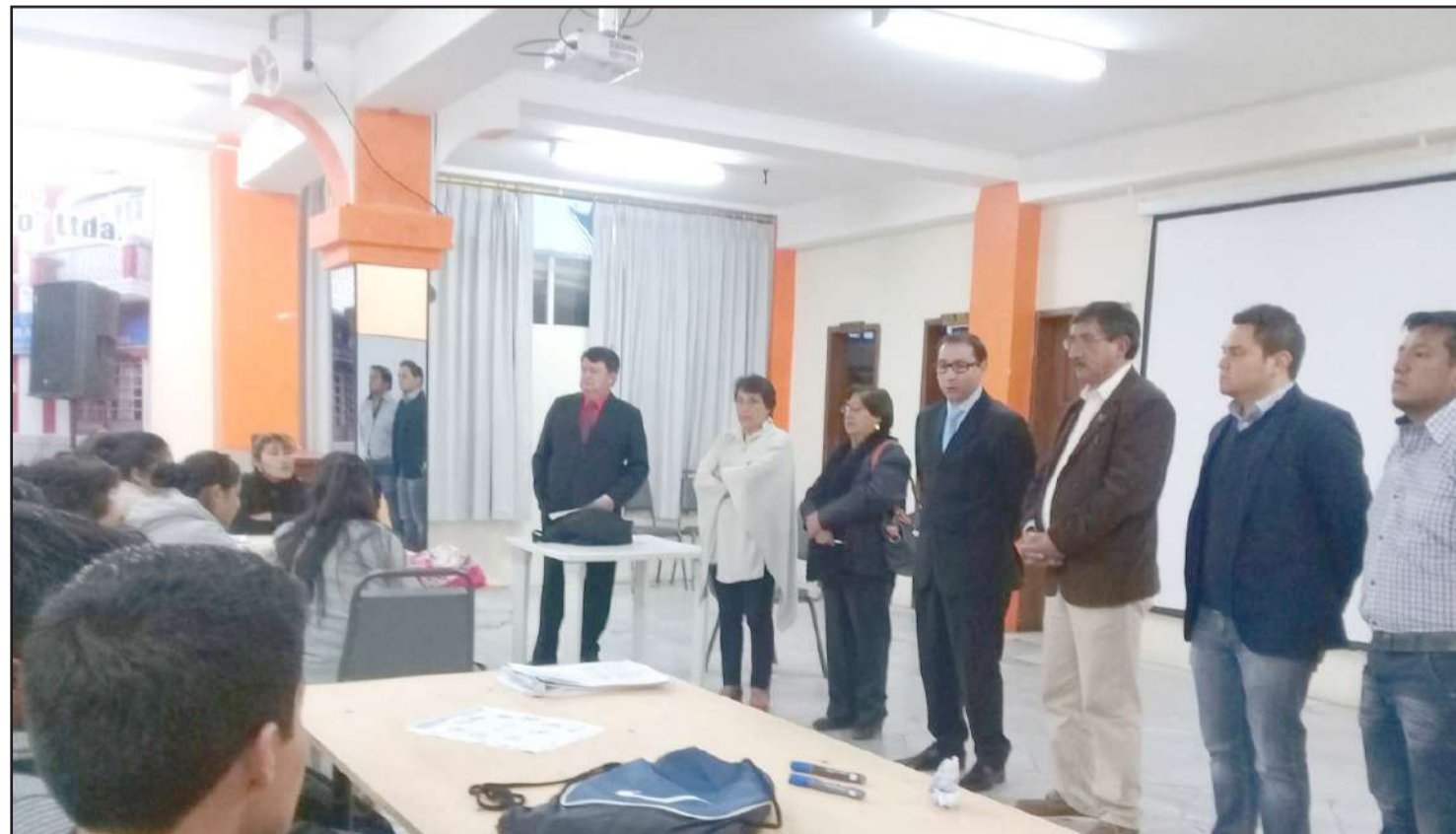
► El taller se realizará en varias unidades educativas de la ciudad.