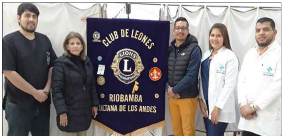
► Equipo que realiza estas pruebas.