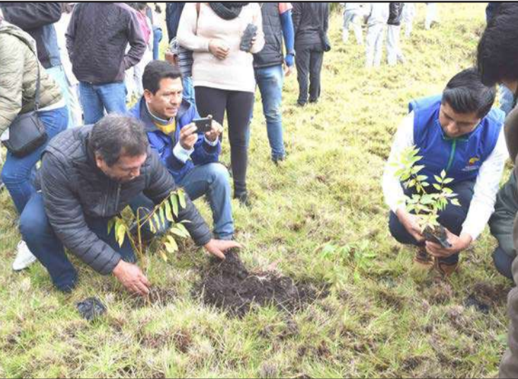
Autoridades colocan las plantas en el suelo.

y proteger el ambiente con la siembra de plantas nativas. "Es bueno agradecer la presencia y participación de los estudiantes que son el futuro de nuestra patria. Luego del acto de inauguración, los jóvenes estudiantes