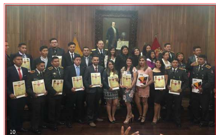
Hombres y mujeres de la prestigiosa Promoción.