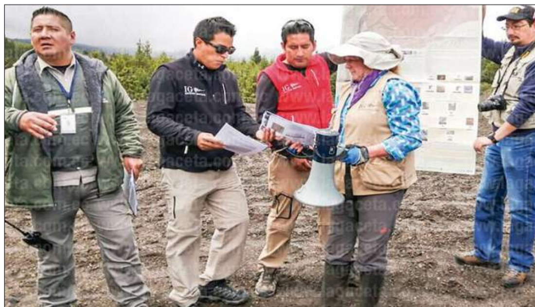
▶ Durante el recorrido por el coloso.