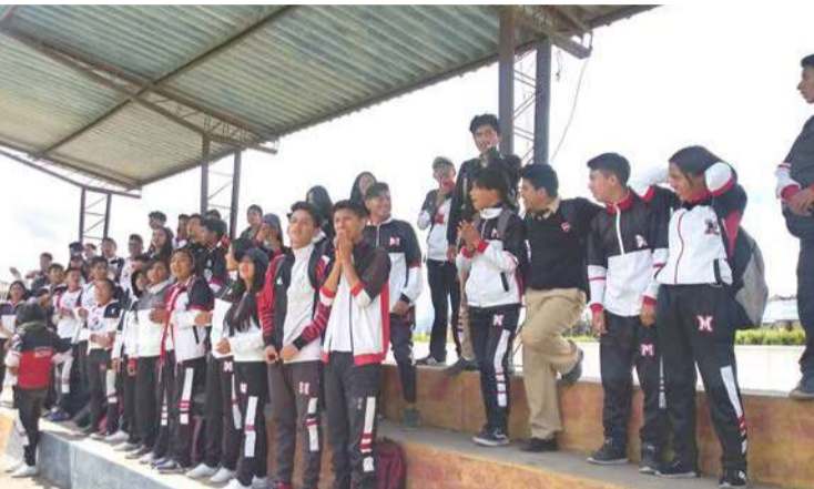
► Alumnos del Colegio Maldonado apoyando a su institución.

po "Santo" y el Maldonado, el equipo salesiano tuvo mejor fútbol, varios de sus integrantes juegan en el equipo del Star en la categoría Sub 17 e inclusive algunos de ellos son jugadores del equipo olmedino y esa diferencia al final se notó, pese al gran esfuerzo por parte de los jugadores maldonadinos que