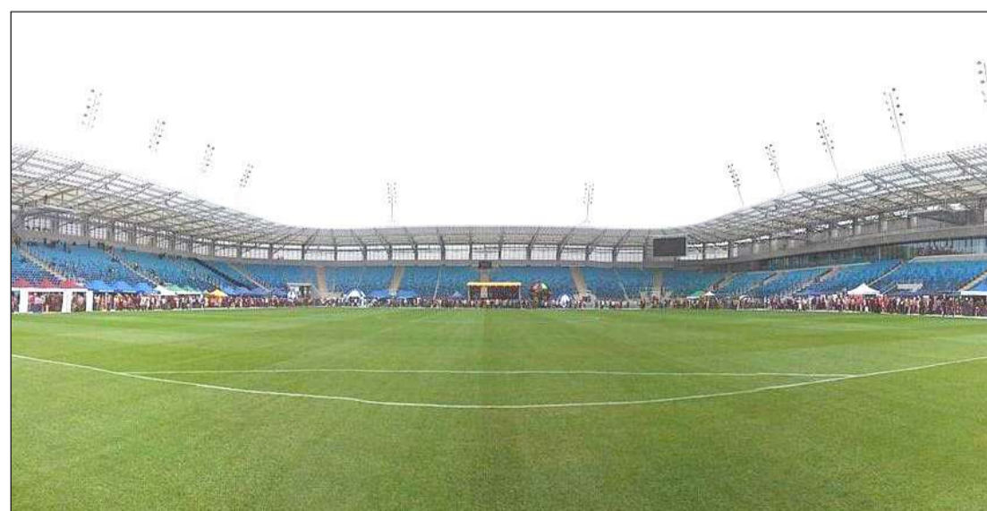
► Stadium GOSIR de la ciudad de Gdynia.

De acuerdo a varios allegados a la selección, la equivocación de los organizadores de este Mundial en ubicar a las dos selecciones sudamericanas juntas, casi provoca problemas, pero los jugadores ecuatorianos reaccionaron muy bien.