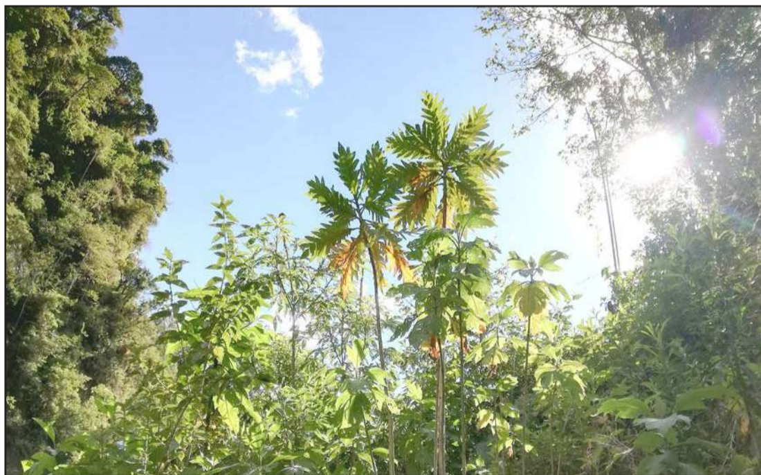
► Cuidar el medio ambiente es el propósito.