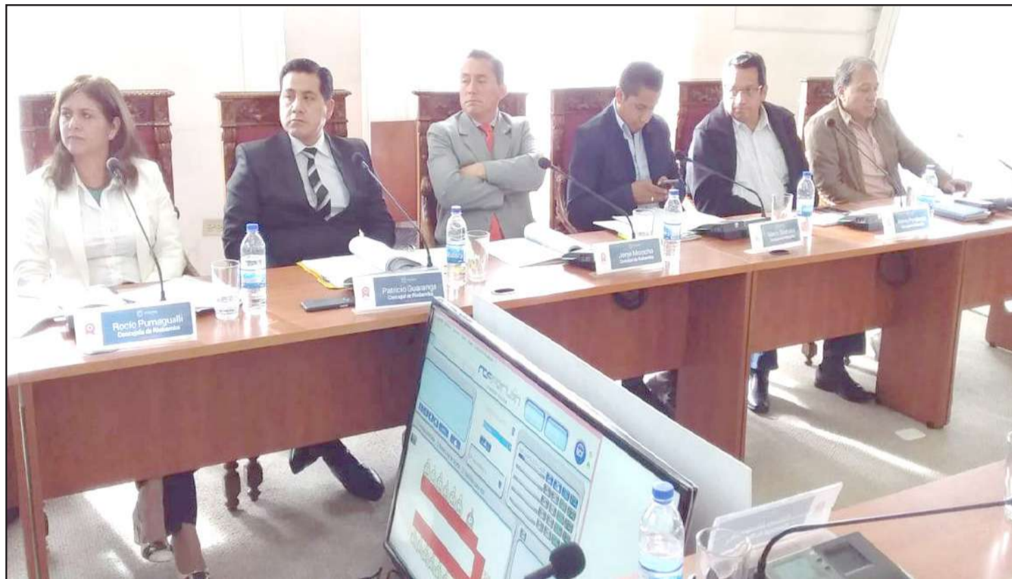
► Realizar un taller que permita establecer qué tipo de ciudad se requiere, fue el planteamiento central en la sesión.

Durante la sesión ordinaria de Concejo Municipal, se analizó un proyecto de ordenanza sobre la regulación de la cooperación internacional no reembolsable y asistencia técnica en el cantón Riobamba.