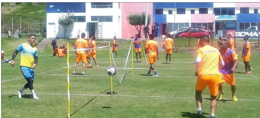
► Olmedo volvería a las prácticas hoy.