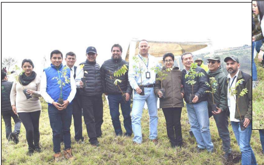
Las autoridades de la provincia recibieron las plantas para ubicarlos en el terreno.