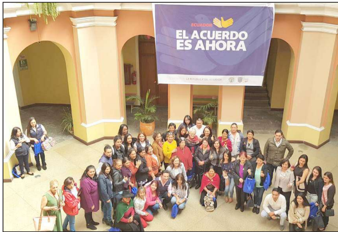
► La entrega de la tarjeta de subsidio inicia hoy, así se dio a conocer la tarde de ayer.