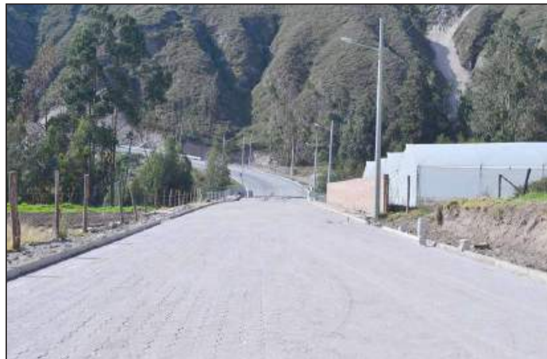
► El plazo es de sesenta días para entregar la obra.