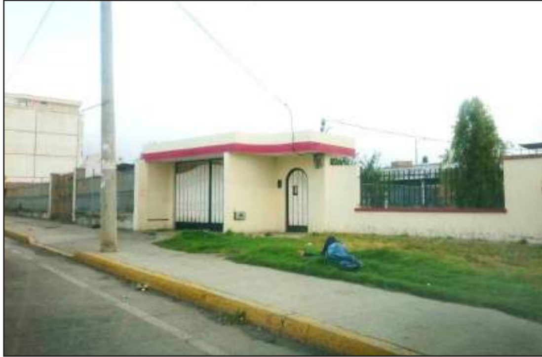
► Mientras se analiza la propuesta de ordenanza aún se ve gente en estado etílico.