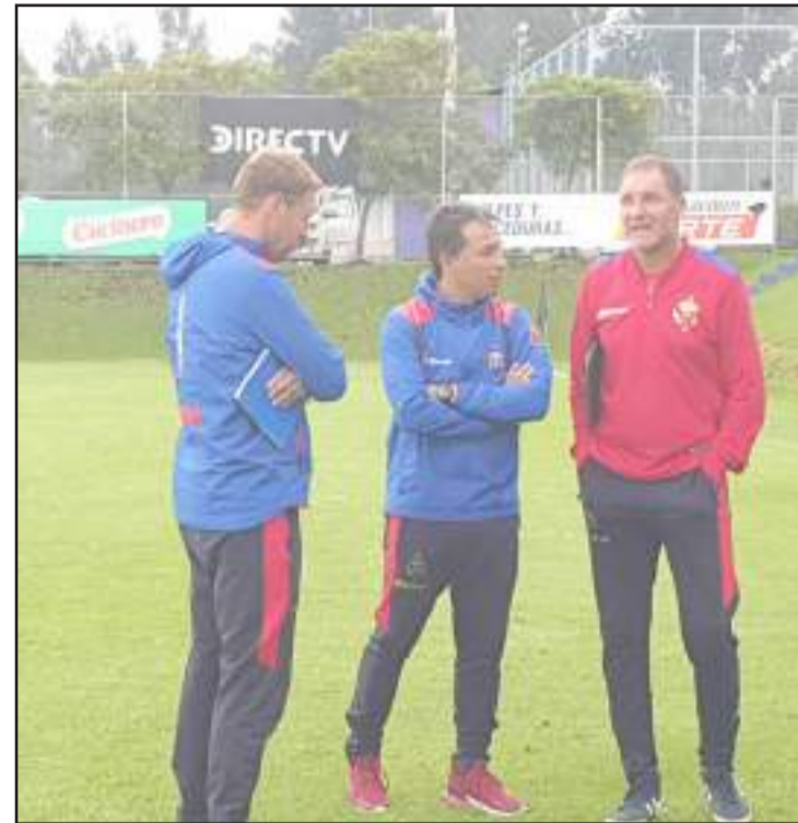
▶ Cuerpo Técnico del plantel riobambeño.

El cuadro riobambeño ya está completo, cuenta con los seis extranjeros que le permite el reglamento de la Liga Pro y de acuerdo al técnico el equipo