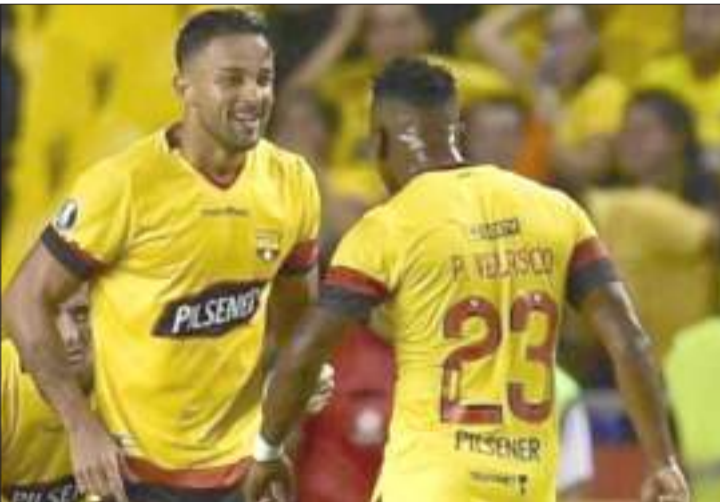
▶ Una victoria por dos o más goles le dará la clasificación al equipo dirigido por el DT Villafañe.

Cinco equipos ecuatorianos tuvieron actividad esta semana en Copa Libertadores y Copa Sudamericana. Solo Macará de Ambato tiene un panorama, que a primera vista, luce más complicado que el del resto de clubes tricolores.