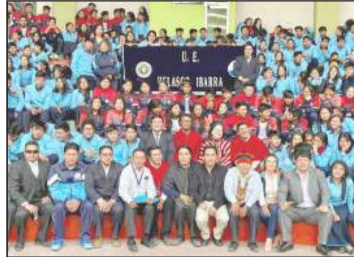
► Las autoridades educativas nacionales, zonales, distritales, municipales y estudiantes presentes en la firma del convenio.

Con la presencia de la ministra de Educación, Monserrat Creamer y Rómulo Antun, secretario del Sistema de Educación Intercultural Bilingüe, la coordinación zonal 3 de Educación, se realizó la firma del Convenio de Cooperación Interinstitucional con el Gobierno Autónomo Descentralizado Municipal de Guamote para mejorar y asegurar la calidad de la infraestructura educativa. 4.438 estudiantes de 11 planteles educativos del cantón Guamote contarán con infraestructura escolar adecuada,