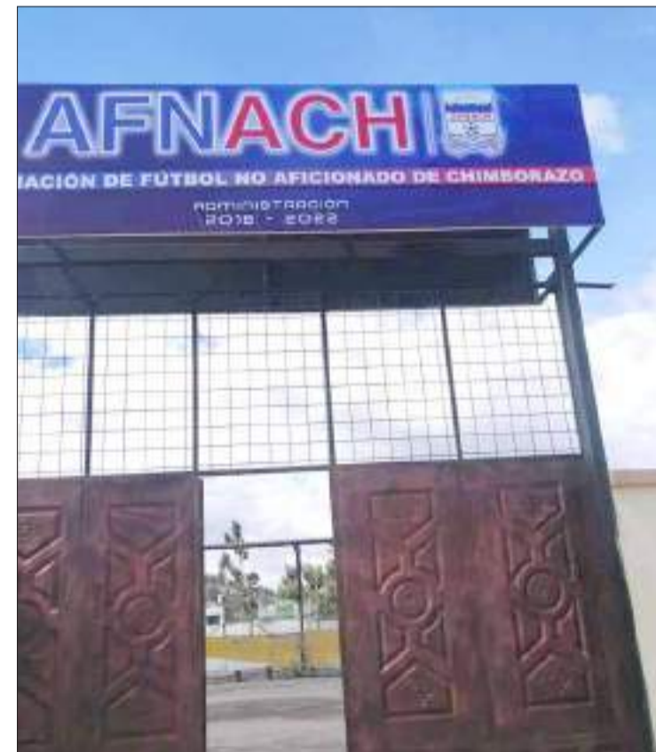
▶ Puerta de ingreso a la AFNACH con su identificación.