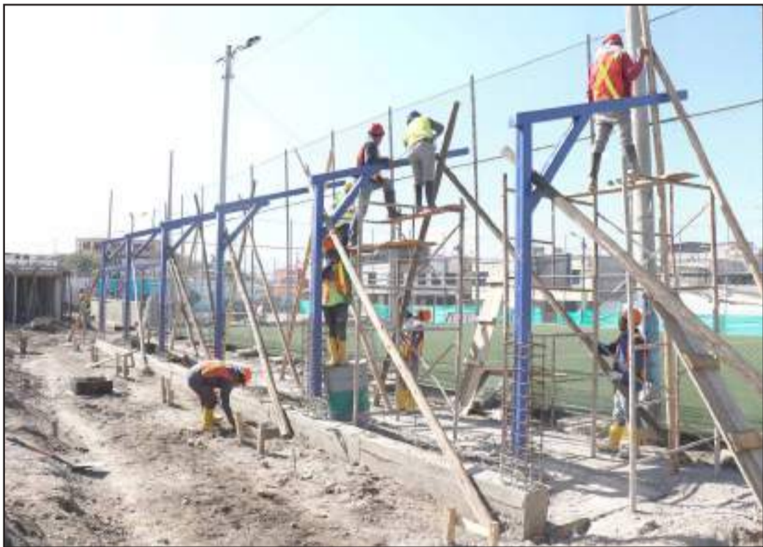
Los trabajos continuarán durante cuatro meses, en donde la obra se entregará.