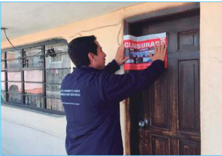
Cierran local de salud por denuncia en la ciudad de Ambato.