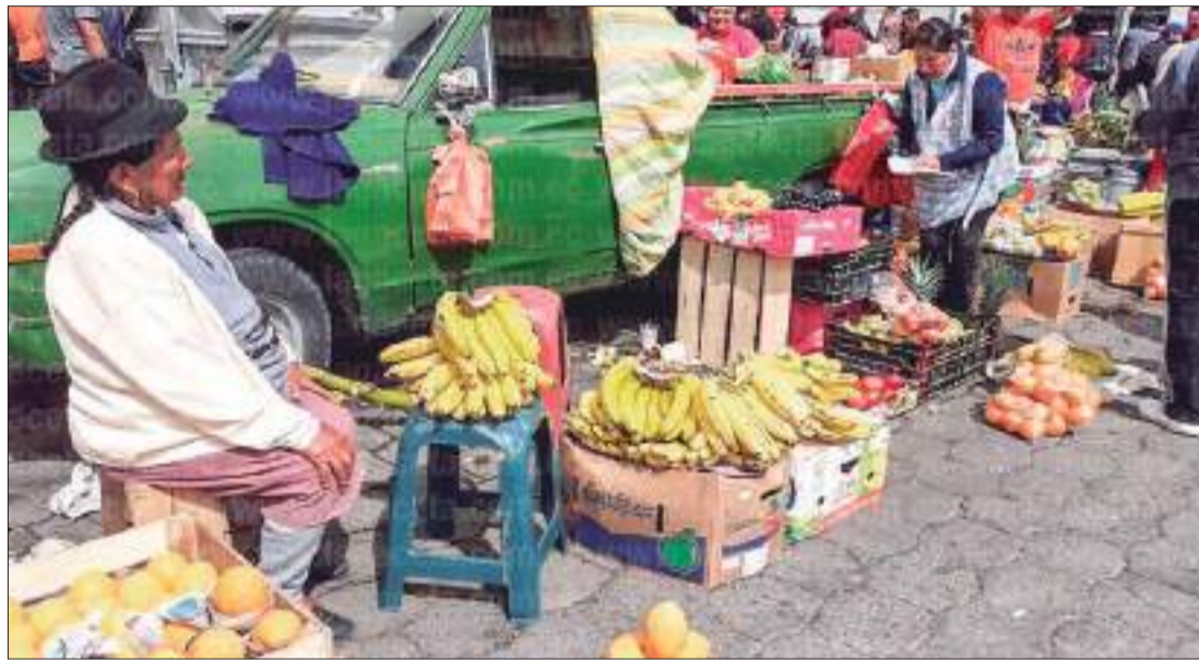
El comercio informal aumenta en la ciudad.