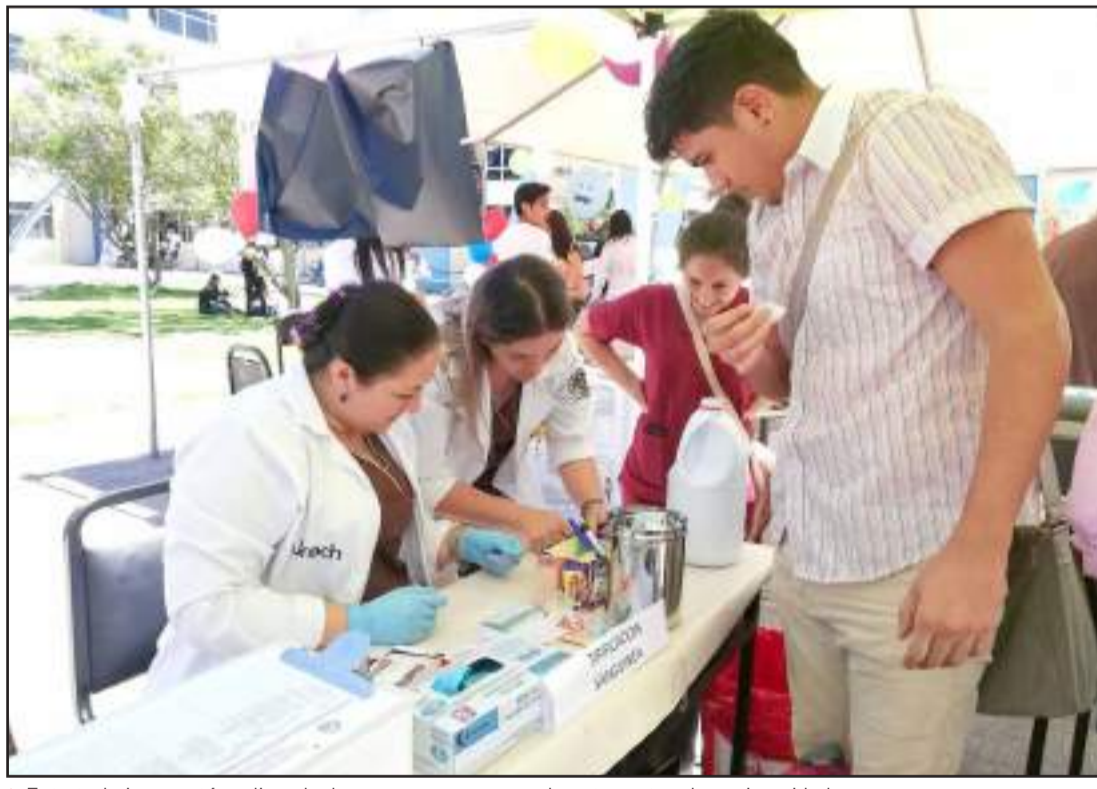
Este trabajo se está realizando de manera mancomunada entre estas dos universidades