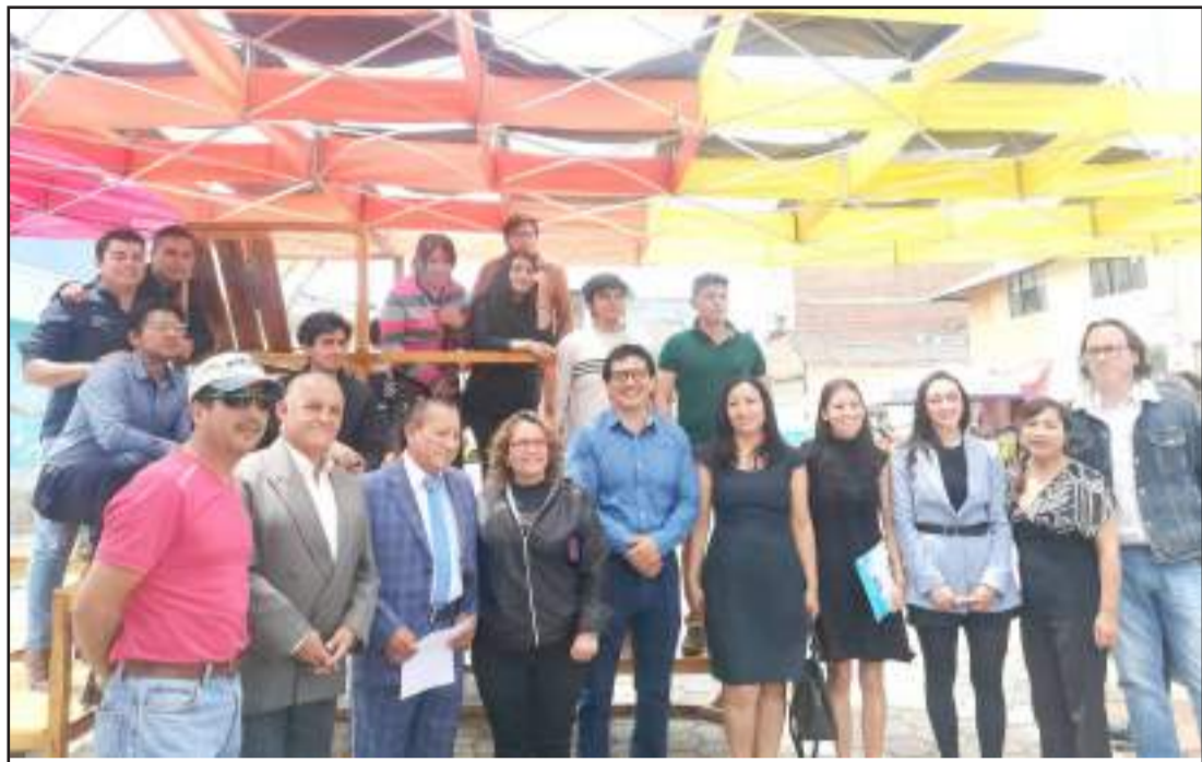
Los moradores de Villamaría estuvieron agradecidos por este trabajo