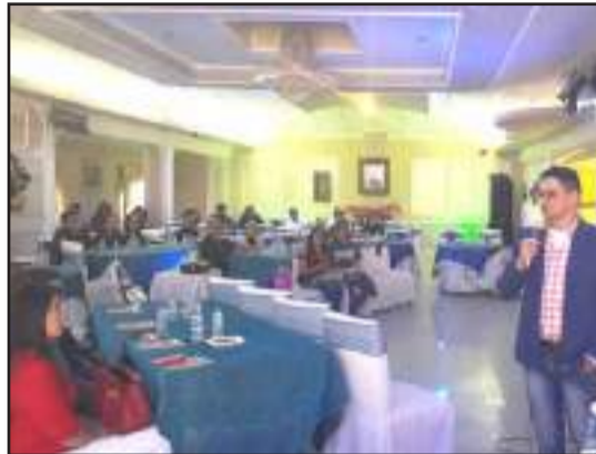
► Odontólogos de la ciudad presentes en el curso.