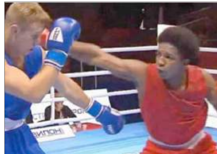
► Alrededor de 38.000 dólares fueron invertidos por la Secretaría del Deporte, que se destinaron para la preparación, alimentación y hospedaje de los deportistas.

Trece boxeadores fueron seleccionados para representar al Ecuador en el preolímpico que se realizará en Argentina, desde el 26 de marzo al 03 de abril de 2020, que otorga cupos a los Juegos Olímpicos de Tokio 2020.