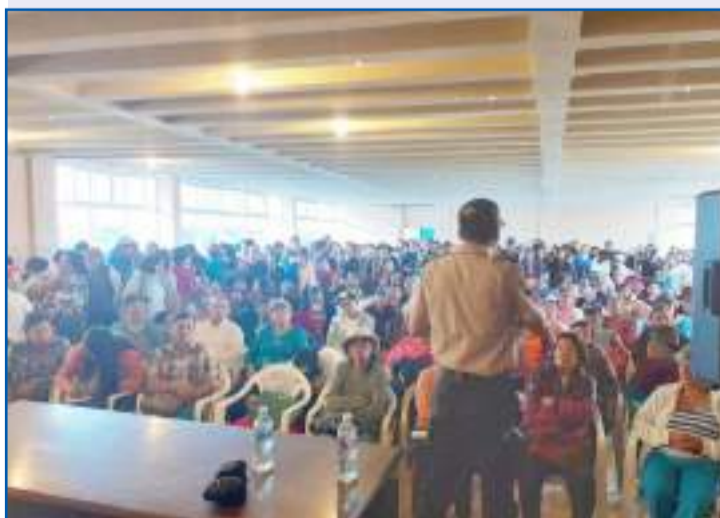
Decenas de ciudadanos acudieron a la reunión con la Policía Nacional.