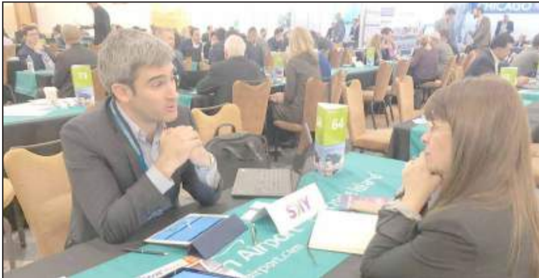
► Este evento reúne a los representantes de las más importantes aerolíneas, aeropuertos y autoridades turísticas del mundo con el fin de estrechar relaciones comerciales y crear amplias redes de networking para mejorar la conectividad aérea hacia o desde los diferentes destinos del mundo.