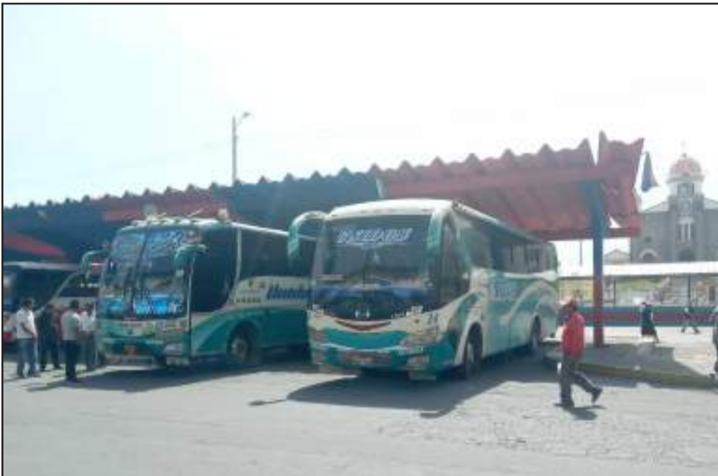
Terminal de estacionamiento de la cooperativa de transportes Unidos.

Son 37 socios y han actualizado o modernizado sus uni-