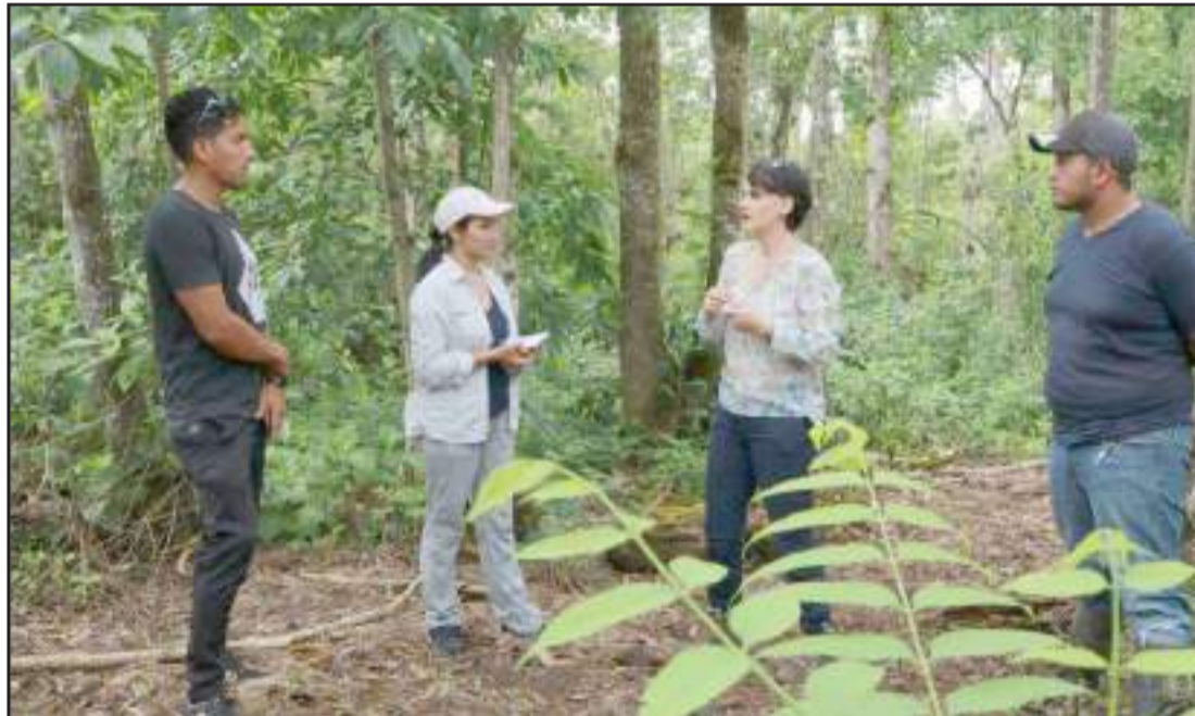
► Páez añade que la entidad busca que los turistas tengan experiencias auténticas en este destino sostenible.