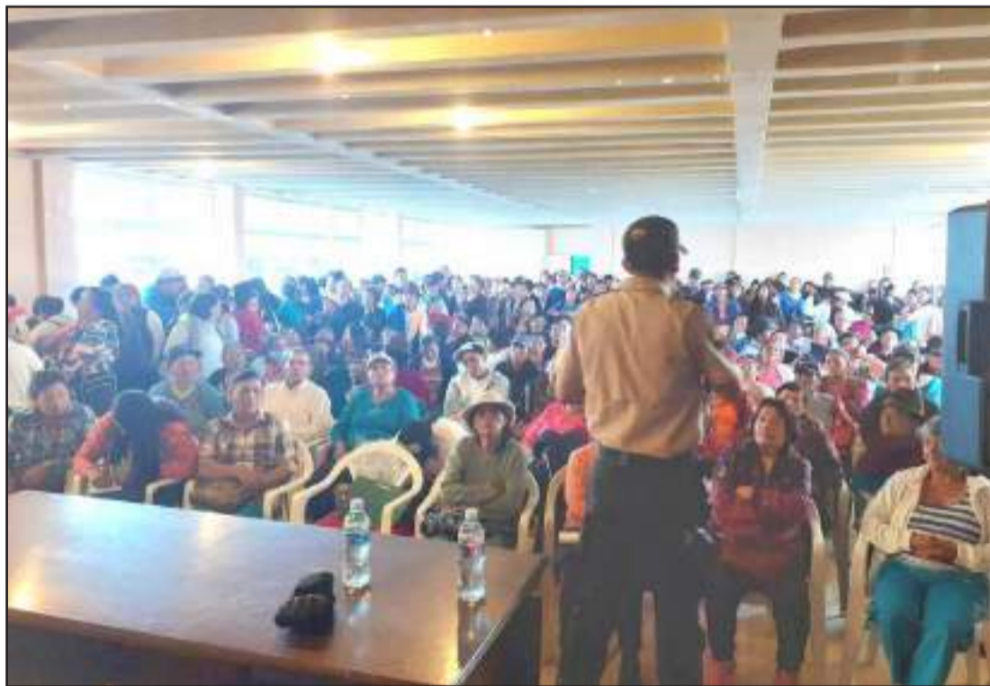
► Decenas de ciudadanos acudieron a la reunión con la Policía Nacional.