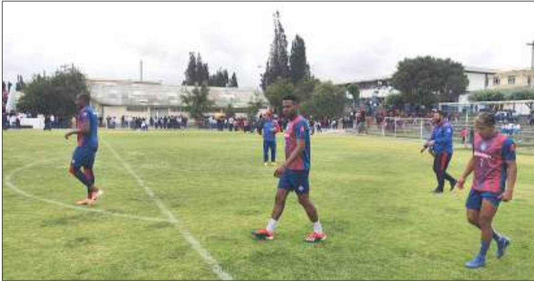
▶ Jugadores olmedinos empiezan sus entrenamientos.

Luego de la gran presentación que tuvieron los jugadores del equipo riobambeño el sábado anterior, hoy fueron llamados los integrantes del cuadro riobambeño para su entrenamiento con miras a su primer encuentro de la Liga Pro.