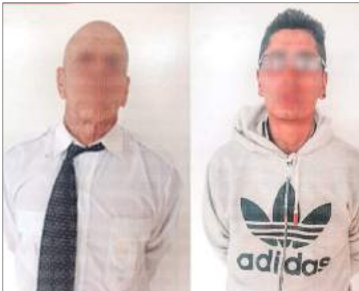
El fin de semana dejó varias novedades en la provincia.