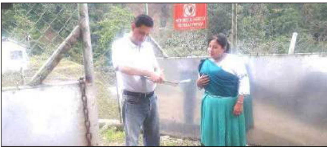
► Técnicos Dirección de Gestión Ambiental de la Prefectura de Chimborazo socializando el permiso ambiental