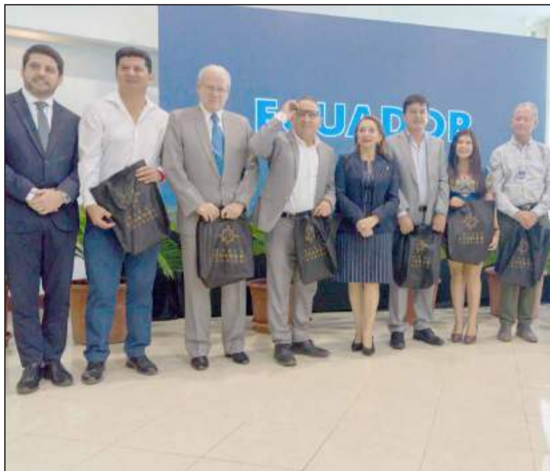
► En el marco del evento se presentó además el inicio de la temporada playera en la Costa que arranca con las vacaciones de los estudiantes de la región y el receso quimestral de la Sierra.