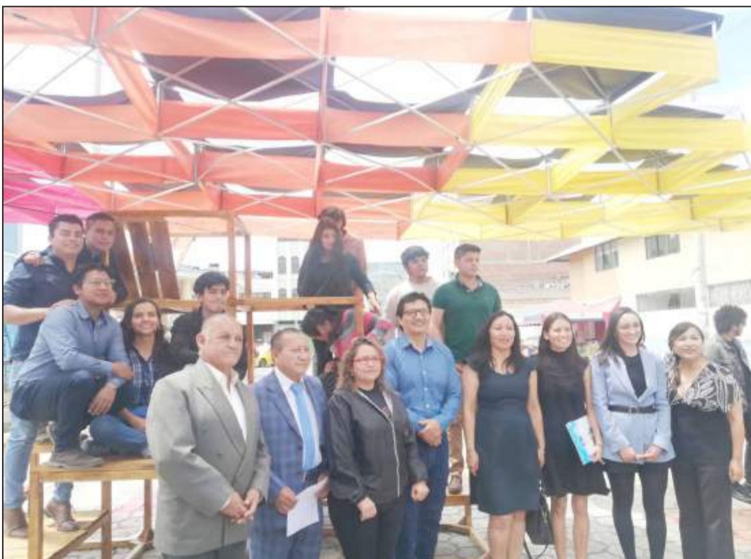
Los moradores de Villamaría estuvieron agradecidos por este trabajo.