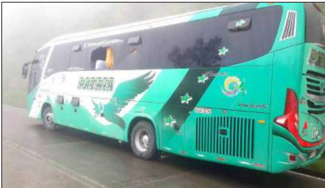
► El bus afectado terminó con una de sus ventanas rotas y daños leves.