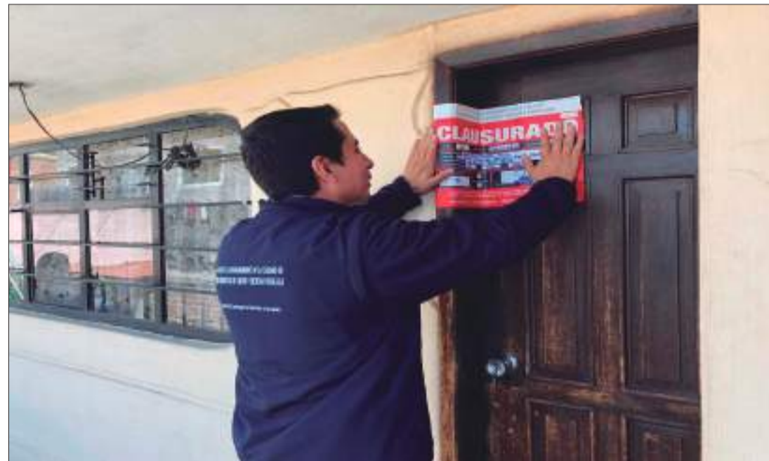
► Cierran local de salud por denuncia en la ciudad de Ambato.