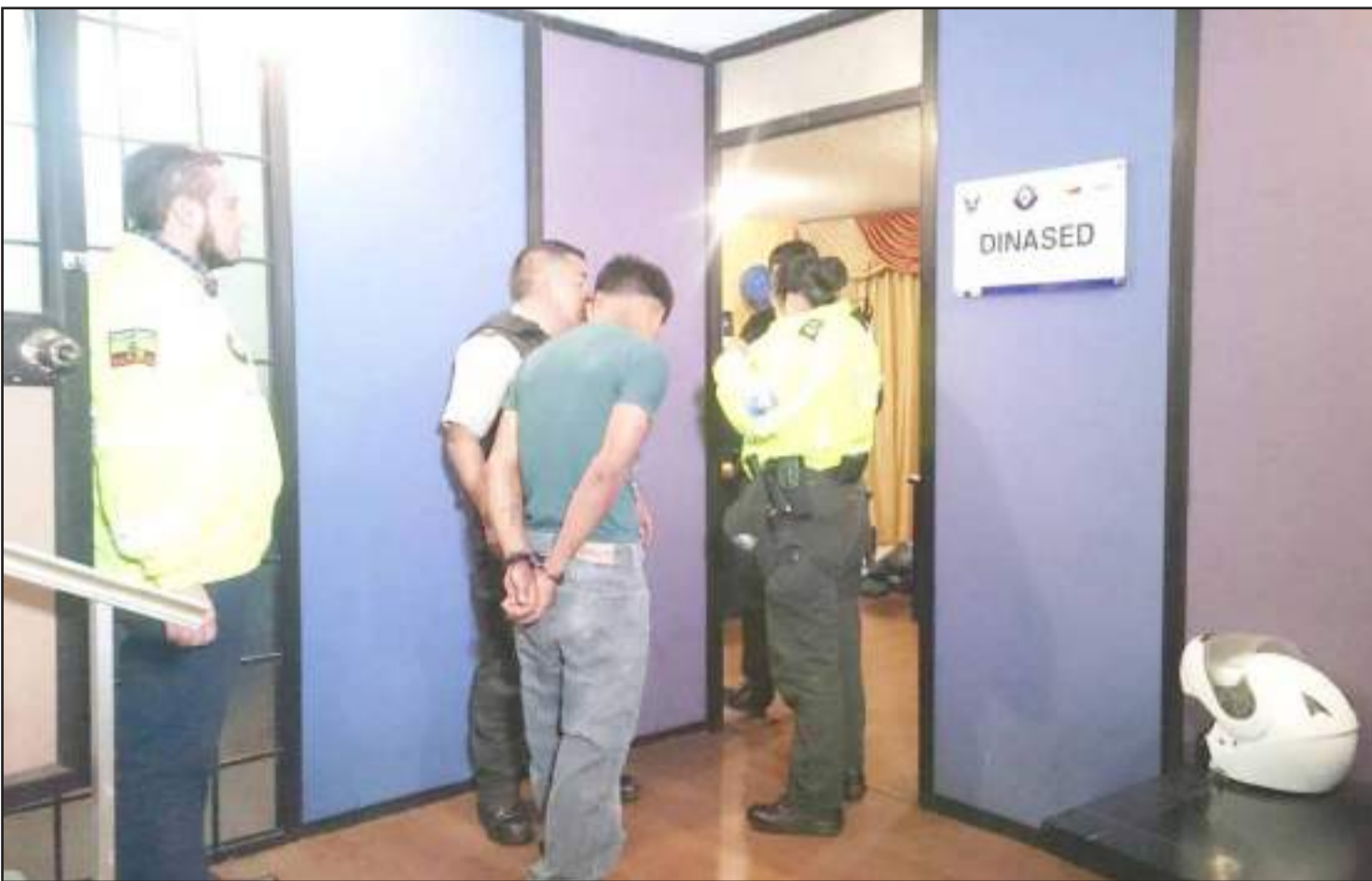
Los agentes de la Policía Nacional lograron ubicar y detener al ciudadano de alrededor de 18 años, quien para despistar a los gendarmes, tras el hecho se fue a una peluquería y se cortó el cabello.

"Inicialmente no informaron que el sospechoso tenía el cabello largo, pero sin importar que se lo cortó, fue plenamente identificado, puesto que ya lo teníamos fichado", mencionó Barreno.