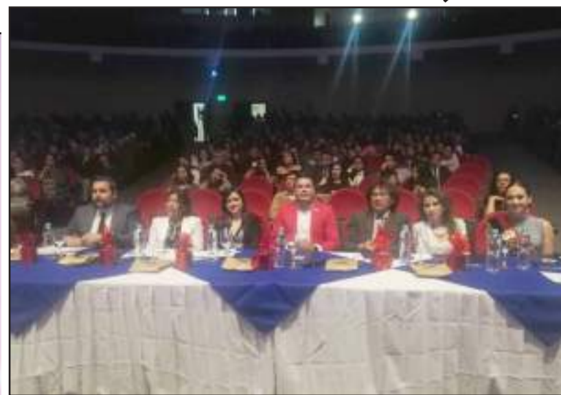
▶ El jurado calificador estuvo conformado por comunicadores

En el auditorio de la Universidad Nacional de Chimborazo se llevó a cabo la exposición de cortometrajes de los estudiantes de la Unidad de Nivelación.