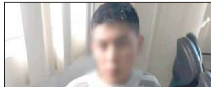
El sospechoso fue detenido por la Policía.