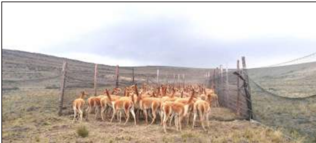
► Campaña pretende proteger a camélidos de la Reserva de Producción Faunística Chimborazo.