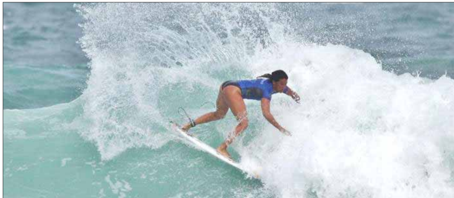
► La surfista muestra su habilidad sobre las olas