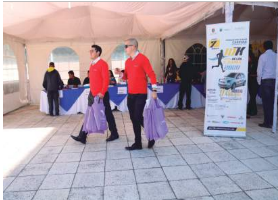
Entrega de chips para la carrera 10k ruta de los Tres Juanes 2020