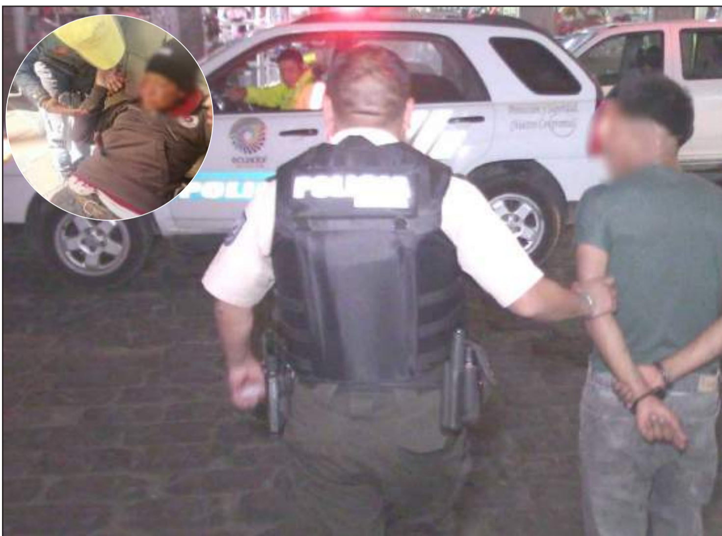
El presunto autor del hecho fue puesto a órdenes de la autoridad competente, mientras la víctima lucha por su vida.