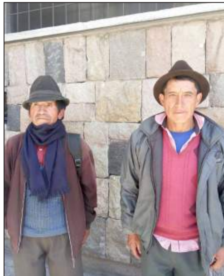
▶ Agricultores de Tomapamba visitaron el Consejo.

ciadas 100 familiares, deberían ampliarse más pero el caudal del agua no es suficiente y ese es uno de los problemas pues todos necesitan riego para mejorar la producción agrícola, esperan la ayuda de las autori-