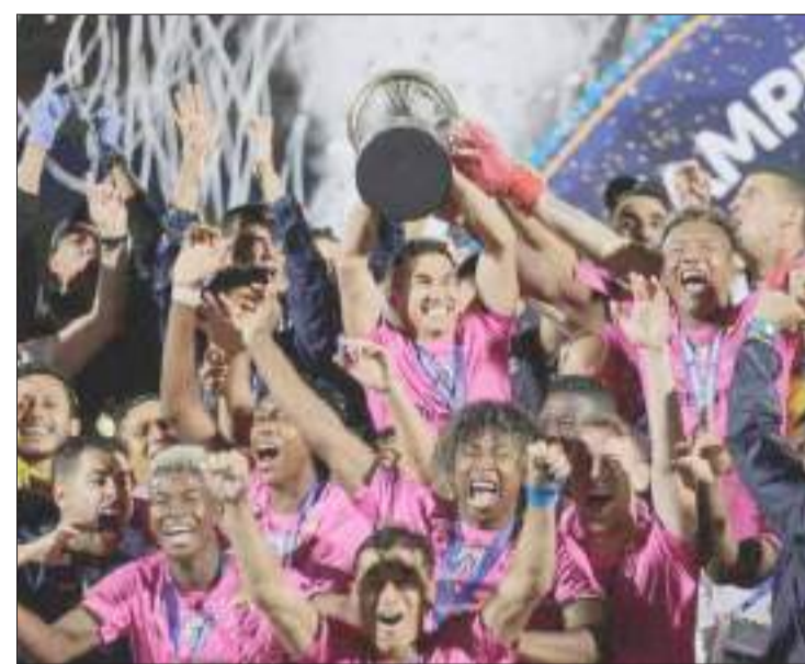
► Los jugadores de Independiente celebran la obtención de la Copa Sudamericana.

El Independiente del Valle se prepara para la Recopa Sudamericana, el conjunto de Sangolquí se prepara con la aspiración de conseguir otro título internacional.