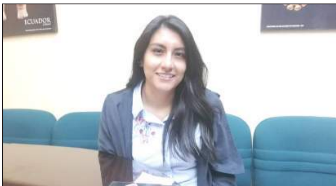
► La animalista recordó que el colectivo no cuenta con albergues e invitó a la ciudadanía a ofrecer estadia temporal a las mascotas que no encuentran hogar.