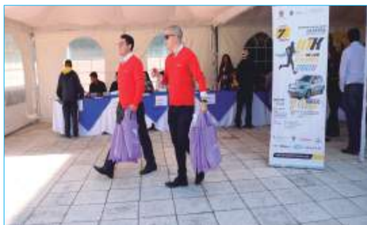
Entrega de chips para la carrera 10k ruta de los Tres Juanes 2020