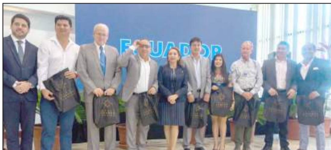
► Este trabajo conjunto logrará potenciar el desarrollo turístico de Ecuador

La dinamización del turismo interno en feriados, fines de semana y temporadas específicas del año es a donde apunta el programa "Viaja Ecuador", presentado este jueves 6 de febrero en Guayaquil, por parte del Ministerio de Turismo.