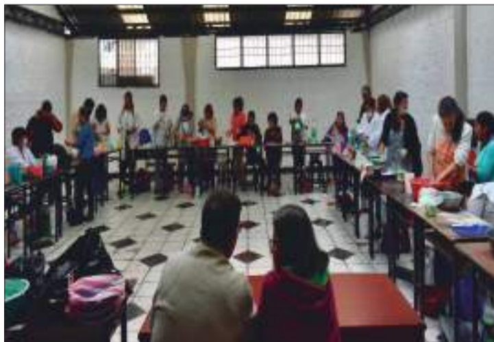
Inician talleres gratuitos en la Municipalidad de Ambato.

Los talleres iniciaron el lunes 3 de febrero, abriendo las puertas a jóvenes, adultos y adultos mayores, con la finalidad de fomentar el emprendimiento con nuevas actividades que ayude a los participantes a desarrollar habilidades,