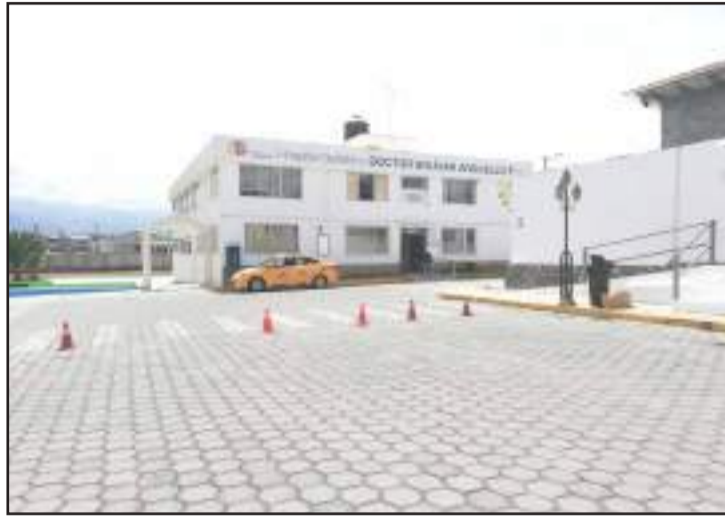
► El Hospital celebra el aniversario de su creación.