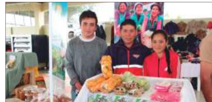
Más de 100 expositores estarán presentes en este evento.

Martínez informó que en un área de 800 metros cuadrados la Corporación Provincial de manera conjunta con los productores de diferentes sec-