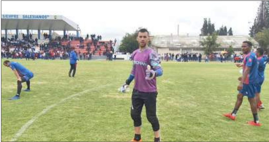
▶ Jugadores del Olmedo buscando estar listos para la noche del Centenario.