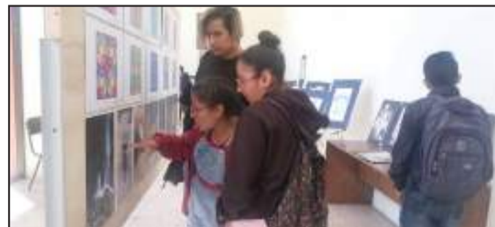
▶ Los politécnicos se acercaron a ver esta exposición.

Esta exposición se la ha realizado de manera continua du-