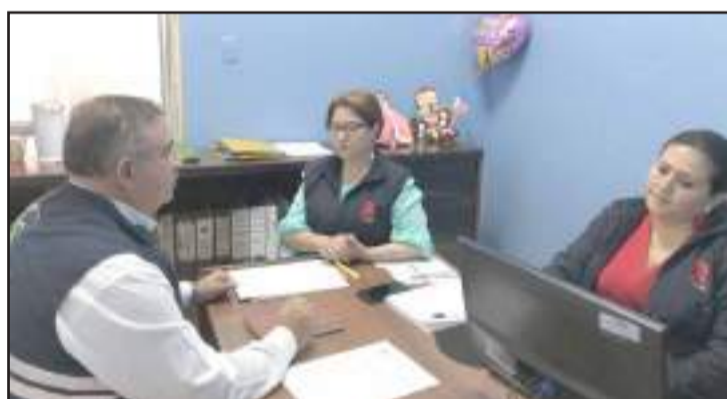
▶ Al momento se está planificando este evento.