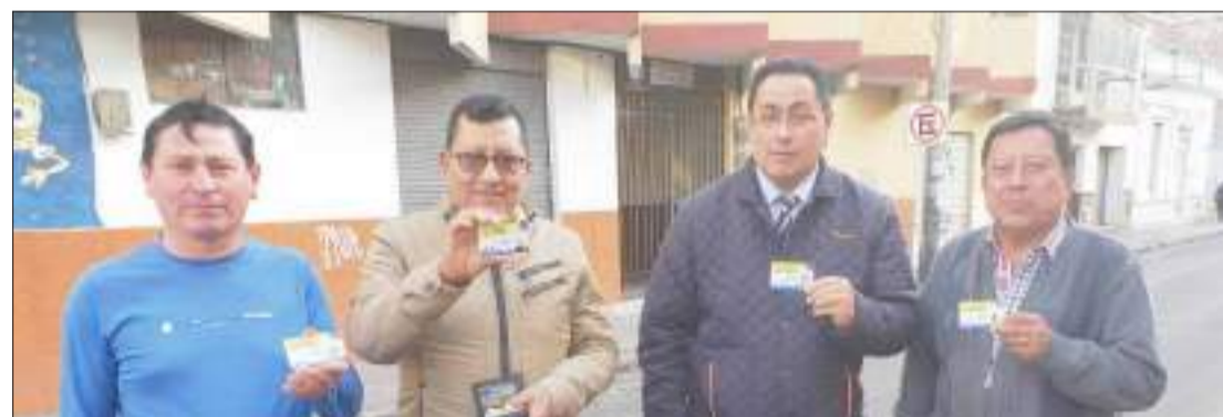
▶ Momentos de la entrega de las credenciales a los miembros del CPDCH.