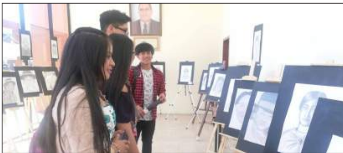
▶ Los estudiantes expusieron sus trabajos de pintura, dibujo, fotografía y arte.