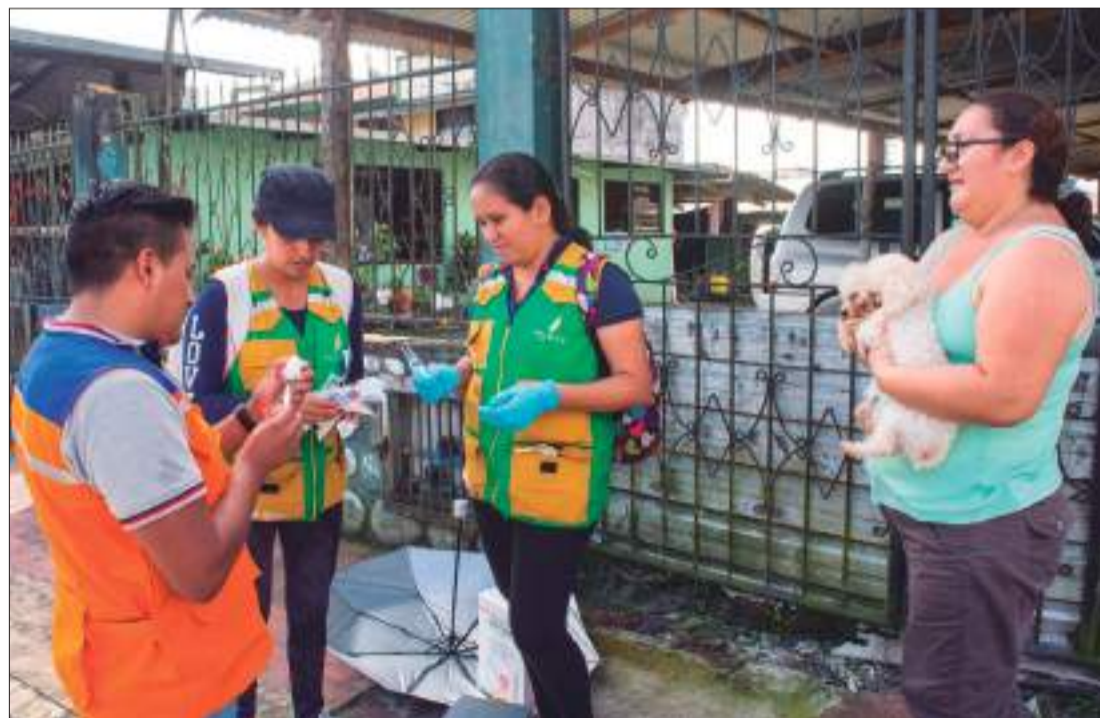
► Brigada de vacunación de mascotas.