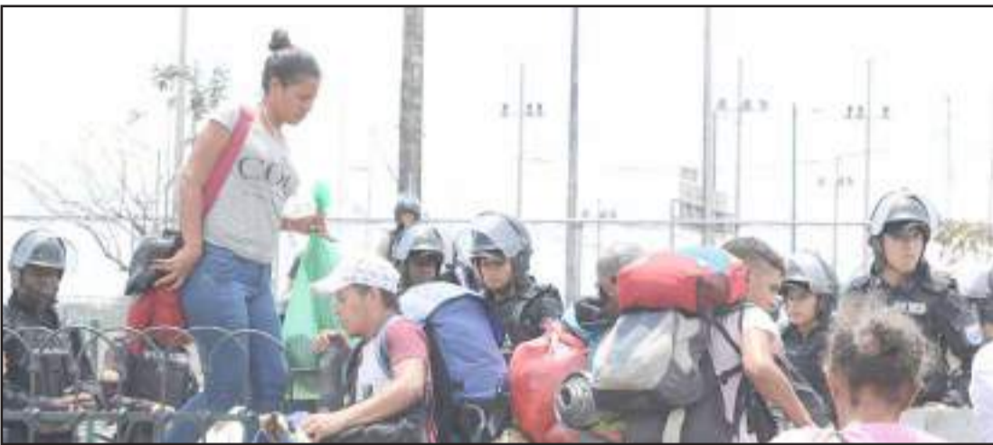
La Reforma a la Ley de Movilidad busca una migración ordenada y la rápida acción en casos de delitos cometidos por extranjeros.