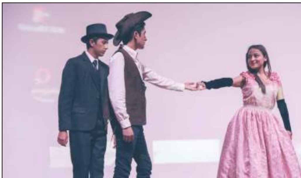
▶ En el evento, los estudiantes también actuaron la sinopsis de sus cortometrajes.

Los estudiantes de la Unidad de Nivelación de la Unach, que pronto formarán parte de la Carrera de Comunicación Social, realizaron una exposición de cortometrajes con leyendas urbanas.