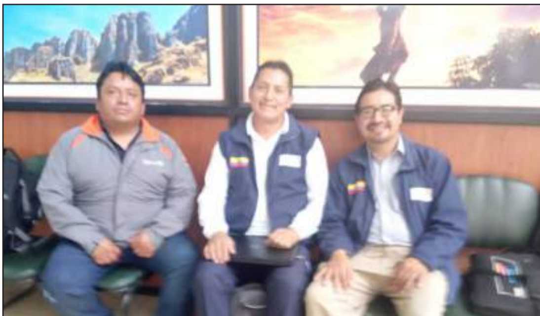
▶ Técnicos y directivos de World Vision en la provincia de Chimborazo y la región.