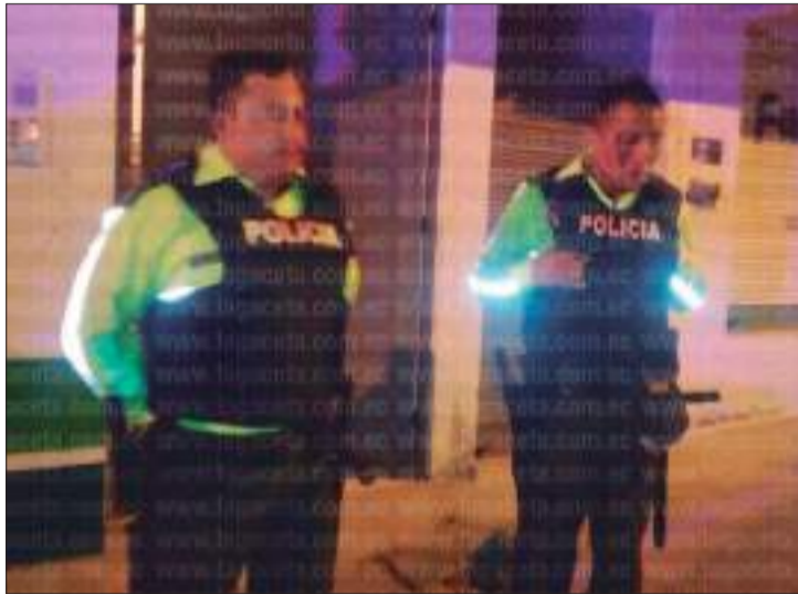
Los uniformados registraron varios golpes y heridas en el rostro. Los ciudadanos no pueden libar en la vía pública, las autoridades piden la colaboración de todos.

tias y ocasionó los inconvenientes con los libadores de la calle".