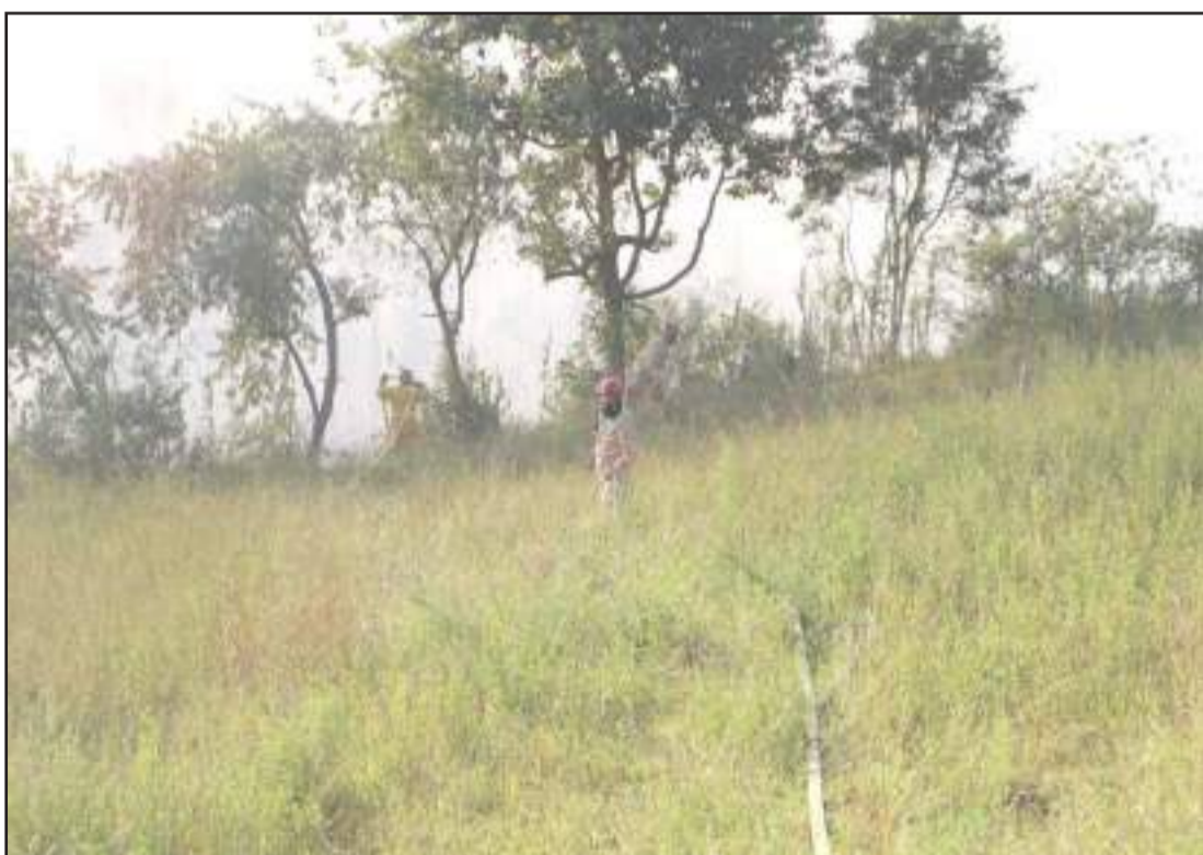
Los efectivos del Cuerpo de Bomberos de Riobamba se movilizaron hasta la zona citada y luego de un trabajo coordinado controlaron las llamas.