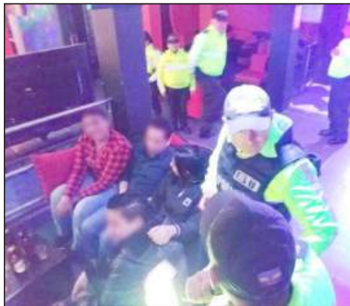
► El trabajo fue coordinado con la Policía Nacional.

Tras los operativos de control ejecutados por la intendencia de Policía, ocho centros de diversión nocturna fueron cerrados por no acatar las normas.