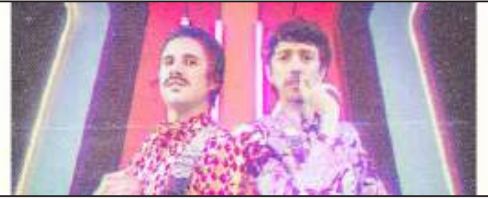
▶ Juan Pablo Vega, cantautor colombiano.