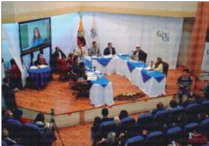
En enero el Pleno del CPCCS realizó la sesión en las instalaciones de la UTC.

Desde el 29 de enero se abrió la etapa oficial de creación del Observatorio Ciudadano para vigilar la implementación de la Ley para la Erradicación de la Violencia contra las Mujeres. En Cotopaxi existen tres integrantes y hay la posibilidad de que puedan inscribirse más.