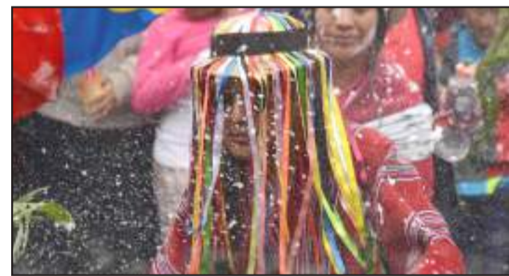
Actividades para el carnaval se darán a conocer este viernes.