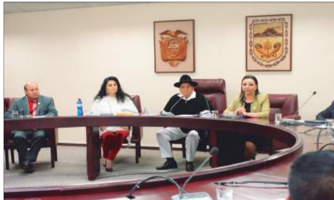
► Sesión ordinaria en el Consejo Provincial.