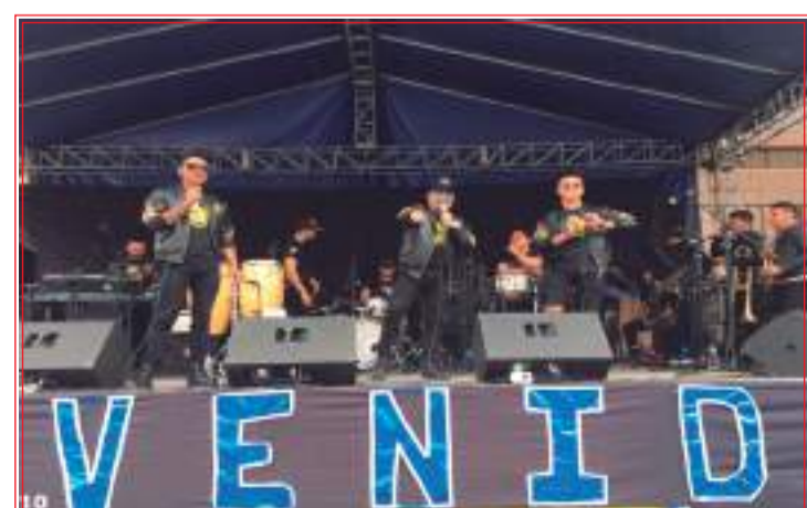
► La Rio City Band hizo bailar, cantar y gozar a todos los asistentes al evento con su show espectacular.