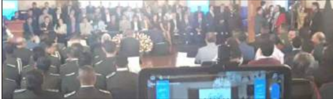
► "Todos los días hacemos un mejor trabajo a través de la mancomunidad con los municipios", expresó.