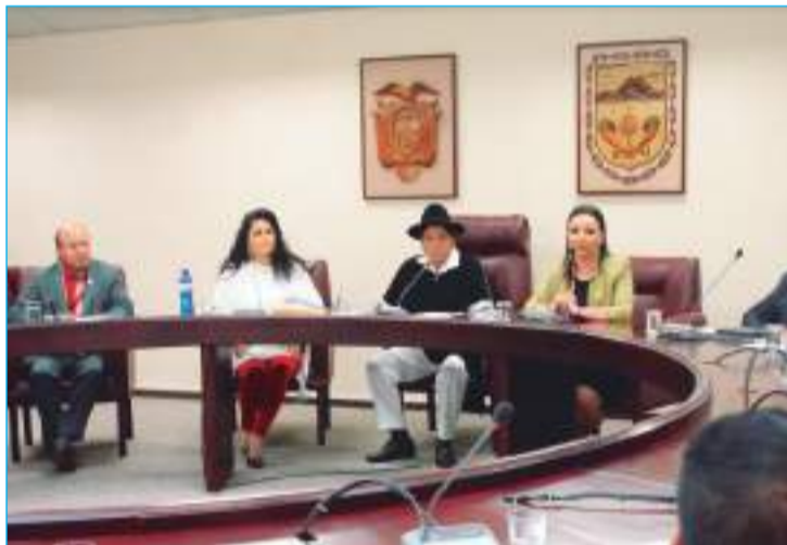
Sesión ordinaria en el Consejo Provincial.