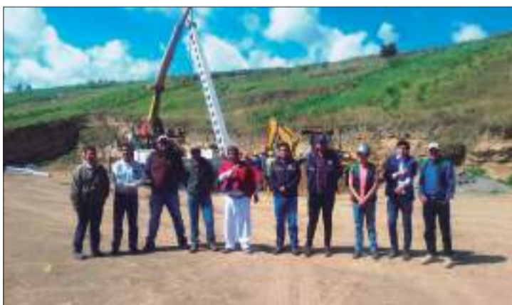
► Maquinaria en el estadio de San Alfonso de Chibuleo.

Los trabajos concluyeron y actualmente el estadio está listo para que la Empresa Eléctrica de Ambato