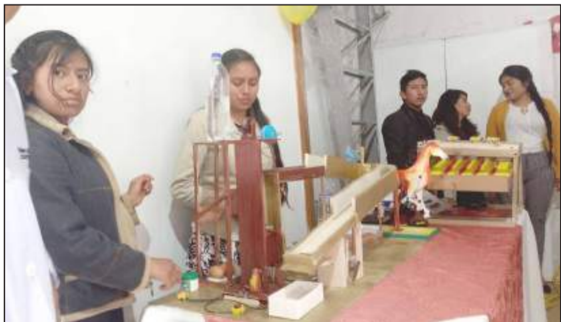
► Los alumnos presentaron una planta limpiadora.

Estudiantes de Zootecnia de la ESPOCH presentaron proyectos que permiten mejorar en presentación y conseguir más ingresos