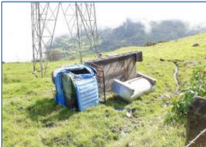
Accidentes en la provincia dejan heridos y cuantiosos daños materiales.