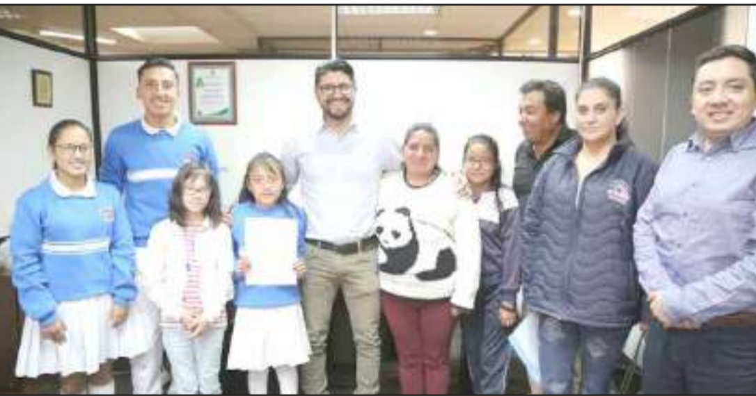
▶ Funcionarios de la Prefectura de Chimborazo junto a estudiantes de "Fe y Alegría".