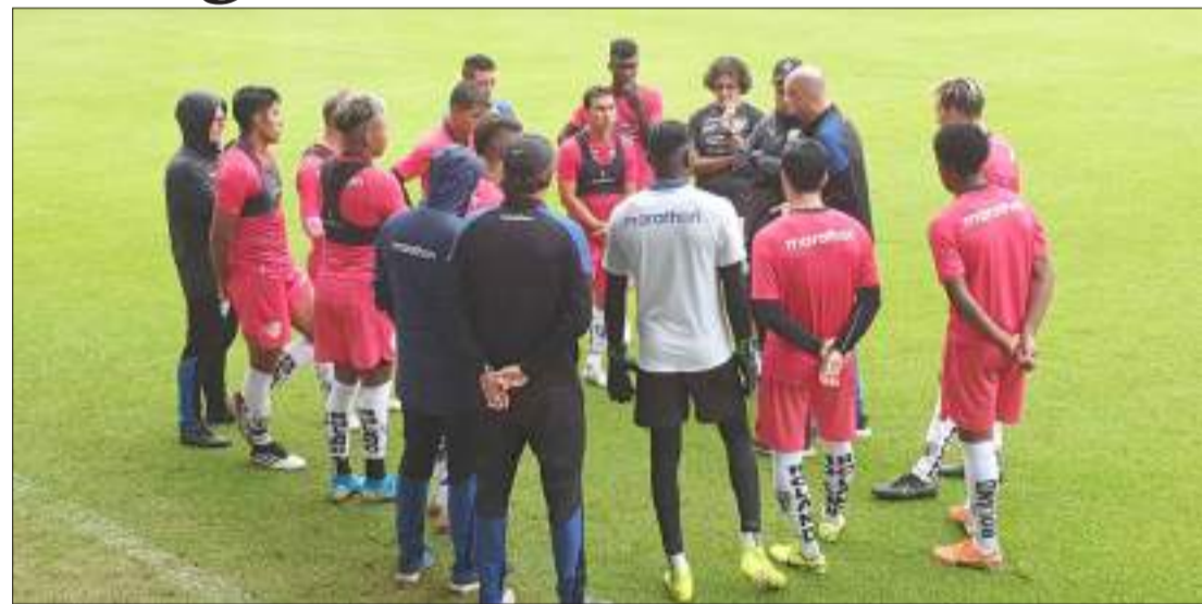
▶ Jugadores del Independiente que inician la Liga Pro Banco Pichincha 2020.