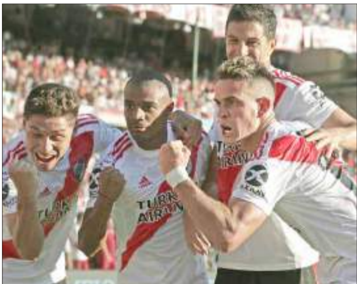
River Plate, actual líder de la Superliga argentina, fue ratificado por el TAS como campeón de la Copa Libertadores de 2018.

También le impone la pena por los incidentes acontecidos fuera del estadio Monumental de Buenos Aires, cuando llegaba el autobús de la plantilla del Xeneize. El 24 de noviembre de 2018, hinchas Millonarios ape-