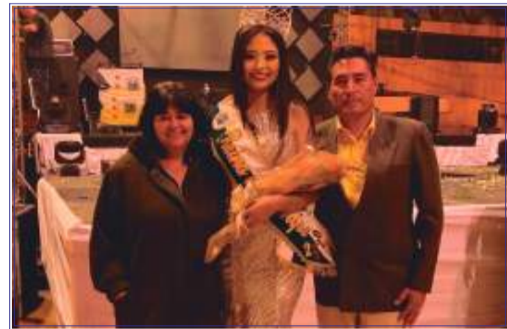
► Los padres de la hermosa ganadora del certamen de belleza apoyándola en todo momento.