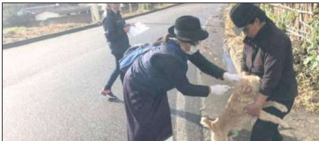
► La campaña de vacunación canina y felina se ejecutará desde el 20 de enero hasta el 15 de marzo de 2020.