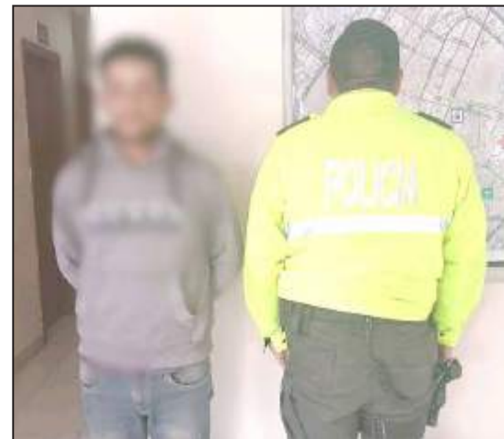
► El detenido fue puesto a órdenes de la autoridad competente.

Los agentes de antinarcoóticos, al realizar un cacheo al sospechoso, hallaron fundas pequeñas que contenían una sustancia verdosa, la cual luego de ser sometida a las pruebas