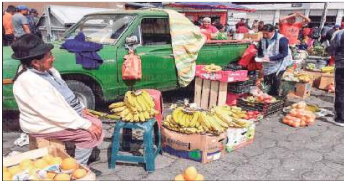
El comercio informal aumenta en la ciudad.