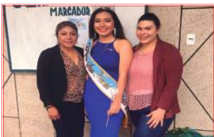
► Familiares de la hermosa soberana.