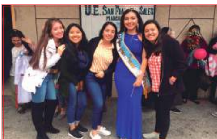
► Amigas de la flamante reina.