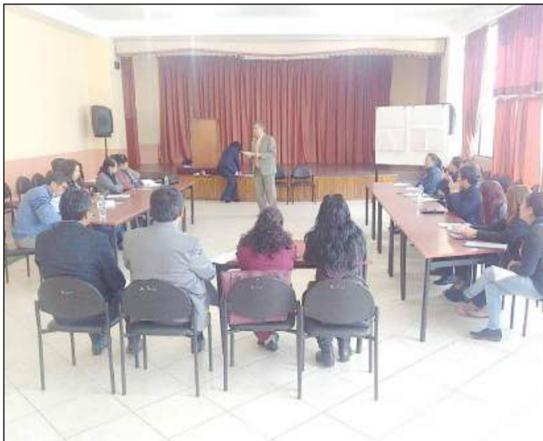
Los docentes de literatura recibieron información sobre las tendencias de la poesía.