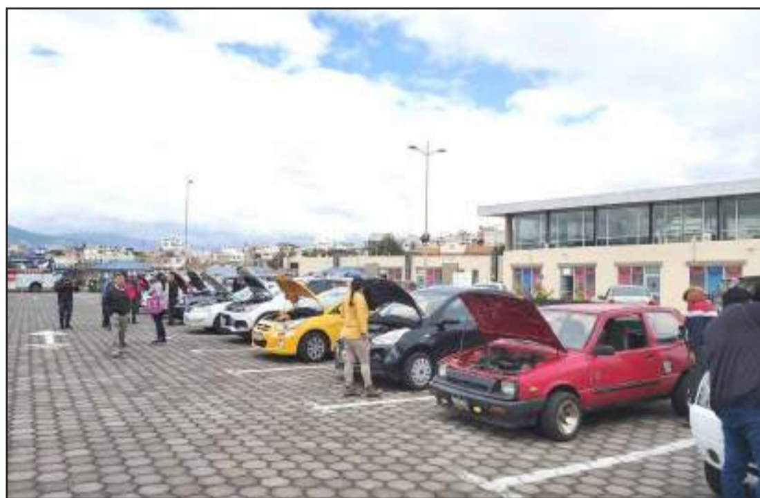
Hasta el momento los ciudadanos que se han acercado a la dirección comentaron que el proceso se está realizando de manera rápida.