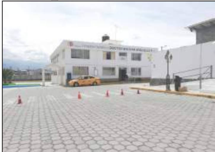
► El Hospital celebra el aniversario de su creación.