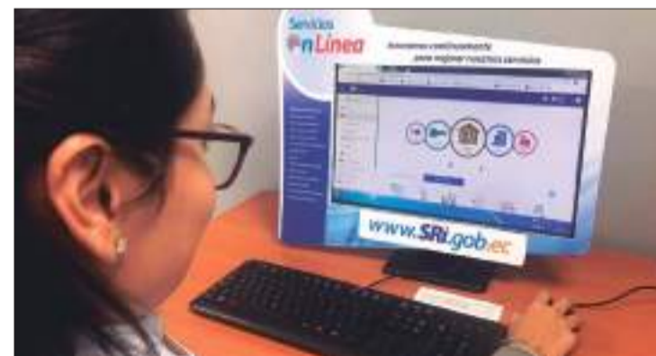
► Las cuotas del SRI se pagan en línea.

de crédito y/o notas de crédito desmaterializadas en www.sri.gob.ec lo cual disminuye el costo por servicios financieros, y permitirá actualizar el estado tributario el mismo día. Los contribuyentes también tienen la opción de pagar sus cuotas con tarjeta de crédito en cualquier agencia del SRI de todo el país.