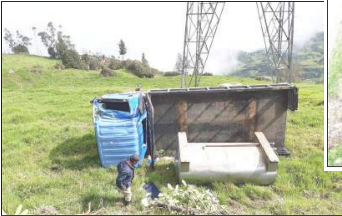
► El camión que se accidentó en la vía a Chunchi terminó con varios daños.

En Cumandá, Chunchi, Colta y Guamote se reportaron accidentes de tránsito que dejaron personas heridas y una víctima mortal.