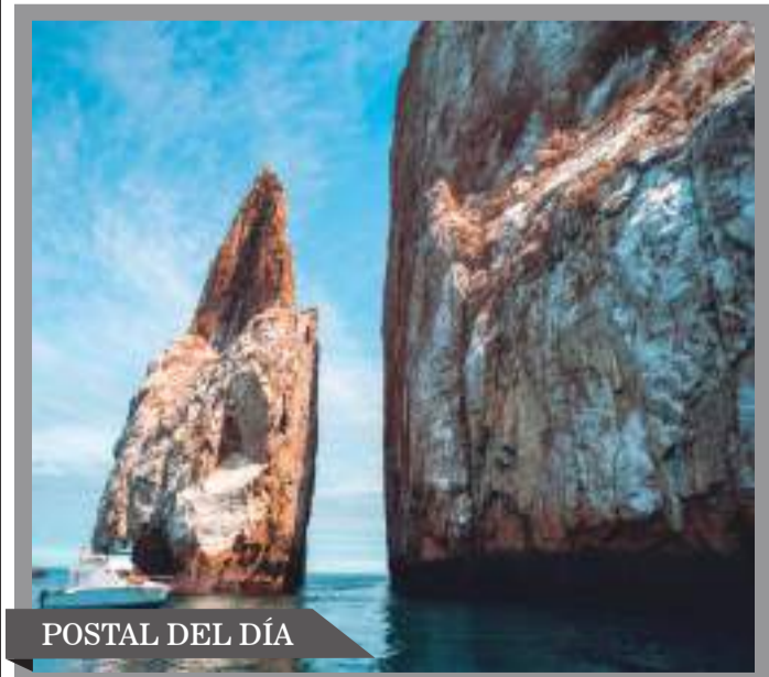
POSTAL DEL DÍA