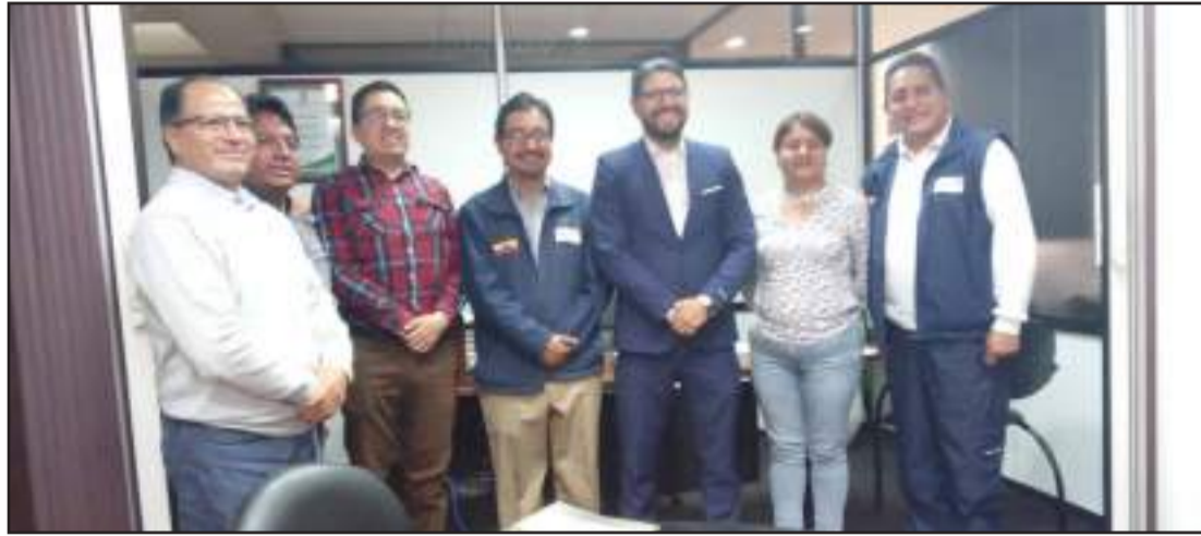
► Directivos de World Vision y funcionarios del Gobierno Provincial se reunieron.