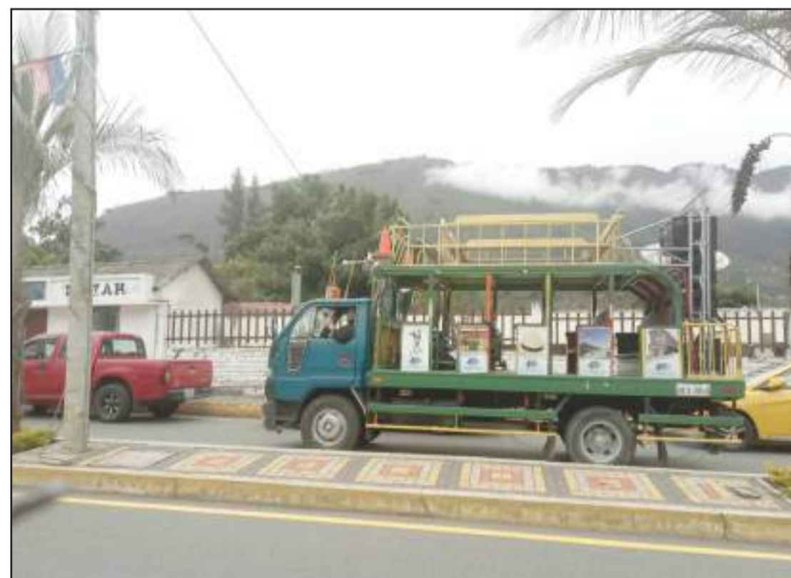
► La chiva volcánica es un ícono en el turismo en el cantón Penipe.