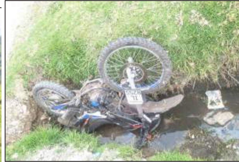
► En Colta, la moto se halló en medio de un acequia.

Uno de los últimos siniestros ocurrió en Santiago de Quito-Colta, en donde una mujer que tenía en brazos a su hijo de apenas dos años, fue atropellada por una motocicleta.