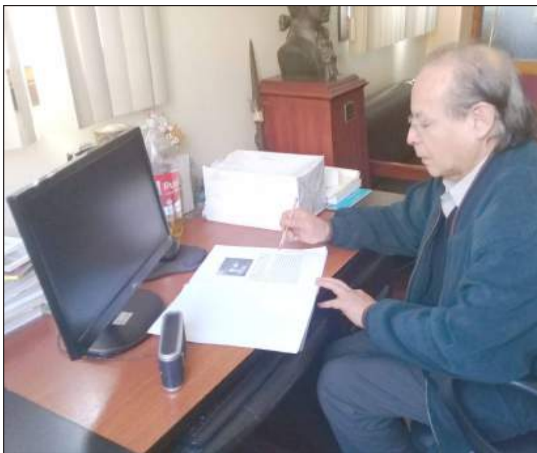
Los convenios favorecerán a los sectores más necesitados.