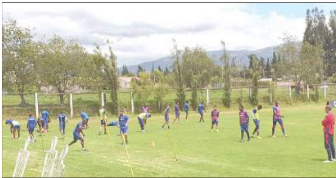
▶ Olmedo en su entrenamientos de ayer en el Complejo Deportivo.

La noche Roja y Azul del Centro Deportivo Olmedo se llevará a cabo el sábado a las 19H00, en el estadio Fernando Guerrero Guerrero, donde se presentarán a jugadores, nuevos uniformes y cuerpo técnico.