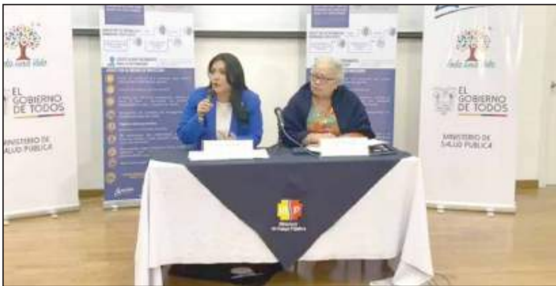
► Se conocieron resultados de exámenes de sospechoso caso de Coronavirus en el país.