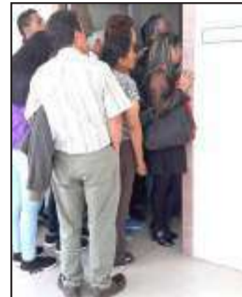
En una de las Salas de la Unidad Judicial Penal de Riobamba se realiza la audiencia.

El viernes, el juez suspendió la audiencia para que se reinstale