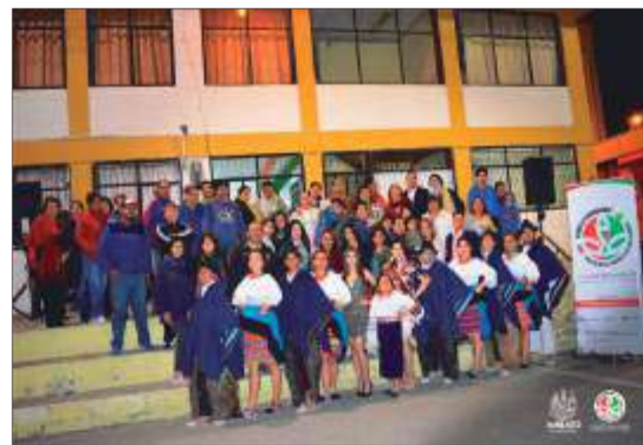
► El barrio José Antonio Clavijo vive la fiesta mayor de los ambateños.

A las 20h30, en las canchas de uso múltiple, moradores del lugar pudieron disfrutar de la participación del grupo folklórico “Sangre Indígena Ecuatoriana”, quienes intervinieron varias veces con bailes y vestimentas representativas de nuestros pueblos ancestrales. Dicha agrupación de baile fue “donado” por el Comité Permanente como apoyo al regreso de los barrios a la Fiesta de las Frutas y de las Flores.