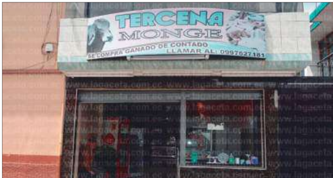
► Tercera 'Monge' una de las diez que venden de forma particular en Pujilí.