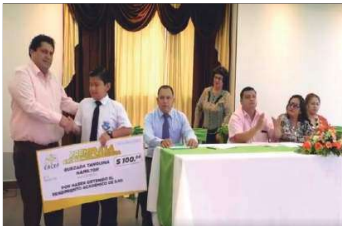
► Reconocimiento de la CACEP a estudiantes destacados.