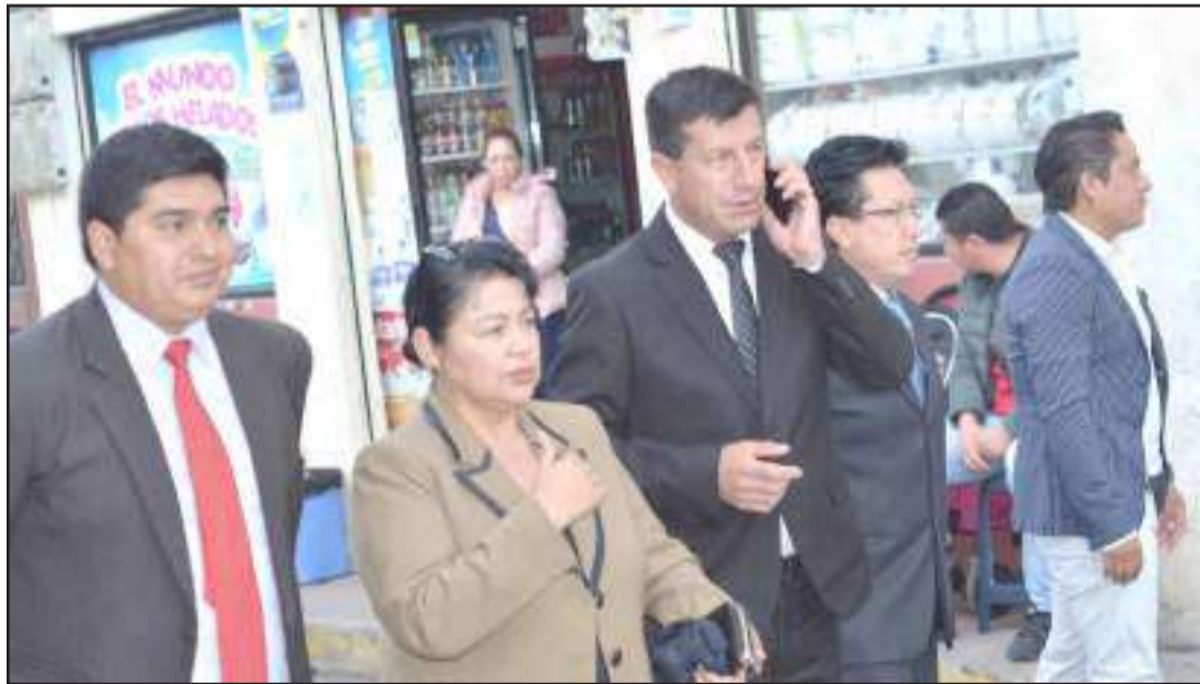
► Autoridades encabezaron el pregón en Penipe.

Una de las primeras actividades que se cumplió este viernes fue el pregón de fiestas para recordar un aniversario más de creación