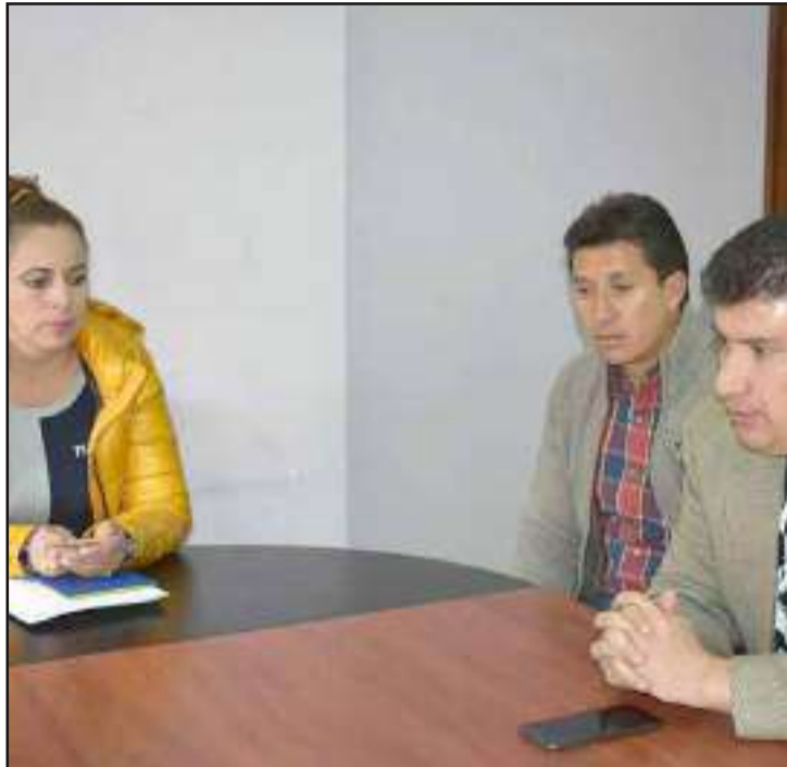
Continuarán manteniendo reuniones para definir lineamientos de trabajo.

Esperan fortalecer el deporte en los sectores vulnerables de la provincia.