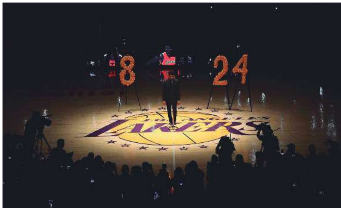
El Staples Center, este viernes.

Los Lakers taparon todas las camisetas retiradas y dejaron sólo a la vista el '8' y el '24', los jugadores vistieron la camiseta de Kobe durante el calentamiento y la presentación, y en primera fila del Staples hicieron hueco a las