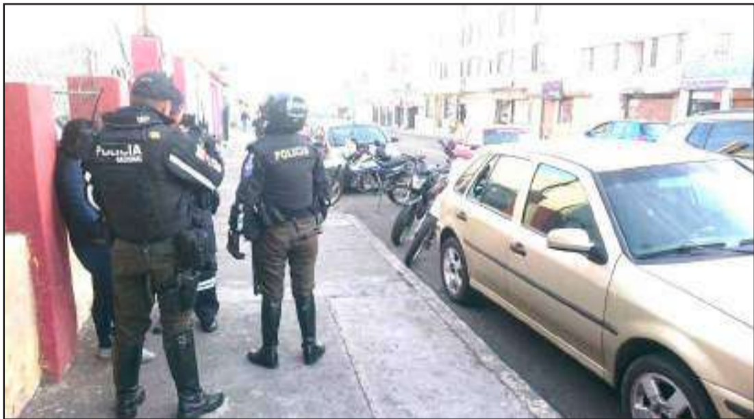
Instantes en que los policías llegaron al lugar para investigar lo ocurrido.