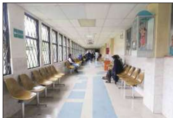
La ciudadanía debe informarse solo por fuentes oficiales.

Finalmente, informó que tomarán las medidas correspon-