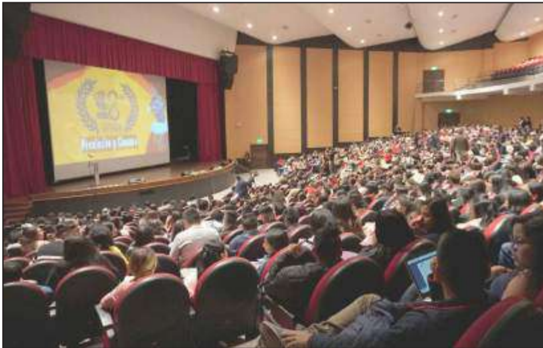
El jurado calificador estará conformado por personas de reconocida trayectoria en el campo cinematográfico.

Fundación Arte Nativo, GADS Municipales de Ambato, Salcedo, Guaranda, la CCE Núcleo de Bolívar y las Universidades del Centro del país, convocan a participar en el IX Festival de Cine Ecuatoriano “Kunturñawi” (El Ojo del Cóndor), que se cumplirá en las Provincias de: Cotopaxi, Tungurahua, Bolívar, Pastaza y Chimborazo.