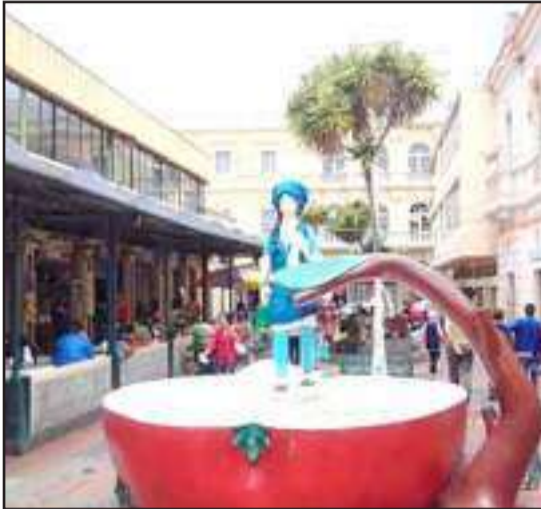
► Panorámica del pasaje colonial de La Merced.