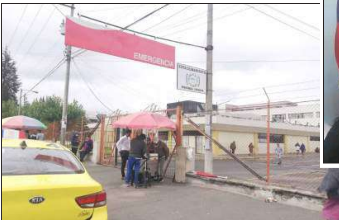
El HPGD atiende con normalidad en el área de Emergencia, pero sugieren medias de prevención.

Este sábado 1 de febrero, surgió el rumor sobre un posible caso de Coronavirus en Riobamba, lo cual puso en alerta a la ciudadanía; la desinformación se hizo viral a través de redes sociales mediante audios. En rueda de prensa, Héctor Pulgar, coordinador zonal 3 de salud se pronunció al respecto, descartando que se trate de un paciente portador del coronavirus.