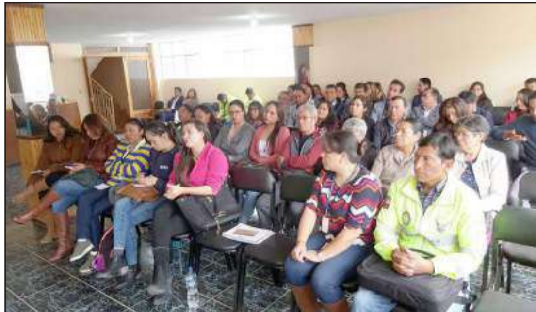
Diferentes autoridades acudieron al taller en donde se abordaron varios temas.