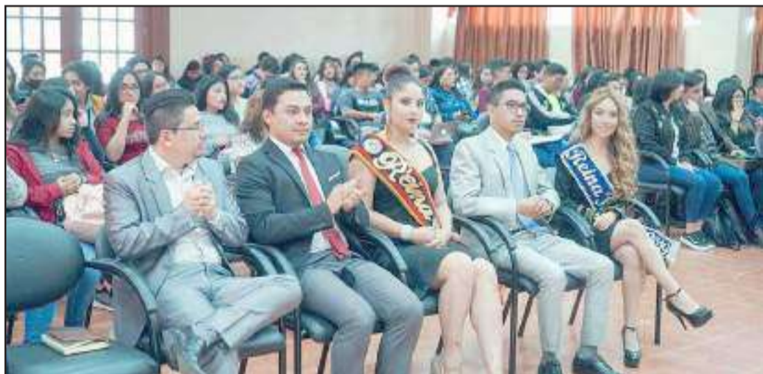
Los estudiantes y docentes de la institución estuvieron contentos de participar en esta actividad.