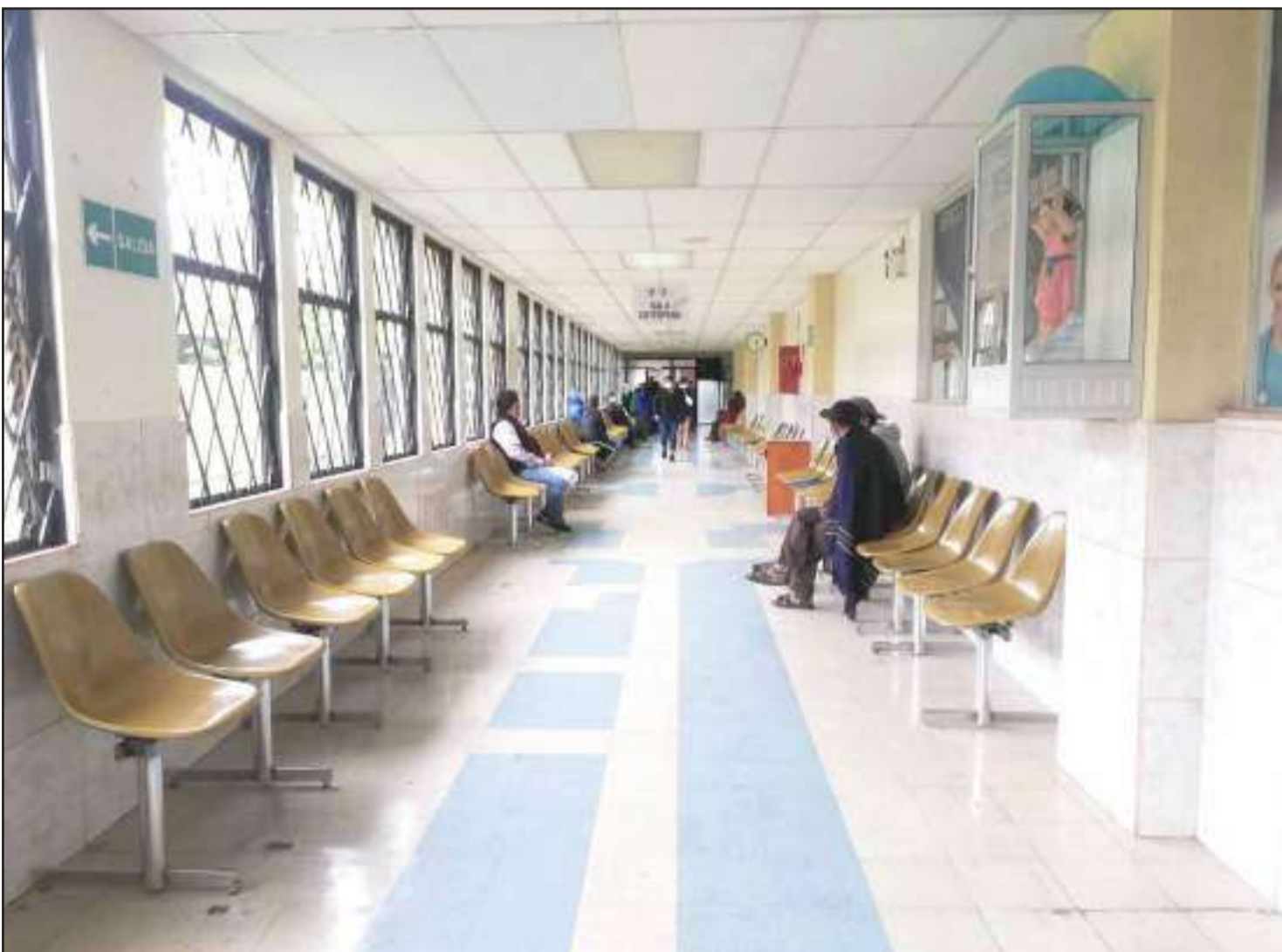
▶ HPGD atiende con normalidad en el área de Emergencia, pero sugieren medias de prevención.