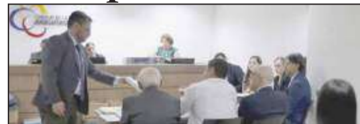
En el Tribunal Contencioso Administrativo de la Corte de Justicia de Guayaquil se efectuó la audiencia de juicio.