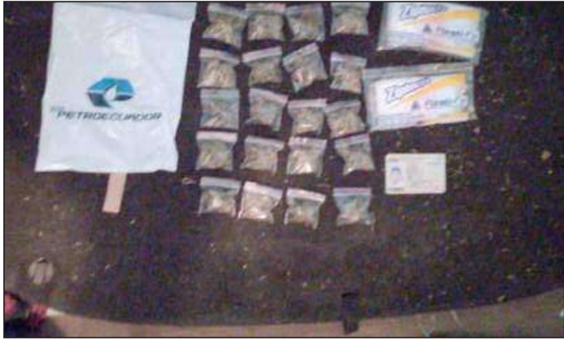
Las evidencias fueron presentadas ante las autoridades judiciales pertinentes.