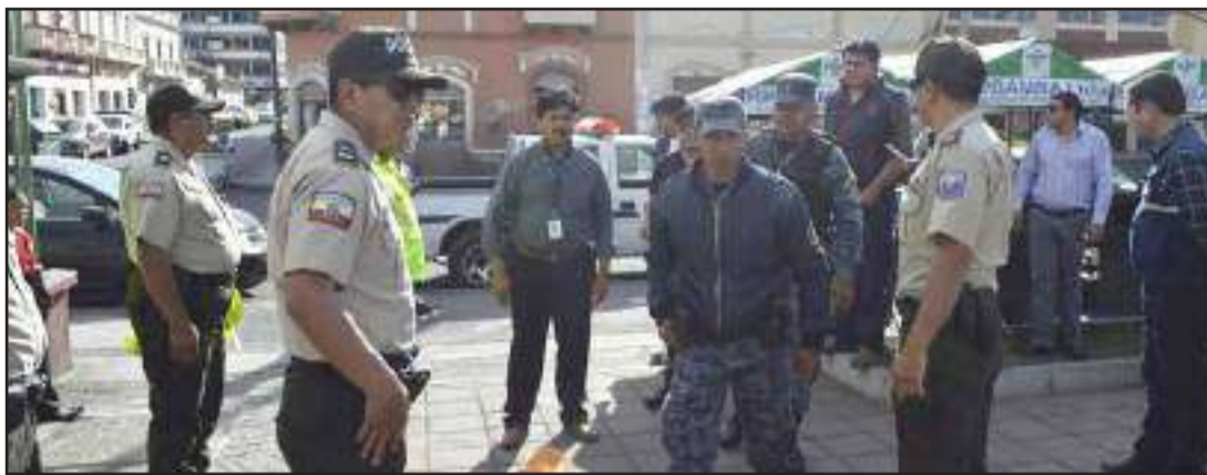
La Dirección de Control Municipal realiza un trabajo interinstitucional para mejorar la situación del barrio La Estación.