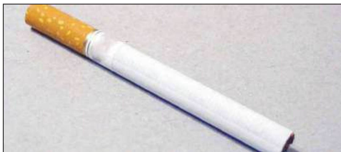
Por este motivo, Ecuador será sede de la Alianza Latinoamericana Anti-Contrabando que en mayo juntará a 16 países que buscarán formas de unir fuerzas para combatir el contrabando.