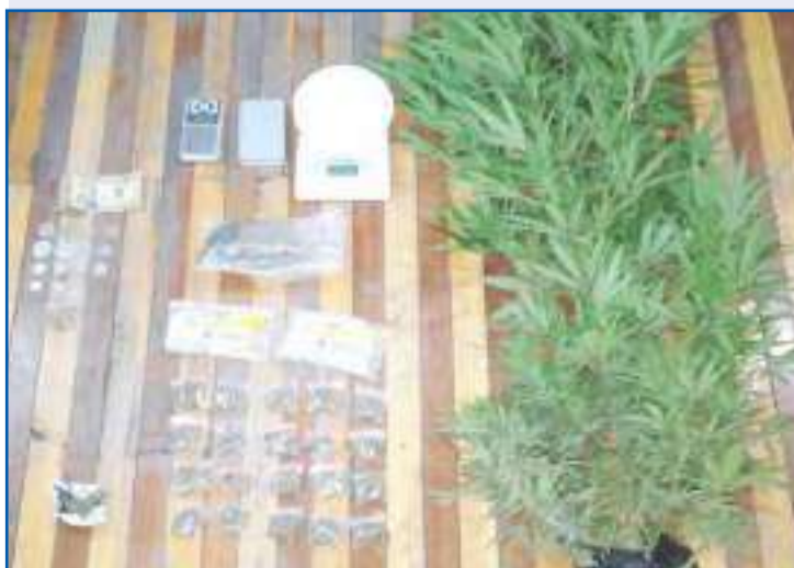
▶ La droga encontrada se encuentra bajo custodia policial.