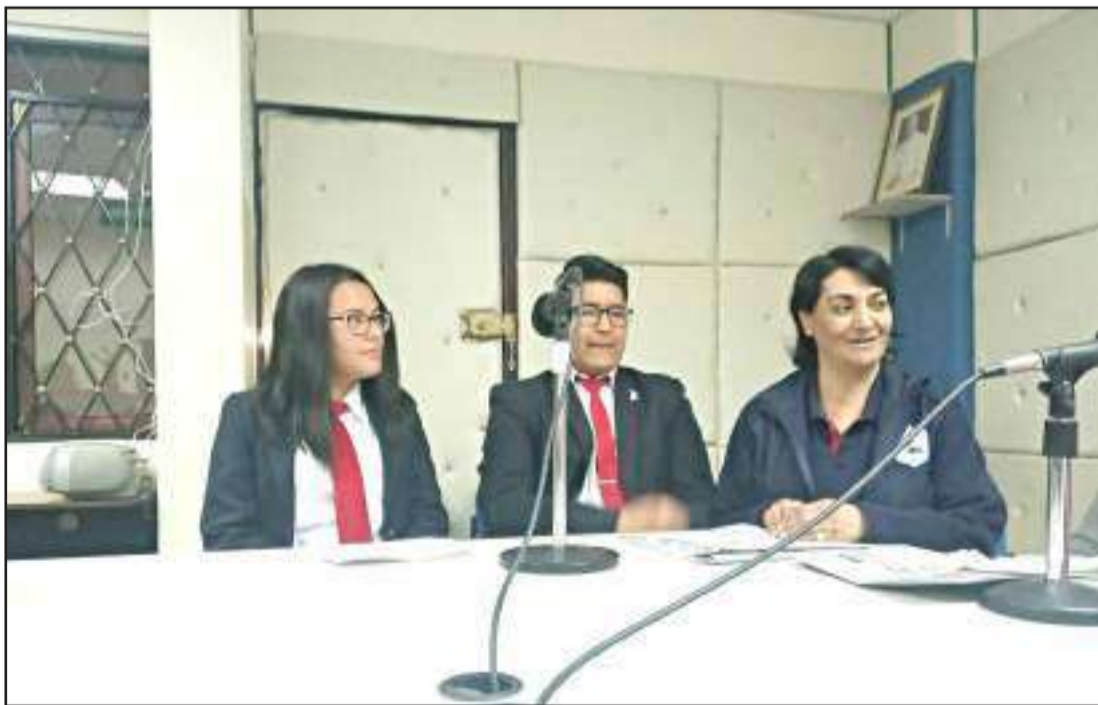
► Estudiantes y docentes del Salesiano visitaron los medios de comunicación.