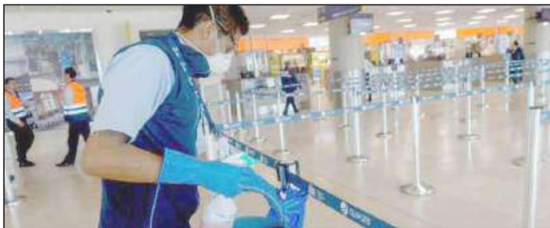
En el aeropuerto de Quito se intensificaron las medidas epidemiológicas.