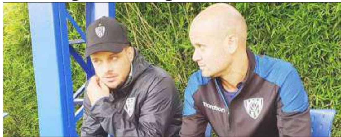
▶ Miguel Ángel Ramírez, DT del Independiente del Valle.