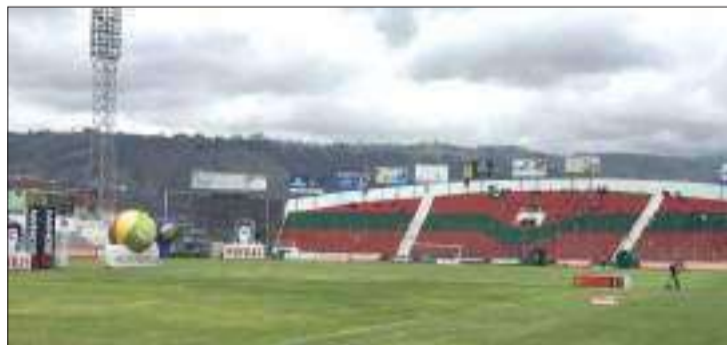
La Conmebol deberá aprobar el escenario para acoger torneos internacionales.

Cambio de luminarias y adecuaciones de las instalaciones del escenario son necesarias para acoger juegos internacionales.