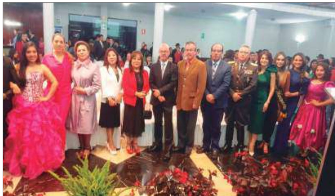
► Clausura de la cuarta edición se realizó con normalidad.