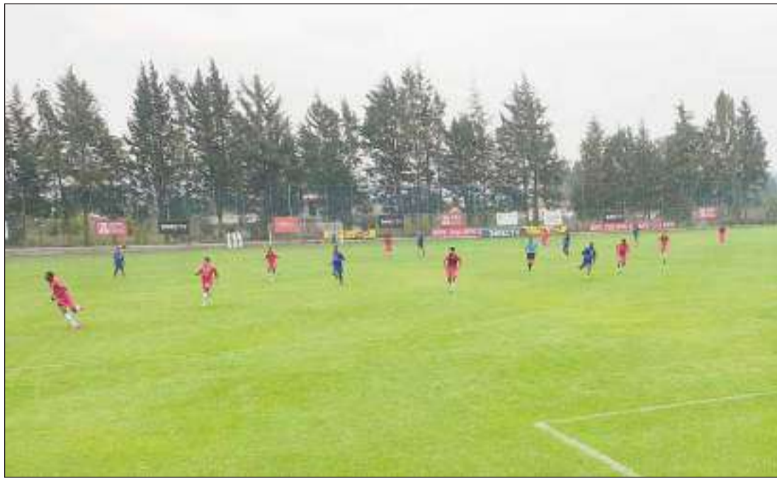
▶ Imágenes del encuentro jugado ayer en Sangolquí.

El partido amistoso pactado para ayer, se cumplió desde las 11h00, cuando se enfrentaron en el Centro Deportivo Olmedo y el elenco del Independiente del Valle.