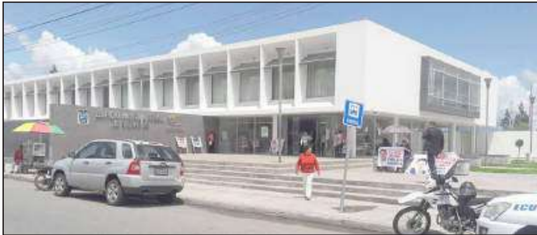
Se espera que el lunes finalice la audiencia y luego esperar el dictamen del juez.