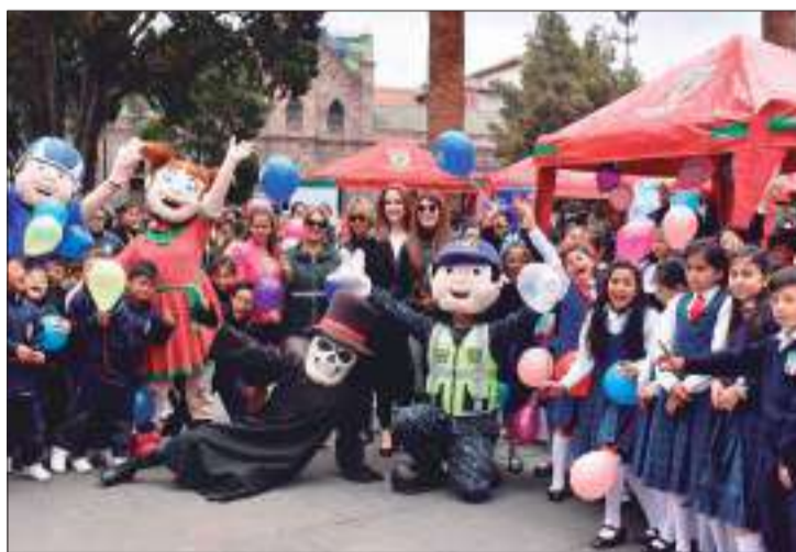
► Campaña de educación vial en la provincia de Tungurahua.

En este contexto, se realizó una casa abierta informativa en el parque Cevallos, con la participación de la Policía Nacional, Agencia Nacional de Tránsito, Sindicato de Choferes de Totoras, escuelas de conducción Aneta, Safre Drive, Vip Drive, Hospital Municipal Nuestra Señora de la Mece y la Dirección de Tránsito, Transporte y Movi-