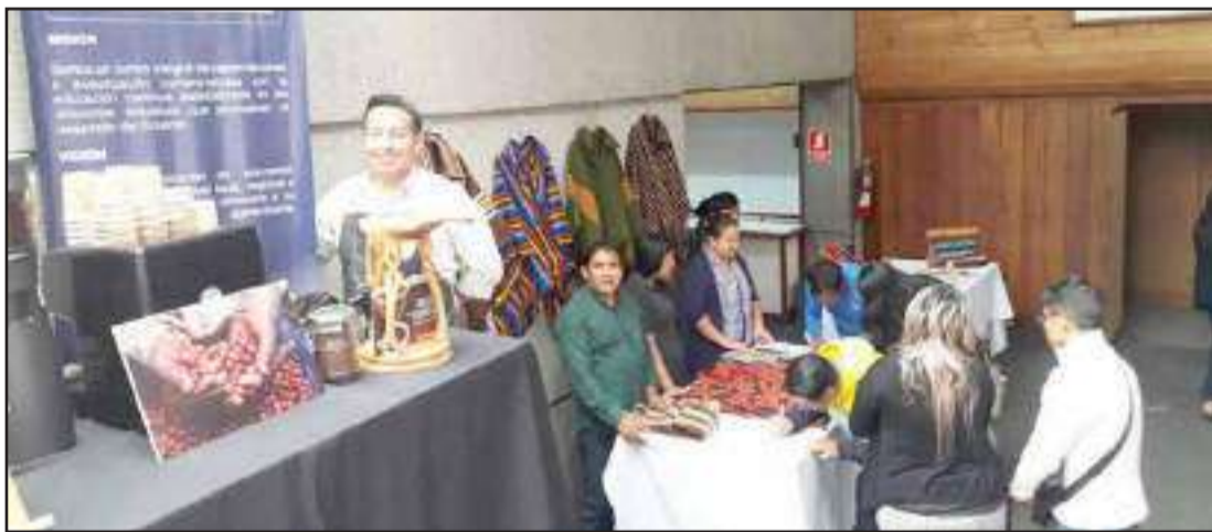
► Decenas de productores y emprendedores participaron en el taller de capacitación “Aprender a importar-exportar”

El jueves 30 de enero, a partir de las 15h00, en el Auditorio de la Prefectura de Chimborazo, se llevó a cabo el taller de capacitación “Aprende a importar-exportar”, dirigido a productores y emprendedores de la ciudad de Riobamba y provincia de Chimborazo