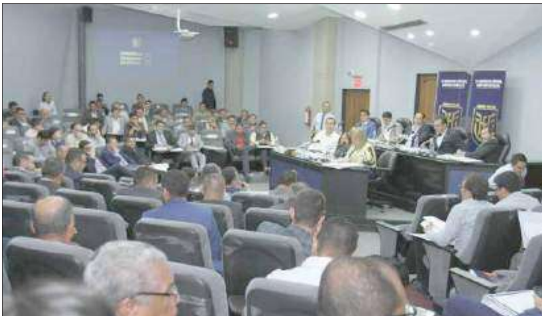
► El Congreso Ordinario de Fútbol resultó muy ágil. La propuesta de la la FEF organice el torneo de la Serie B fue re-