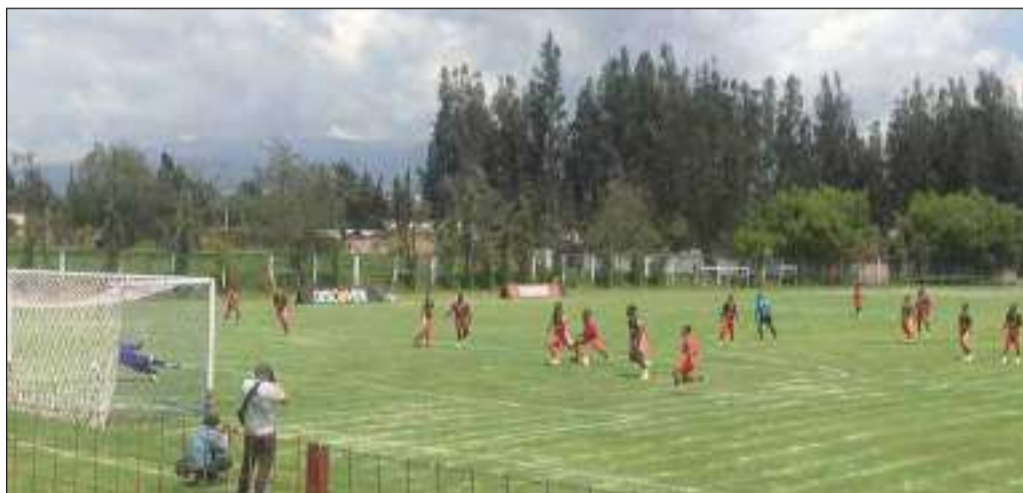
▶ Olmedo de Riobamba jugó con el Chacaritas.

Esta será la última semana de trabajos forzados para los jugadores del Centro Deportivo y entonces podrán hacer partidos de preparación ante equipos de la Serie A de la Liga Pro, uno de ellos ante Independiente del Valle el 1 de febrero en Sangolquí.