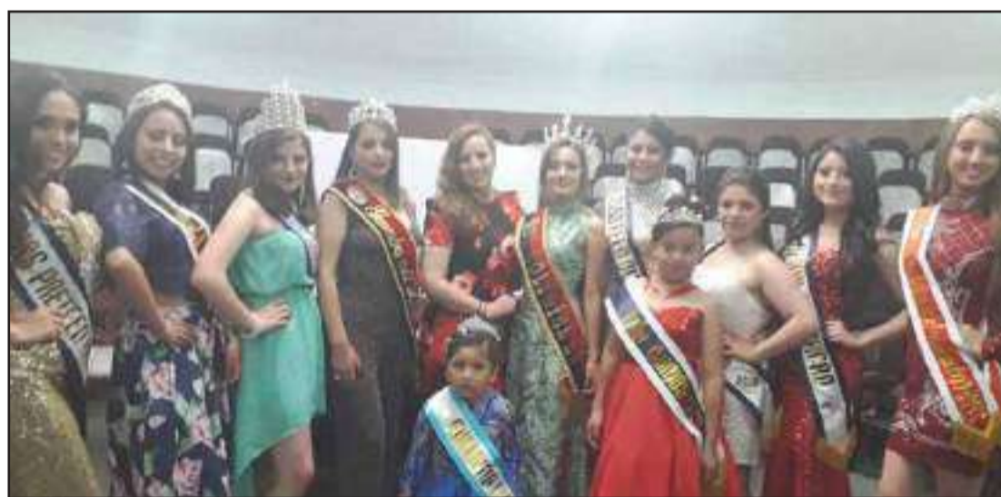
► Representantes de la belleza riobambeña que participarán en certámenes de belleza a nivel local y nacional.