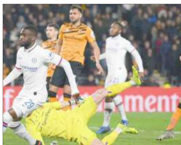
► El equipo de Frank Lampard paseó la grama del KC KCOM Stadium durante casi todo el encuentro

El equipo de Frank Lampard paseó la grama del KC KCOM Stadium durante casi todo el encuentro, pero en los compases finales los anfitriones elevaron la dosis de nervios gracias al gol del polaco Kamil Cgrosicki, en el minuto 78. Con poderosa presencia de jugadores españoles, dada las actuaciones de César Azpilicueta, Marcos Alonso y Pedro Rodríguez, el Chelsea dejó el panorama encarrilado a la hora de juego, con las dianas