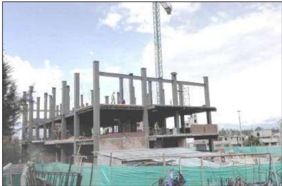
► Al momento en la Dolorosa, el nuevo edificio tiene un avance del 50%.