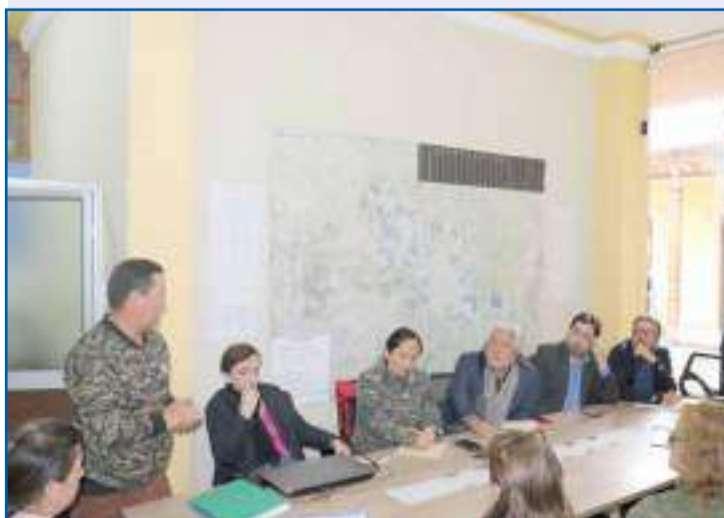
▶ La primera reunión se realizó con los propietarios de estos establecimientos de la ciudad.