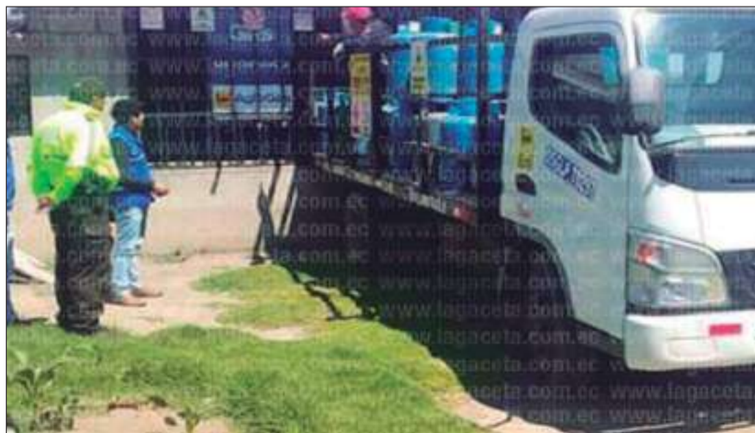
► Control a los camiones repartidores.

a más de los operativos se ha realizado un control minucioso con el objetivo de sociabilizar los precios oficiales y el precio en los recorridos que realizan los camiones repartidores en los sectores rurales.