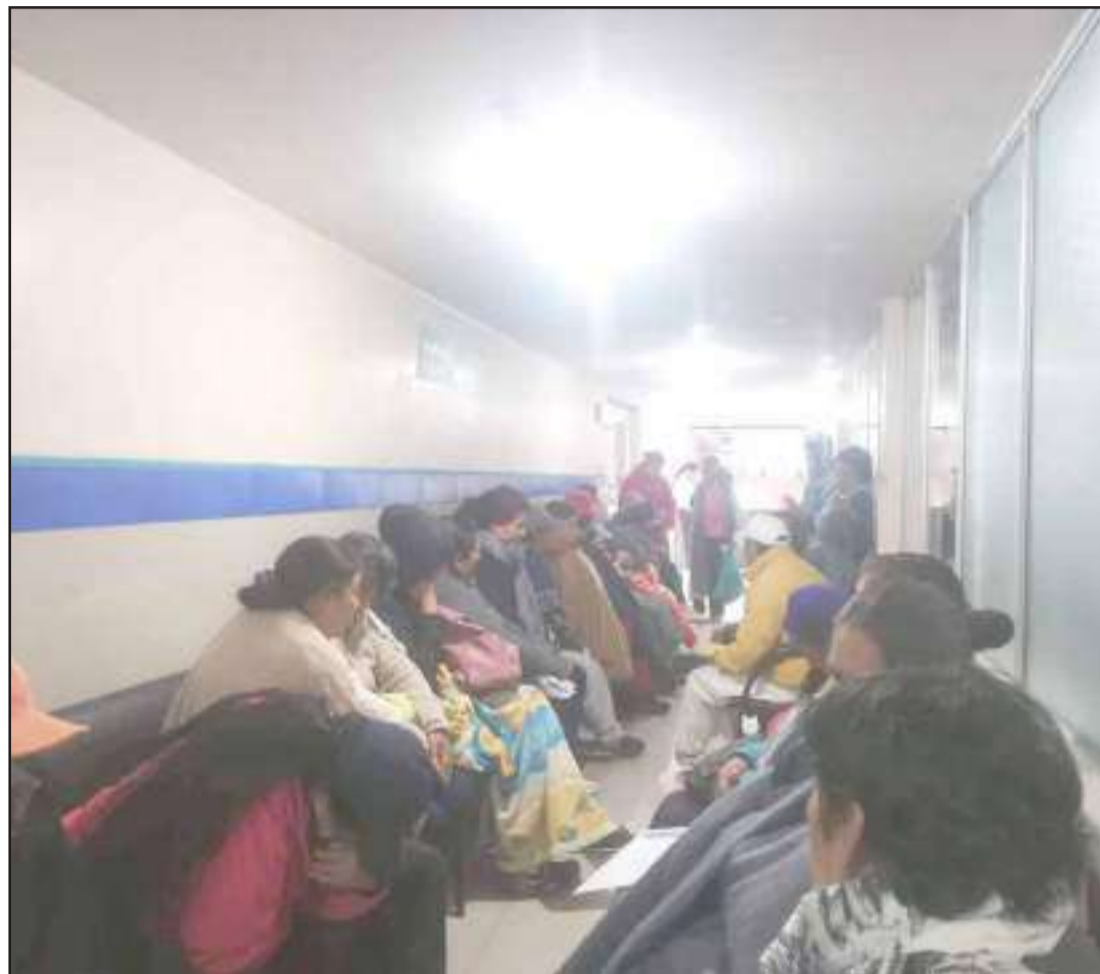
► La mayor demanda de turnos es en el área de geriatría.