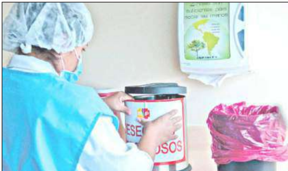
► El costo total de manejo de desechos en el país representa 27'160.722 dólares al año.