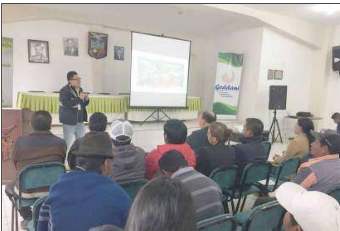
► El objetivo de los productores es alcanzar la certificación de las BPA.