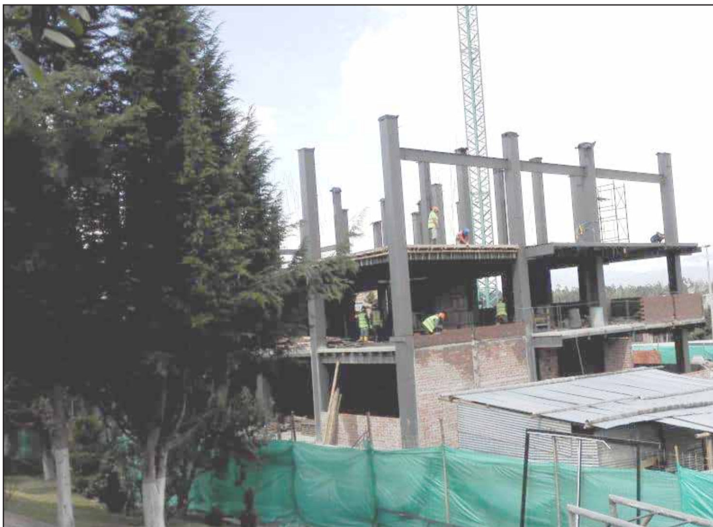
▶ Al momento, el nuevo edificio en la Dolorosa tiene un avance del 50%.