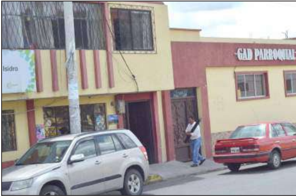
► El edificio del Gobierno Parroquial y auditorio de la parroquia San Isidro de Patulú

Este lunes San Isidro de Patulú cumple 126 años de creación.