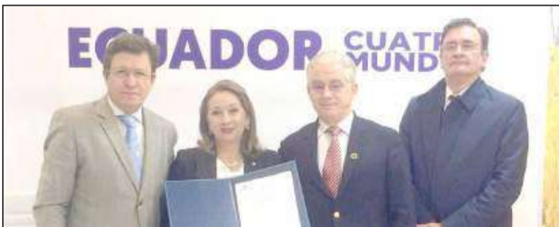
► Está previsto que a la conferencia asistan alrededor de 400 participantes nacionales e internacionales que integrarán diferentes paneles temáticos sobre políticas y estrategias de turismo accesible, accesibilidad y su potencial económico para el sector turístico, atractivos turísticos accesibles, entre otros temas.