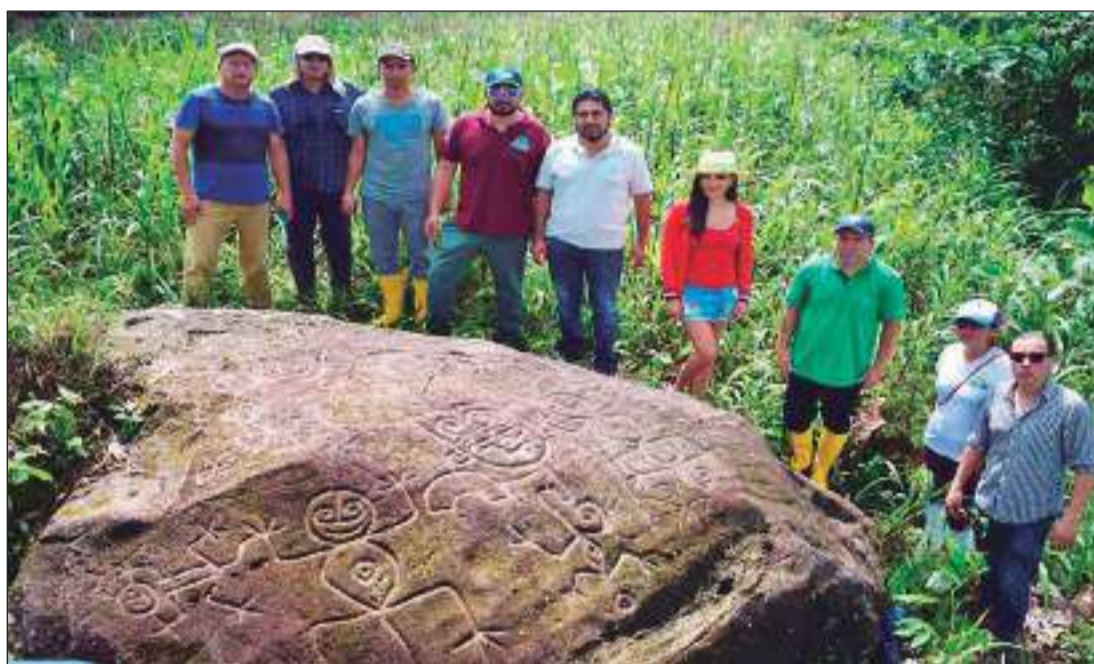
Fundación Conservarte Ecuador visita petroglifo de Palora.

deterioro y riesgo. Por lo que se requiere de un plan urgente de delimitación y protección del área.