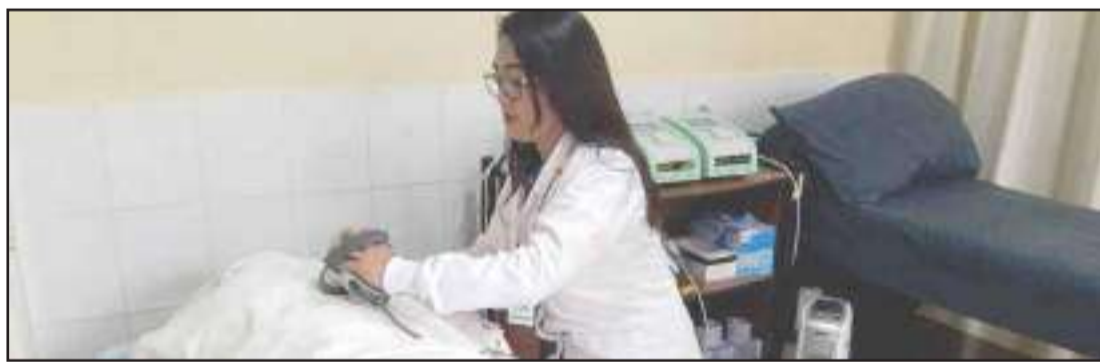
► Los dos nuevos servicios, es abierto a todos los ciudadanos que necesiten