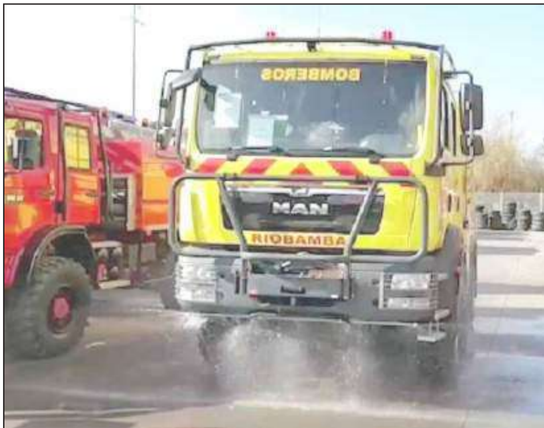
► El automotor llegará la finales del mes de febrero.