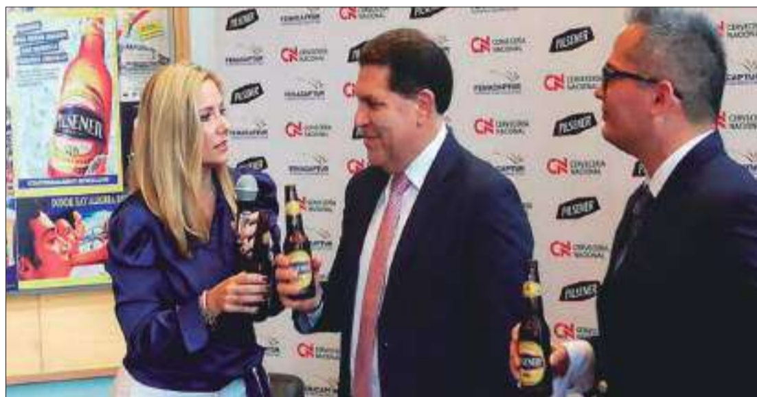
► Presentación de la Campaña la Fiesta de Todos.