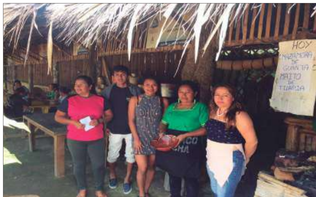
Esta feria funciona desde marzo del año pasado.