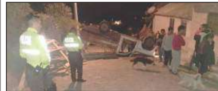
► Los gendarmes llegaron al sitio a investigar el siniestro.