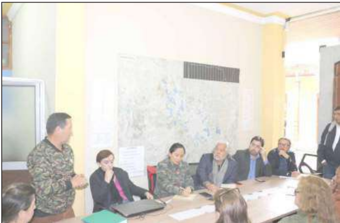
► La primera reunión se realizó con los propietarios de estos comercios de la ciudad.