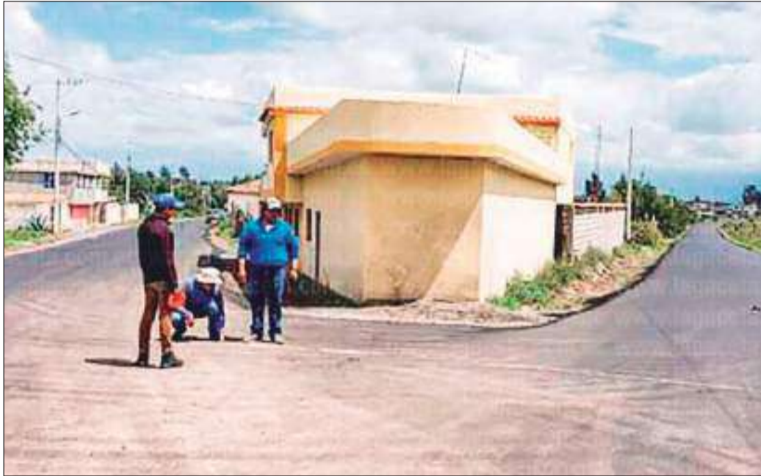
► Prefectura realiza el asfalto de vías en barrios rurales que están próximas a culminar.

Posteriormente constató el avance de la construcción del Coliseo de Deportes que ejecuta la Prefectura de Bolívar, el mismo que está en su fase final de acabado y pintura y será entregado en las próximas semanas. Una de las principales acciones fue la firma del Convenio de Cooperación Interinstitucional entre la Prefectura de Bolívar y el GAD Parroquial,