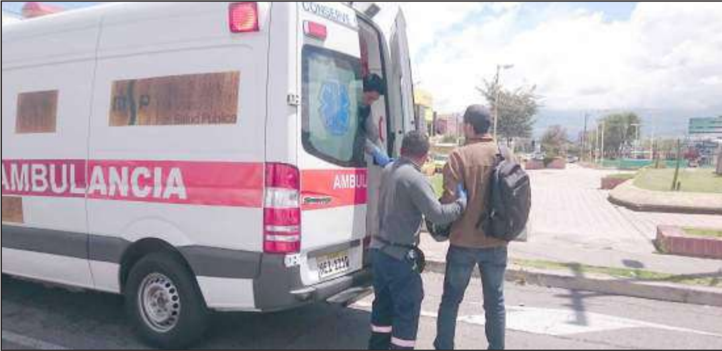
► En estos últimos días, a causa de los accidentes de tránsito, varias personas han resultado heridas.