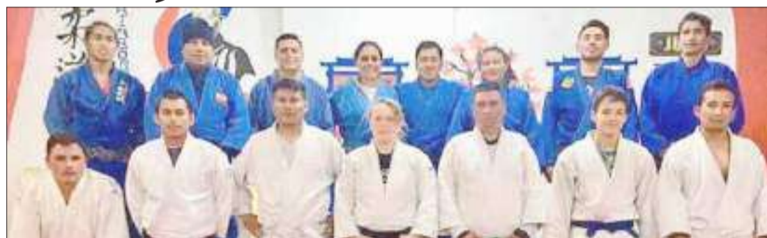
▶ Judocas de Chimborazo que representaron en el torneo nacional de Judo.