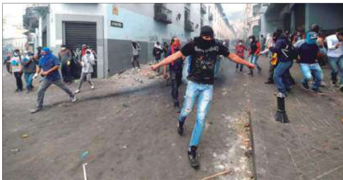
► El texto señala que en octubre Ecuador vivió jornadas de violencia organizada que atentaban contra el orden democrático.