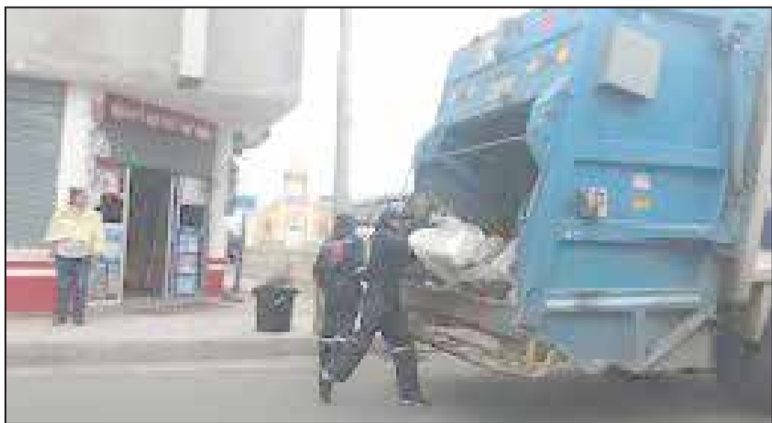
► Hasta el momento la recolección en Yaruquíes se realiza con el sistema normal.