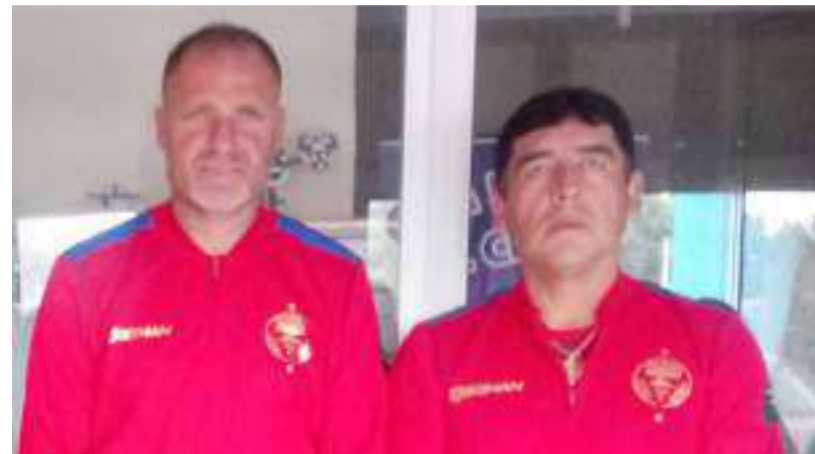
▶ Parte del Cuerpo Técnico del plantel olmedino.

Olmedo viene cumpliendo con el plan establecido desde el comienzo, esto es trabajar desde el 8 de enero en el aspecto físico y finalizar el 1 de febrero, para luego de ello tener encuentros amistosos con equipos de la serie A e inclusive ver la posibilidad de que al final de la preparación y para la presentación del equipo a su público, juegue con un equipo internacional, que está por confirmarse.