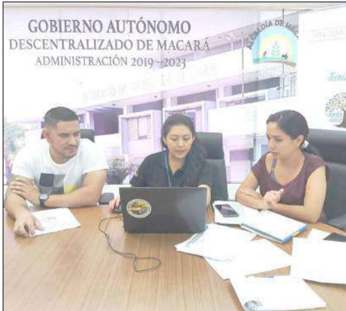
► Esta institución del Estado con los técnicos de la dirección de Registro y Control brindó asesoría en territorio al GAD Municipal del cantón Macará.