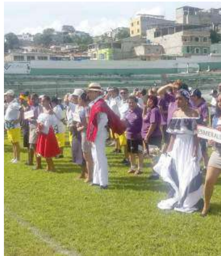
► Jugadores de las provincias participantes.