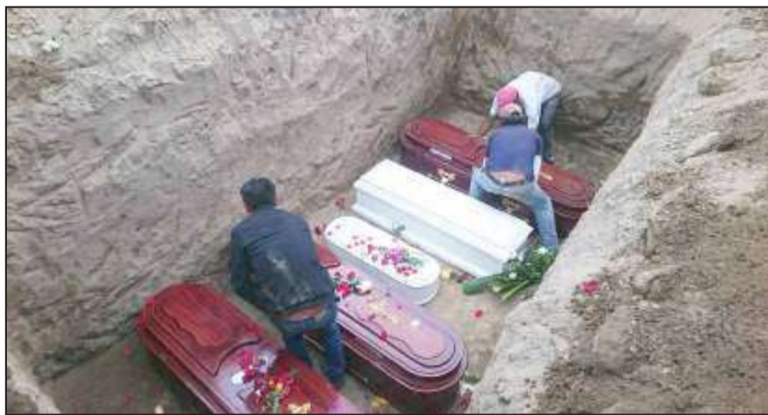
▶ Los féretros fueron colocados en la misma fosa.