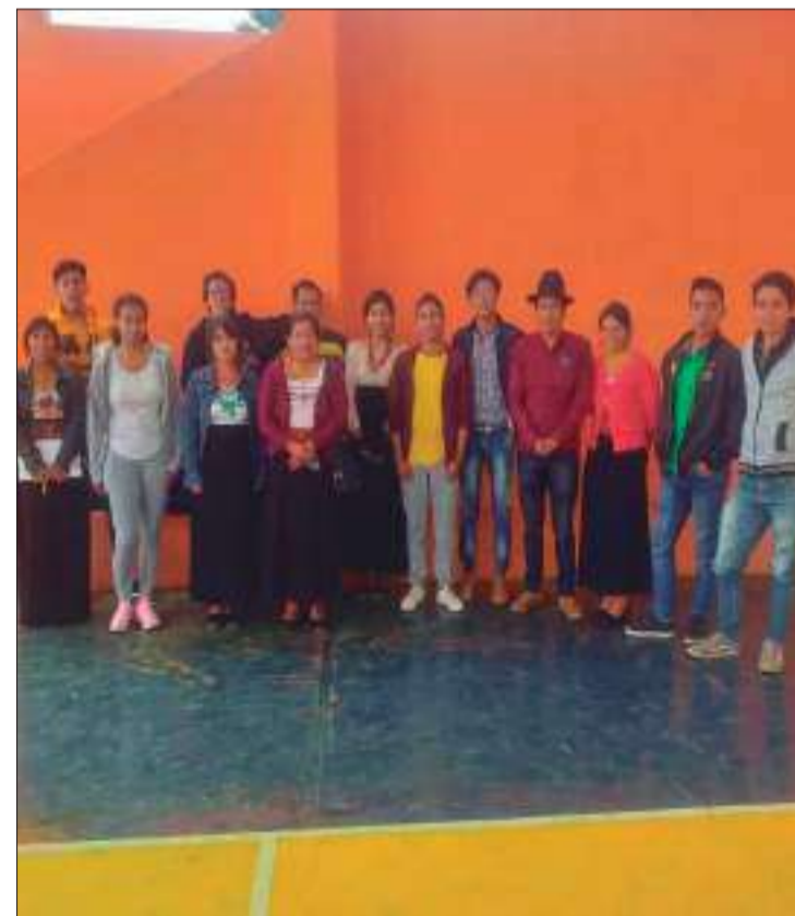
Los talleres se realizarán con el objetivo de reforzar la estructura y el trabajo de la organización de los jóvenes kichwas.

Los talleres se realizarán con el objetivo de reforzar la estructura y el trabajo de la organización de los jóvenes ki-