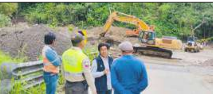
▶ Autoridades recorrieron la zona afectada.