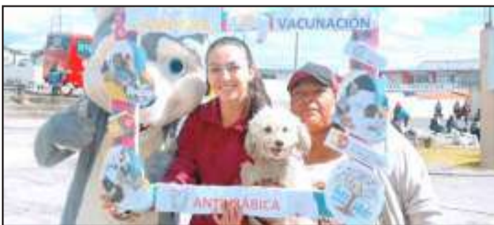
Para la Coordinación Zonal 3 Salud ha llegado un total del biológico 243280.