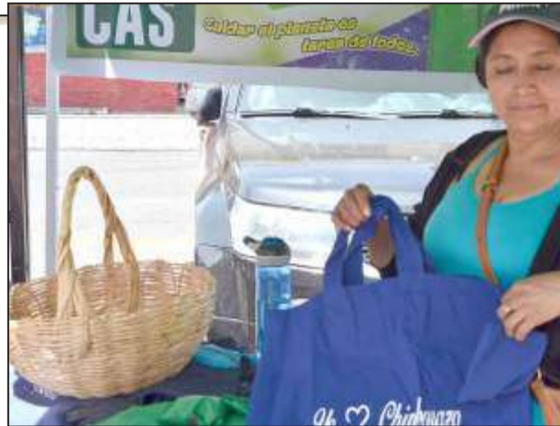
Las familias también elaboran bolsos reutilizables.

Explicó que para la elaboración de las canastas acuden a los humedales que hay en la parroquia San Gerardo, cor-