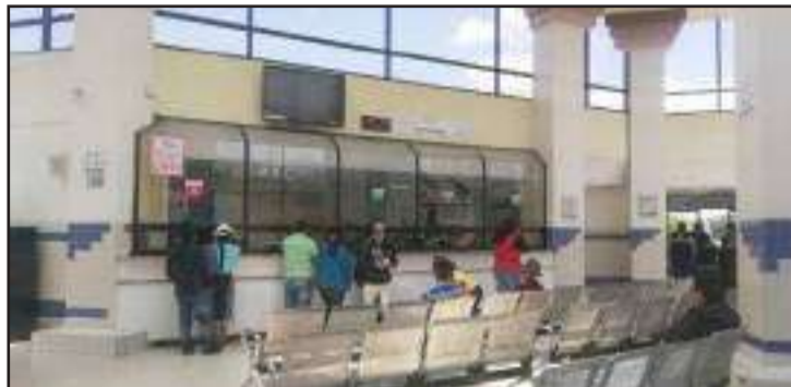
HPGD de Riobamba ofrece atención en el área de rehabilitación y terapia física.