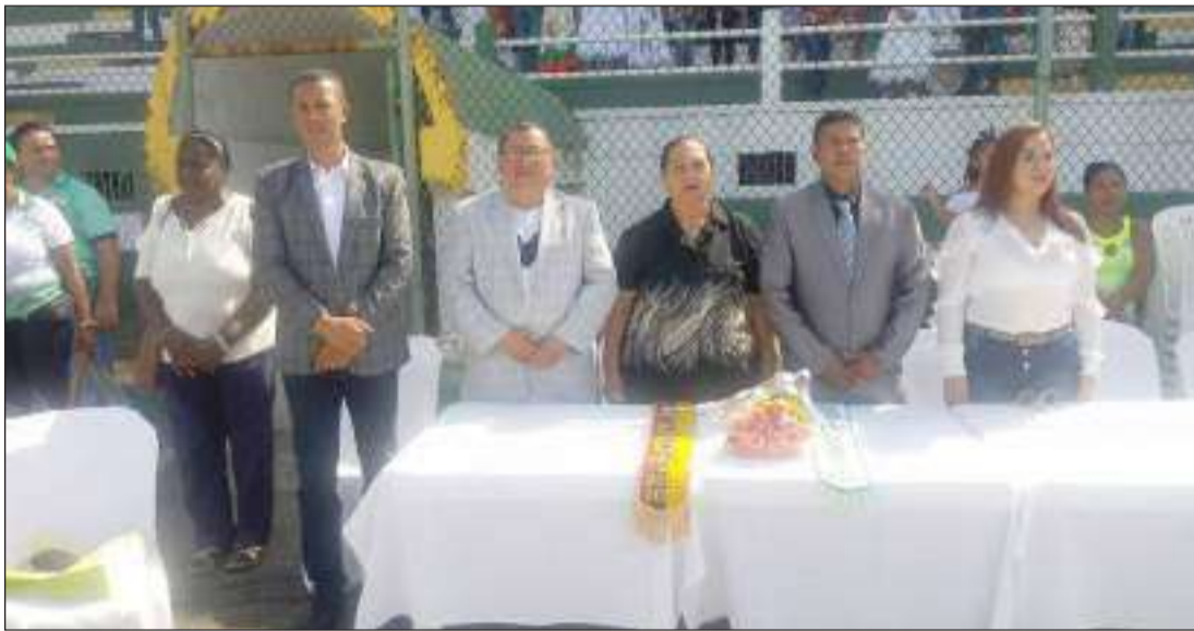
► Autoridades presentes en el acto de inauguración de los XVIII Juegos Nacionales.

Ayer en horas de la mañana y luego de un desfile por las principales calles de la ciudad de Esmeraldas, con la presencia de todas las provincias participantes, se inauguró los XVIII Juegos Nacionales del Periodismo Deportivo.