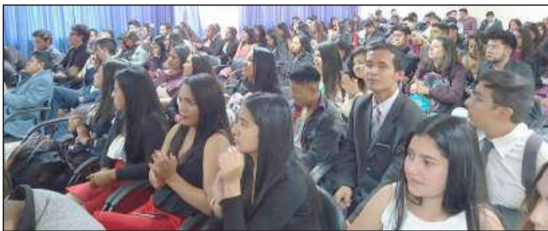
Los estudiantes que participaron en esta actividad presentaron sus ideas.