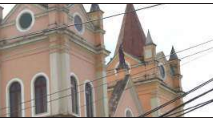
Iglesia matriz del cantón Chambo.