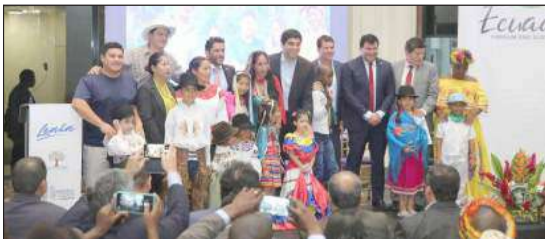
Presentación de la Feria Fruit Logistic 2020.