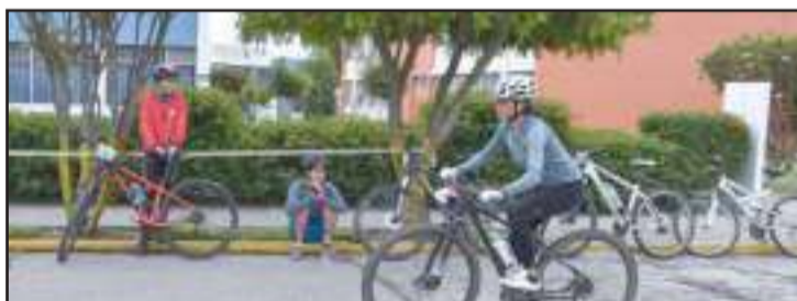
La finalidad de esta actividad es fomentar en los estudiantes y funcionarios el cuidado del planeta.