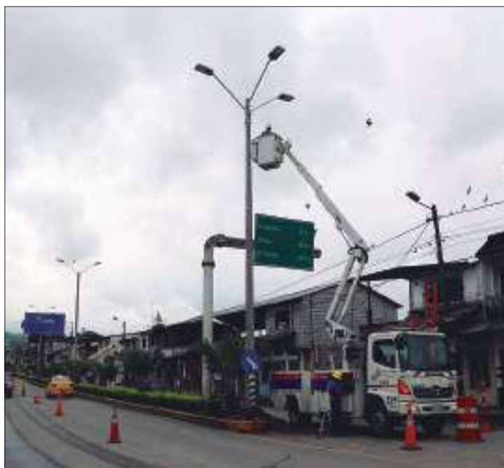
► EERSA instaló luminarias LED en Cumandá.

Los trabajos fueron realizados por el personal de la institución eléctrica el 16 y 17 de enero del presente año. El presupuesto asignado para esta obra que aporta a la actividad comercial que se desarrolla en el perímetro de la vía y sus alrededores, además del turismo y seguridad ciudadana, supera los 38.900 dólares. Las ventajas de las luminarias LED instaladas son: Visualización de los colores reales, mayor tiempo de