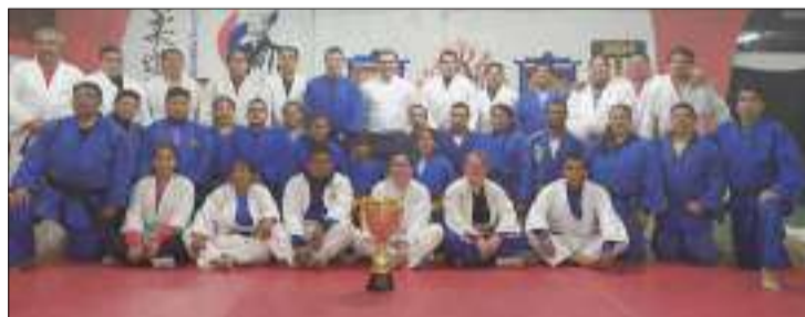
▶ Chimborazo se ha convertido en campeón absoluto en ediciones anteriores del torneo.

217 deportistas participarán en el torneo, que vienen de diferentes provincias del país e inclusive una delegación de la Federación Peruana de Judo.