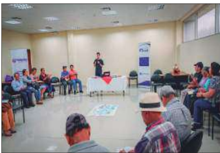
Ciudadanos acudieron a este evento.