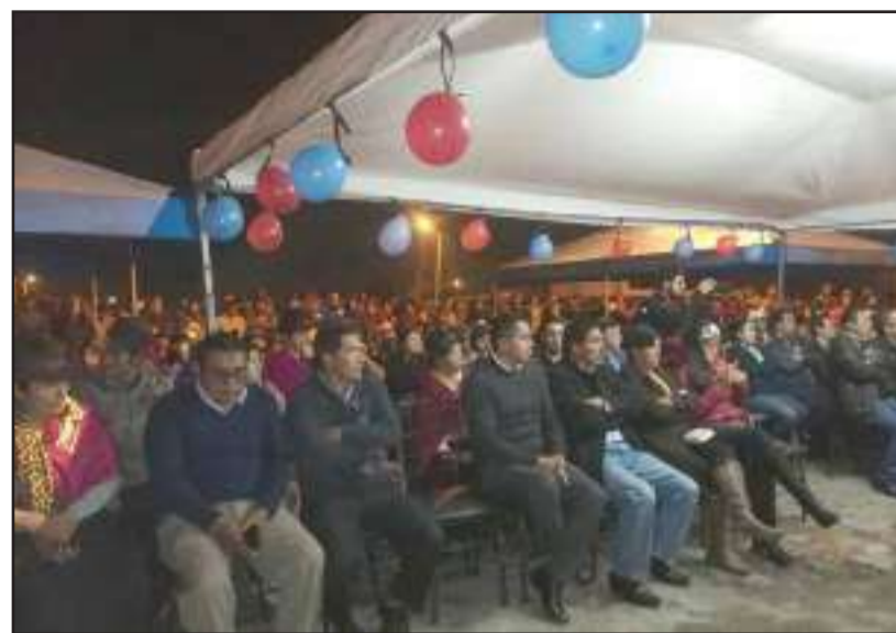
Alrededor de 200 familias serán beneficiadas con estos estudios.

En el barrio Liribamba se llevó a cabo la firma del contrato para la consultoría de planificación del Polígono de Interés Social "La Lolita". El objetivo de este contrato es el establecimiento de condicionantes sustentados en una normativa que despliegue del crecimiento ordenado y planificado de esta zona y del cantón.