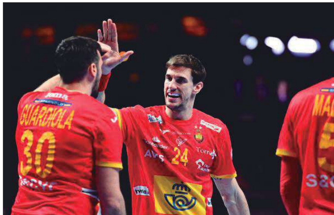
▶ Morros y Guardiola celebran una acción, este viernes.