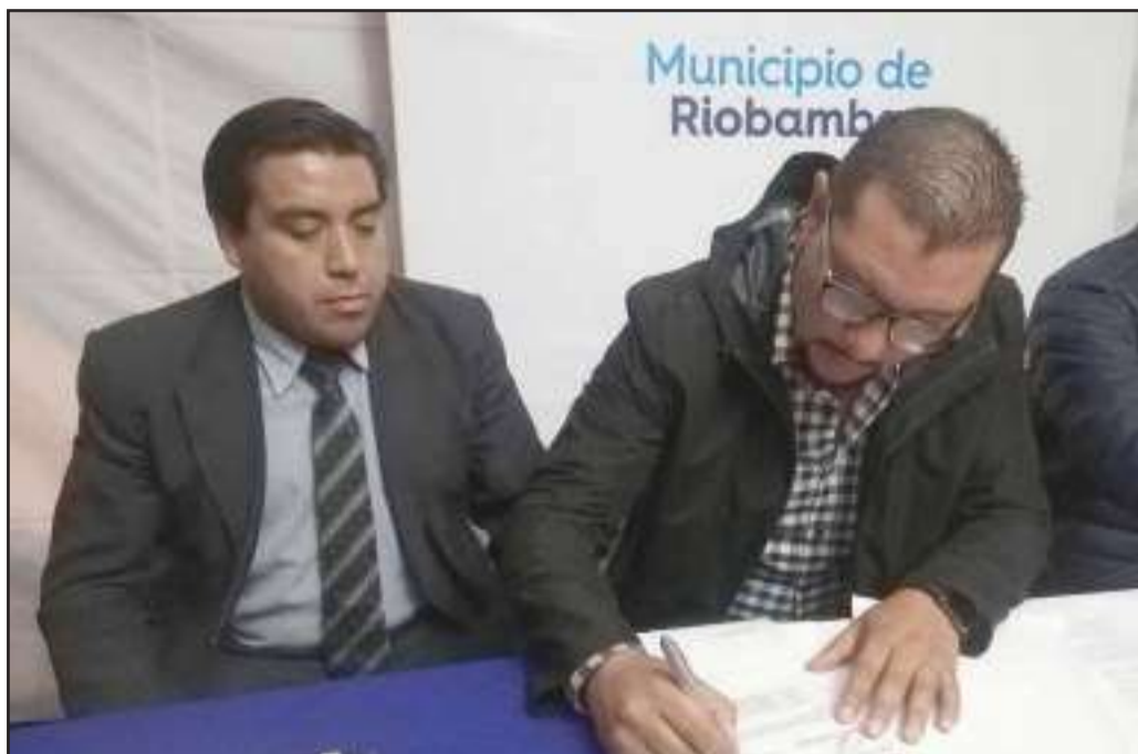
El contrato fue suscrito por el contratista que ejecutará los estudios en esta zona.

La firma del contrato para que se realicen los estudios en el polígono denominado "La Lolita", se hizo en presencia de los moradores de los barrios beneficiarios y los funcionarios de la municipalidad.