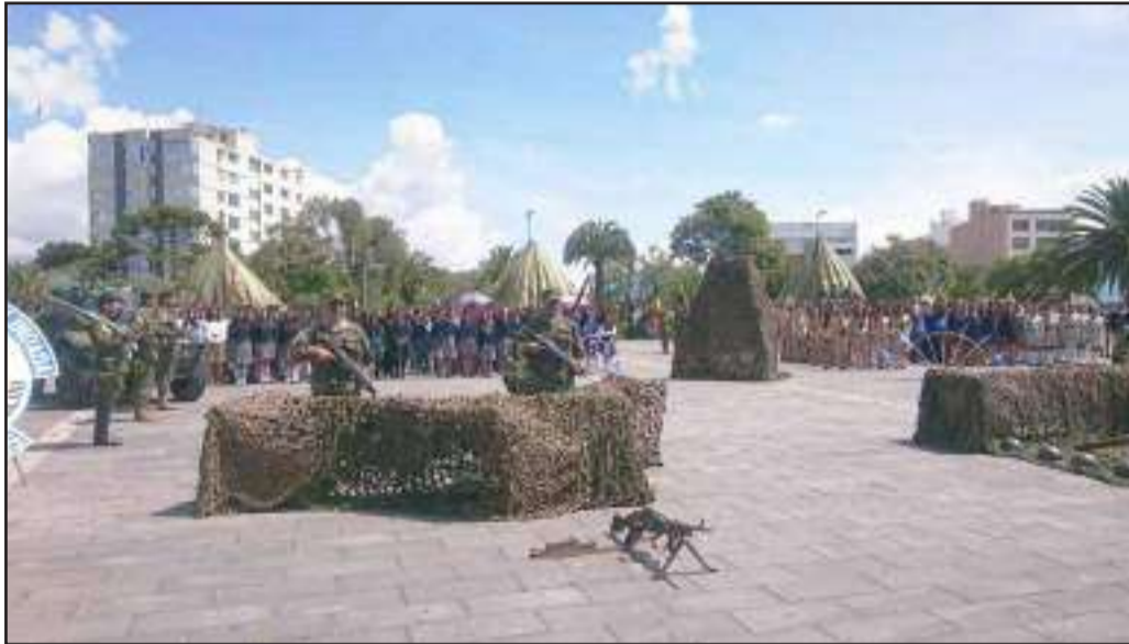
▶ Estudiantes y militares recordaron los 24 años del Combate del Cenepa.

Con civismo y gallardía se recordaron los 25 años de la Guerra del Cenepa. Autoridades de la provincia y estudiantes rememoraron la gesta de héroes que ofrendaron su vida por la Patria.