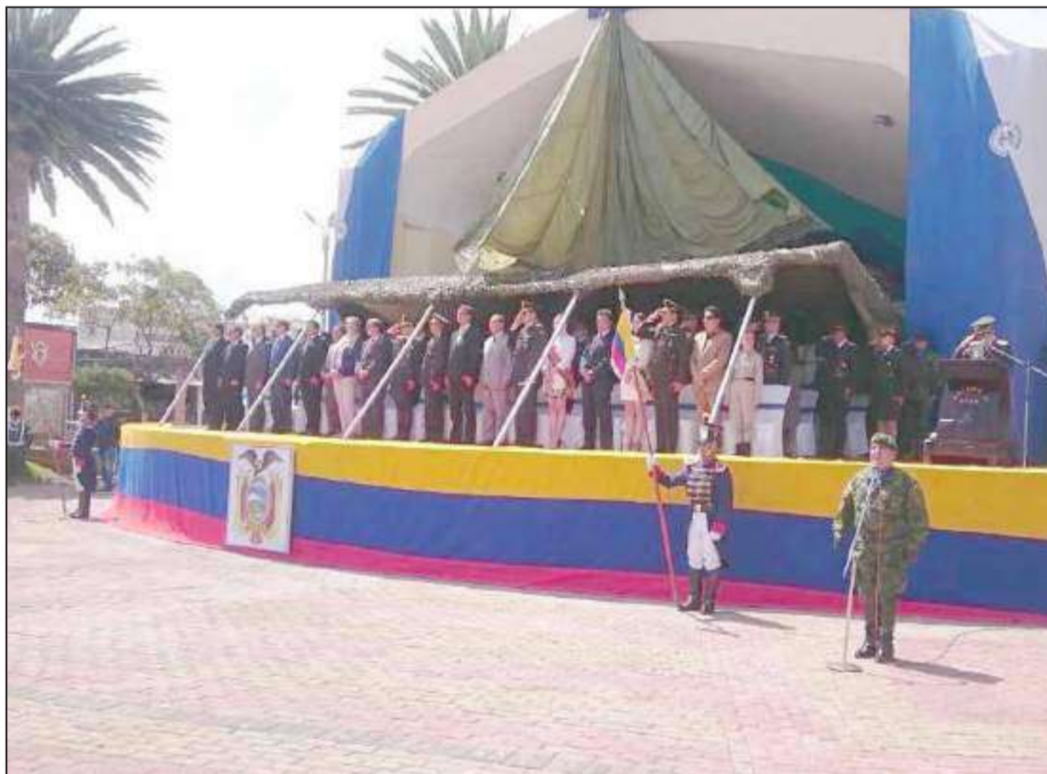
Estudiantes y militares recordaron los 24 años del Combate del Cenepa.