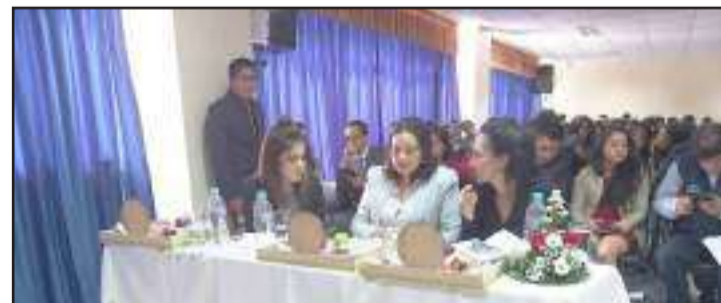
El jurado calificador estuvo constituido por mujeres profesionales en estas temáticas.

Con el objetivo de fomentar alternativas de inversión desde la academia, para que posteriormente se conviertan en proyectos ejecutables que contribuyan al dinamismo económico de la provincia y país, en la Unach se realizó la segunda edición del programa denominado "Sales pitch, Administración Empre-