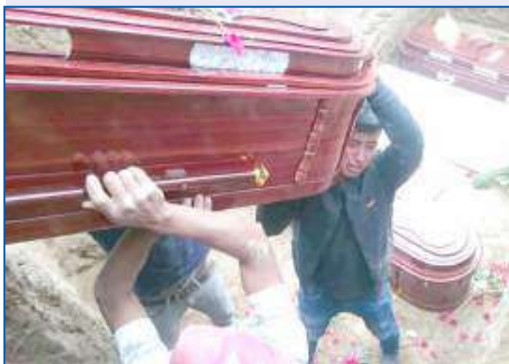
Los féretros fueron colocados en la misma fosa.