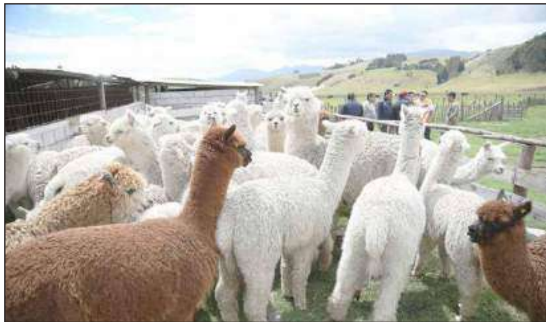
► Las Alpacas, animales muy ricos en fibra, contribuirán al cuidado y conservación del medio ambiente.