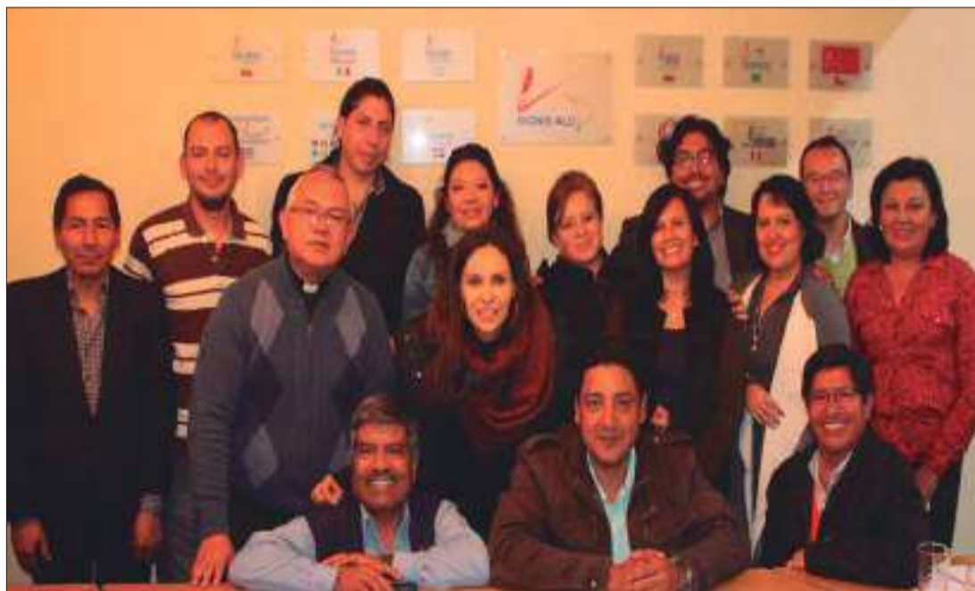
► Asociación de comunicadores católicos SIGNIS Ecuador.