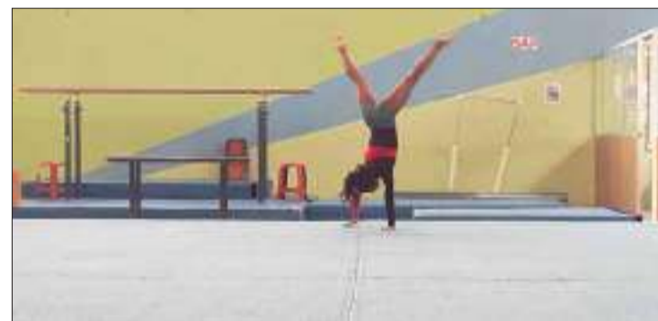
▶ Los gimnastas lograron varios triunfos para Chimborazo durante el 2019 en sus participaciones.

A mediados de febrero iniciarán sus competencias a nivel nacional, también participarán en un selectivo que servirá para escoger la selección de gimnasia para los juegos bolivarianos.