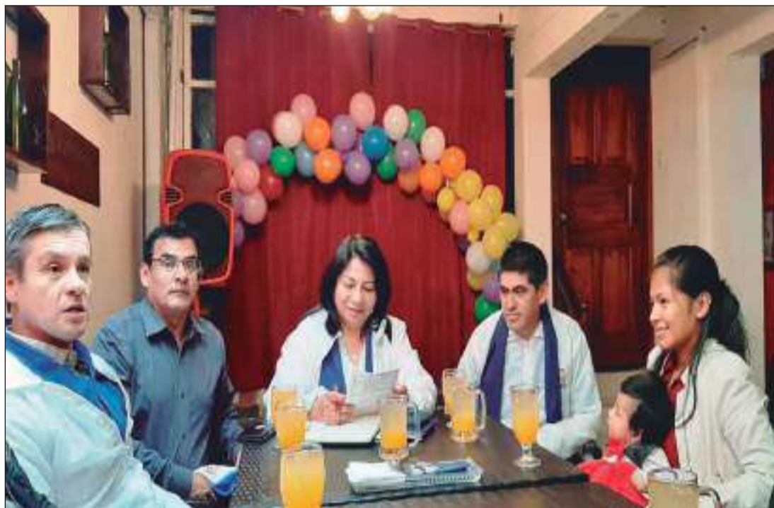
El propósito es dar a conocer las propuestas del plan de trabajo de dicha candidatura.