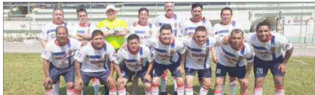
► Equipo de Chimborazo juega hoy ante Manabí.