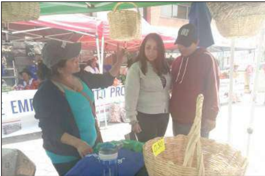
Las canastas de carrizo, un elemento importante para evitar la contaminación.

Señala, que nació en la parroquia San Gerardo del cantón Guano y desde muy niña junto a sus padres migró a Guayaquil, después a España; a su retorno es su obligación apoyar a quienes lo necesitan especialmente las mujeres, por iniciativa propia creó la fundación Caminantes del Mundo entidad de la que es su presidenta, también busca