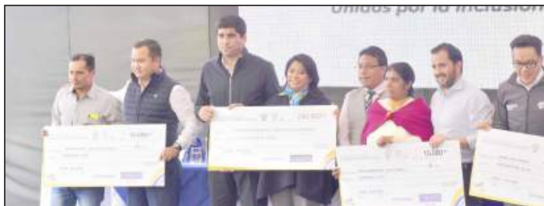
► En el cantón Colta se entregó un total de 140 mil dólares a los emprendedores.

Para concluir con su agenda, el vicepresidente visitó la Unidad Educativa Riobamba, en donde realizó la inauguración de la cancha del proyecto Juego Limpio 2030. (18)