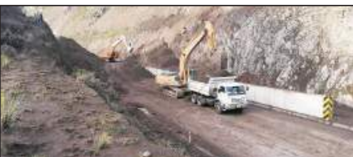
Los trabajos de limpieza continúan.