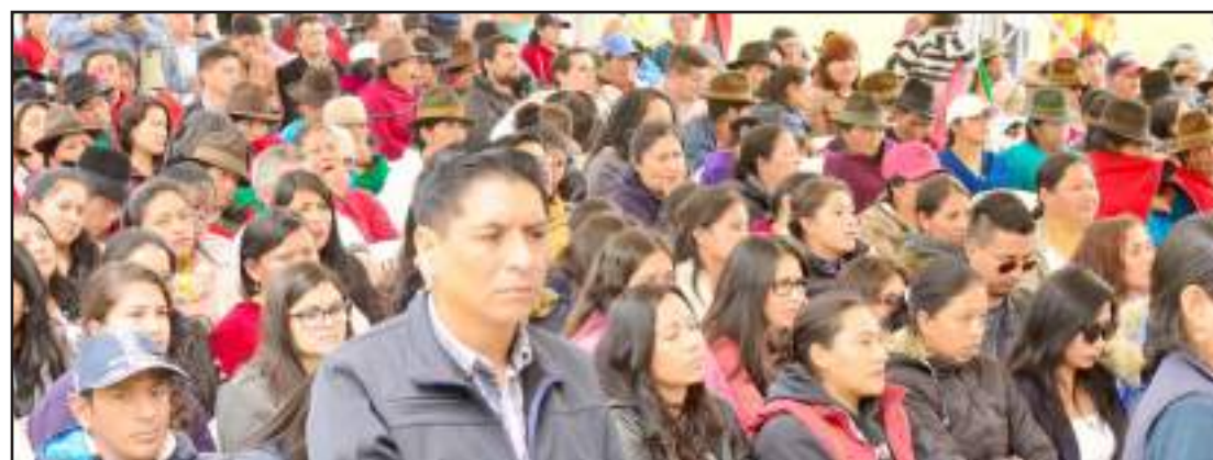
► Cientos de habitantes de las distintas comunidades acudieron al evento en Colta.