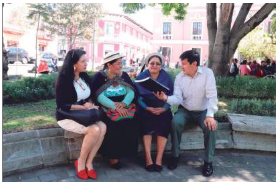
► Simbaña visitó el cantón Guaranda.