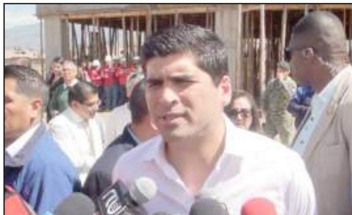
Vicepresidente Otto habló sobre la ayuda que recibirá la familia de las víctimas.