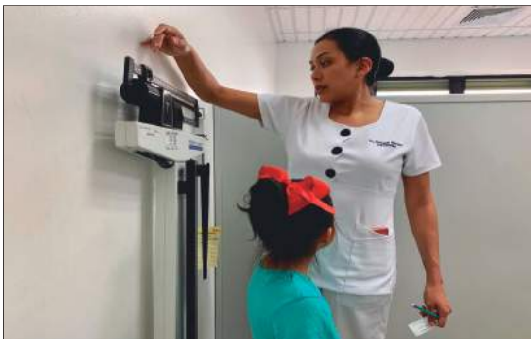
► Atención a pacientes con problemas de obesidad.