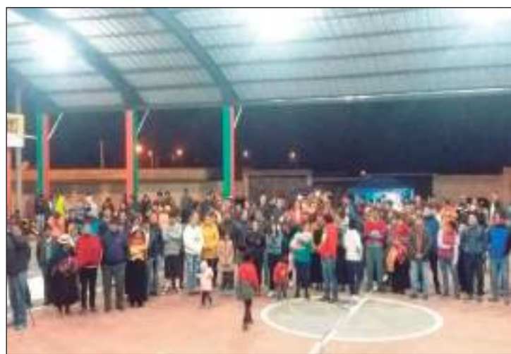
► Moradores se mostraron agradecidos con la obra.