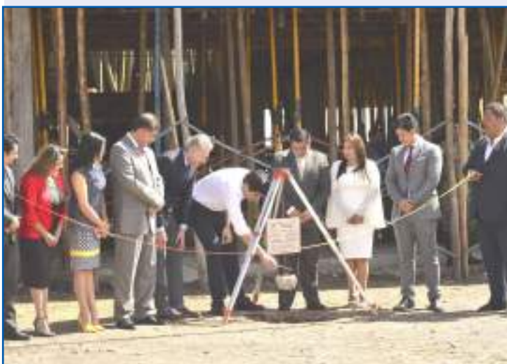
▶ El Vicepresidente participó de la presentación de esta obra.