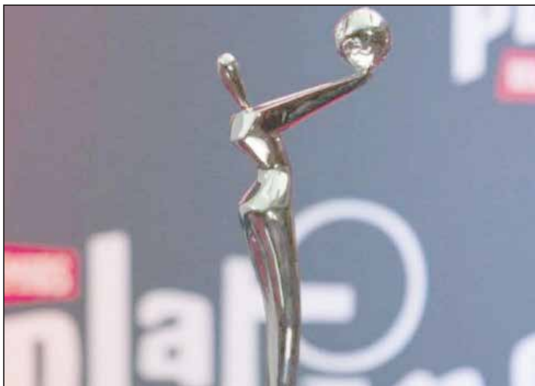
► El evento es el más importante del cine iberoamericano.