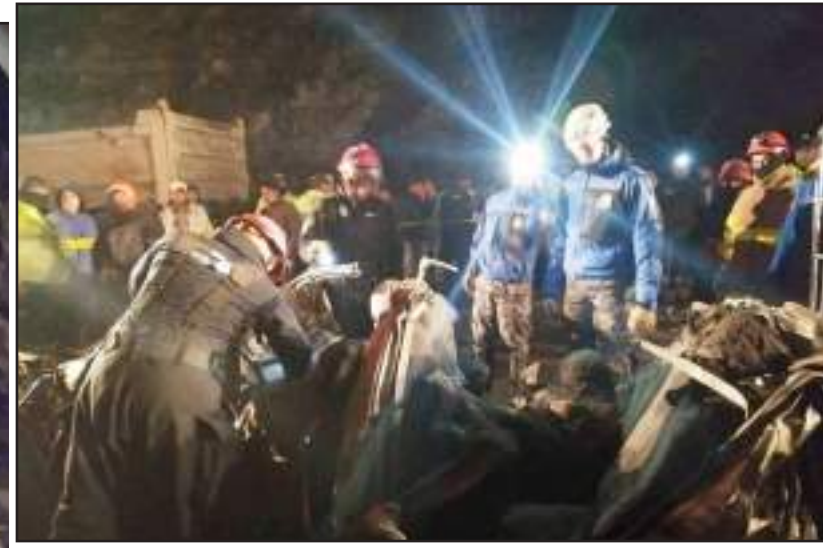
El vehículo terminó destruido.