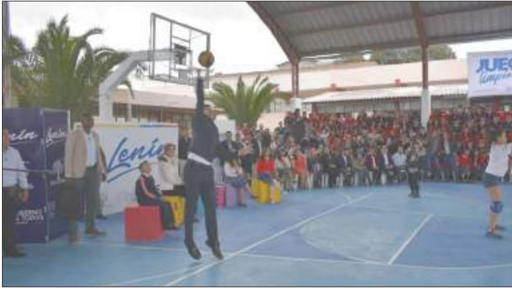
▶ Sonnenholzner destacó el nivel deportivo de las estudiantes que fueron parte del partido.

La cancha beneficiará a más de 3.772 estudiantes y forma parte del proyecto emblemático del Gobierno Nacional.