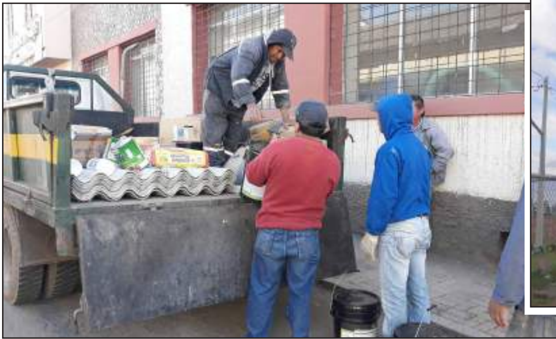
► Personal hace el traslado de los materiales para mejorar los centros.

En el cantón funcionan tres centros En la parte céntrica: "Mi