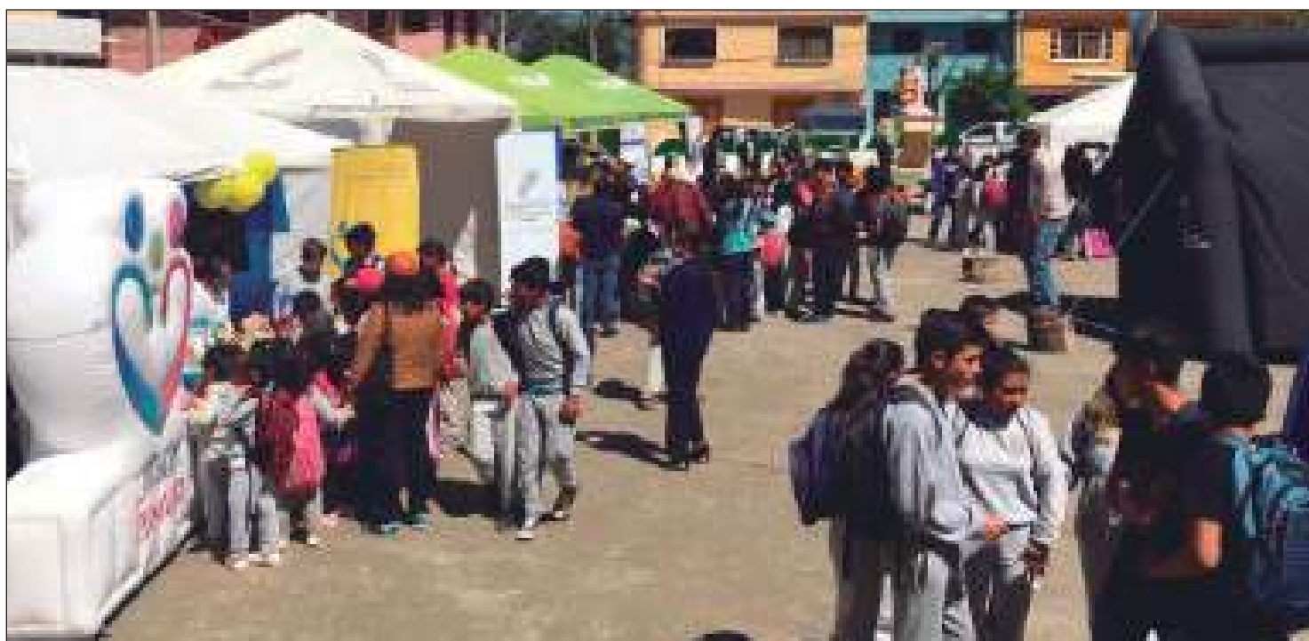
► Los asistentes fueron estudiantes y niños de las unidades educativas del sector.