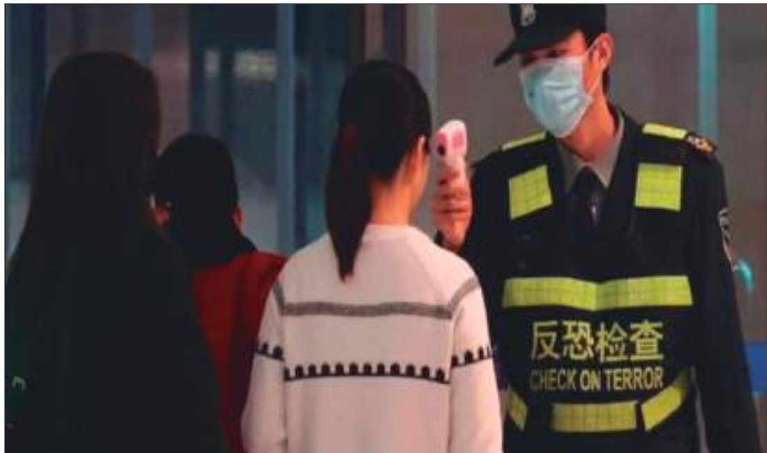
▶ En aeropuertos de todo el mundo se están realizando controles.

El Ministerio de Salud Pública (MSP) aclaró que el coronavirus no circula en el Ecuador y que la cartera de Estado ha adoptado medidas de prevención para evitar la migración del virus al país. El coronavirus (2019-nCoV) golpea a China, país donde ha provocado la muerte de 17 personas y 444 contagiados. Pero además se registran casos en Tailandia, Corea del Sur, Japón y EE.UU., que confirmó el martes último la presencia del virus en el país. El caso de EE.UU. se trata de un hombre que llegó el 15 de enero a Seattle tras recorrer la región china de Wuhan, donde fue detectada la enfermedad por primera vez.