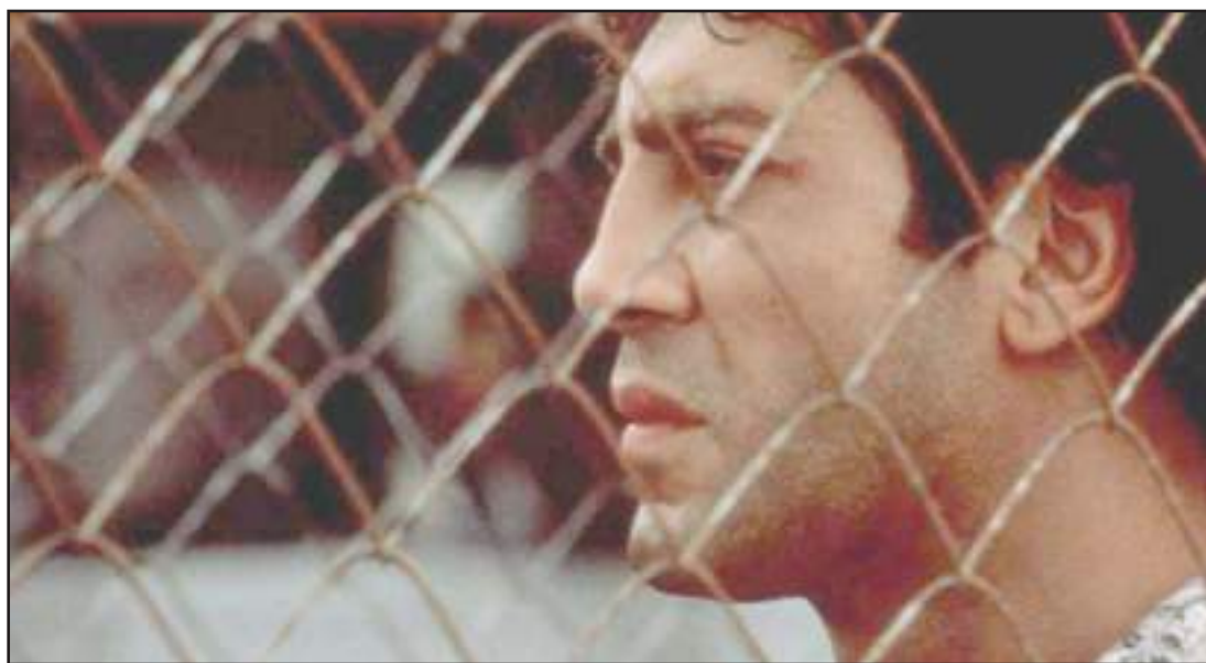
► Javier Bardem interpreta al escritor peruano Reinaldo Arenas en Before Night Falls.

El 75° aniversario de la liberación de Auschwitz será conmemorado en la quinta edición del ciclo de cine que exhibirá 13 películas en el Ochoymedio.