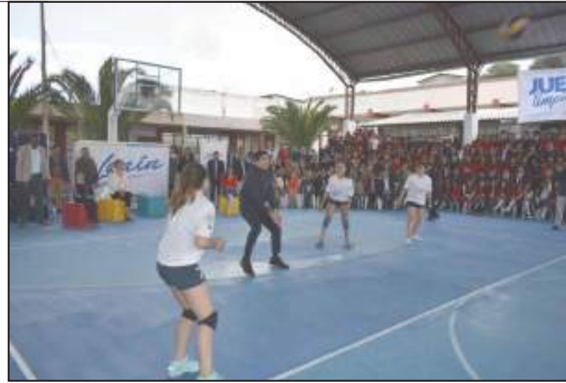
▶ Las estudiantes agradecieron al vicepresidente por haber sido parte de su equipo.

Dentro de la agenda que cumplió ayer el Vicepresidente de la República, Otto Sonnenholzner, en Chimborazo, estuvo la inauguración de la cancha que forma parte del proyecto "Juego Limpio 2030", construida en la Unidad Educativa Riobamba; evento que se desarrolló pasada las 14h00, en el que también participó la Secretaria del Deporte, Andrea Sotomayor.