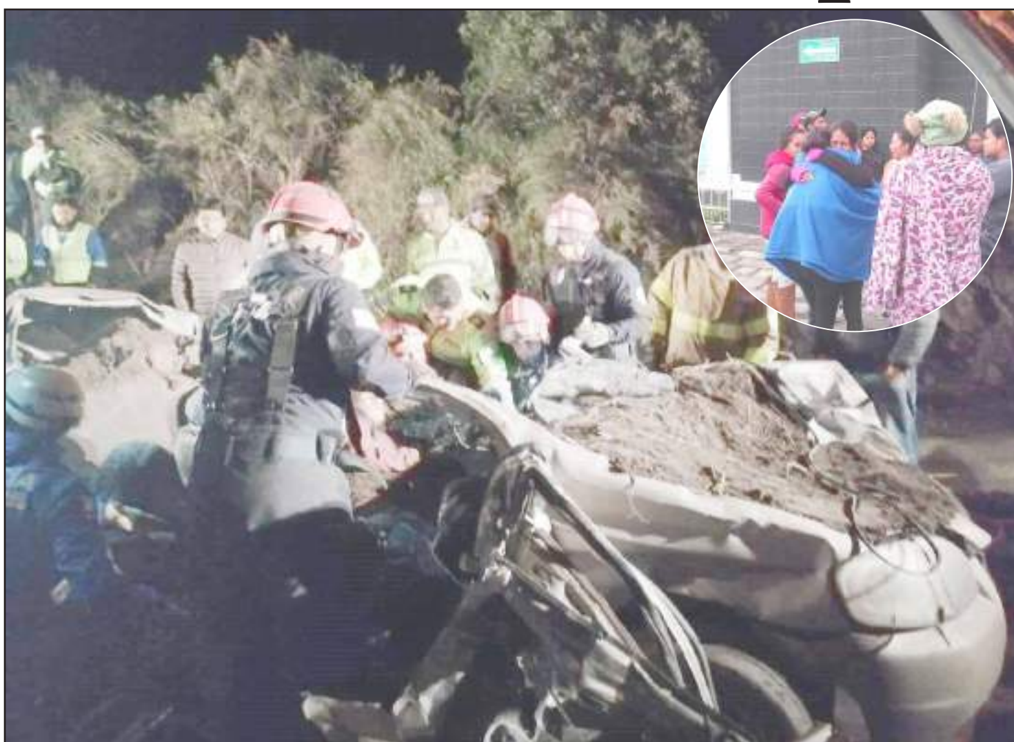
▶ El cuerpo de los cinco ocupantes fue rescatado, mientras los familiares lloraban desconsolados.