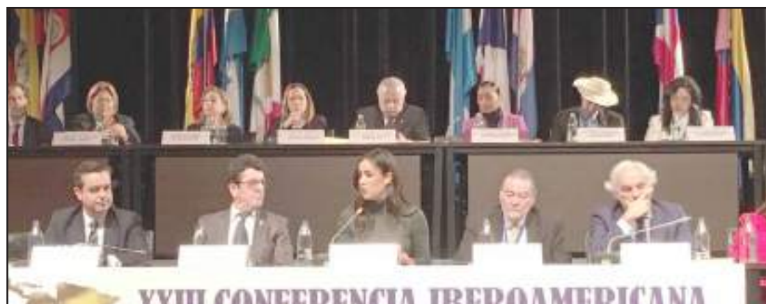
► La reunión que tuvo lugar en el Palacio Real de Madrid estuvo liderada por la ministra de Industria, Comercio y Turismo de España, Reyes Maroto, con el objetivo de establecer más vínculos turísticos con los países Iberoamericanos.