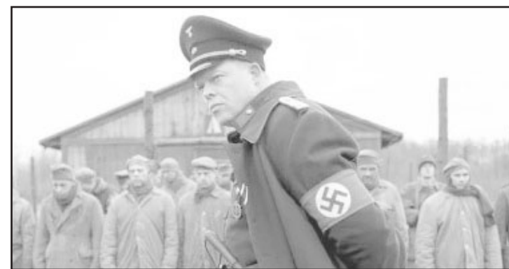
► Der Hauptmann inicia con un soldado desertor en el campo de batalla de la Segunda Guerra Mundial que encuentra un uniforme como salvación. Fotograma de Der Hauptmann

El odio racial ha tenido su representación en el cine de ficción de los últimos años. Desde la aclamada American History X (Tony Kaye, 1998) hasta This Is England (Shane Meadows, 2007) se han sucedido varios filmes de un tema que no pierde vigencia pese a que su punto más crítico fue el de los campos de concentración.