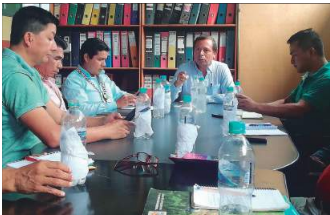
► Reunión de autoridades con la Comuna San Jacinto.