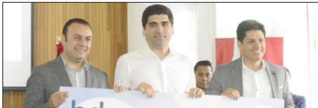
► El Municipio de Riobamba recibió 50 millones 790 mil dólares para el proyecto de la planta de tratamiento de aguas.