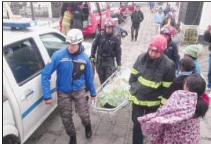
Los cadáveres llegaron con los rescatistas del GOE y del Cuerpo de Bomberos de Riobamba y Penipe.

Sin embargo, Tanqueño explicó que uno de sus yernos, quien los acompañó, se adelantó en el retorno a Riobamba y una vez que pasaron las horas, se preocupó porque no llegaban, por eso los fue a buscar