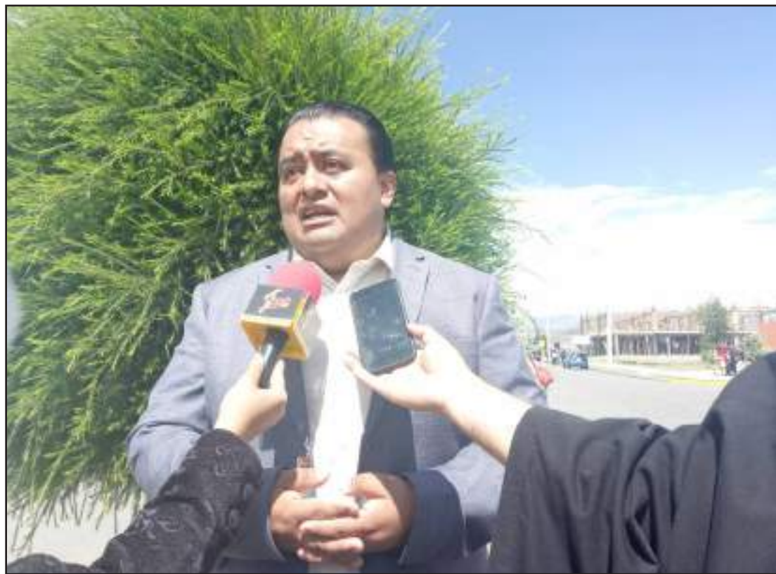
► Héctor Pulgar, director zonal del Ministerio de Salud Pública.