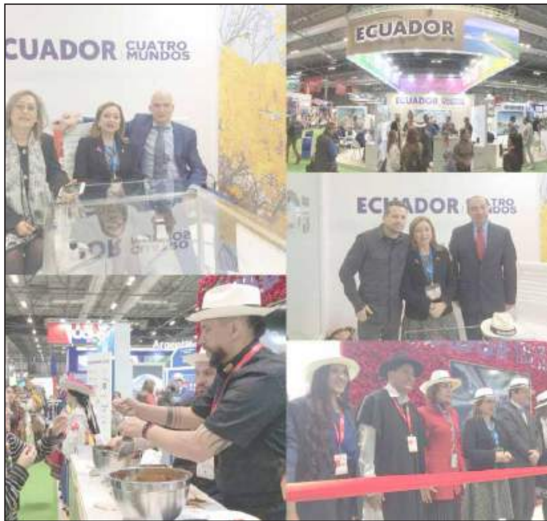
► La ministra de Turismo, Rosi Prado de Holguín inauguró este miércoles el stand de "Ecuador, cuatro mundos" en el marco de la Feria Internacional de Turismo Fitur 2020