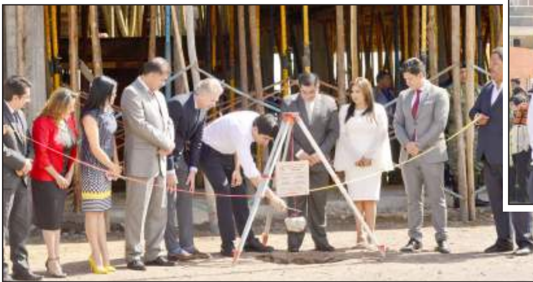
► El vicepresidente puso simbólicamente la primera piedra en las aulas de la Facultad de Salud.

El vicepresidente de la República, Otto Sonnenholzner, visitó Chimborazo para cumplir una agenda en distintos sectores de la provincia, para iniciar el recorrido estuvo presente en la Escuela Superior Politécnica de Chimborazo, en donde se hizo la presentación de la obra de la Facultad de Salud, que ya está ejecutando en esta institución.