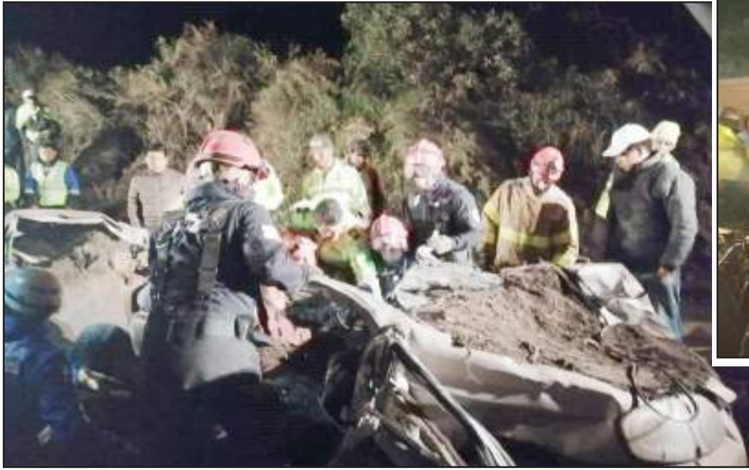
El rescate duró más de 8 horas.

Inmediatamente retiraron el volumen de tierra que atrapaba