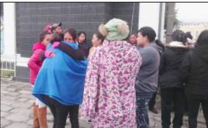
Familiares lamentaron la muerte de sus seres amados.

Cabe indicar que los trabajos de limpieza siguieron hasta la tarde de ayer, pero un nuevo deslizamiento de tierra complicó el trabajo. (25)