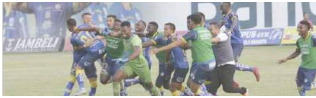
▶ Delfín jugará la Supercopa gracias a que ganó la final de la LigaPro.