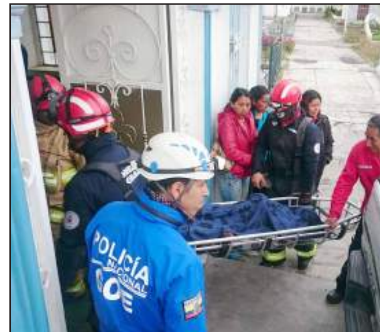
Los cadáveres ingresaron a la morgue de Riobamba para la necropsia.

llaba atrapado y por eso con los bomberos de Penipe y GOE, liberaron los cadáveres.