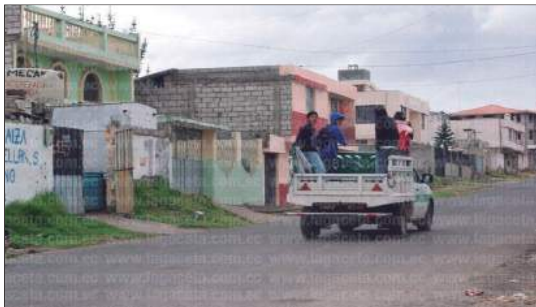
▶ Cientos de personas utilizan transporte comunitario.