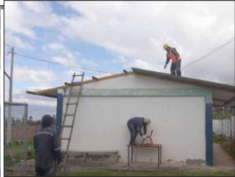
► Los locales en el cantón Chambo reciben mejoras.