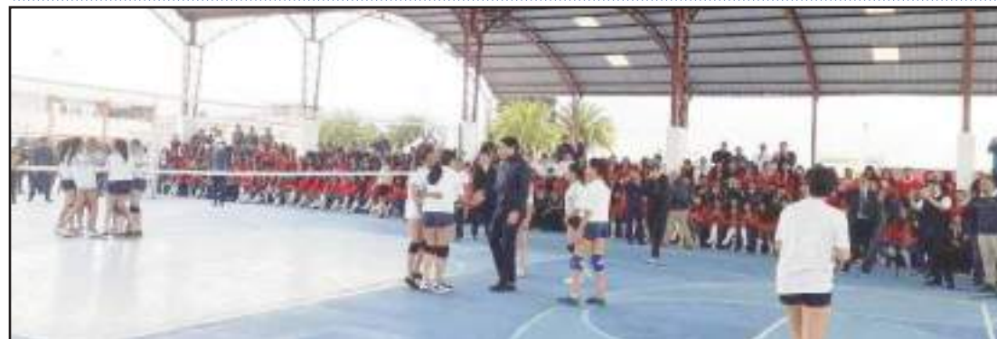
► En la Unidad Educativa Riobamba inauguró el proyecto Juego Limpio.