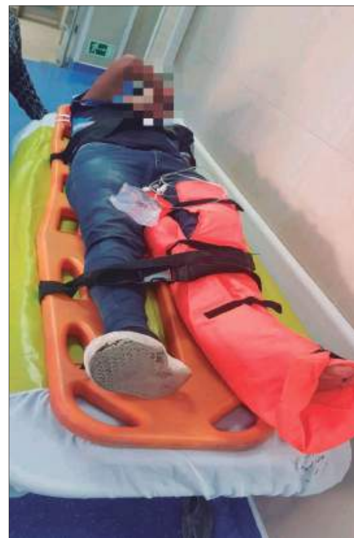
► El ciudadano fue trasladado a una casa de salud.

Al lugar llegó la unidad de salud para brindar los primeros auxilios al herido, para luego trasladarlo hasta el hospital a que reciba atención médica.