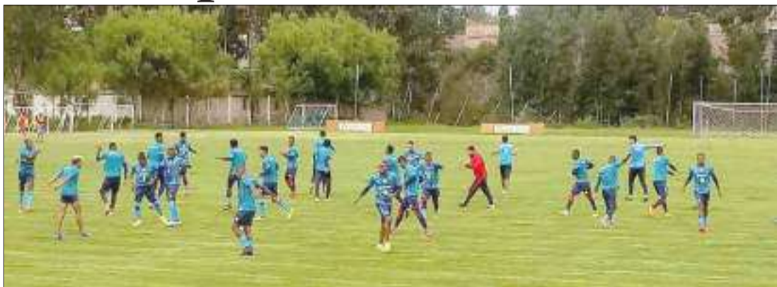
► Entrenamiento del equipo olmedino en esta semana.