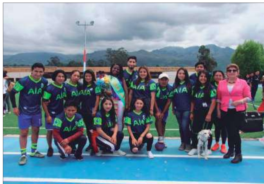
Alrededor de 7 equipos conformados por estudiantes participarán en las disciplinas.