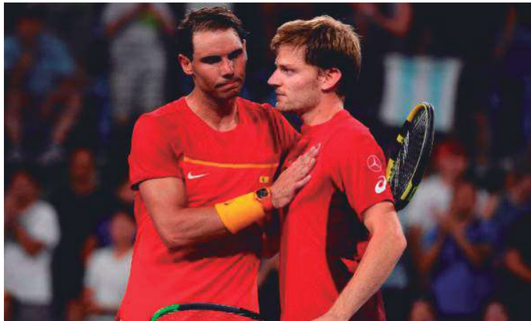
► Nadal felicita a Goffin tras el partido en Sydney.

A lo largo de su extensa trayectoria con el equipo español, Rafa también perdió cuatro partidos de dobles de