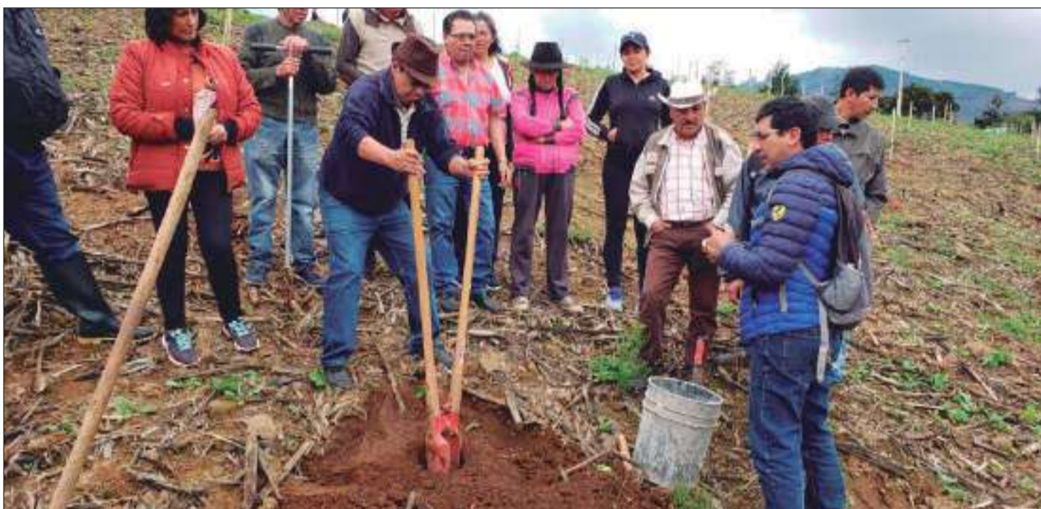
► La actividad tuvo la finalidad de realizar un análisis del contenido de nutrientes de sus predios.

Los celulares fueron puestos en custodia judicial.