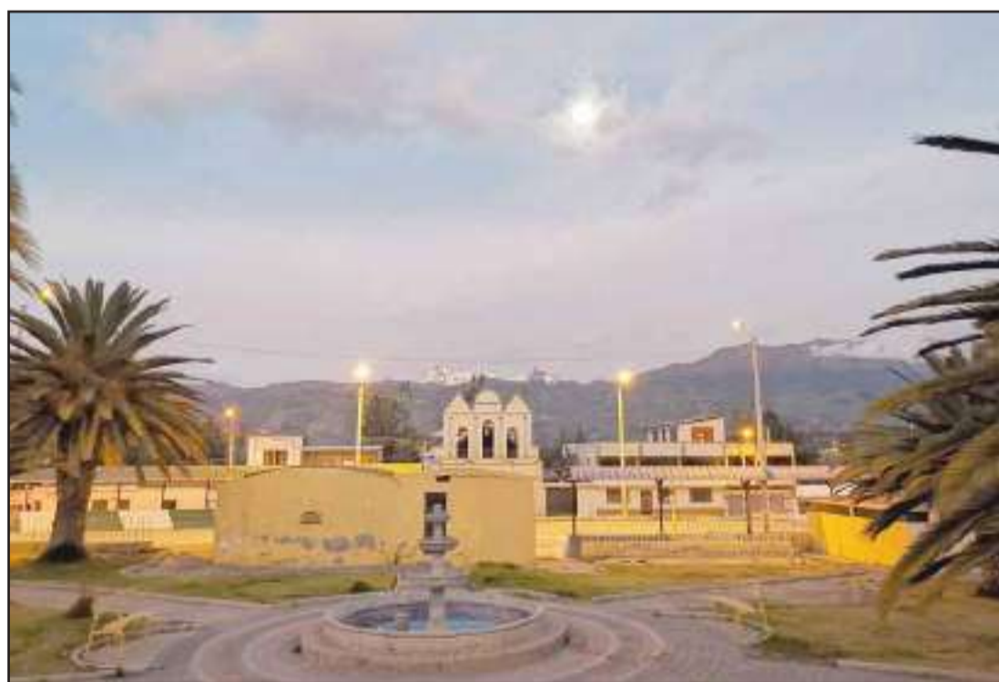
Parque central de la parroquia.