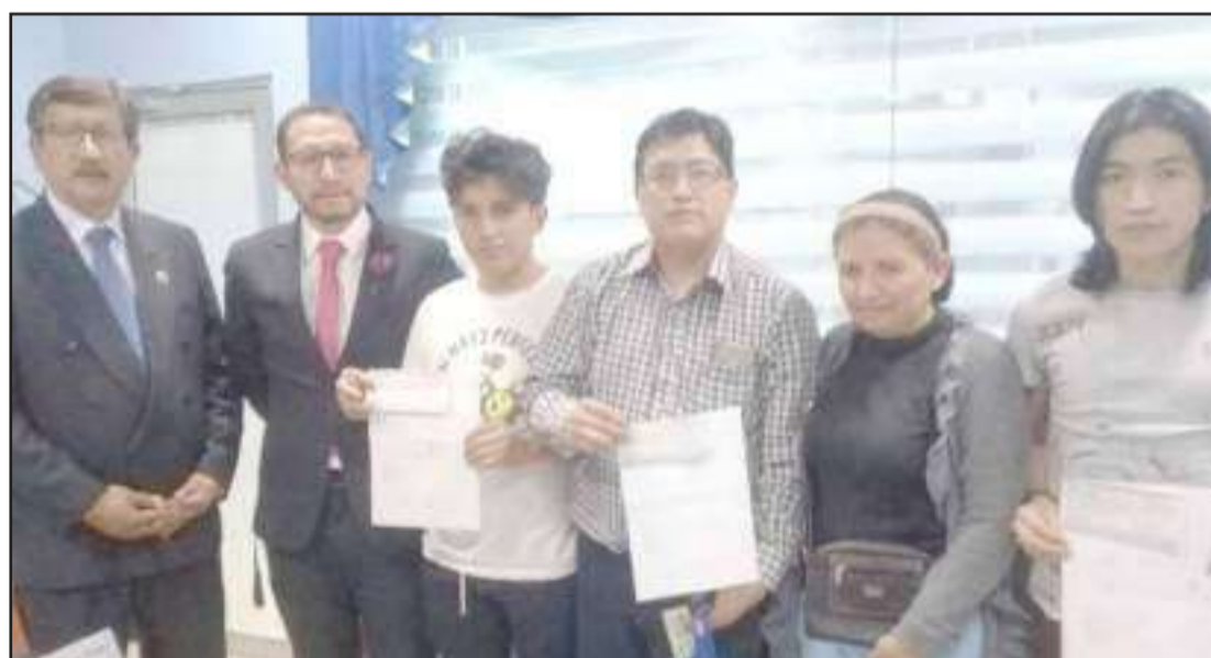
Los familiares del socio fallecido recibieron el apoyo económico.