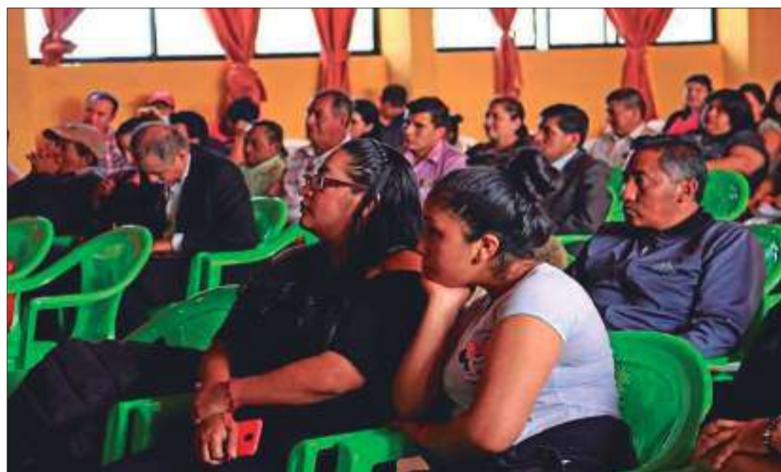
Los moradores realizaron propuestas y debatieron sobre las diferentes labores que están por ejecutarse.