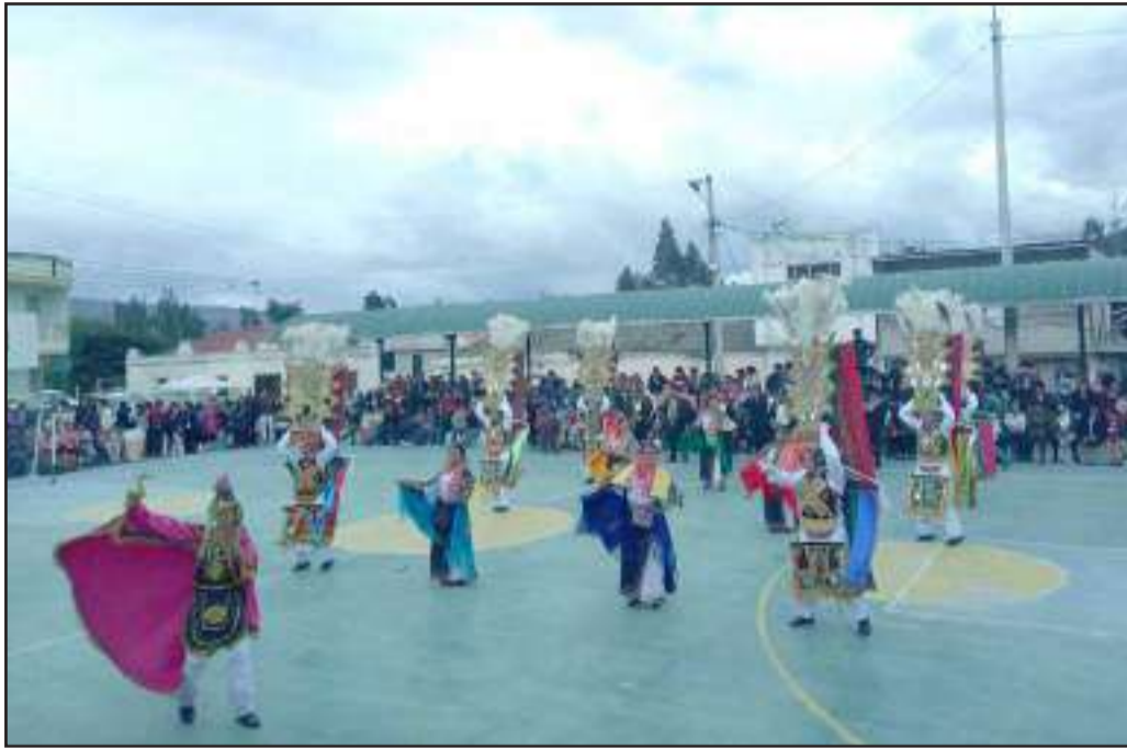
▶ Grupos de danza presentes en el pregón de fiestas de San Gerardo.

Agradeció por el apoyo que reciben por ejemplo de las parroquias Matus, San José de Chazo y La Providencia, tam-