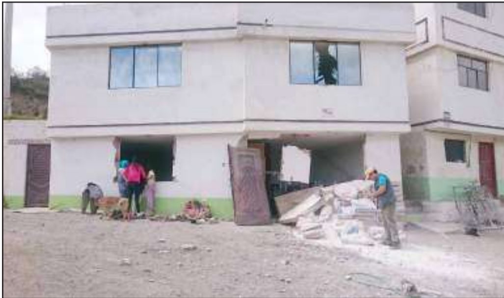
Los daños materiales fueron evidentes en el pequeño departamento.

Una fuga de gas doméstico generó una explosión dentro de un departamento, en donde un padre soltero vivía con sus cuatro hijos, tres de ellos resultaron con quemaduras de gravedad.