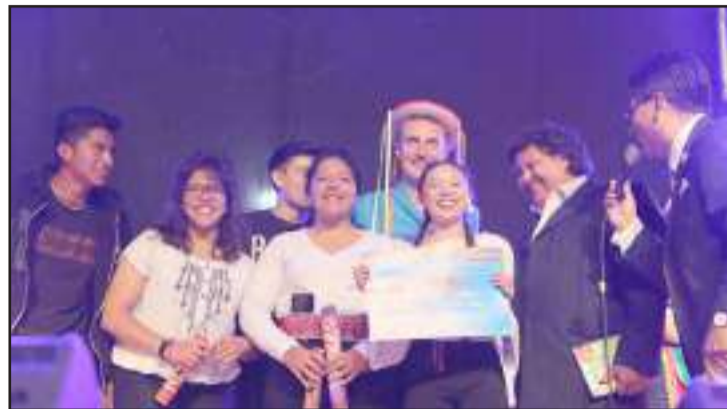
El concurso de coplas tiene premios económicos.