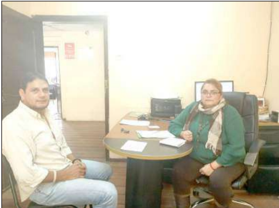
▶ Integrantes de la Asociación Chagra Chambeño preparan actividades.