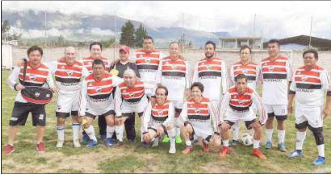
► Equipo del Colegio Maldonado que juega la final de la sub 50.

Luego de varias fechas, hoy llega a la parte final el Torneo de Fútbol 9, de los deportistas que pertenecen a las Bandas de Guerra de los exalumnos de los diferentes colegios de nuestra ciudad, en las categorías sub 40, sub 50 y Femenino.