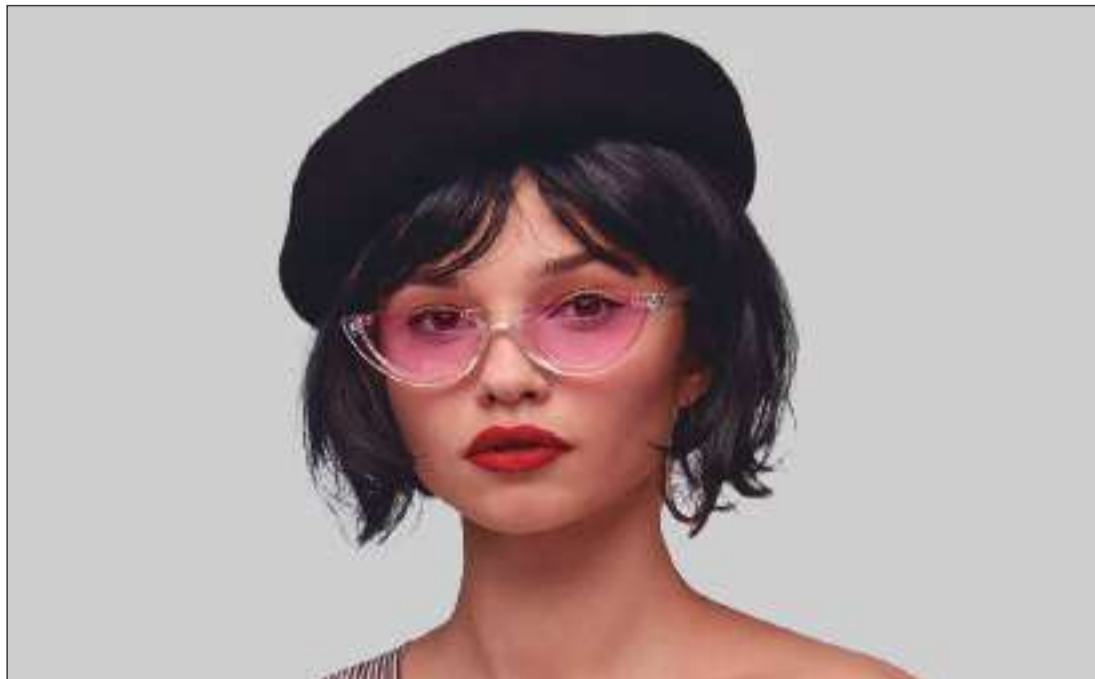
Las gafas de gran tamaño, estilo máscara, estarán de moda durante este año.

Los expertos aseguran que los materiales como el acetato o el nylon translúcido se pondrán de moda en cuanto a las monturas para el 2020. Estos materiales, en colores pastel o completamente transparentes, marcarán la tendencia para quienes usen lentes o gafas en este nuevo año.