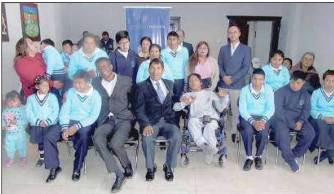
El Ministerio de Educación trabaja en la inclusión de todos los niños, niñas y jóvenes al sistema educativo nacional.