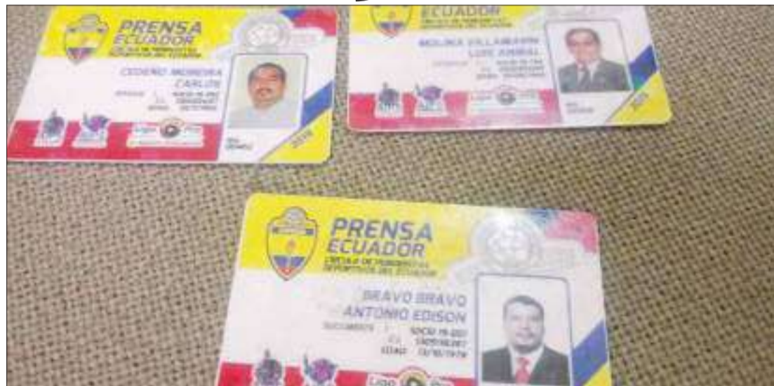
► Credenciales de La Liga Pro y del CPDE.