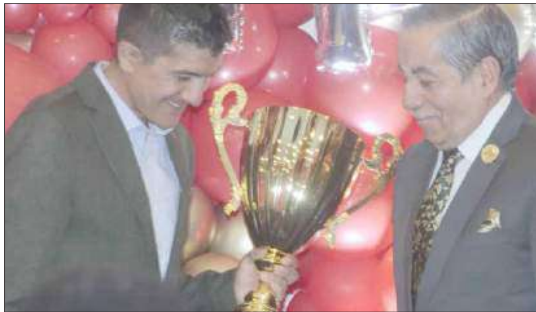
El ciclista Richard Carapaz, campeón del Giro de Italia, se mostró emocionado tras recibir el galardón como mejor deportista del año 2019 por parte de la APDP.