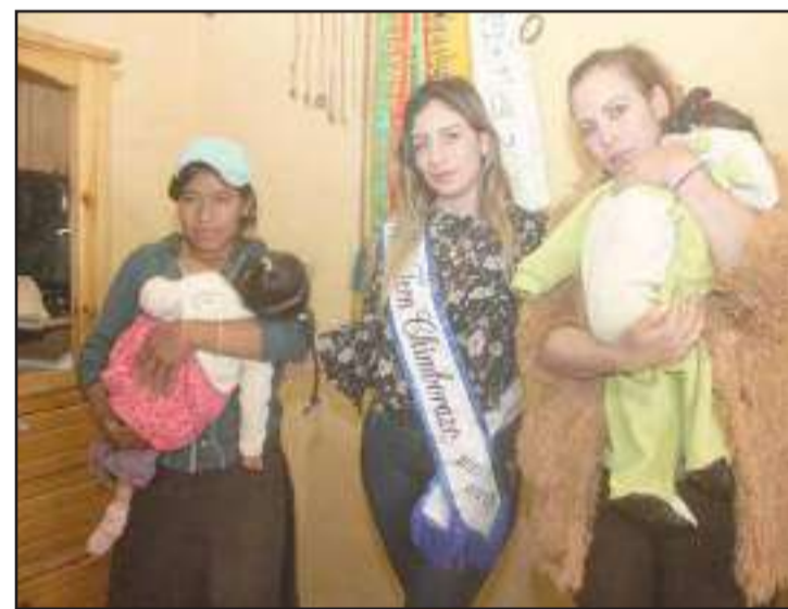
► Los niños (as) en condiciones de vulnerabilidad, una preocupación del Patronato Provincial.

de amigos voluntarios, incluso en el exterior; destacando los convenios con el MIES, “creo que es el momento de cambiar la historia de Chimborazo, porque estamos autoridades muy comprometidas, con mucha