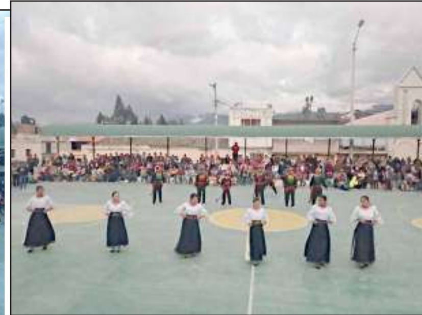
▶ Participantes en el pregón de fiestas en San Gerardo.

En cuanto a la regeneración urbana continúan con los trabajos y esperan contar con una parroquia muy bien atendida en su zona urbana. (09)