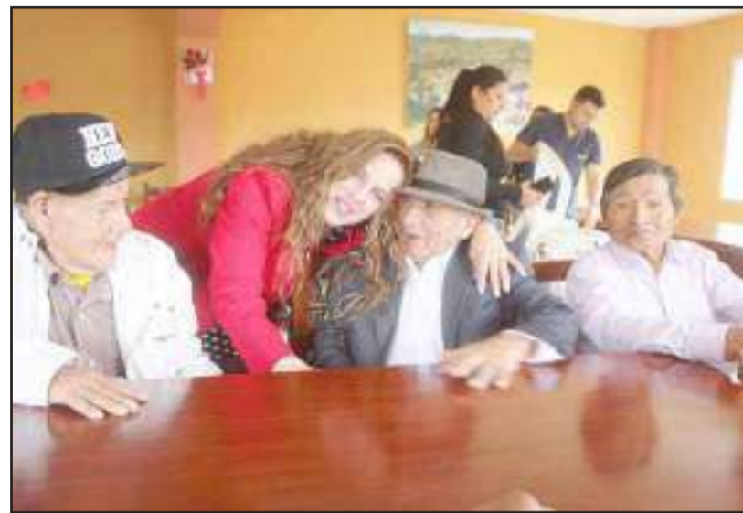
► La atención al sector del adulto mayor es una prioridad del Patronato Provincial.

Todas las acciones impulsadas mediante disposición de la Prefectura de Chimborazo, han sido con el presupuesto institucional y también con trabajo de autogestión, porque se ha “golpeado puertas” en otras entidades, organizaciones, colectivos de reinas cantonales y grupos