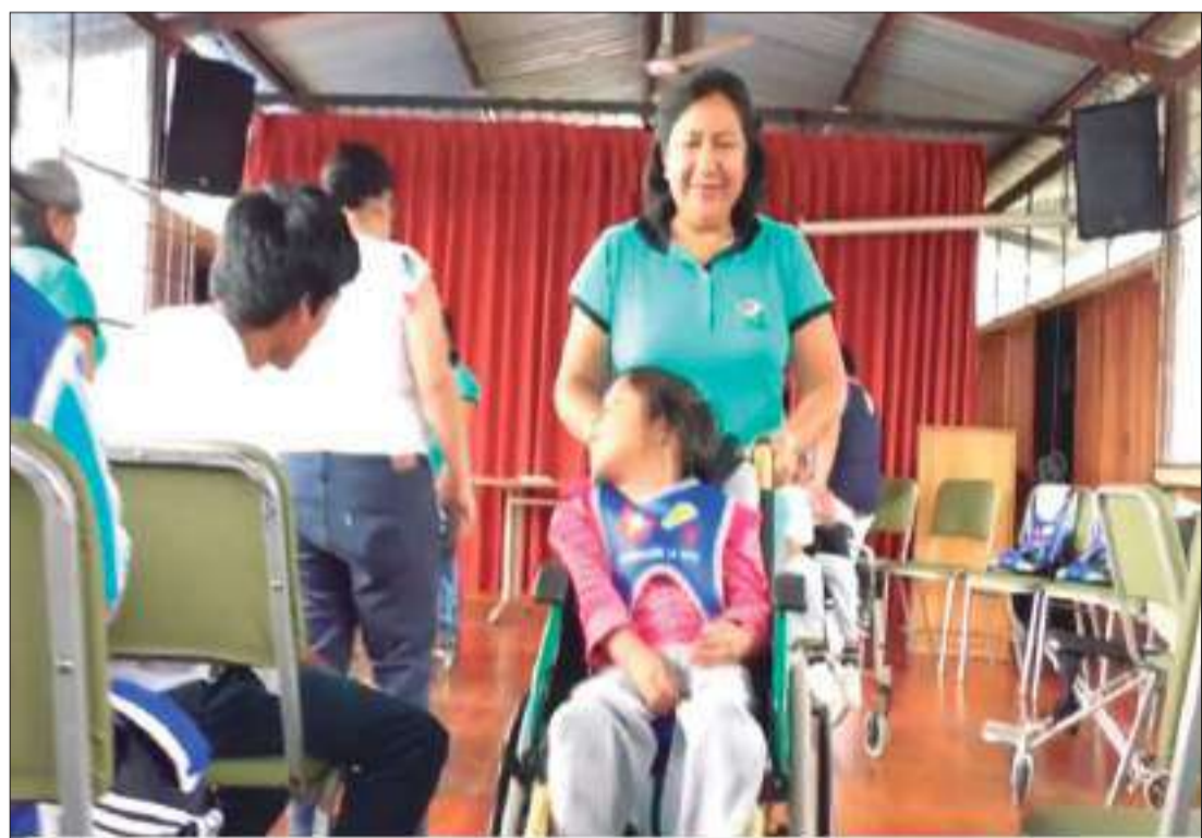
▶ Estudiantes de la Unidad Educativa Puyo.