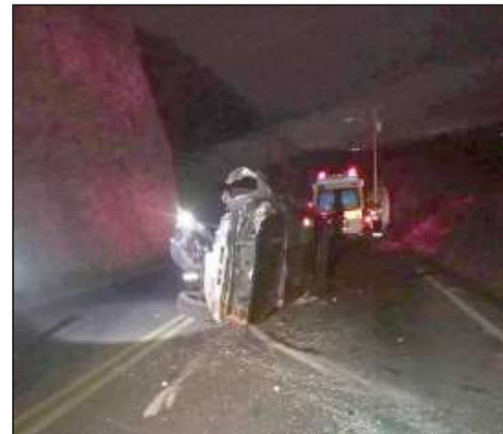
Las afectaciones fueron evidentes en el sitio.

Tras levantar datos del incidente, los agentes policiales retiraron el automotor y lo ingresaron a los patios de reten-