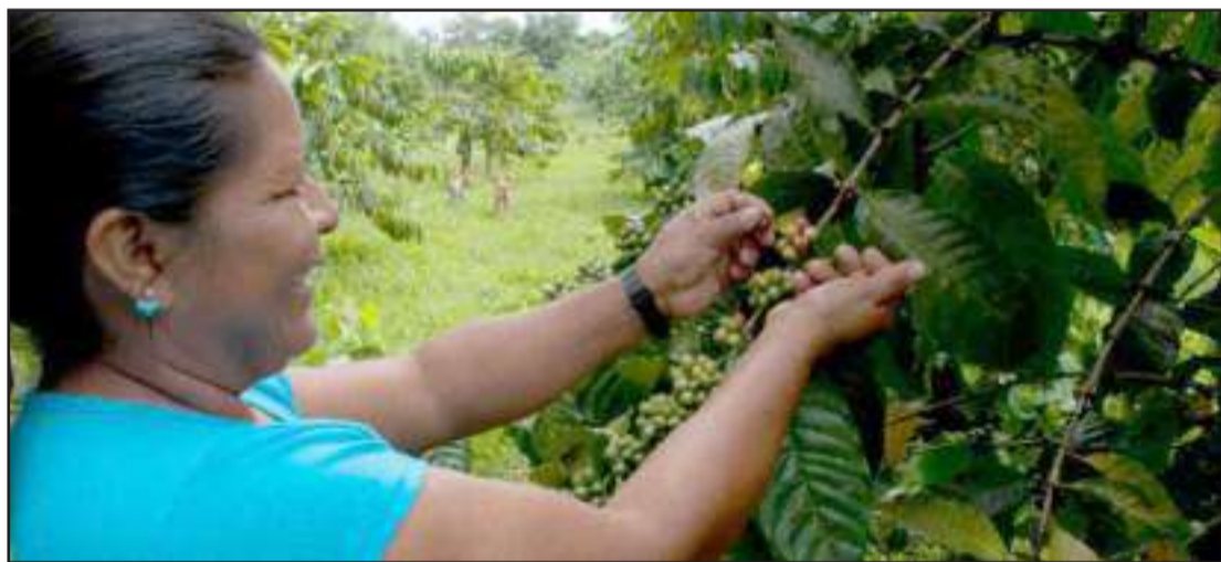
► Petroamazonas invierte en proyectos sociales en comunidades de la Amazonía y el Litoral.