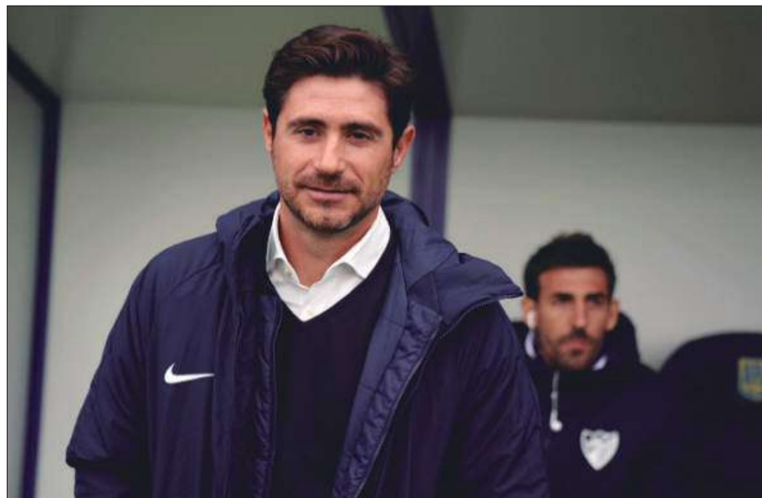
► Víctor Sánchez del Amo.