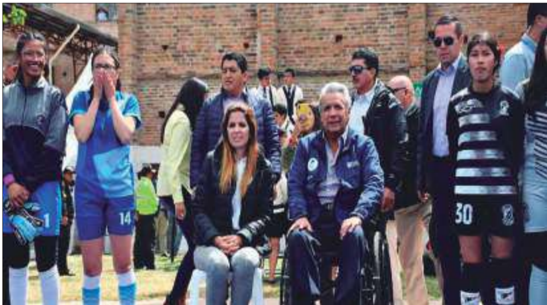
El presidente Lenín Moreno y la ministra de Deportes, Andrea Sotomayor, entregaron el colorido espacio deportivo al colegio Benigno Malo, en Cuenca.