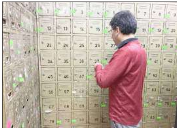
Tienen que actualizar la información de los casilleros.

Hasta el 31 de marzo será el plazo para renovar el canon de arrendamiento de los casilleros judiciales físicos, adjudicados a los abogados en libre ejercicio y de instituciones públicas y privadas de Chimborazo.