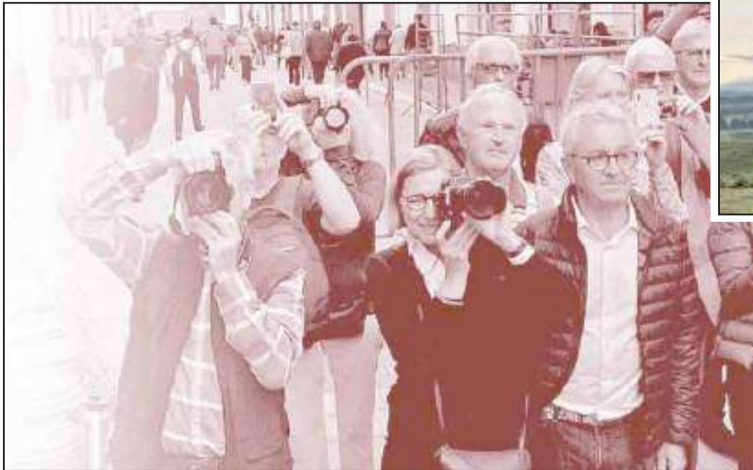
► El turismo apunta a ser la segunda fuente de ingresos no petroleros.

El Ministerio de Turismo trabaja para que desde 2021 el país perciba $ 2.195,8 millones anuales. Las Cámaras de Turismo consideran que la cifra se duplicaría con una mejor planificación. El turismo de aventura está en la mira.