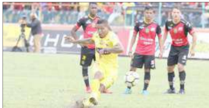
La demanda presentada es de más de ocho millones de dólares, pero Arroyo afirma que él no la presentó.

Arroyo afirma que no ha demandado a Barcelona, mediante un vídeo el centrocampista ecuatoriano dio su versión respecto al polémico tema.