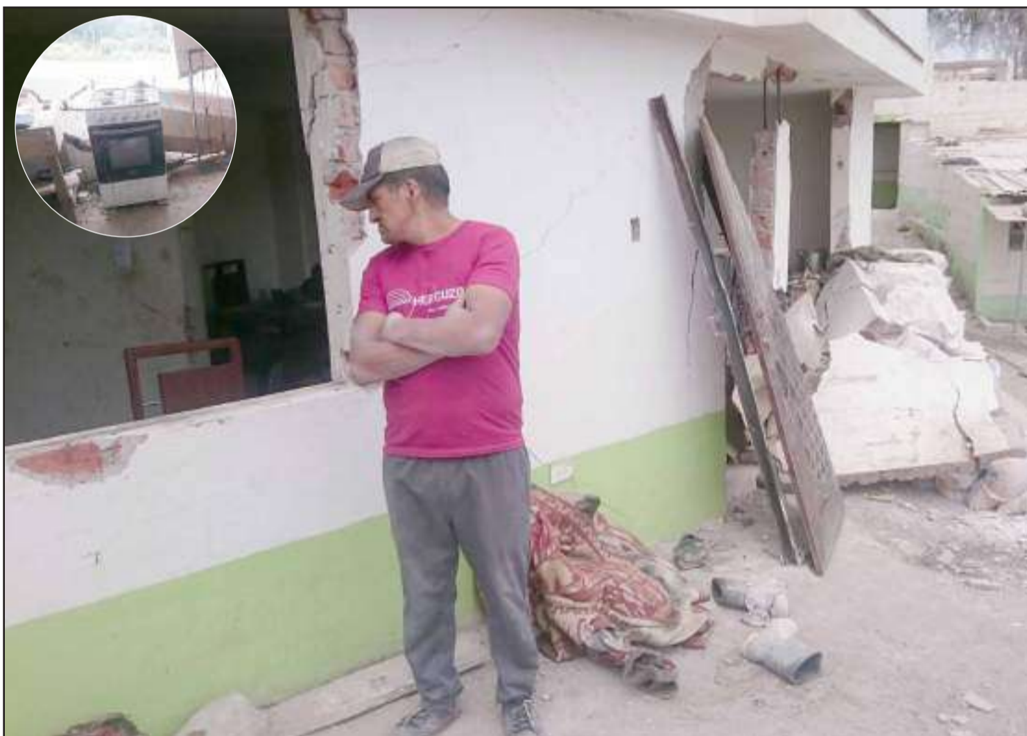
Los daños materiales fueron evidentes en el pequeño departamento.