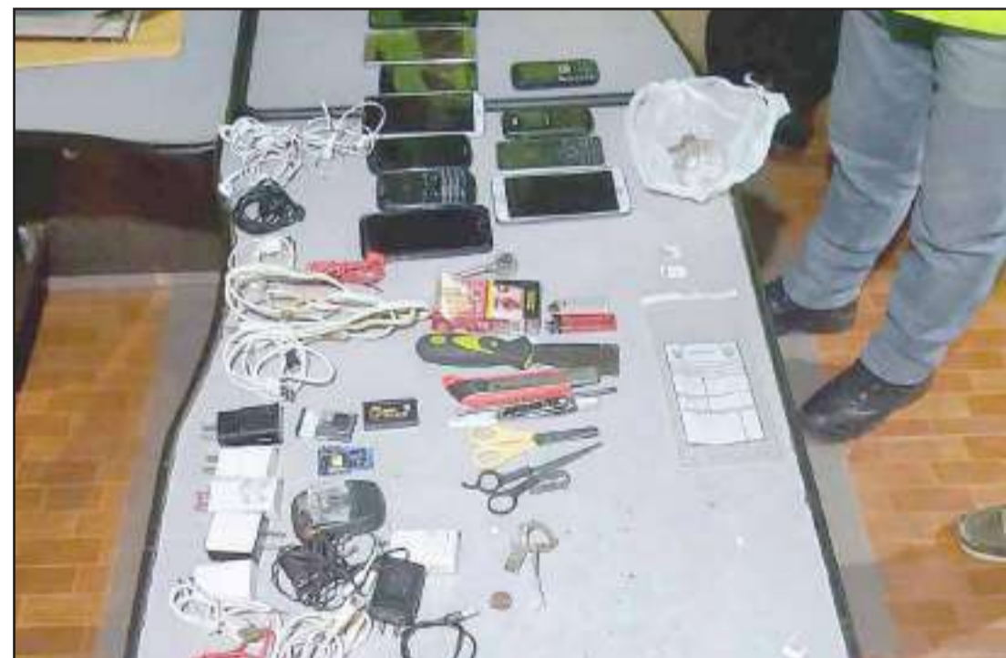
Los objetos fueron hallados por los agentes de la Policía Nacional.