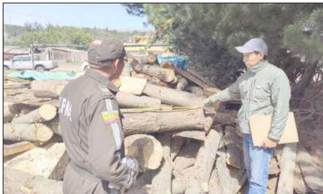
La madera fue decomisada por las autoridades.