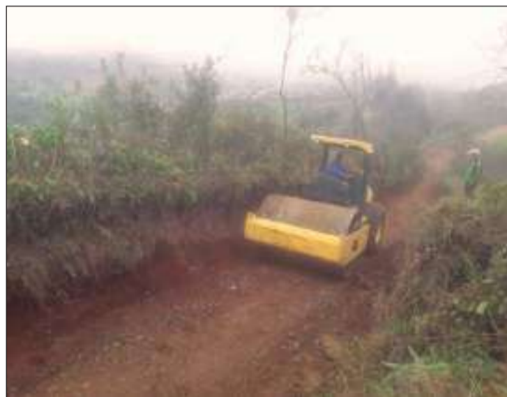
► Iniciaron los trabajos de mantenimiento y bacheo.