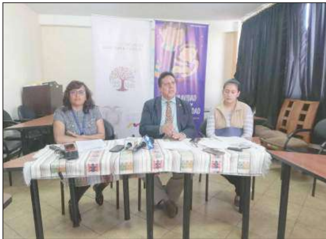
► El MIES mantiene 7 convenios de cooperación con gobiernos locales de Chimborazo.