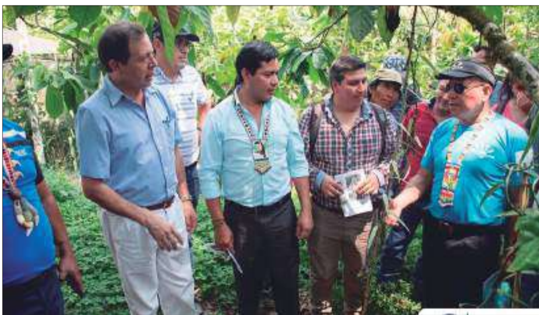
► Prefecto Jaime Guevara y autoridades locales recorren instalaciones de Vainilla.