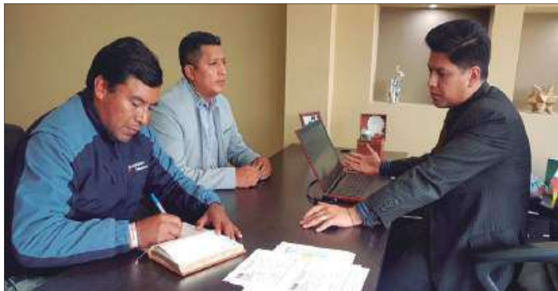
En la reunión se conoció el proceso en la que se encuentran los créditos para las parroquias de Chimborazo.