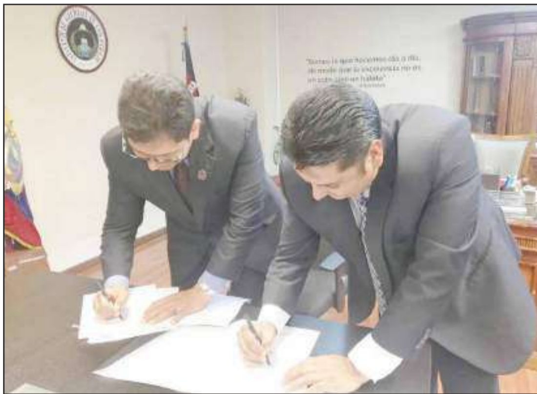
► Autoridades de las dos instituciones participaron de la firma del convenio.