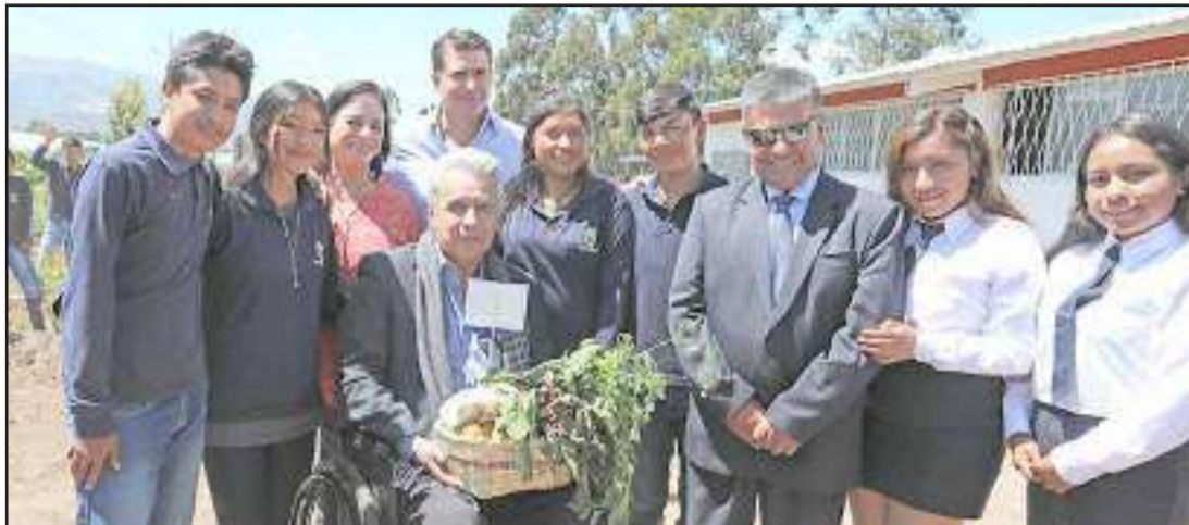
▶ A los estudiantes les dijo que ellos serán quienes impulsen la soberanía alimentaria de Ecuador.

El presidente de la República, Lenin Moreno y los ministros de Educación y Agricultura y Ganadería presentaron el nuevo modelo de autogestión de las Unidades Educativas de Producción, para promover el fortalecimiento de colegios agropecuarios autosostenibles y posicionar y revalorizar la Educación Técnica, con la participación de las y los jóvenes rurales. El evento se desarrolló en la Unidad Educativa Cayambe, la mañana de este miércoles 8 de enero.