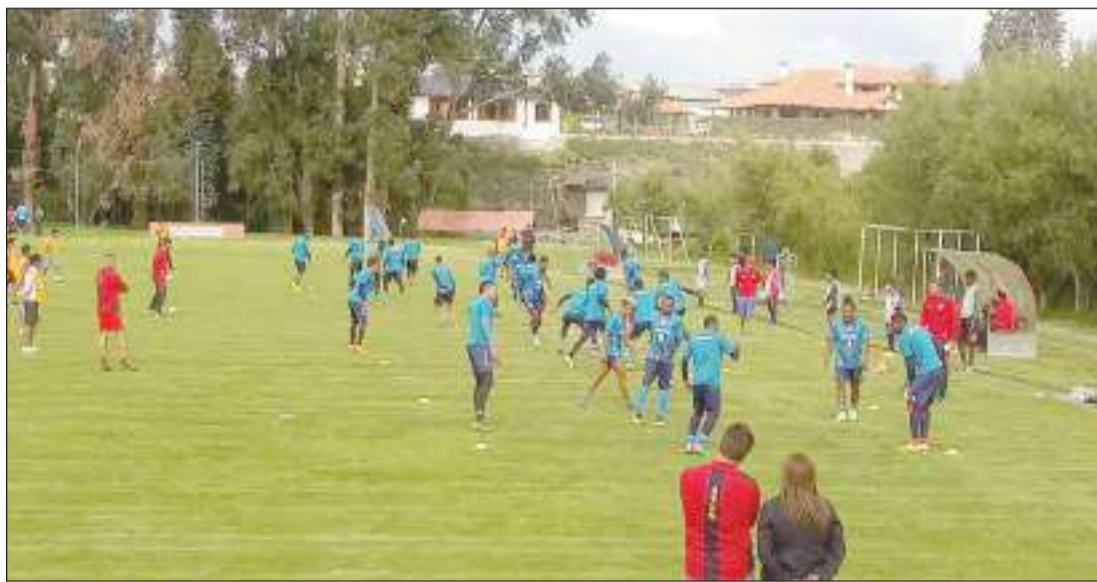
► Entrenamiento del equipo olmedino 2020.

Un buen detalle fue la presencia de la banda de música del Municipio de Riobamba, quienes llegaron en el bus del Olmedo y alegraron la fiesta de presentación y fotos con los hinchas que estuvieron en el Complejo Deportivo del Ídolo.