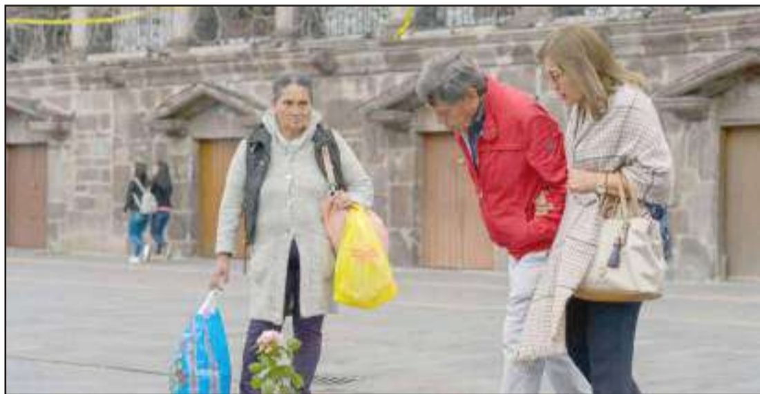
▶ Un grupo de niños dejó una flor en la acera de la Plaza de la Independencia, donde suele haber plantones.