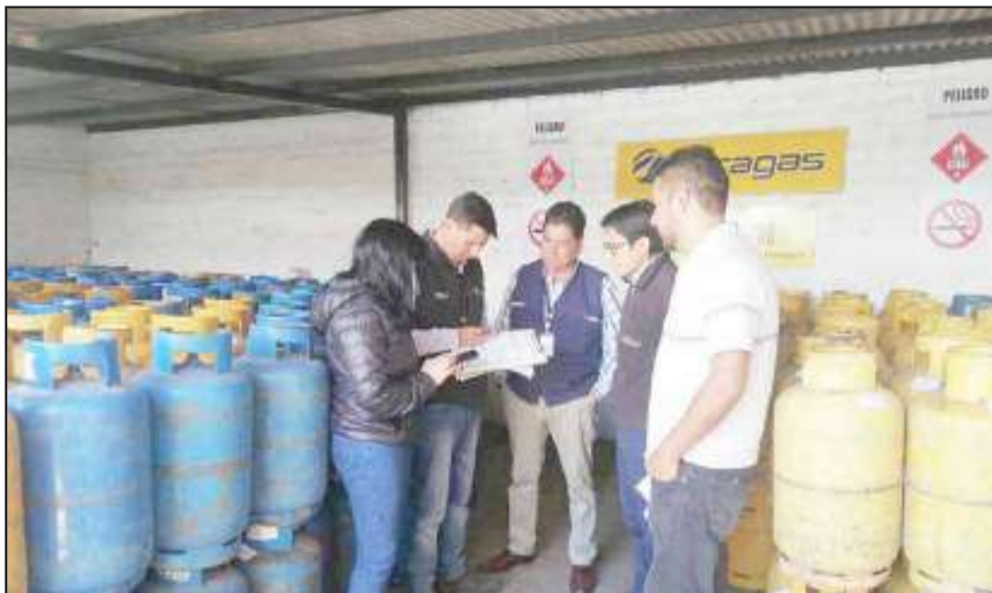
Las inspecciones a las gasolineras y a los centros de acopio han sido constantes.

En cambio, Guerrero citó que en la vista a otro lugar se