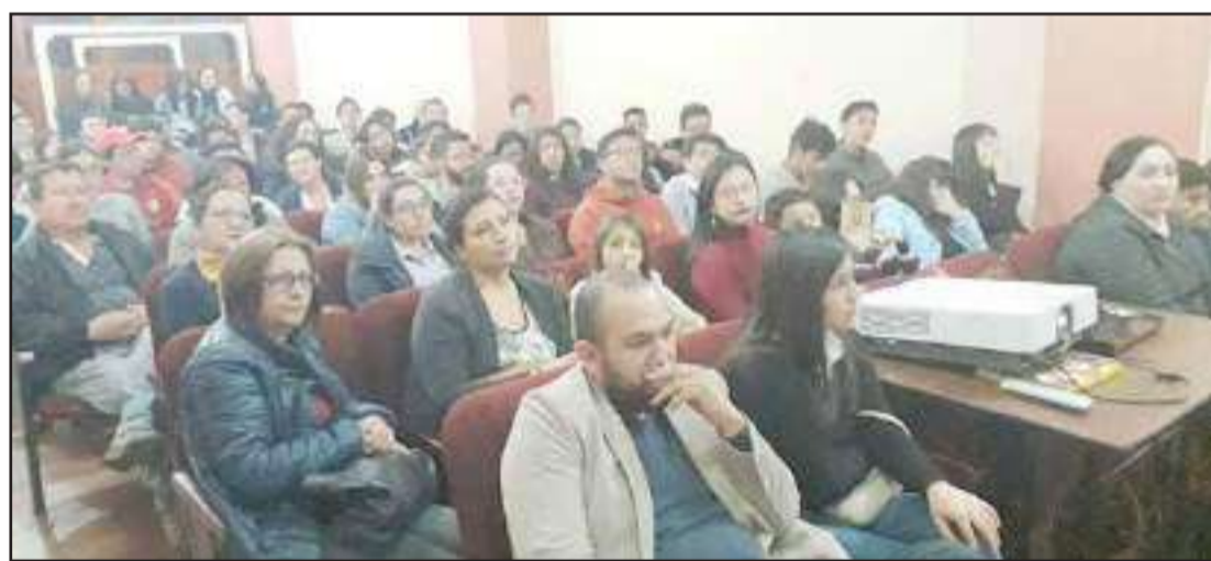
► Decenas de personas se dieron cita a la sala César Naveda de la Casa de la Cultura para observar la cinta.