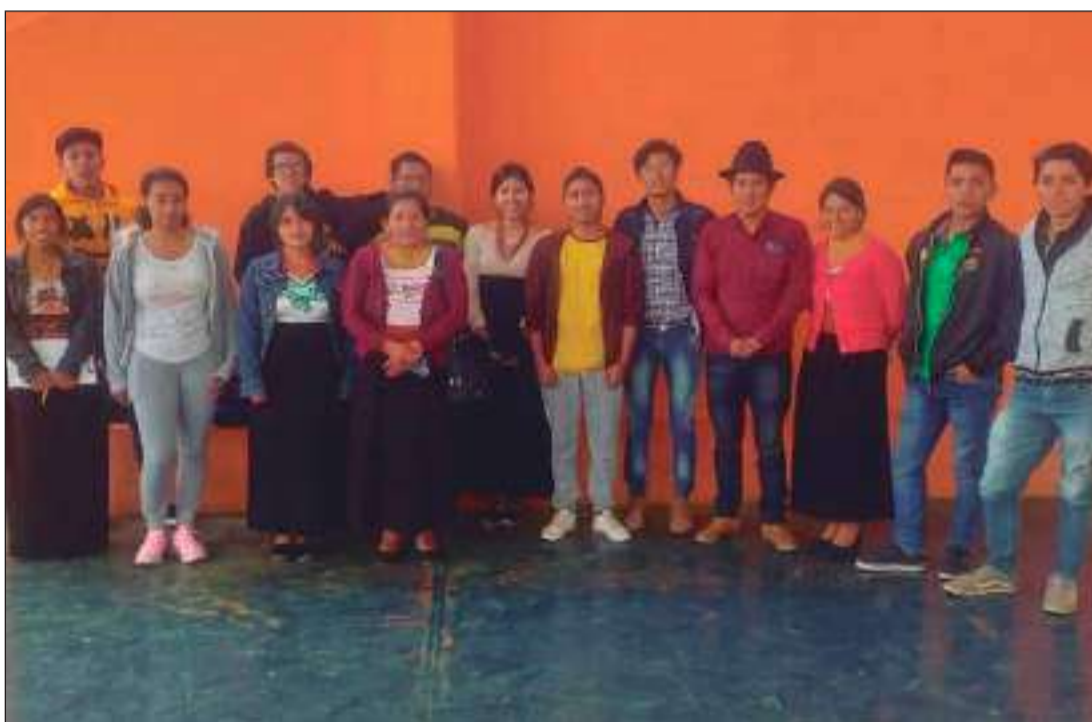
► Más de 30 jóvenes asistieron al conversatorio de liderazgo