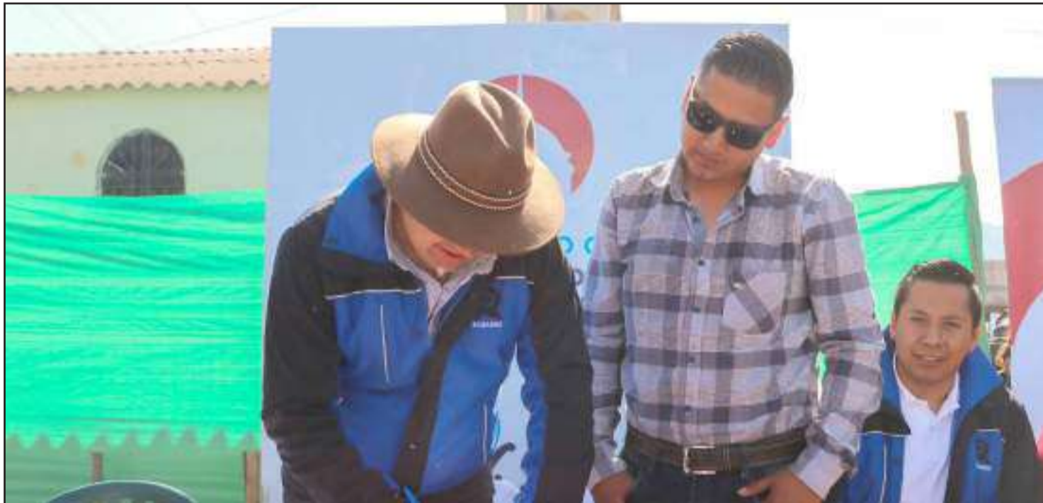
► El contrato fue suscrito por el Alcalde para construir esta obra en la comunidad.