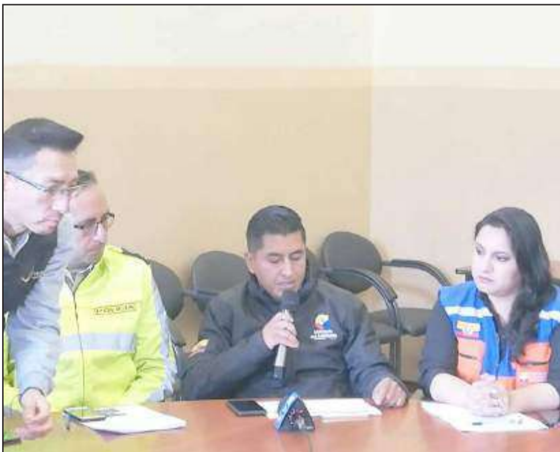
► Varias actividades tienen planificadas luego de evaluar este año de trabajo