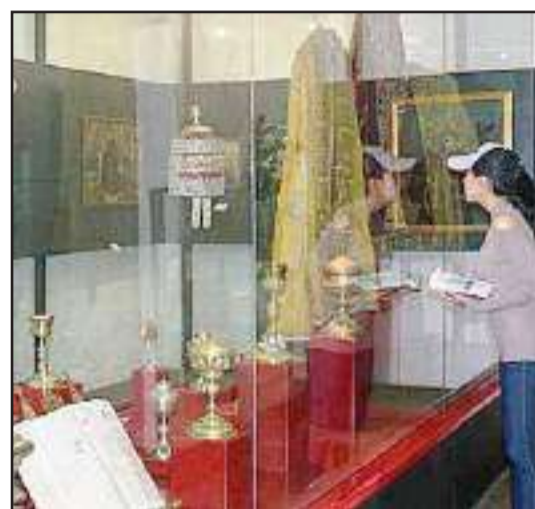
► Los muros exteriores de dimensiones altas protegen la privacidad de la vida conventual.