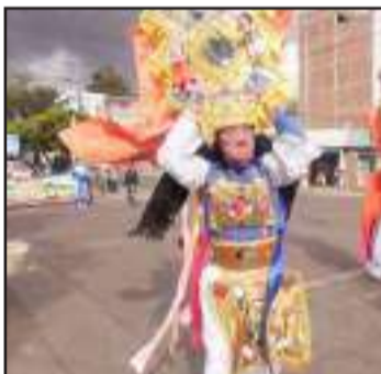
► Pases del Niño