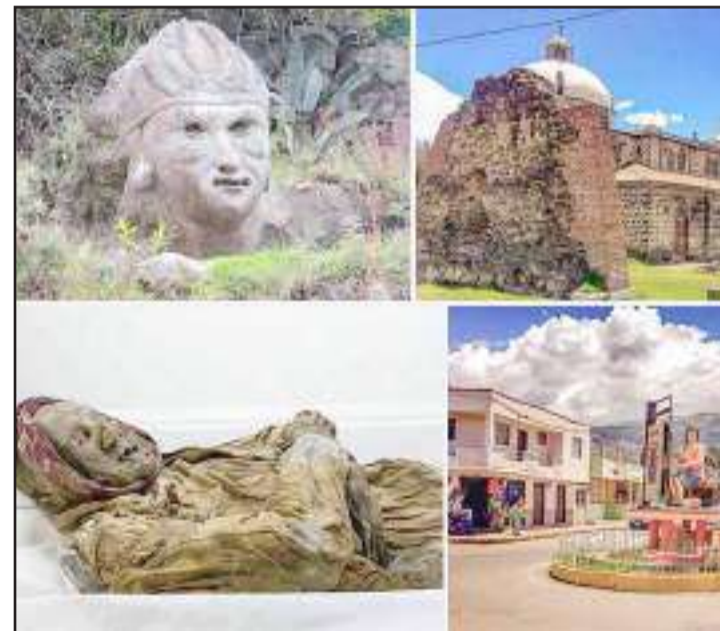
► Atractivos turísticos del cantón Guano, capital artesanal y turística del Ecuador.

Hoy por hoy Guano es reconocido por sus atractivos turísticos, como por ejemplo: Zoológico de Guano, donde se puede observar la fauna, promueven la conservación sobre todo concientizando en animales en peligro de extinción, sirve como refugio de animales que han sido recuperados producto del tráfico de animal; Laguna valle hermoso, un atractivo natural donde la hermosa vegetación que se encuentra cerca del lago, los impresionantes pinos que se encuentran alrededor dan un realce al paisaje; Museo de la Momia, un espacio donde