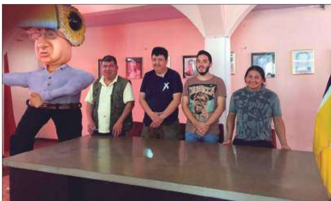
► Grupo Los escultores ganadores del primer lugar del concurso de años viejos

ha organizado y él mismo ha ganado el certamen.