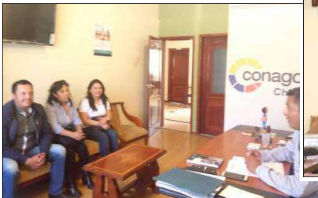
▶ Autoridades de la parroquia Sevilla con el presidente de Conagopare.

La ayuda es con procesos de capacitación y estudios para obras