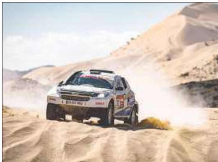
► La quinta etapa logró completar el equipo ecuatoriano.

La Quinta etapa recorrió la parte central de Arabia Saudita con un recorrido de 563 kilómetros, 353 de tramo especial. La jornada estuvo marcada por mayor presencia de arena en relación a las otras etapas