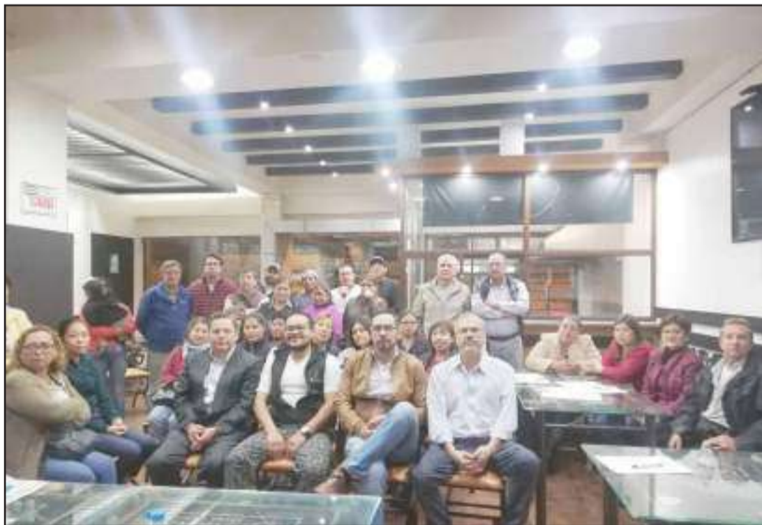
► Los comerciantes y moradores del sector de la Calle José Veloz, se reunieron para hablar de las afectaciones en sus negocios.

gañados y sorprendidos, por esa razón han establecido reunirse con el Alcalde, para que esta medida sea analizada de manera técnica.