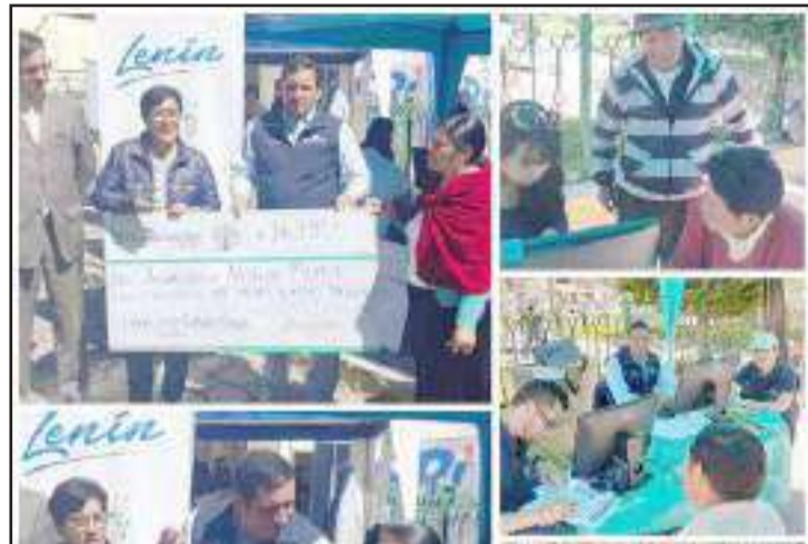
► Gerente de BanEcuador-Riobamba junto a la Gobernadora de Chimborazo.