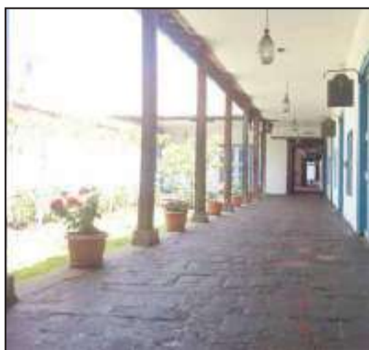
► Vista interior de una de las salas del museo de arte religioso.