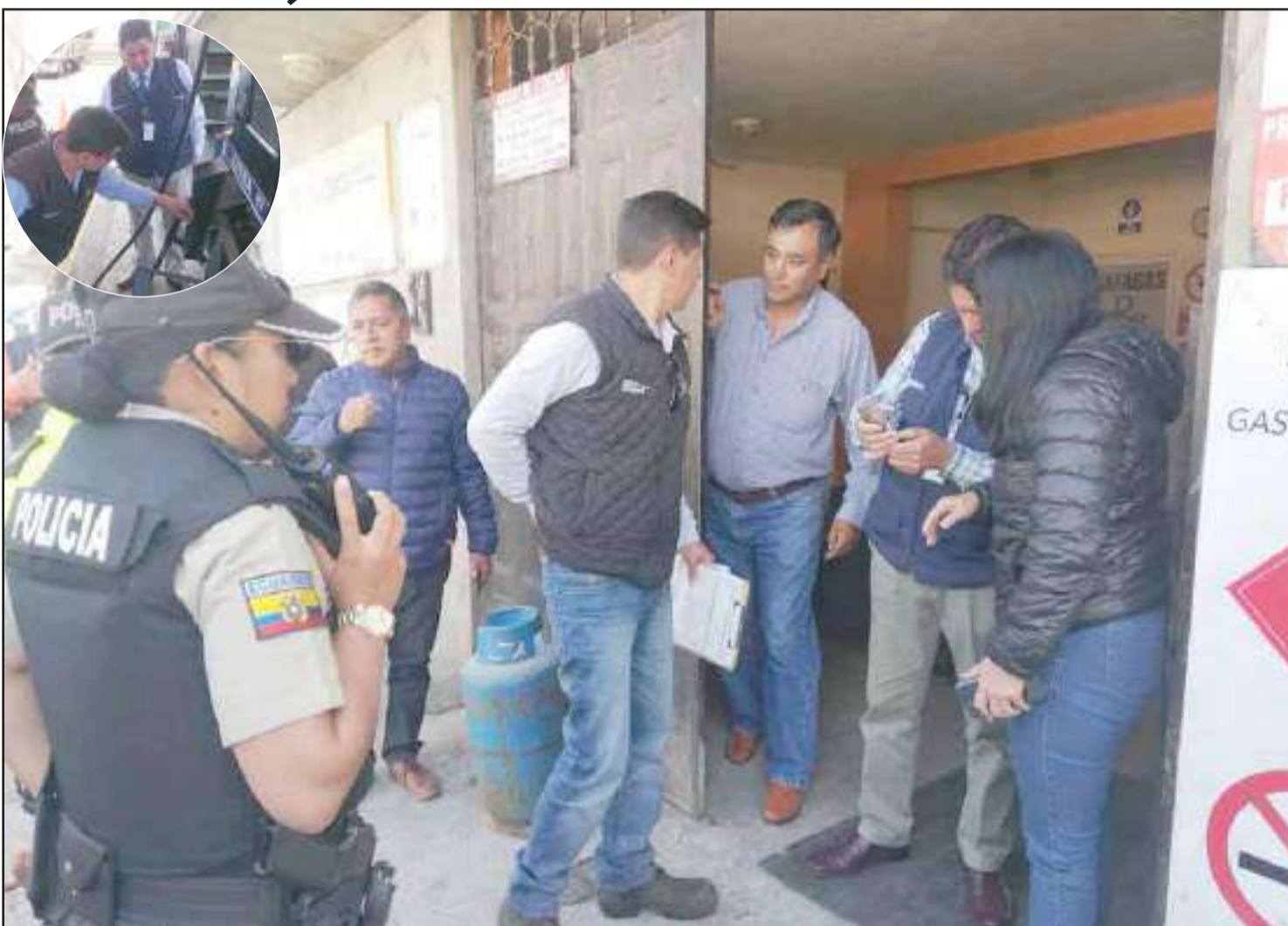
Las inspecciones a las gasolineras y a los centros de acopio han sido constantes.