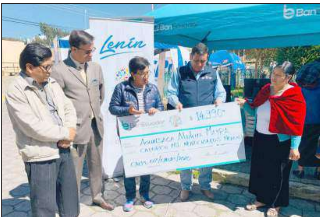
En las brigadas se entregaron montos crediticios por parte de BanEcuador.