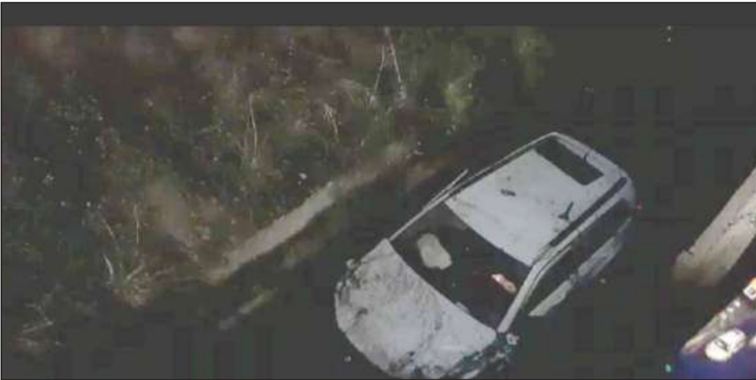
Las autoridades de la SNGRE coordinaron la asistencia humanitaria en las zonas afectadas en Flores.