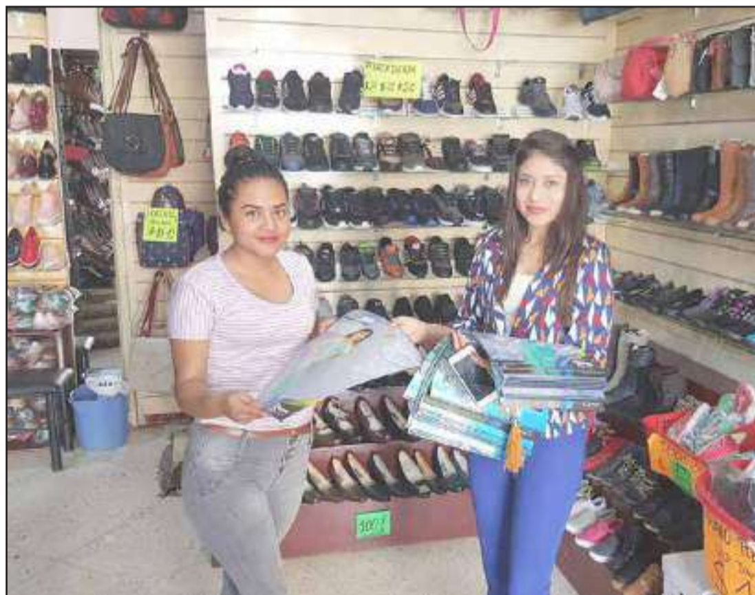
Los calendarios entregó en varios establecimientos comerciales.