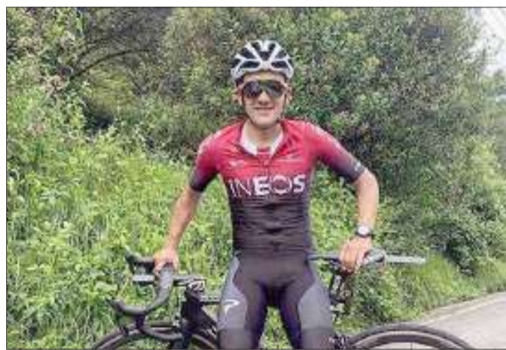
▶ El ecuatoriano firmó con Ineos por tres temporadas

El campeón del Giro de Italia iniciará calendario con su nuevo equipo en suelo americano. Esto se confirmó por la organización del Tour Colombia, evento que anunció a Richard Carapaz para la prueba que se correrá del 11 al 16 de febrero.