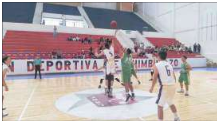
▶ Cada equipo deberá jugar tres partidos durante el fin de semana.

Los equipos chimboracenses jugarán este fin de semana en Ambato que será sede del Grupo 1, esperan seguir sumando puntos para escalar posiciones en la tabla general.