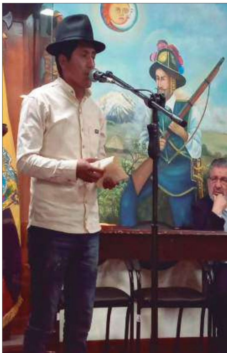
Premiación al primer lugar con el tema "Saguani", de la comunidad de Tolapungo.