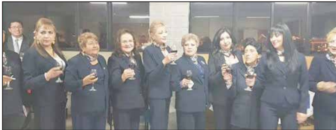
▶ Damas chimboracenses que conforman la Asociación de Escritoras del Ecuador- Matriz Chimborazo.