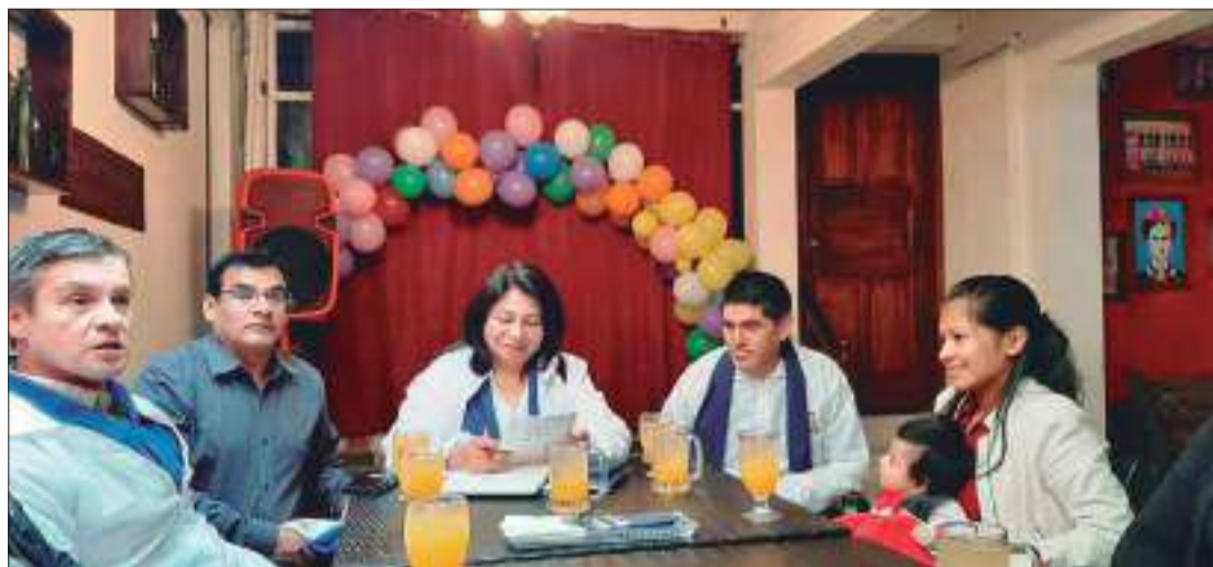
Las propuestas fueron presentadas.