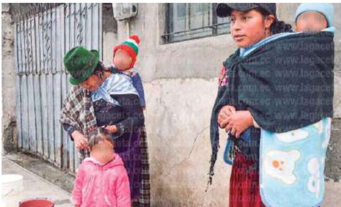
► La comunidad vive aún algunos problemas de identidad.

“A veces a los indígenas nos juzgan porque dicen que hemos perdido nuestra esencia,