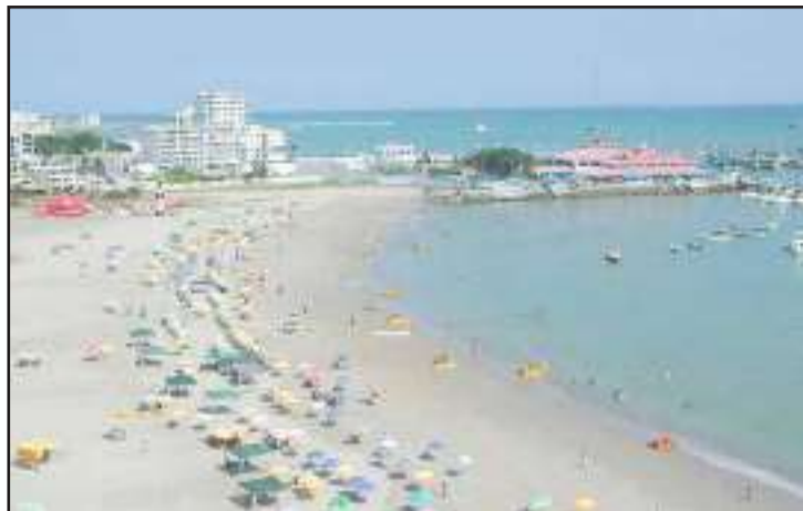
Este 2020 habrá 9 feriados.