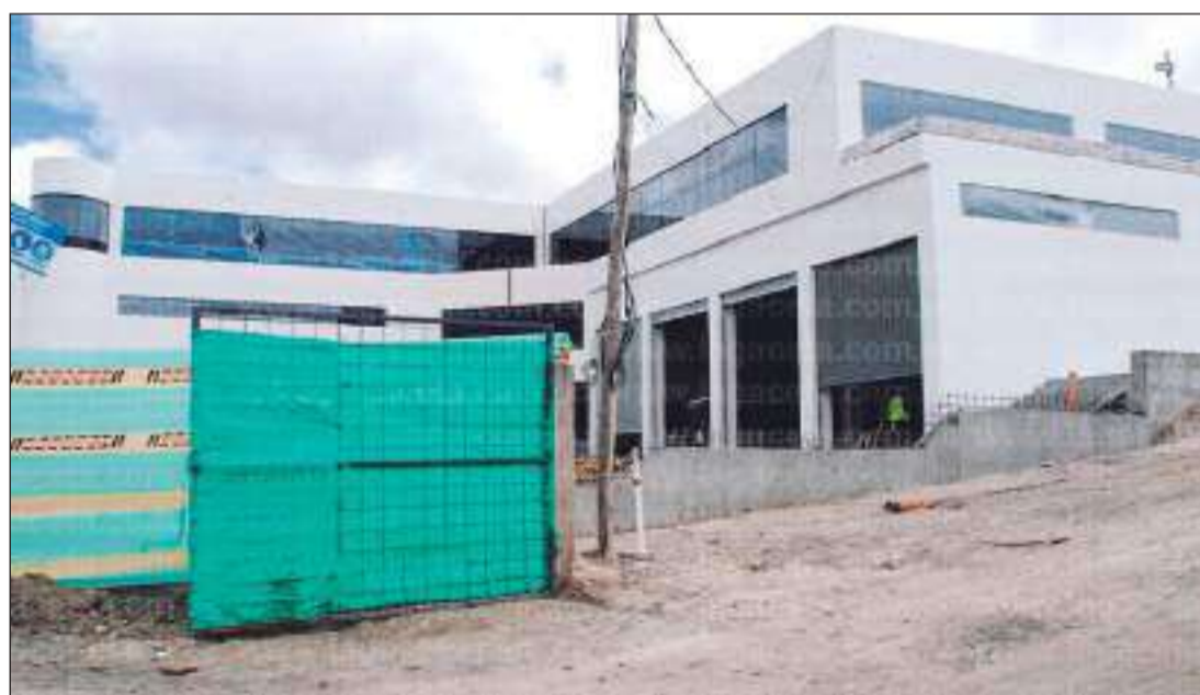
► Nueva construcción donde funcionará el cuartel de Bomberos de Latacunga.