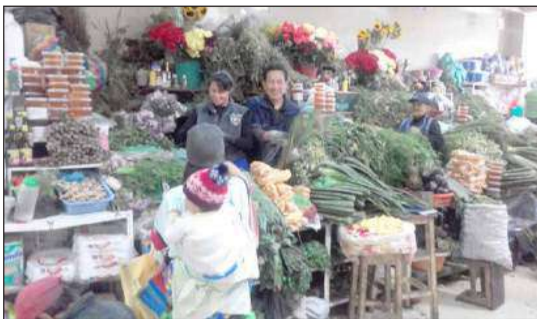
▶ Variedad de plantas medicinales que ofrece la sección del CCP La Condamine.