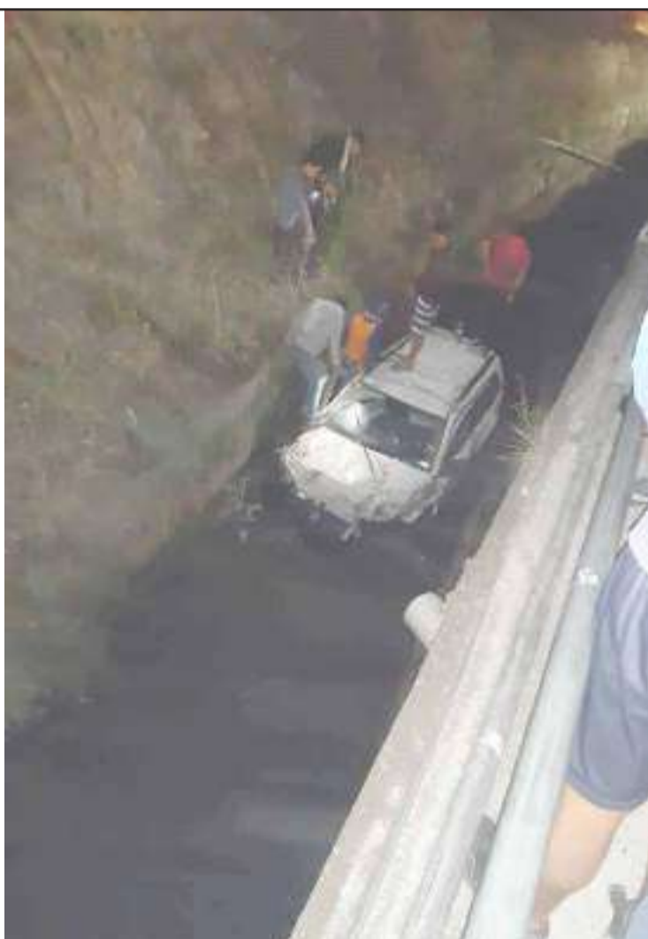
Organismos de emergencia acudieron al sitio para socorrer a los afectados.