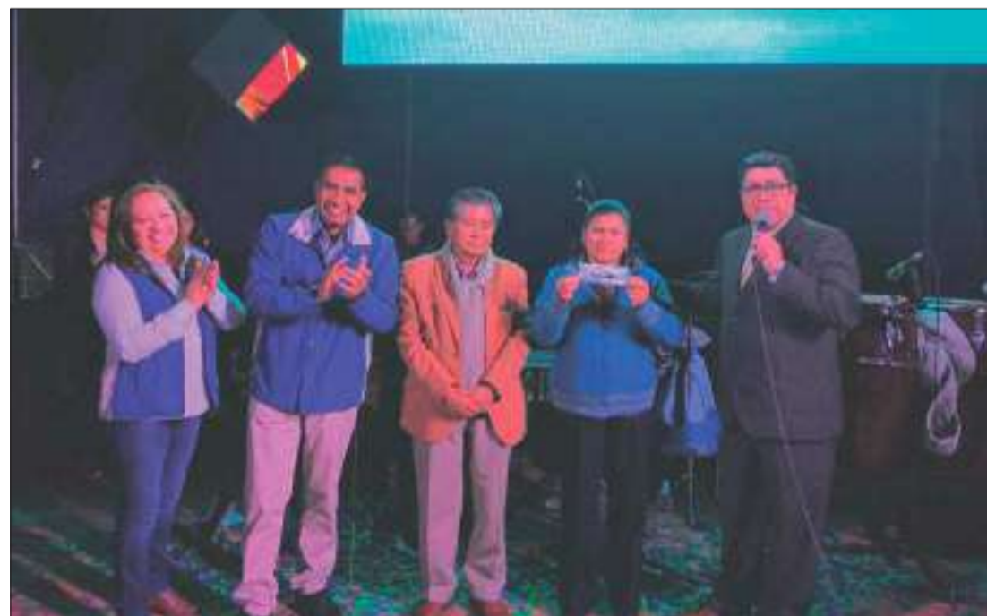
► La entrega se realizará este viernes 10 de enero.