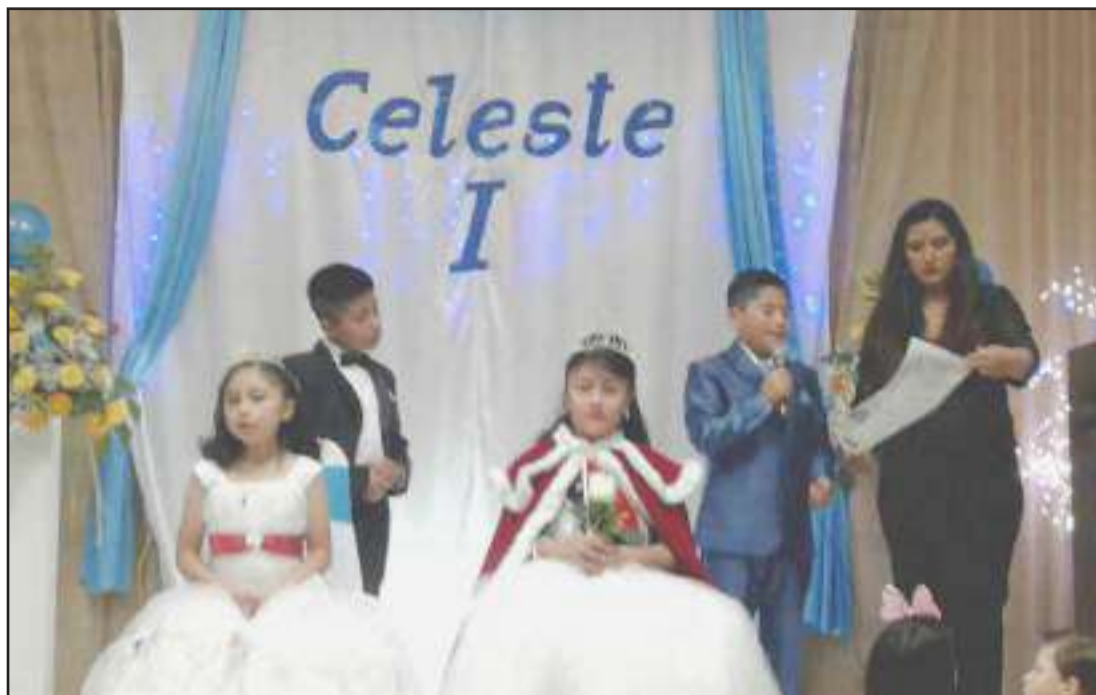
El secretario de la princesita de Navidad leyó el edicto real.