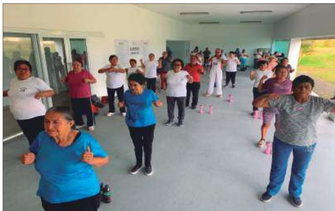
► Participantes en la terapia grupal.