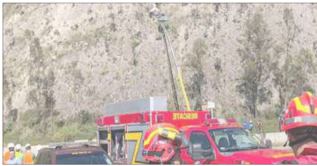
► Con un elevador de 36 metros de altura se hizo esta mañana el primer acercamiento.