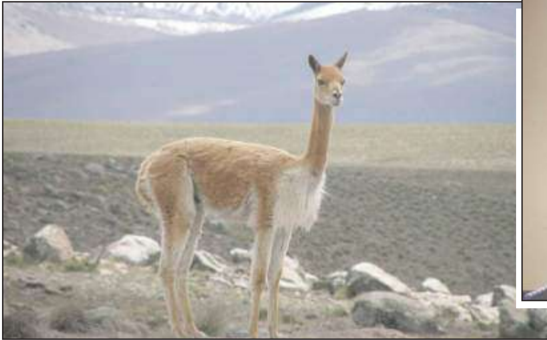
▶ La vicuña es el ícono de la reserva faunística del volcán Chimborazo.

La presencia de las vicuñas en el Chimborazo es uno de los íconos para la presencia de turistas.