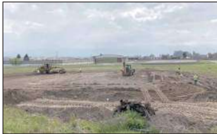
▶ Al momento se encuentra en el proceso de movimiento de tierras, la cancha tendrá una dimensión de 53x33 metros.