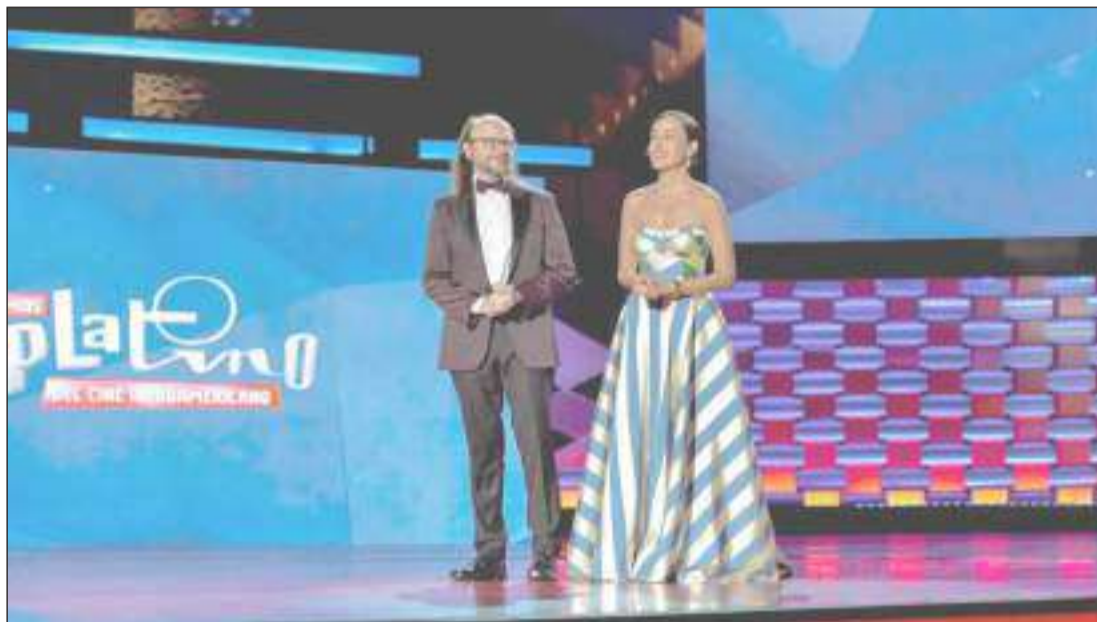
► La VII Edición de los Premios PLATINO se celebrará el 3 de mayo de 2020 en la Riviera Maya

Los premios globales de la industria audiovisual de los 23 países iberoamericanos repetirán sede, tras terminar una etapa inicial en la que pasaron por otros países como Panamá en 2014, España (Marbella) en 2015, Uruguay (Punta del Este) en 2016, España (Madrid) en 2017 y México (Riviera Maya) en