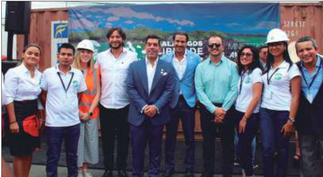
► El total de neumáticos reciclados en Galápagos es el equivalente a un edificio de 5 pisos. Este residuo especial puede tardar más de 500 años en descomponerse.

Muchos de estos neumáticos, más de 10 mil, se hallaron en los rellenos sanitarios de las islas Santa Cruz y San Cristóbal. Para que tengan una idea más precisa de la magnitud, esa cantidad de llantas son el equivalente a un edificio de cinco pisos, y el dato más grave es que cada neumático tarda al menos 500 años en descomponerse. Y de seguir acumulándose quitará vital espacio en las Islas para las especies que ahí conviven, a lo que se suma la contaminación de la