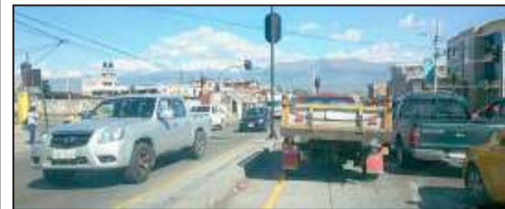
Aún existen conductores que no respetan las normas viales.