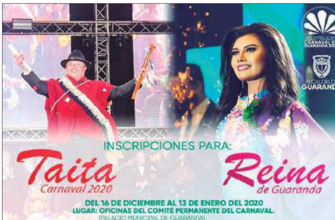
Las candidatas deberán cumplir con varios requisitos para su aceptación.

plir con varios requisitos para su aceptación: Tiene que ser guarandeña de nacimiento, tener entre 17 a 21 años de edad, tener un proyecto con el que trabajará en caso de ser electa, no tener descendencia, tener documentos de identidad, foto tamaño carnet y contar con un auspiciante.