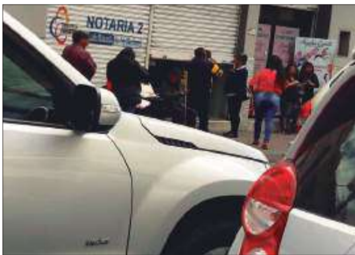
► Ayer supuestamente habría estado atendiendo a puerta cerrada.

Según documentos investigados por este medio de comunicación y subidos en las diferentes plataformas digitales, el detalle del proceso menciona que: "(...) se procede a remitir el expediente original de Instrucción Fiscal