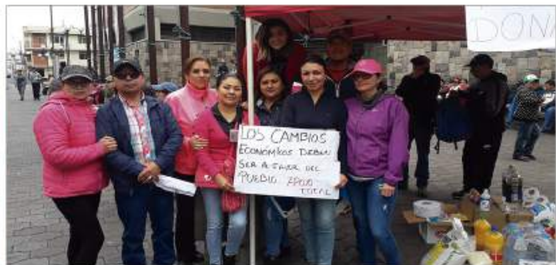
► Ciudadanos con carteles apoyan a los manifestantes paralizados.