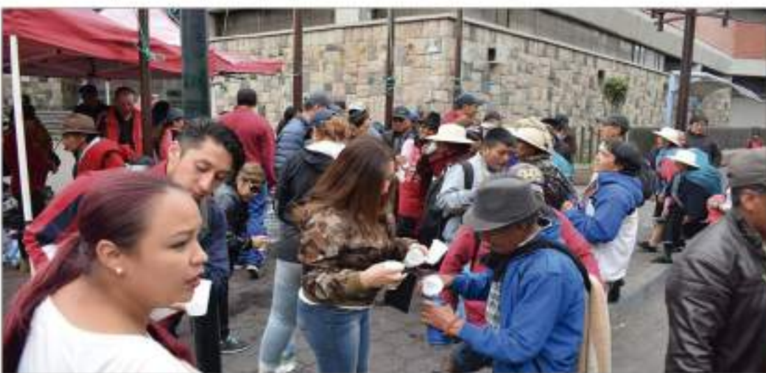
► El agua es una de los elementos más solicitados por los manifestantes.