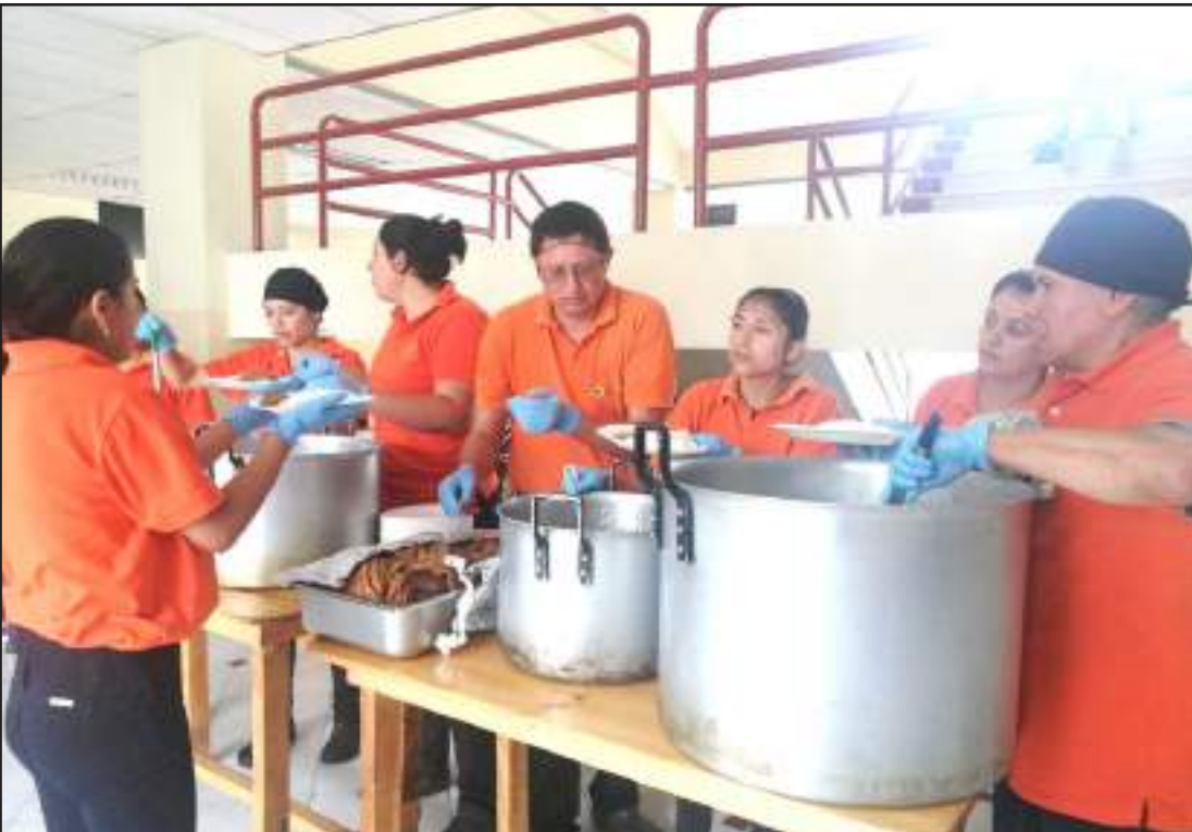
Los estudiantes asistieron hasta la universidad para servirse los alimentos.

que son cientos de estudiantes que no han podido recibir víveres ni dinero por parte de sus familiares.