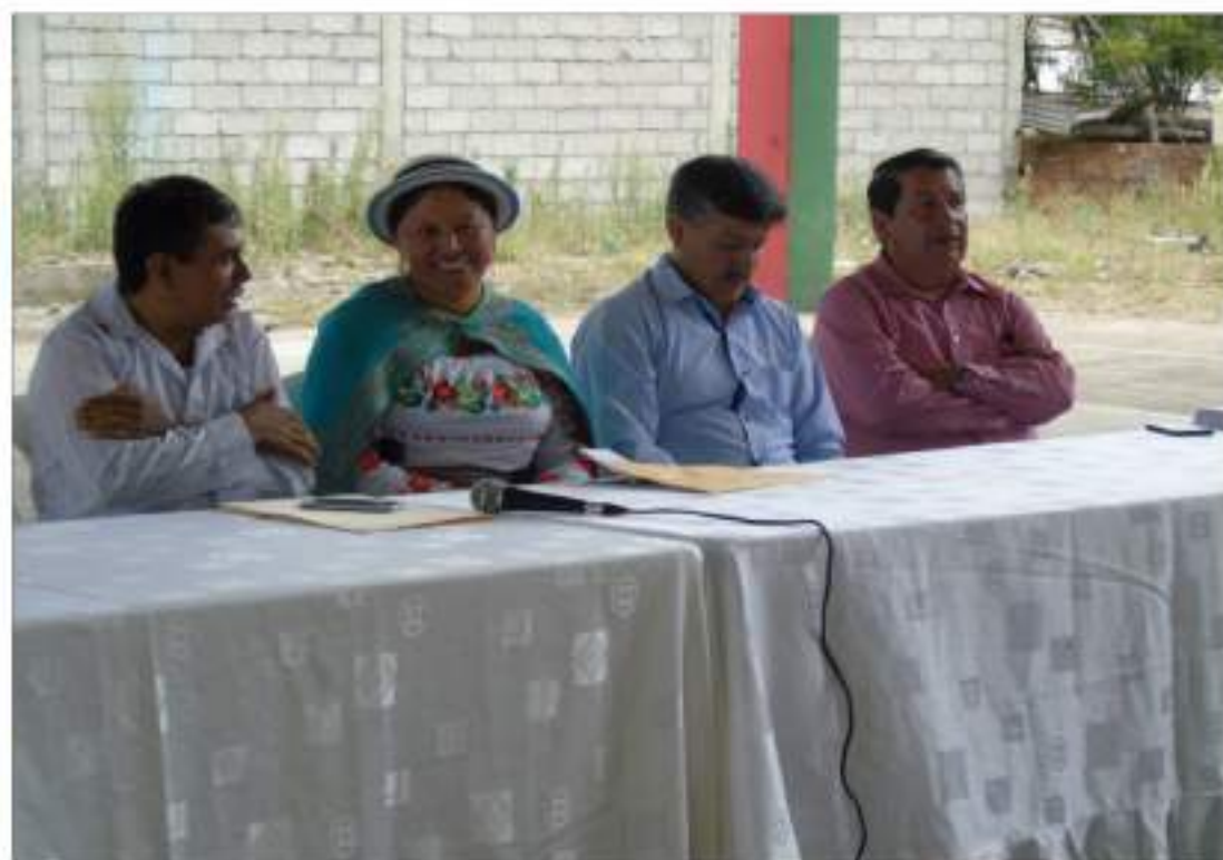
Cabe destacar la presencia y el interés demostrado por los habitantes de comunidades.