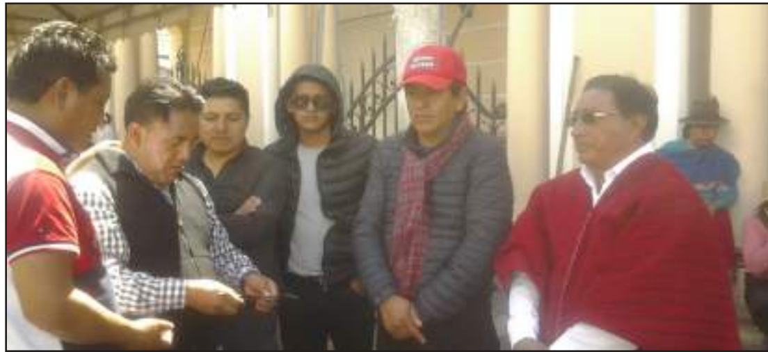
El alcalde Simón Bolívar Gualán junto a los funcionarios del Municipio de Colta.