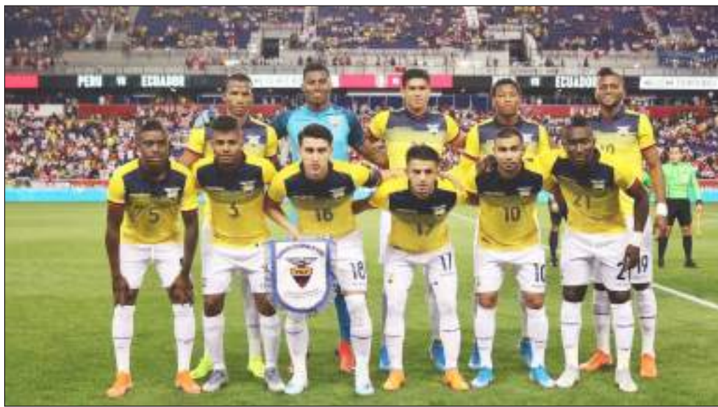
► Selección de Ecuador juega hoy a las 09H00 frente a Argentina

El seleccionado ecuatoriano que tuvo inconvenientes para llegar hasta España, por problemas en el vuelo que debió realizar el miércoles de esta semana y que recién llegó el viernes, solo entrenó ayer sábado, y hoy jugará con Argentina un partido amistoso.