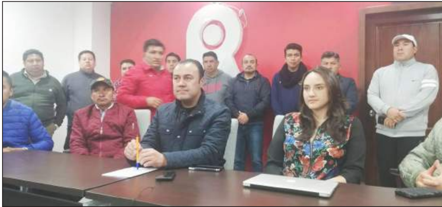
Los representantes de las instituciones públicas y privadas emitieron un manifiesto que llegará al presidente.

El alcalde del cantón conjuntamente con los representantes de diferentes sectores del cantón se reunieron para hacer un manifiesto y establecer su posición ante la situación de paralización que se vive.