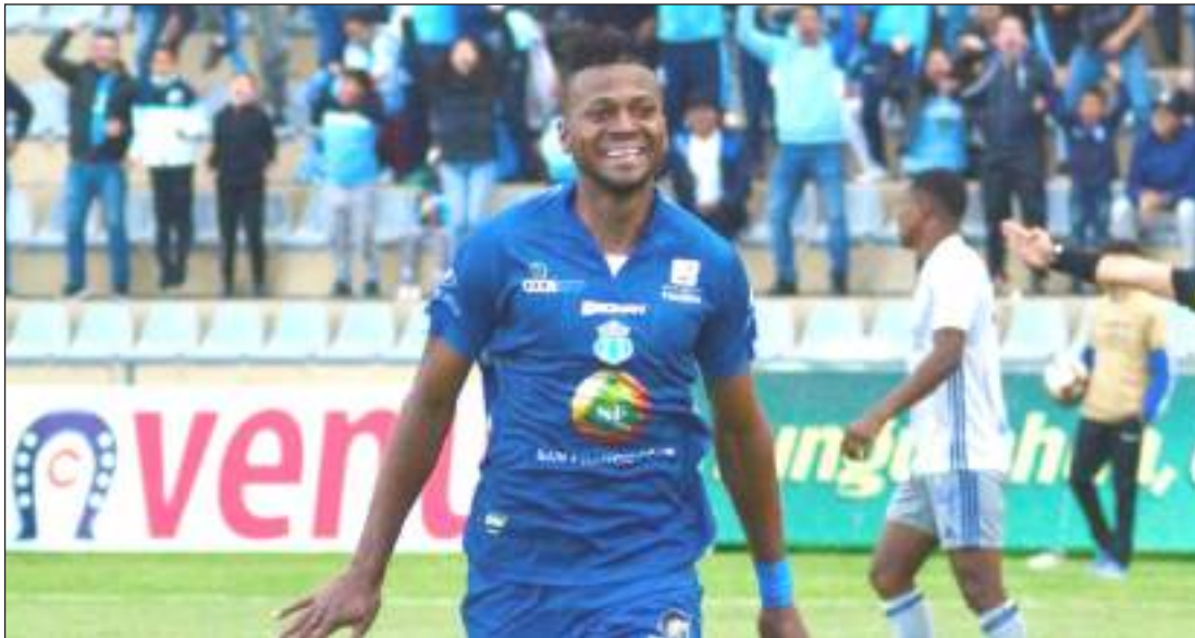
► El Macará lidera la tabla de posiciones, su rendimiento ha sido destacable.