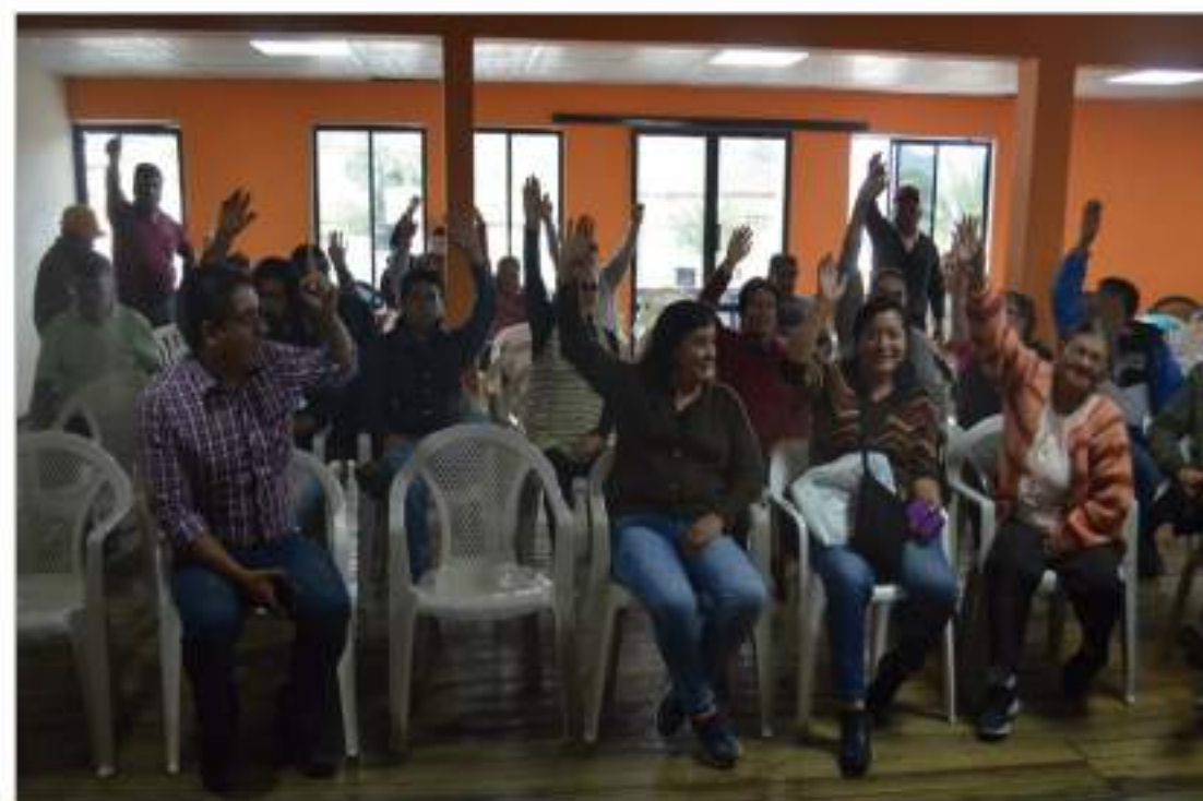
Varias personas participaron de esta asamblea.