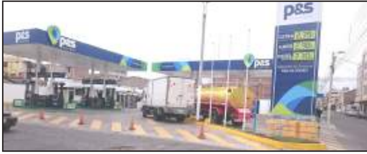
► Algunos administradores informan a los usuarios que ya no tiene gasolina.

Ciudadanos siguen buscando en la ciudad y en los cantones cercanos, combustible para su trabajo o para sus vehículos.