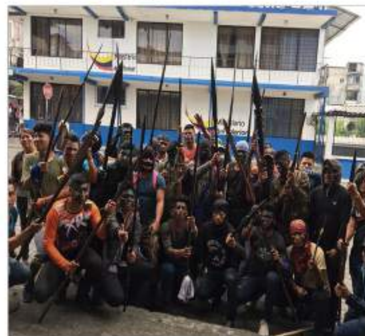
Varios manifestantes se unen a las protestas en el país.

Las ciudades principales de la Amazonía permanecen incomunicadas porque los manifestantes persisten tomados la troncal amazónica, vía