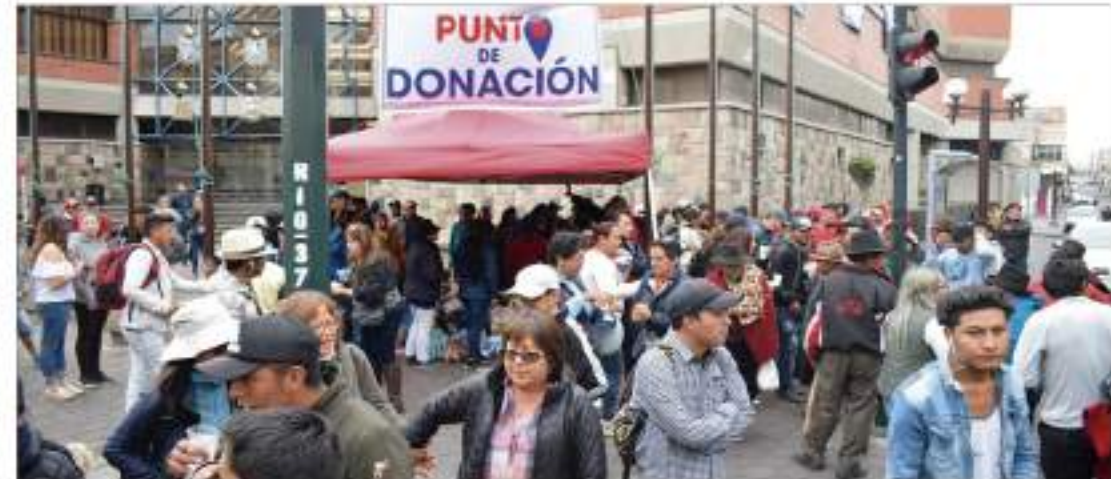
► Personas solidarias se acercaron a dejar su donación voluntaria.