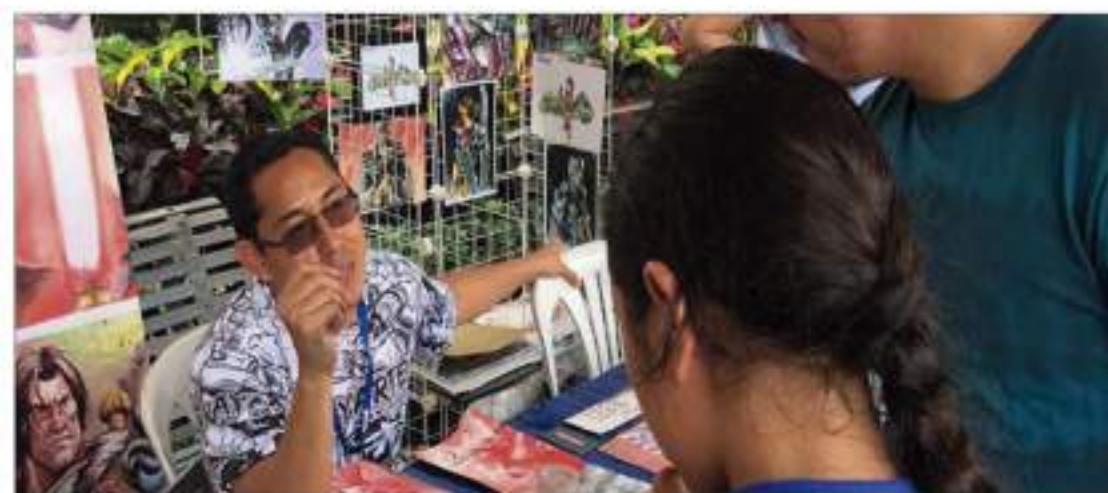
► El ilustrador participó con una exposición en la galería Guayarte; lo suyo es la acuarela bajo la línea del animé y el cómic de distintos personajes.