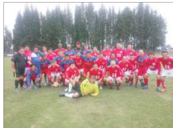
► Equipo del Olmedo de la categoría súper 50.

Hoy en cambio se jugará los partidos entre el Club 21 de Abril y el elenco del Cruzeiro a