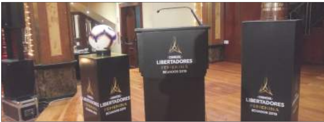
► El balón y la copa que se disputaba en nuestro país.