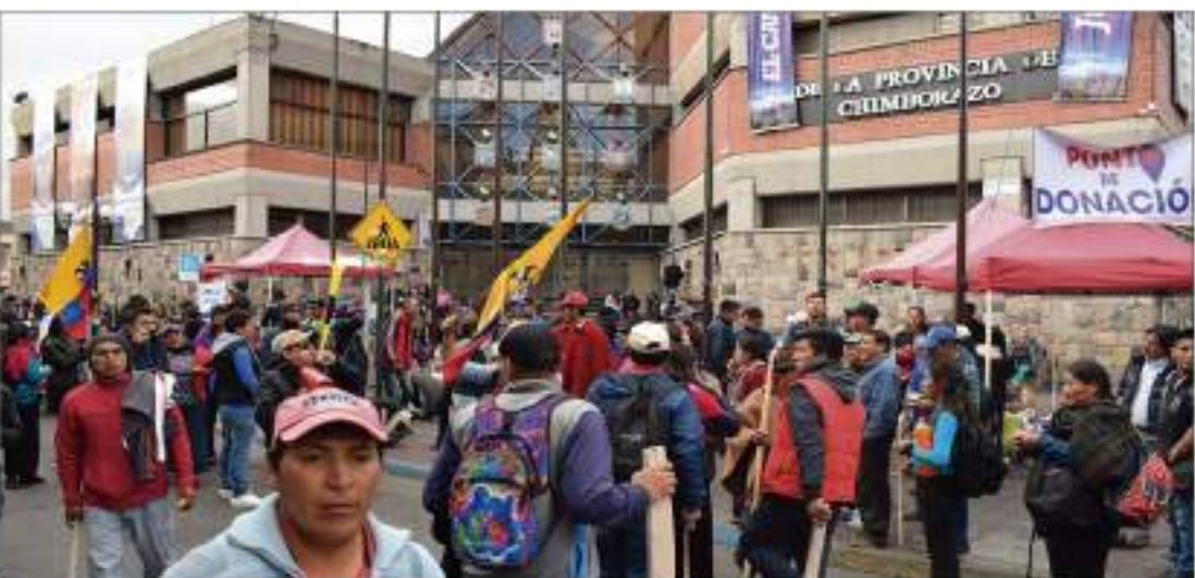
► Brigadas médicas atendieron con normalidad a varios pacientes.