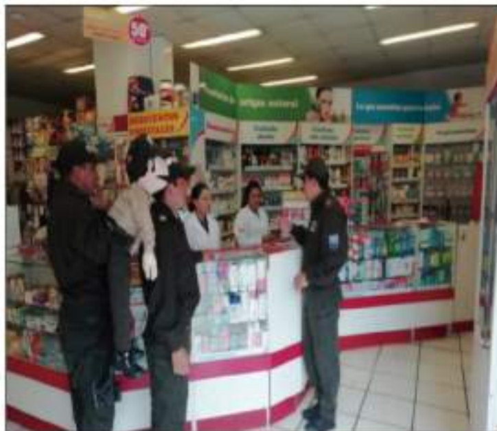
Los controles se realizan en toda la ciudad.