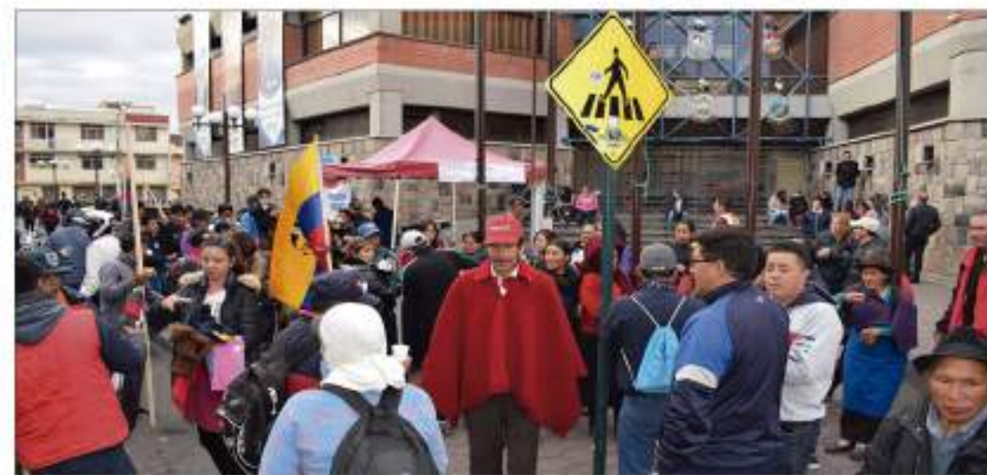
► Jóvenes y adultos, todos unidos por una misma causa.