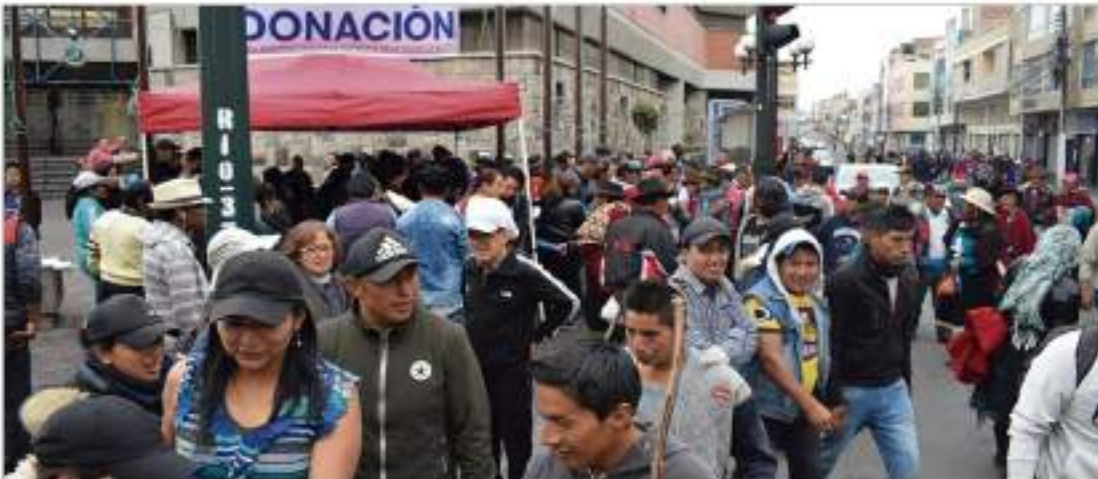
► Punto de donaciones ubicado en el exterior del Consejo Provincial.

nes (panes, agua, gaseosas, atunes, entre otros), con el objetivo de hacerles llegar lo más pronto posible a miles de indígenas que se encuentran en Quito, protestando contra las medidas económicas adoptadas por el presidente Lenin Moreno. (16)