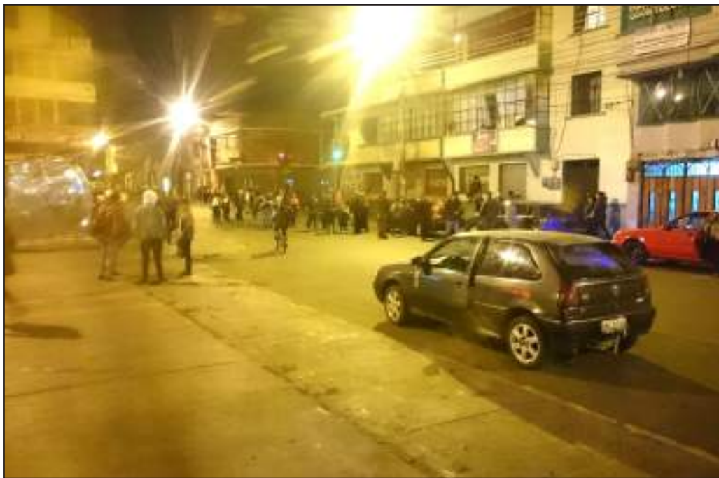
► Instantes en que un grupo de manifestantes paraban a vehículos en La Dolorosa.

Ciudadanos se encuentran intranquilos por la presencia de grupos de personas que fuerzan a cerrar los negocios. Temen que se sigan registrando hechos violentos en Riobamba.