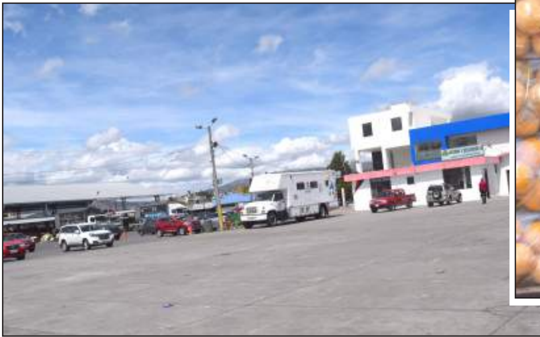
El mercado de productores San Pedro de Riobamba (archivo).

y apoyamos a los campesinos, los indígenas y el pueblo del campo que están en la medida de hecho, pues están luchando por el bienestar de la población, las medidas tomadas afecta a todos y eso es lo que reclaman los sectores indígenas y campe-