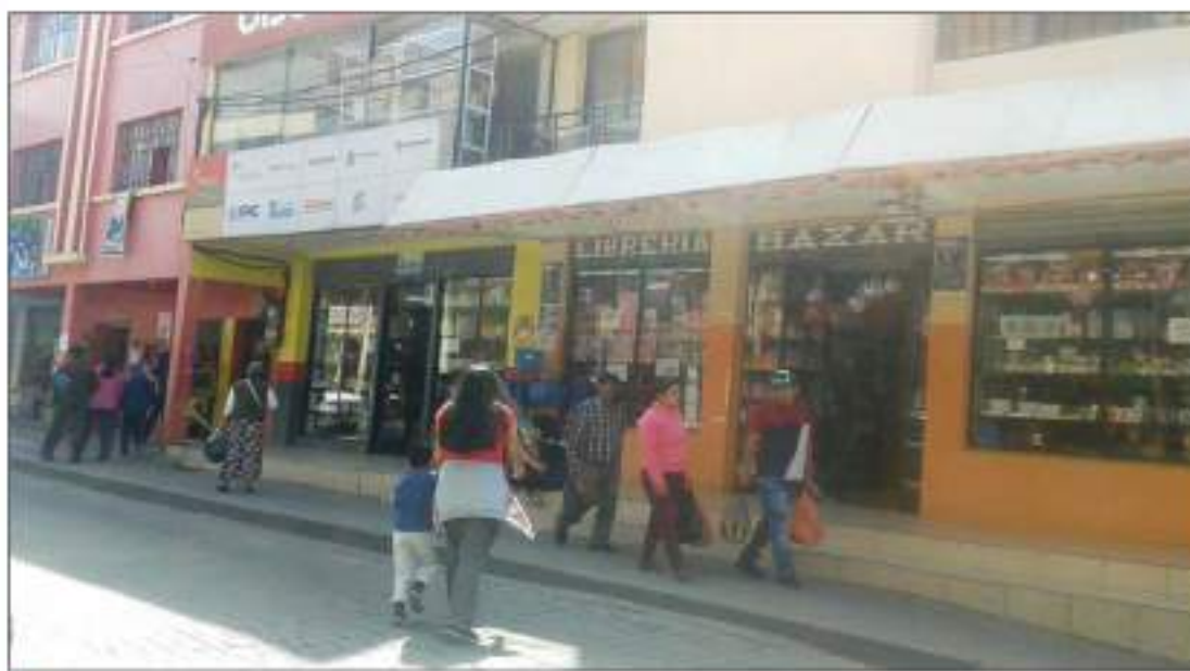
Algunos centros de comercio abrieron sus puertas en estos días.