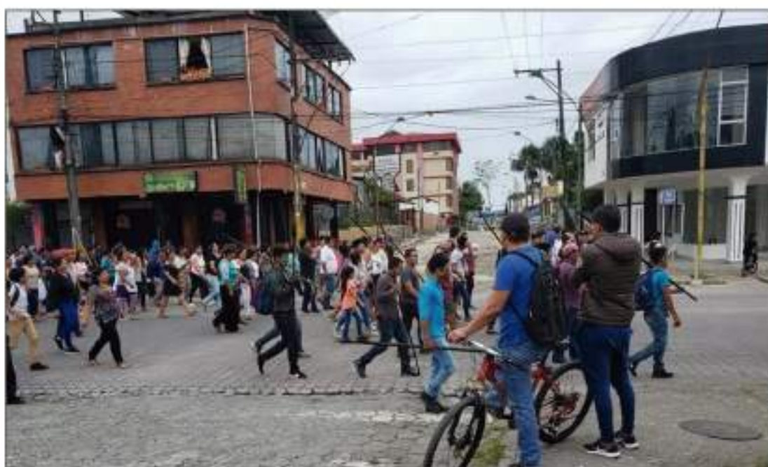
Manifestantes exigiendo el cierre de negocios.

con productos de la sierra, especialmente de verduras, hortalizas, frutas, que no han podido abastecerse porque las vías están bloqueadas, pidieron que todos apoyen esta paralización de actividades.