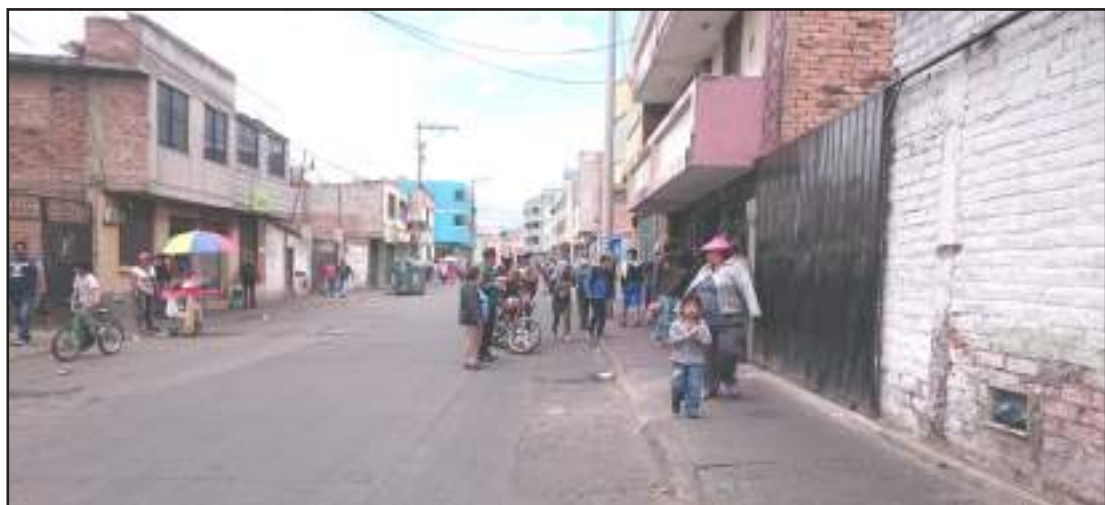
► Miles de ciudadanos decidieron caminar.