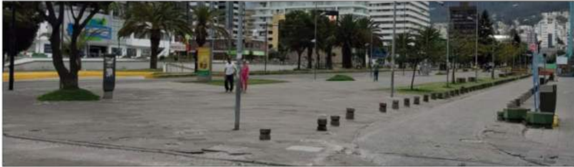
► Un hombre trabaja en las calles lucen desoladas en Quito tras anuncio de toque de queda.