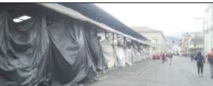
El comercio en la ciudad fue nulo ayer.