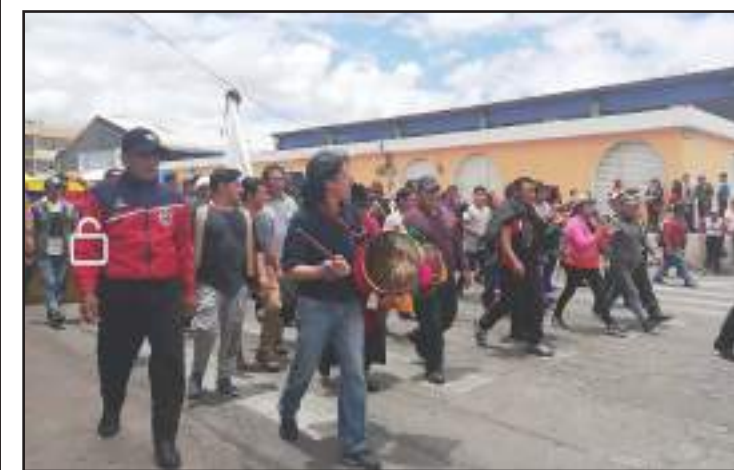
Cientos de manifestantes continúan en la lucha.