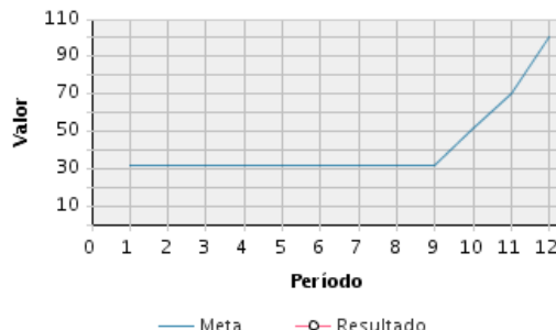
AVANCE FÍSICO PROGRAMADO VS. REAL

Transcurrido: 100.00 % Fecha de Inicio: 02/05/2013 Fecha de Fin: 30/12/2016