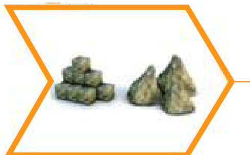
Comparación de los desechos para reducir el volumen