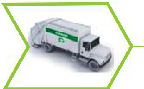
Disposición final como cualquier desecho tipo A