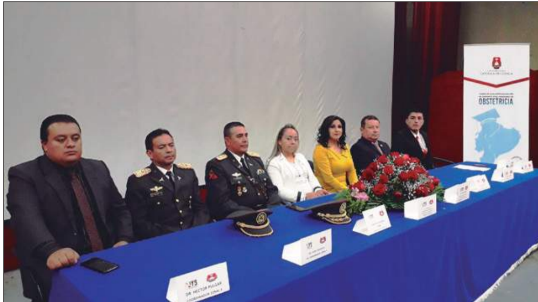
▶ Autoridades presentes en el evento de certificación en el cine de la Brigada Blindada Galápagos Nro. 11