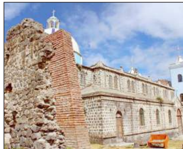
► Pueblos Mágicos es un programa turístico desarrollado por la Secretaría de Turismo (Sector).