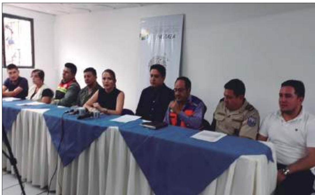
► Autoridades dan informe de operativos del feriado.

para que no se haya registrado problemas de magnitud, excepto casos aislados, entre los que resumió el comandante encargado del Distrito de Policía Pastaza.