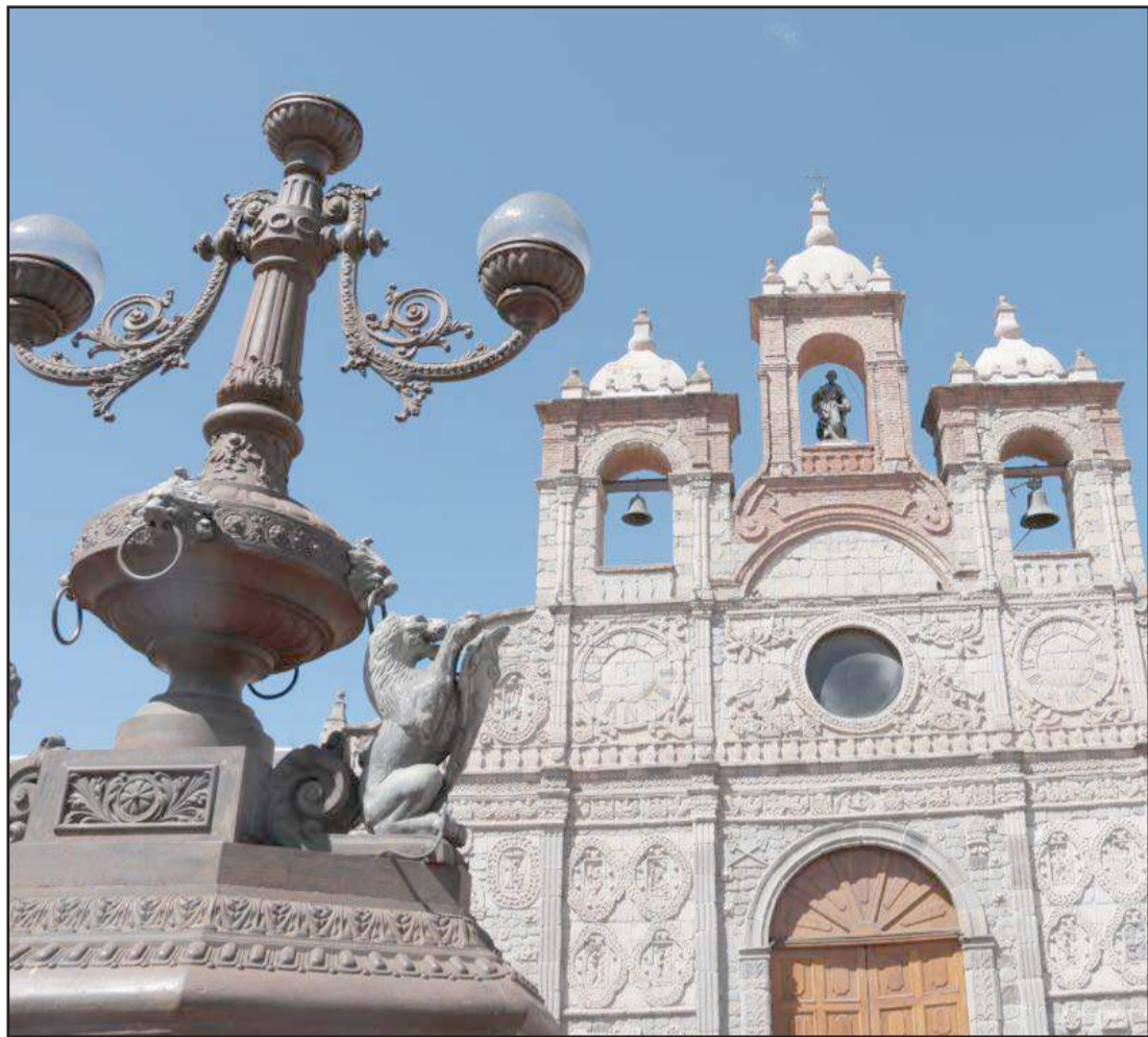
► Riobamba es una de las 10 ciudades más visitadas en el último feriado.