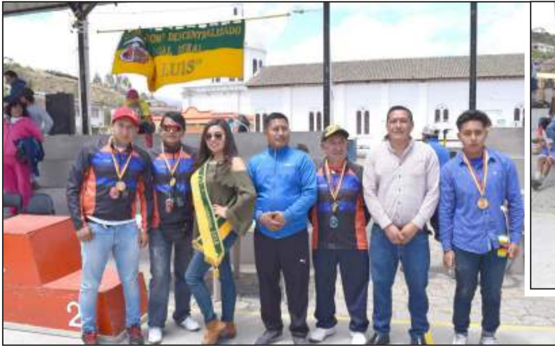
Los deportistas recibieron los trofeos y premios en San Luis.