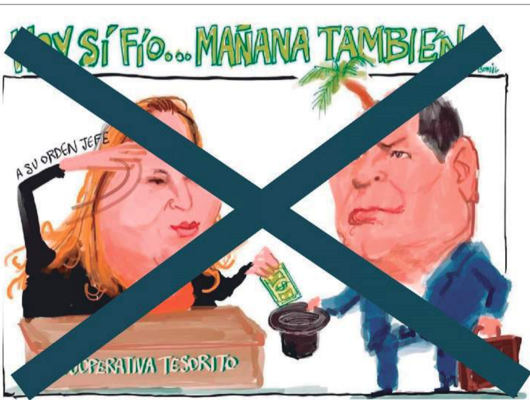
► Esta es la caricatura que rechaza la UPROCACH.