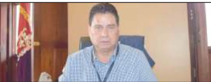
Germánico Guerrero, intendente de Chimborazo.