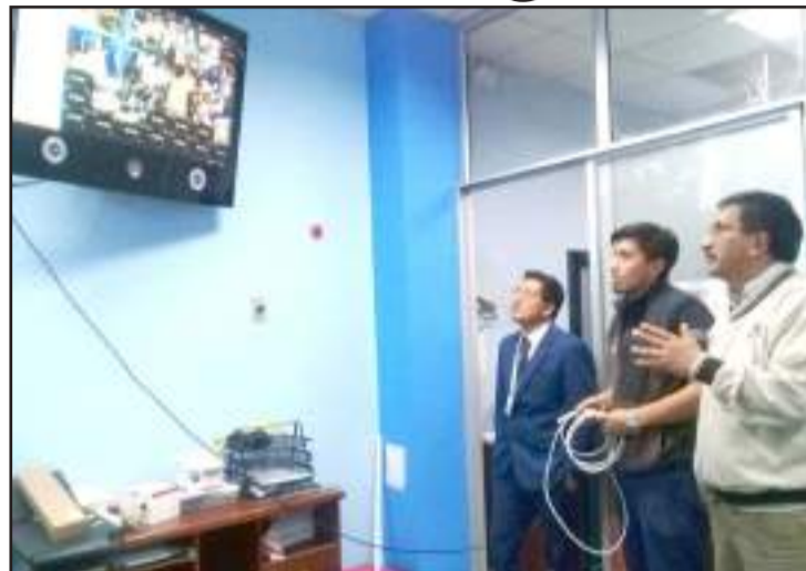
Los directivos observan las pruebas de las cámaras.