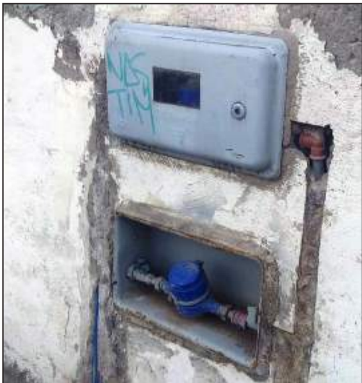
► El servicio se suspenderá para quienes tengan deudas.

A través de una rueda de prensa, representantes de la Empresa Municipal de Alcantarillado y Agua Potable dieron a conocer el proceso de suspensión del servicio de agua potable para quienes tengan deudas.