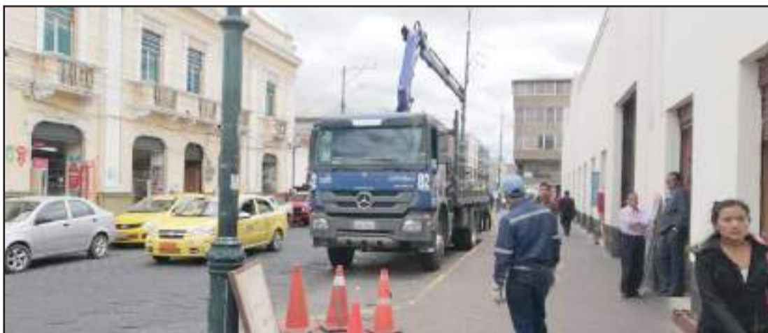
► Técnicos de la EERSA iniciaron los trabajos de iluminación en el Mercado San Francisco.