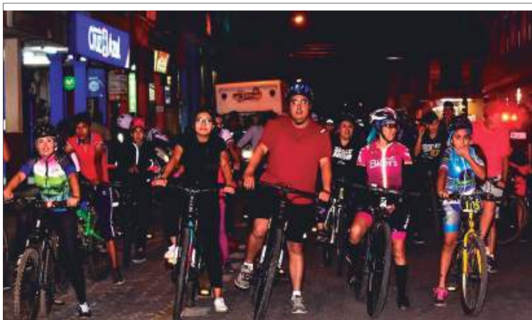
► Ciclopaseo por agosto mes del turismo.