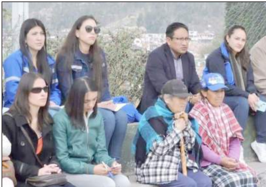
▶ La EERSA y el GAD Municipal socializaron `proyecto en el barrio Lourdes Macají.