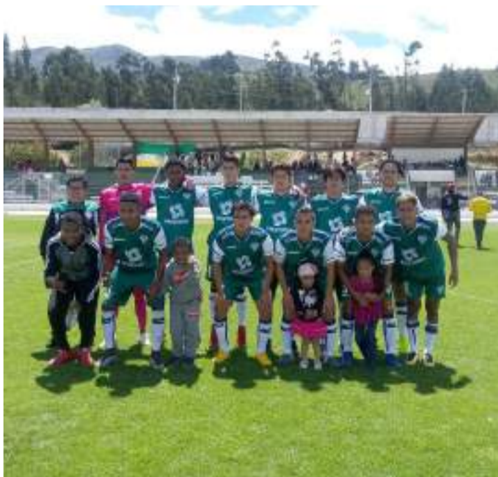
Deportivo Guano juega mañana a las 15H00 con el Pelileo.

Este miércoles se juega la tercera fecha del Torneo Zonal de la Segunda Categoría a nivel nacional y en la zona 5, el elenco del Alianza juega como visitante ante Liga Deportiva Estudiantil de Morona y el Deportivo Guano recibe al Pelileo en el Timoteo Machado.