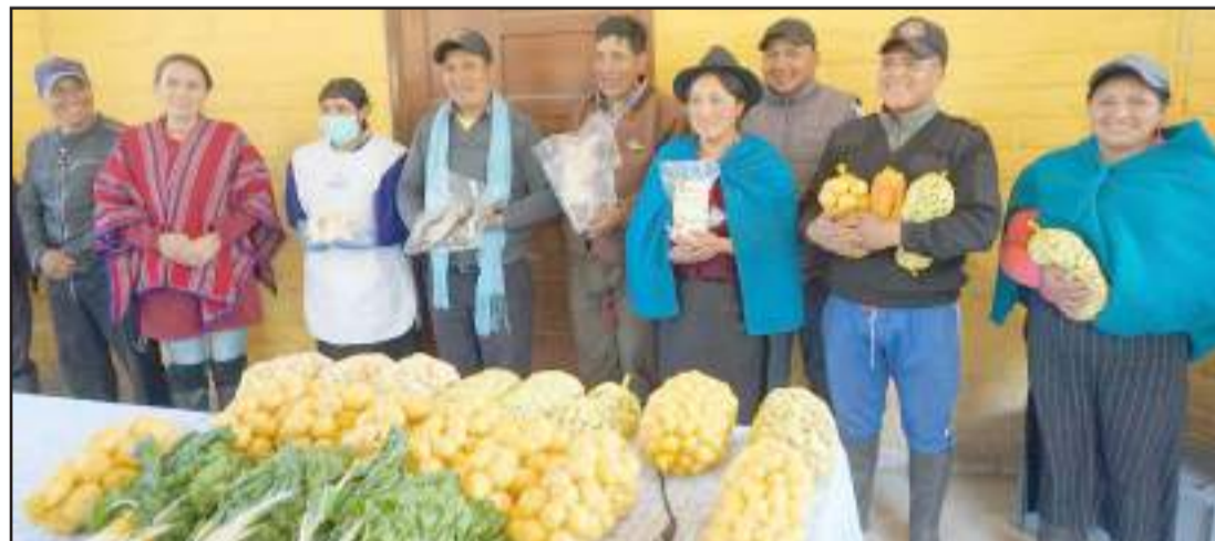
► Los productores de la zona ofertan varios productos.