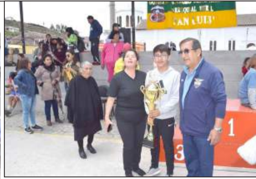
Los deportistas y la familia disfrutó de la competencia.

Igual la Virgen de las Nieves patrona de la parroquia también visitó las casas de varias