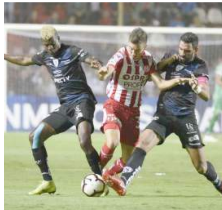
Los del Valle recurrirán a la velocidad y potencia física de sus jugadores para contrarrestar al experimentado rival argentino.

Tiene la ventaja el “Rey de Copas”, como también le dicen al Independiente de Avellaneda, que el martes pasado ganó por 2-1 y con el antecedente de haber eliminado en octavos al también ecuatoriano Universidad Católica. La intención del técnico del equipo argentino, Sebastián Beccacece, será repetir la fórmula de juego ante un rival que en la clasificación del torneo local está por debajo del