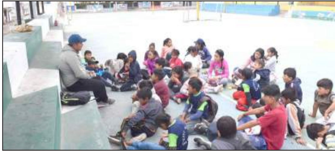
Los niños disfrutaron de las actividades deportivas y paseos en el curso vacacional.