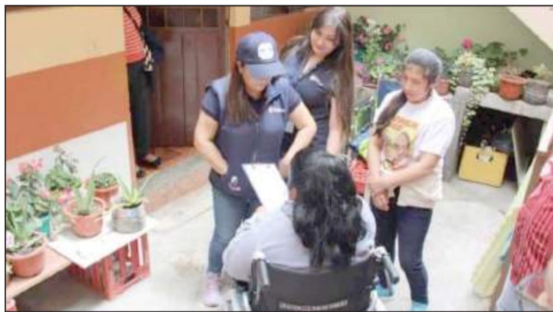
▶ Las ayudas técnicas se ejecutan en la zona 3.