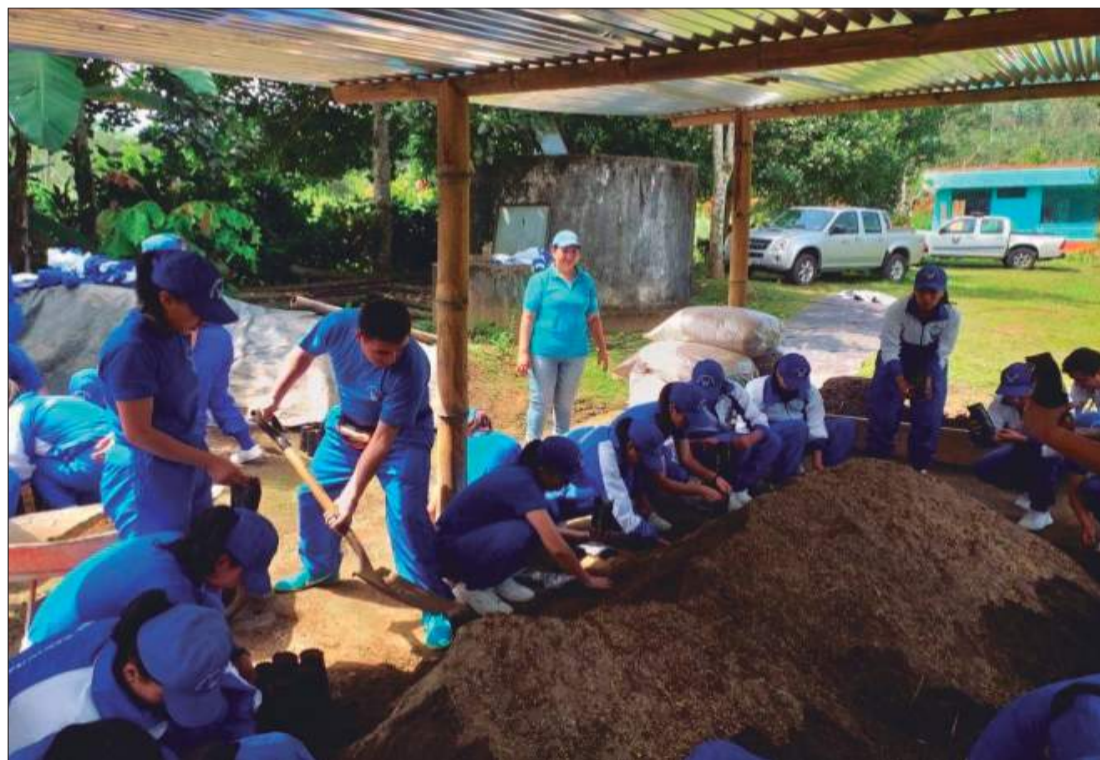
Permite contar con un stock necesario de plantas de especies forestales