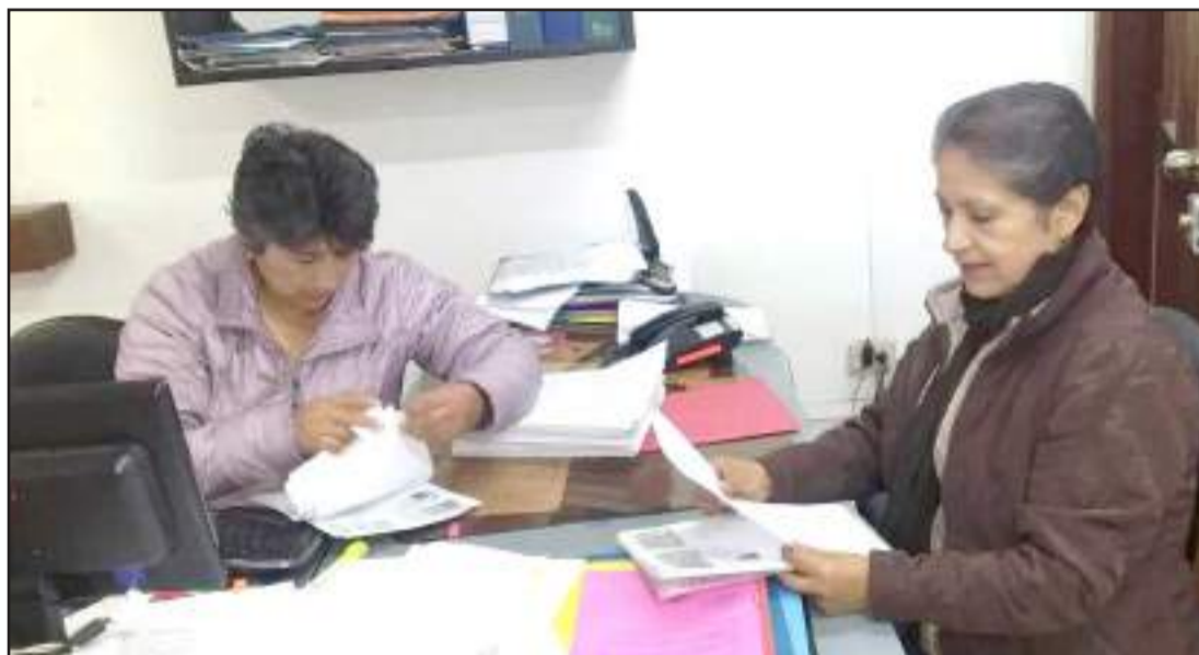
La atención se realizó en las 144 distritos educativos.