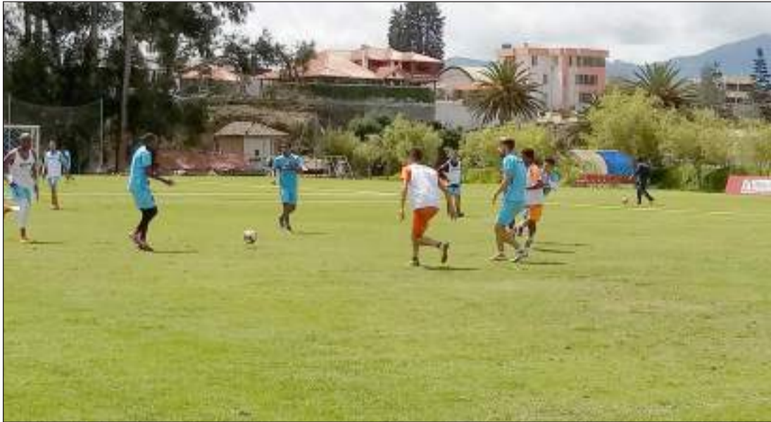
Jugadores del Olmedo continúan con sus entrenamientos.

Los jugadores del Centro Deportivo continúan sus entrenamientos con miras a lo que será el cotejo por la séptima fecha de la Liga Pro Banco Pichincha, en el estadio Fernando Guerrero Guerrero.