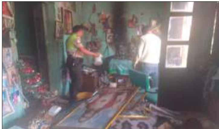
Personal policial logró controlar el incendio.