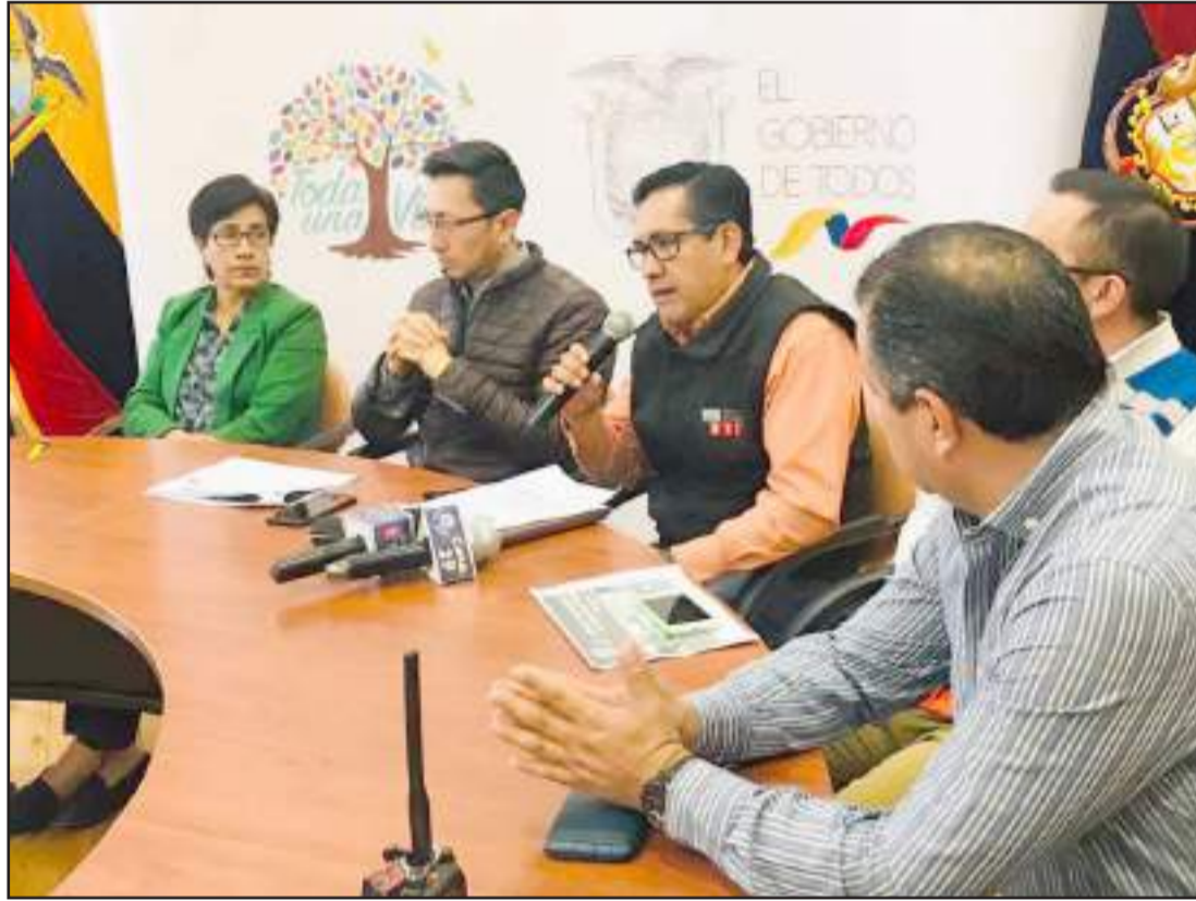
► Autoridades que socializaron los resultados del Plan de Contingencia