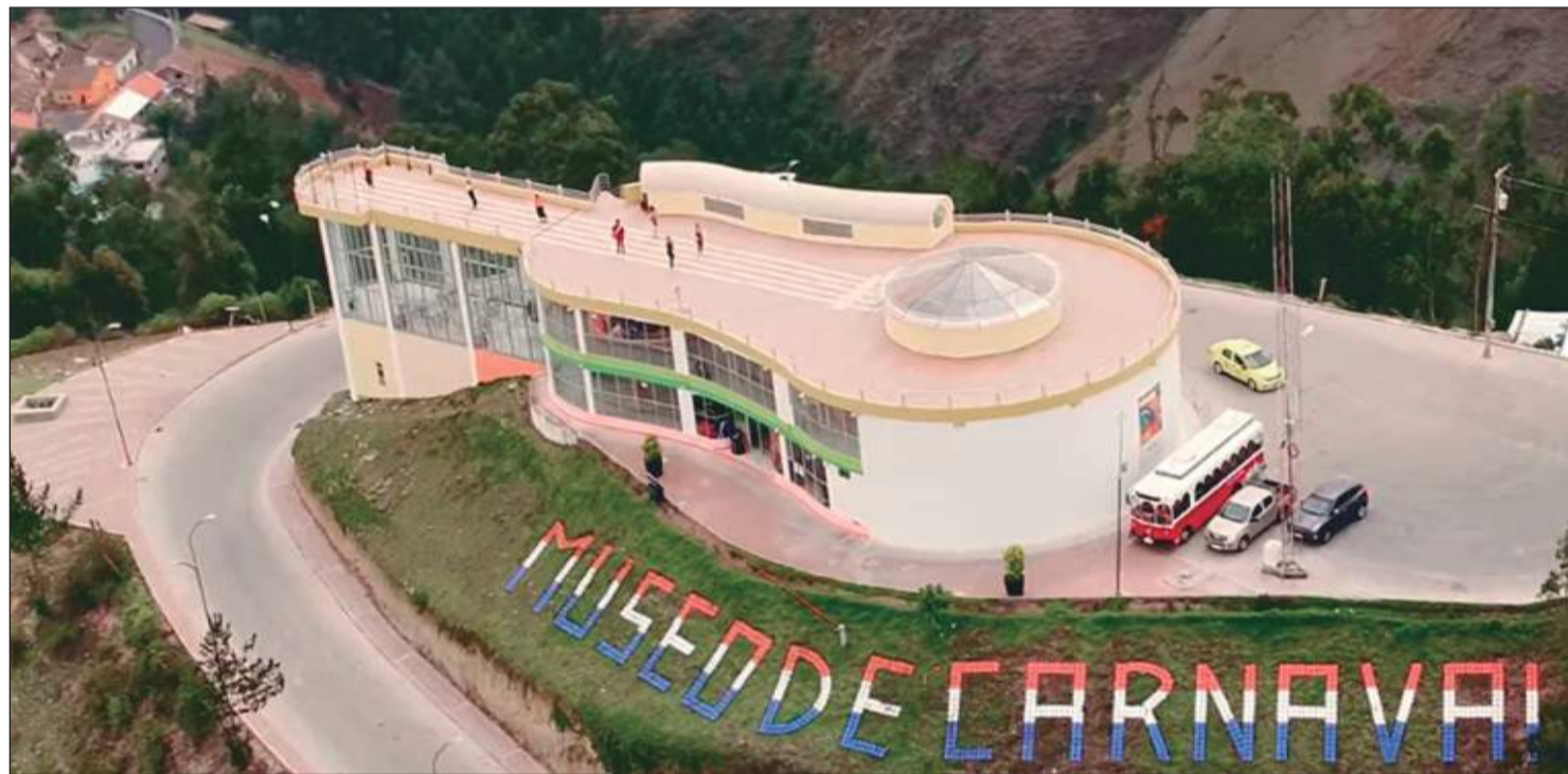
Estos museos les espera con las puertas abiertas a propios y extraños.