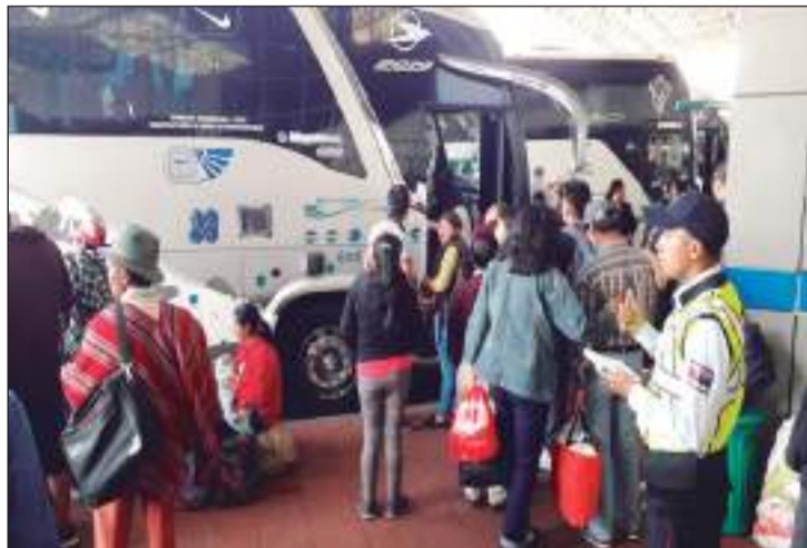
▶ Decenas de pasajeros retornaron a su ciudad de origen.