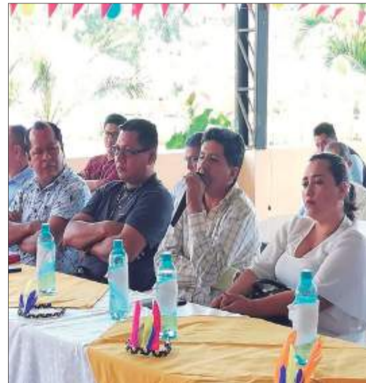
► Alcalde y concejales del cantón Santa Clara.

De ahí que en los 3 municipios se eligieron a mujeres como vicealcaldesas. La Comisionada de la Defensoría del