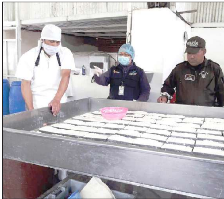
Más de 1.700 quesos no aptos para el consumo humano y 500 litros de leche con índices altos de acidez, fueron decomisados.

Técnicos de la Agencia Nacional de Regulación, Control y Vigilancia Sanitaria (Arcsa) y la Agencia de Regulación y Control Fito y Zoosanitario (Agrocalidad) visitan de forma permanente plantas de producción de lácteos y derivados en las provincias que comprenden la zona 3: Chimborazo, Cotopaxi, Tungurahua y Pastaza.