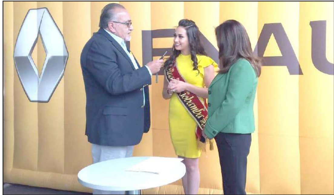
La entrega del vehículo se realizó ayer en Automotores Antonio Larrea.