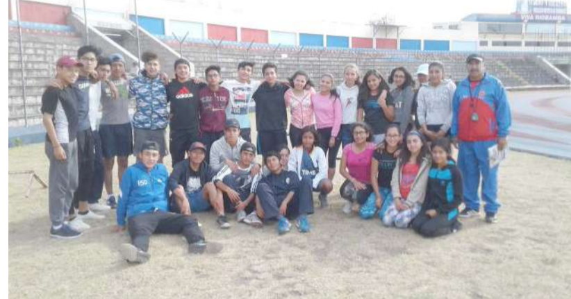
► Deportistas de Chimborazo buscarán ser buenos anfitriones

también conoce que en casa siempre se vuelve fuerte y los atletas tratarán de alcanzar las medallas necesarias y que estas sirvan como incentivo para lo que será su participación de lo que será los Juegos