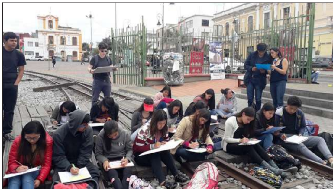
► Estudiantes de la carrera de Arquitectura de la Unach en la Plaza Alfaro.