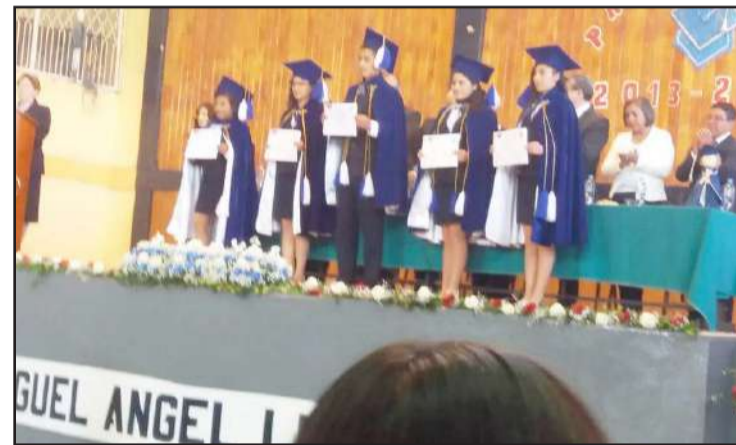
► En su coliseo, las autoridades de la Unidad Educativa "Miguel Ángel León" incorporaron una nueva promoción de graduados.