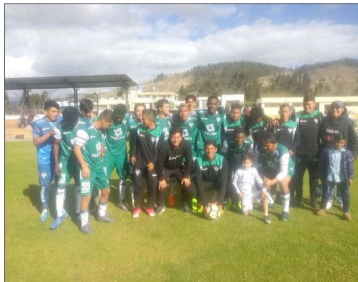
Deportivo Guano quiere llegar a la serie B.

El elenco "Ciudadano" trabajará hasta el día de hoy en el aspecto físico y regresará a sus trabajos habituales este día lunes, para realizar trabajos con balón y hará fútbol en el transcurso de la semana.