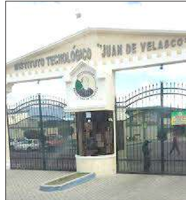
► Los exalumnos rendirán homenaje a los docentes.