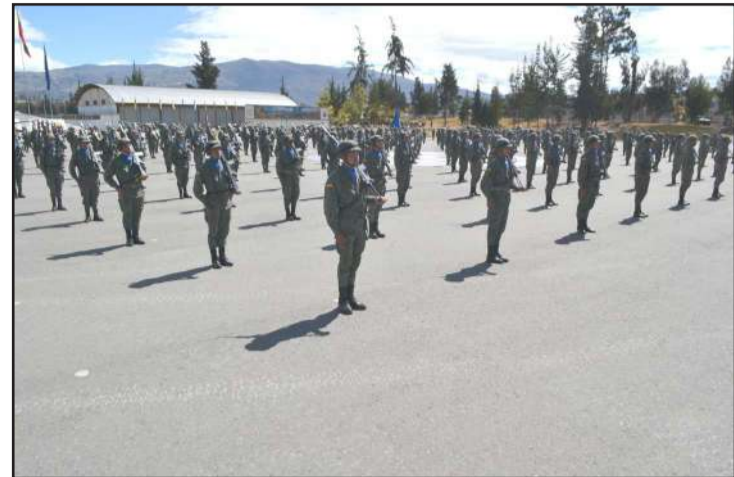
El evento se desarrolló en el Campo de Marte del Fuerte Militar

diferentes campos de acción de la Brigada. De igual forma, gracias a la gestión del alto mando de este regimiento militar, y en coordinación con otras instituciones del Estado, los jóvenes recibieron capacitación en áreas como la Educación Ambiental y Gestión para la Conservación de