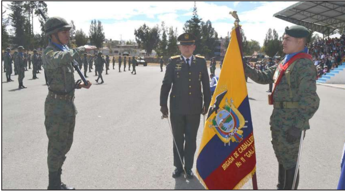
Los nuevos reservistas gritaron al unísono "Sí juro"

¡Sí juro!, fue el compromiso hecho a la nación por los nuevos reservistas del Ejército Ecuatoriano que se licenciaron.