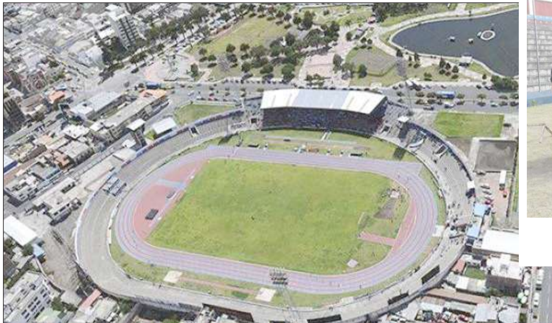
► Pista del estadio Olímpico de Riobamba, sede del Nacional de Atletismo.

Hoy en nuestra Riobamba, inicia el campeonato Nacional de Atletismo de menores con la participación de casi todas las provincias del Ecuador y además de 5 clubes de atletismo, en total serán 430 participantes.