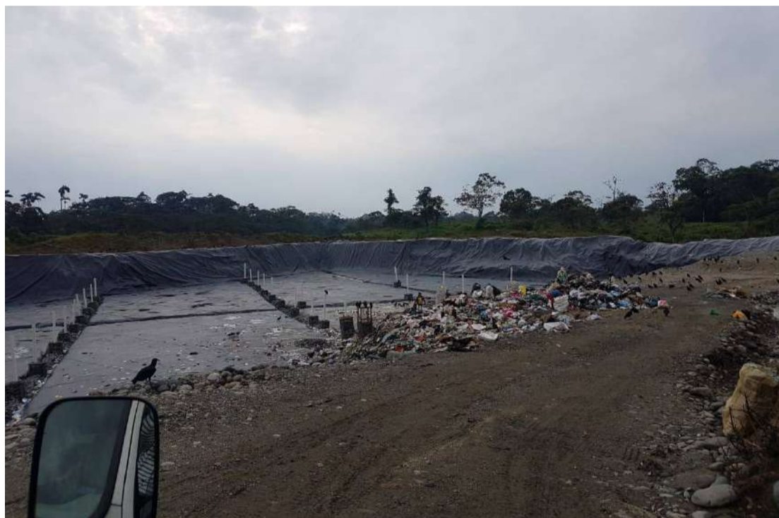
► La celda empezó a funcionar el 23 de diciembre del 2018.

La celda empezó a funcionar el 23 de diciembre del 2018, se ha realizado el seguimiento a su ocupación en los meses de enero, marzo, mayo, junio y julio del 2019, como se demuestra en las fotografías damos constancia de que hay un llenado acelerado de residuos provocados por la mala clasificación de los mismos; la ciudadanía se vuelve cómplice de este impacto por el mal manejo originado