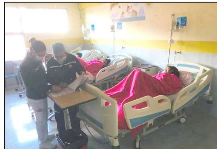
Autoridades activaron los protocolos para atender a las personas afectadas

Ante la alerta de intoxicación alimentaria en Guamote, autoridades activaron plan de contingencia por parte del Ministerio de Salud Pública.