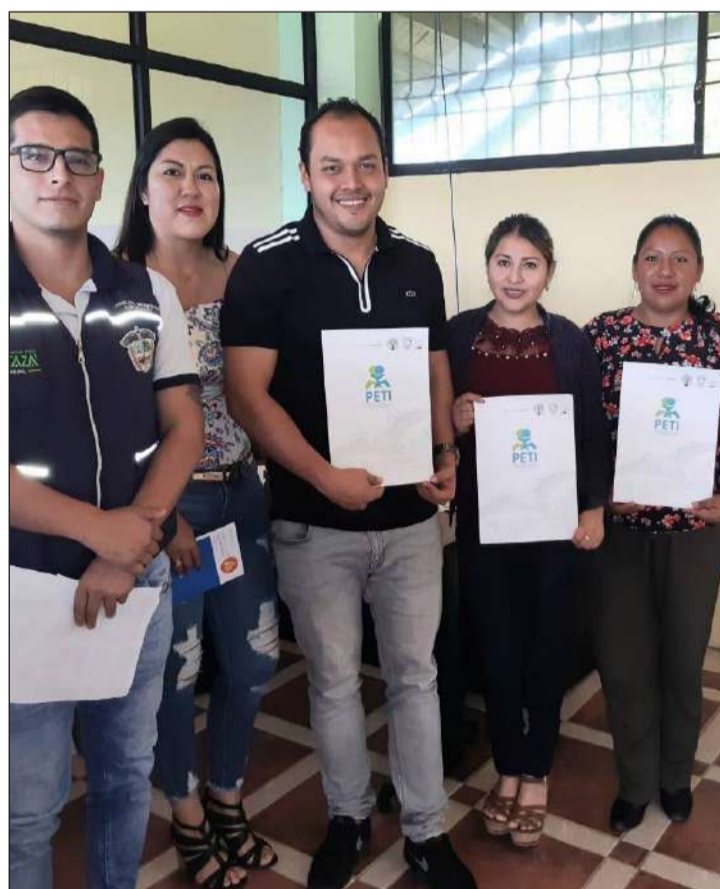
► Se realizó una reunión de trabajo con los responsables.