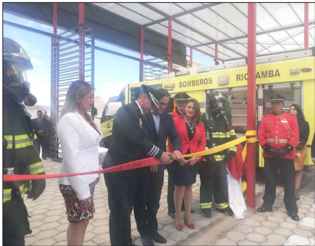
Al evento asistieron autoridades locales, representantes de instituciones y ciudadanía en general.

nicipio, instituciones, personal y ciudadanía para la construcción de este nuevo espacio y aseveró que la ciudadanía gana en funcionalidad, tiempo, apertura y en consideración de acuerdo a las necesidades de emergencia que puede tener la ciudad. Además, dio a conocer que construirán nuevas estaciones de bomberos e implementarán nuevas unidades. "En enero estaremos con un vehículo escalera, 32m de altura para poder realizar rescate en alturas y combate de incendios estructurales", finalizó. Se conoció que Canela es el nombre de la mascota adoptada por el Cuerpo de Bomberos, que ahora vivirá en estas instalaciones. Luego de cortar la cinta para dar por inaugurada la nueva estación del Cuerpo de Bomberos, los asistentes realizaron un recorrido por las instalaciones. (13)