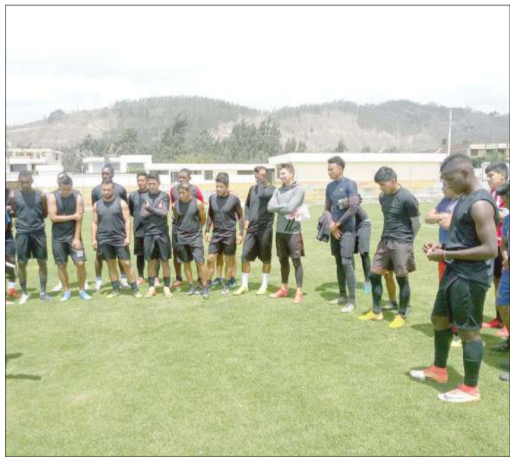
Alianza de Guano tiene dos cotejos fuertes.