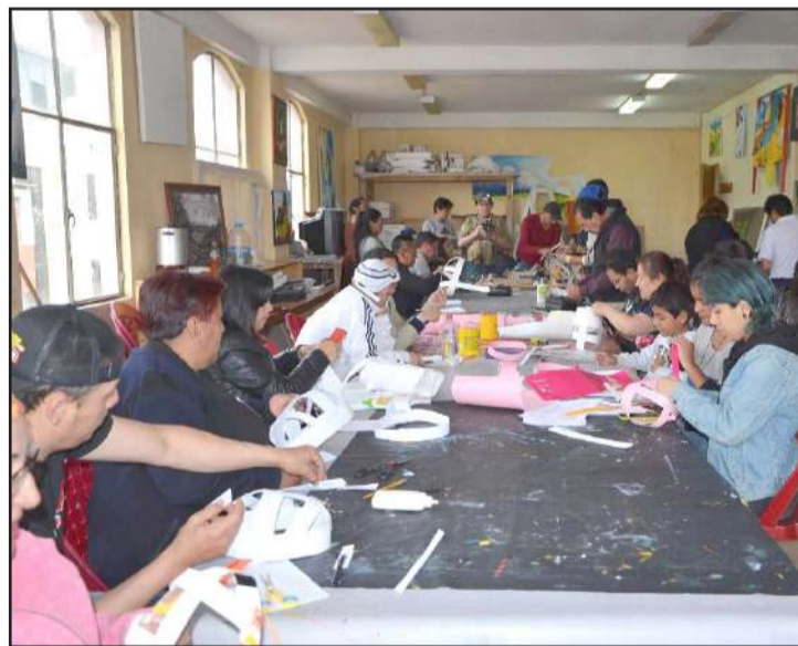
► El pasado sábado se realizó el taller para elaborar máscaras.