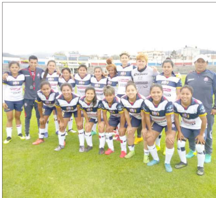
► Olmedo femenino juega mañana ante el Delfín de mantra.

El equipo del Olmedo femenino de la ciudad jugará mañana a las 10h00 en el estadio del Complejo Deportivo del Club, ante el elenco del Delfín de la ciudad de Manta, por una fecha más de La Liga Femenina de fútbol.