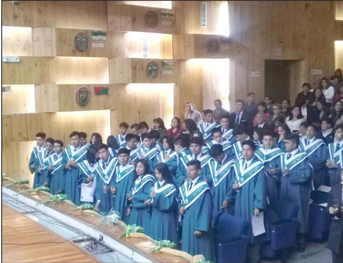
► Nuevos bachilleres de la Unidad Educativa "Dr. Nicanor Larrea León".

Con solemnes ceremonias las unidades educativas, continuaron las incorporaciones de los neobachilleres en los auditorios institucionales y de la ciudad. Los padres de familia fueron los primeros invitados al acto para felicitar con aplausos un peldaño más de sus hijos e hijas en el sistema educativo.