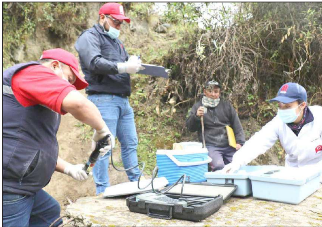
Los estudios se realizaron en las fuentes de agua y en las propias viviendas.