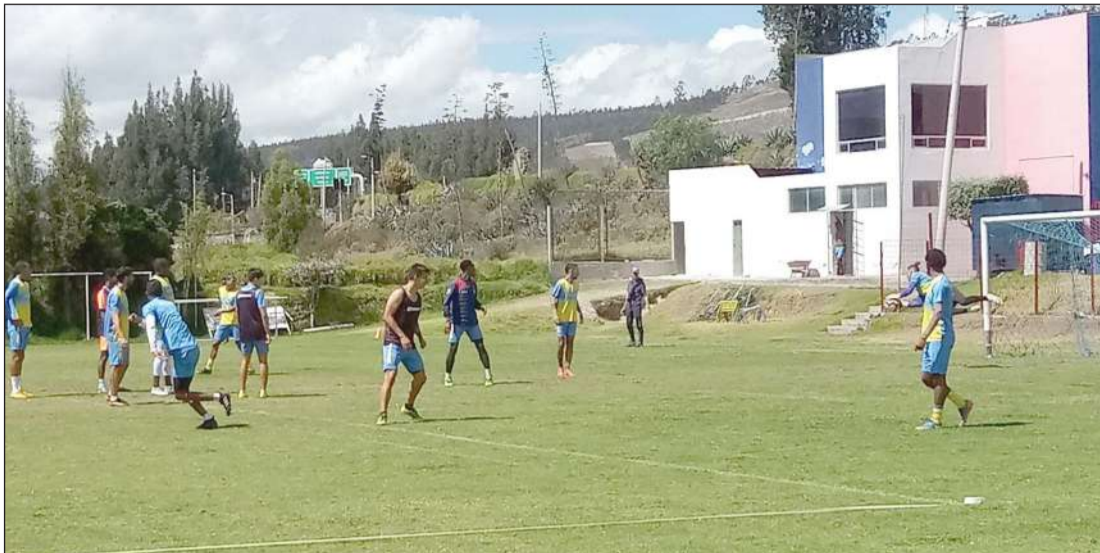
Entrenamiento de Olmedo en el Complejo Deportivo.