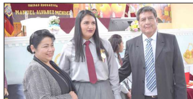
Mejor egresada recibe el reconocimiento