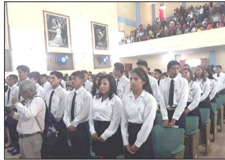
► La Unidad Educativa "Alfredo Pérez Guerrero" de Guano realizó su evento de graduación en el Teatro del cantón.

des del GAD del cantón y de la institución declararon nuevos bachilleres a los 71 estudiantes de tercero de bachillerato, de los cuales 26 son del programa ABC. (30)