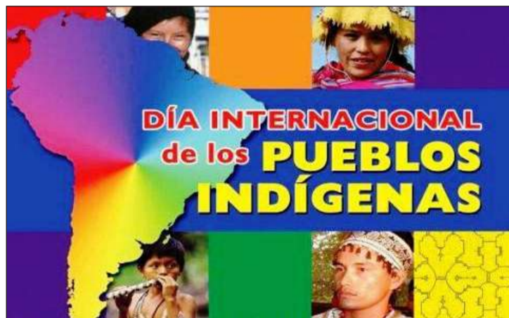
► “Fest 527 años”, una iniciativa de los pueblos originarios.