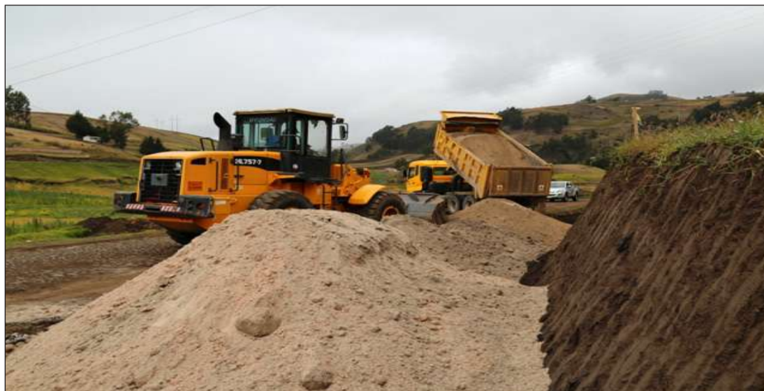
► Maquinaria y personal del Gobierno Autónomo Descentralizado de Chimborazo.