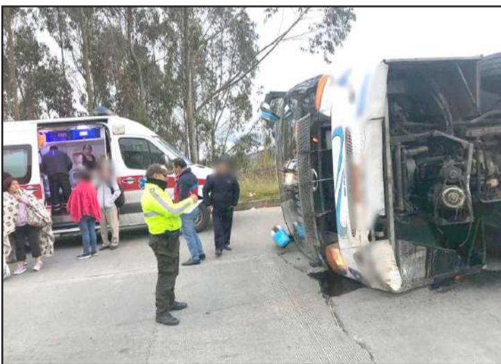
El accidente se suscitó en el sector de Balbanera en el cantón Colta.

Autoridades confirmaron que el vehículo interprovincial cubría la ruta Guayaquil-Ambato. Se trató de una pérdida de carril con volcamiento 1/4.