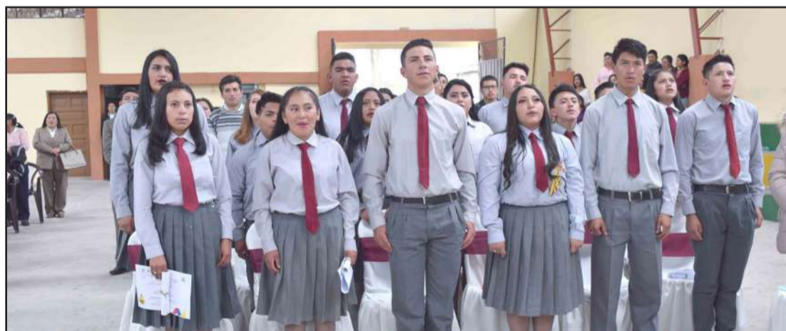
Estudiantes de tercero de bachillerato de la Unidad Educativa Manuel A Méndez.