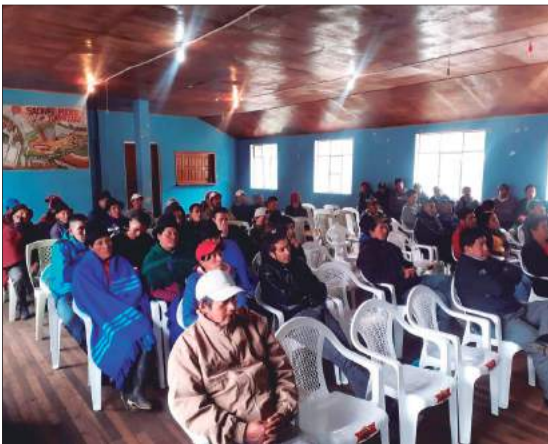
Comunidades que se van a beneficiar del presupuesto participativo.

Las comunidades que se van a beneficiar del presupuesto participativo en la pa-