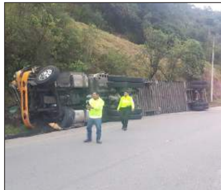
La Policía Nacional colaboró con la seguridad.

estabilizar el camión, y posteriormente lo trasladaron hasta los patios de retención vehicular en Alausí, en donde estará hasta que terminen con las investigaciones. Cabe indicar que no hubo lesionados.