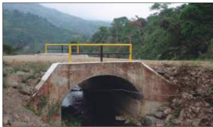
La obra ya fue entregada a la colectividad de Pasagua.