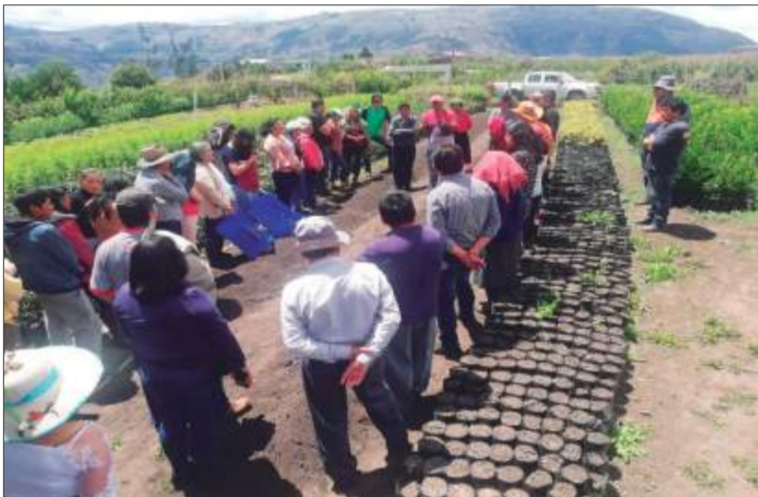
Participantes en la gira durante este día.