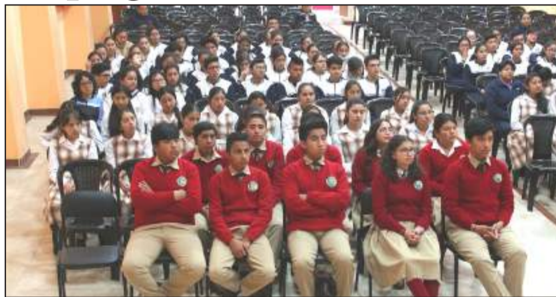
Los jóvenes que participan en el programa recibirán la asesoría técnica adecuada.