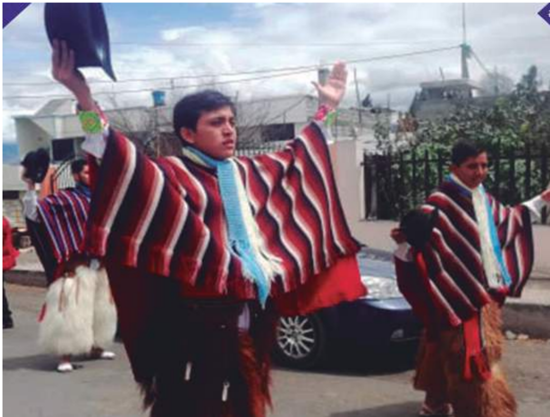
▶ La UTC y Mashca Danza se preparan para las festividades de la parroquia.

Esta tradicional parroquia de Latacunga tiene doce barrios, de estos 10 participaron de los 'repasos', María Jacinta, Santa Bárbara, Chile, Monjas, La Libertad, San Buenaventura Centro, Colaisa, San Francisco, Bellavista y San Silvestre, fue-