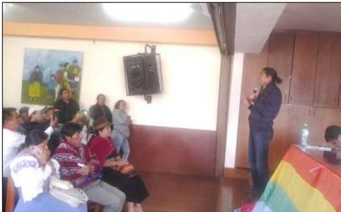
► Yaku Pérez, prefecto de Azuay y dirigente del Movimiento Pachakutik.