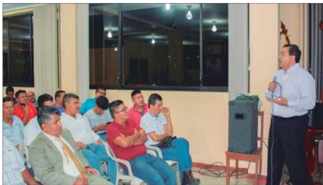
► Socialización de la obra remodelación de la Plazoleta México.