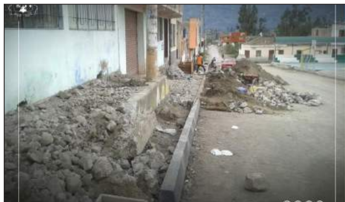
► Los trabajos que se realizan tiene un plazo de 90 días.