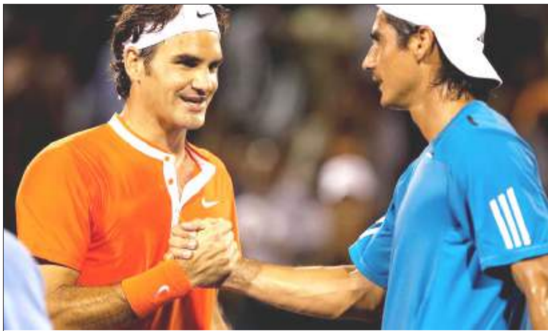
▶ Roger Federer junto a Nicolás Lapentti, en uno de sus partidos años atrás.

Las conversaciones con Roger Federer (3º del ranking ATP) y su manager, para que el suizo aceptara venir a Ecuador a jugar un partido de exhibición, comenzaron hace más de tres meses, según reveló Nicolás Lapentti, organizador del torneo Quito - Mitad del Mundo.