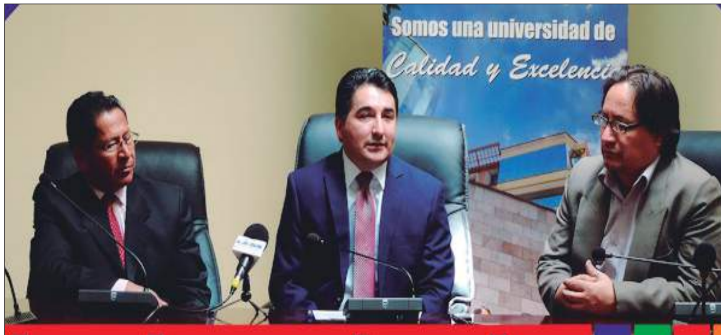
▶ El convenio permitirá a los afiliados estudiar programas de posgrado.