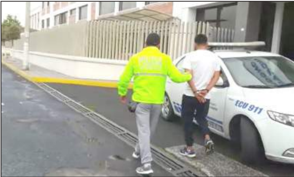
El ciudadano fue detenido en Riobamba por los agentes de la Policía Nacional.

La aprehensión del ciudadano de nacionalidad ecuatoriana se dio cerca de Solca, en donde los gendarmes lo acorralaron y al