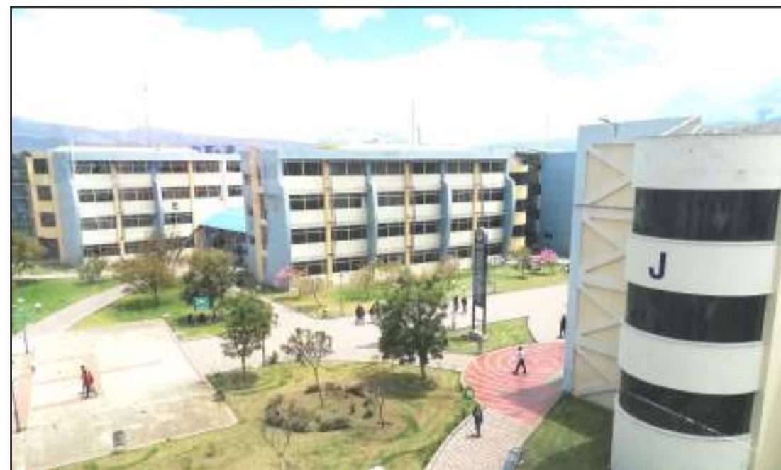
El proyecto macro es la acreditación institucional que se está evaluando.