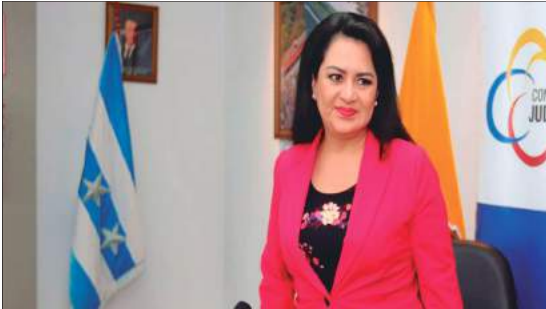
► La presidenta de la Judicatura, María del Carmen Maldonado, durante su visita a la Corte de Justicia del Guayas.

La lista preliminar del Consejo de la Judicatura devela que siete jueces y cinco conjuces se mantendrán en sus funciones de la Corte Nacional de Justicia (CNJ). Siete jueces y cinco conjuces de la Corte Nacional de Justicia (CNJ) recibieron una puntuación favorable en el informe de evaluación al que fueron sometidos por el Consejo de la Judicatura (CJ). Los 12 jueces y 10 conjuces obtuvieron una calificación por debajo de 80 puntos. Cuatro de ellos ya presentaron una petición de reconsideración este viernes 25 de octubre. Con el propósito del Día del Servidor Judicial, la presidenta del CJ, María del Carmen Maldonado, visitó la Corte Provincial de Justicia, con sede en Guayaquil. Antes del evento, la funcionaria se refirió al proceso de evaluación y a la información que circula desde ayer en las redes sociales sobre la lista de los mejores puntuados y los que obtuvieron malos resultados. Los jueces y conjuces fueron notificados el jueves 24 de octubre con los resultados del proceso evaluatorio. Ella aclaró que se trata de una lista preliminar y que una vez concluido el proceso se dará a conocer los nombres de los jueces y