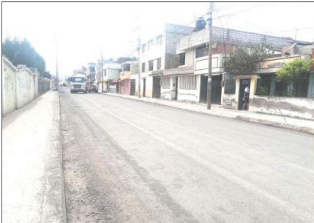
Los trabajos se realizan hasta los fines de semana para acabar de manera breve.