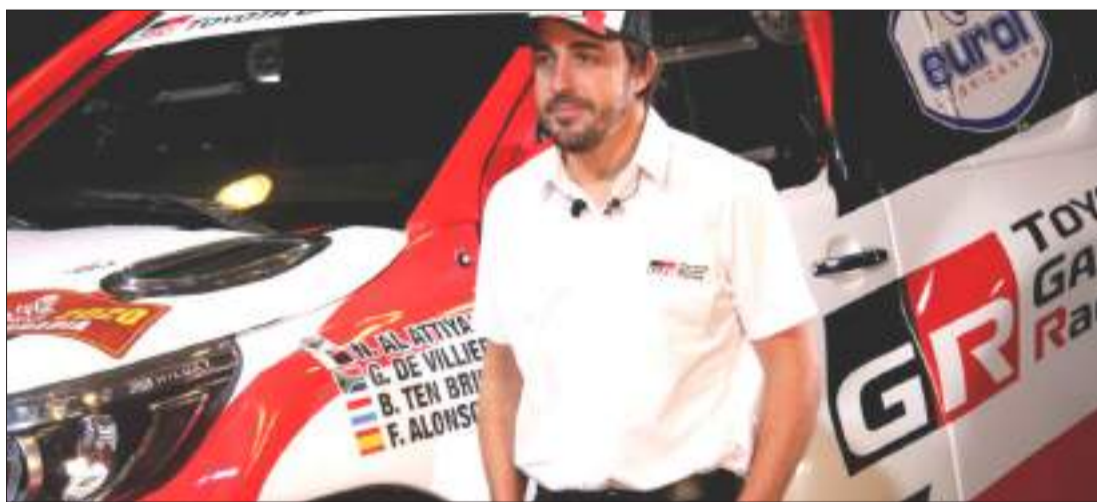
▶ Fernando Alonso anunció que se preparará arduamente.