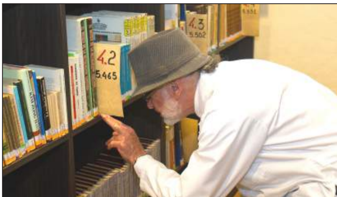
► Las Bibliotecas del Ministerio de Cultura y Patrimonio albergan aproximadamente 383.000 bienes bibliográficos.