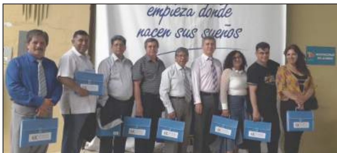
► Delegación de Chimborazo participó de la convención nacional.