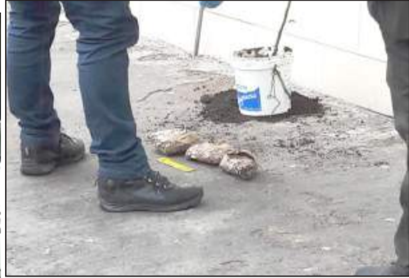
La droga se hallaba oculta en una maceta.

realizarse un cacheo, se tomaron con el alcaolide.