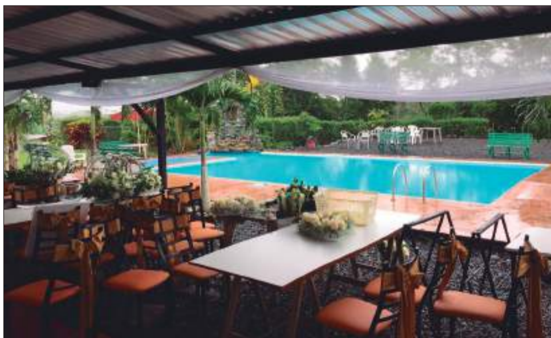
► Paradero Che Carlitos, Las Américas, vía Santa Martha.

De manera que el turista también puede conocer las prácticas de cultivos de la Amazonia. Este emprendedor ha trabajado en el área turística, desde que tiene uso de razón, nos comenta, por lo que se considera una especialista en atención a los visitantes, manifiesta que su carisma es el servicio, de ahí que no le faltan clientes.