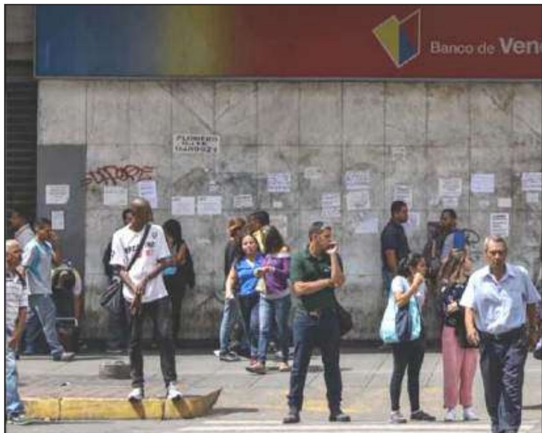
► Personas caminan frente a una entidad bancaria en Caracas. La inflación acumulada de 2019 en Venezuela se situó hasta septiembre en 3.326 %.