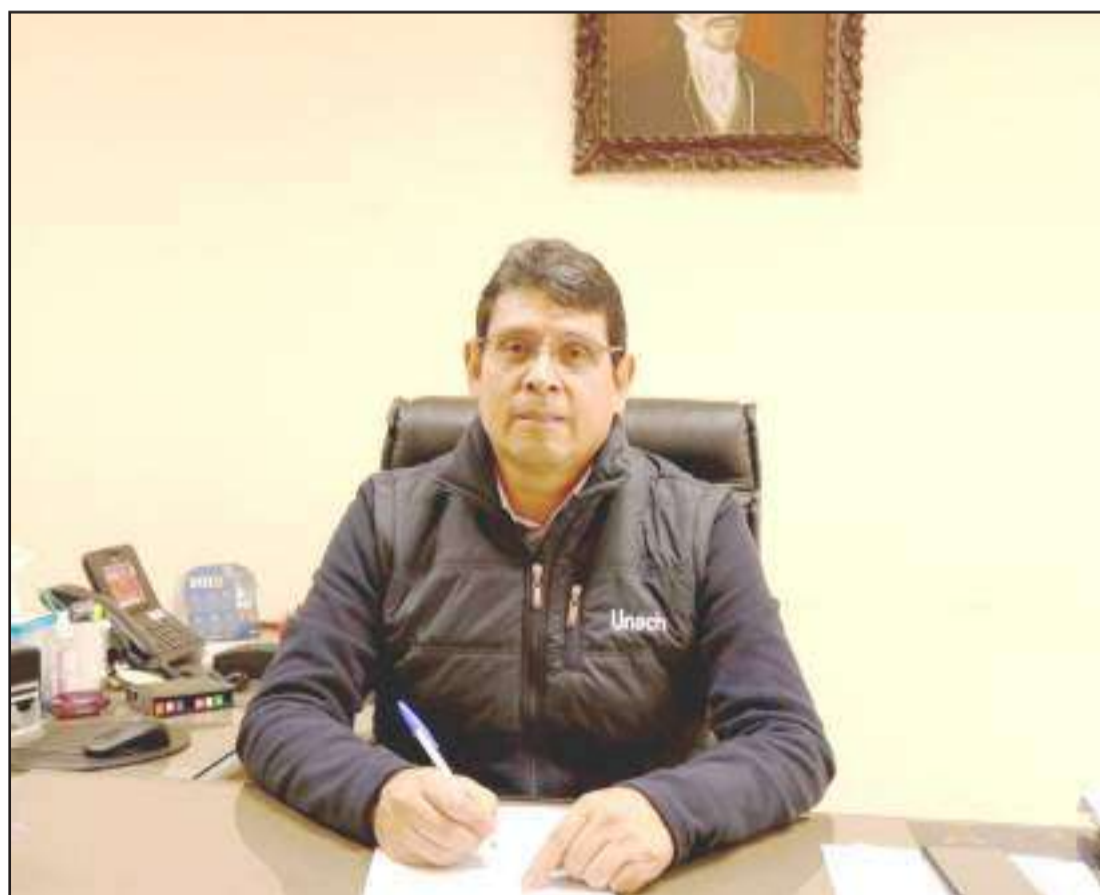
► El proceso de acreditación de la carrera de Medicina pasó por diferentes filtros.