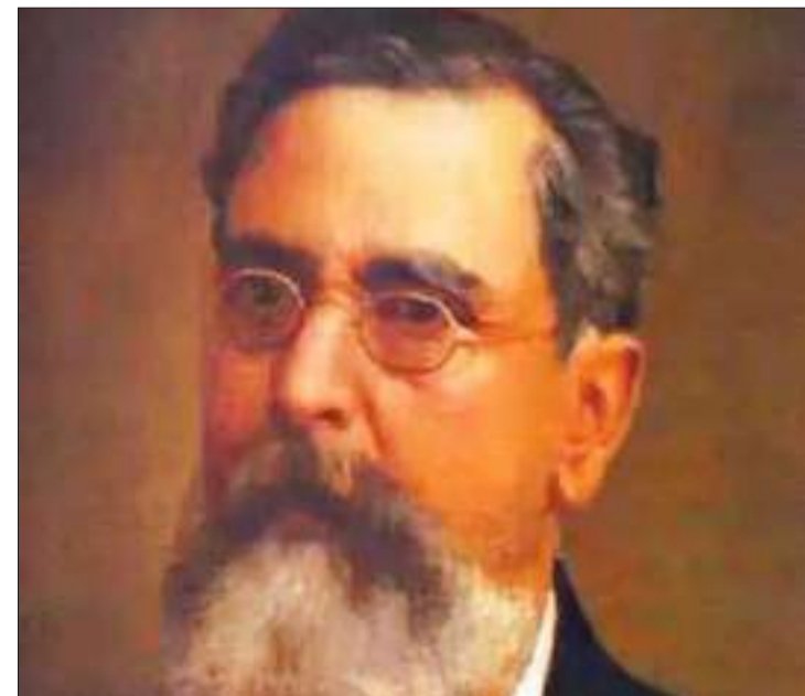
▶ Víctor Emilio Estrada, expresidente del Ecuador.

Conque, al morir, fue enterrado en su tumba de cobre, una de las más grandes del famoso cementerio de Guayaquil. El demonio, tal cual