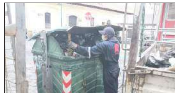
► La recolección de basura se está haciendo a diario.