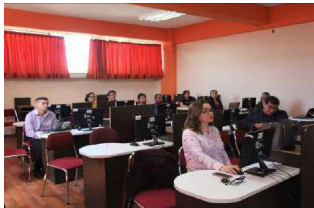
Varios ejes se abordaron durante el curso.