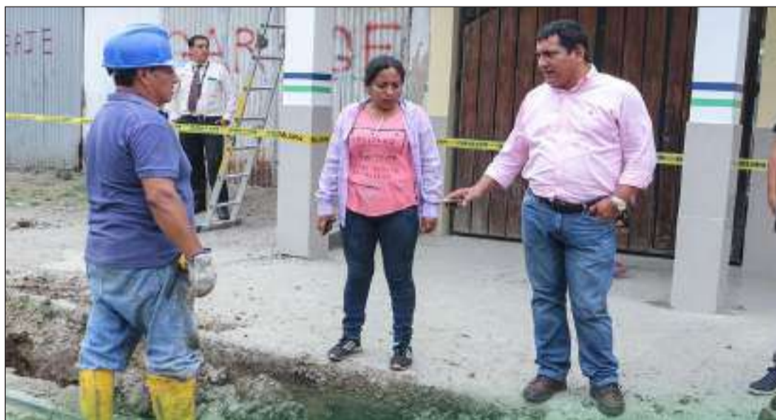
La labor se cumple en diferentes puntos de la urbe.