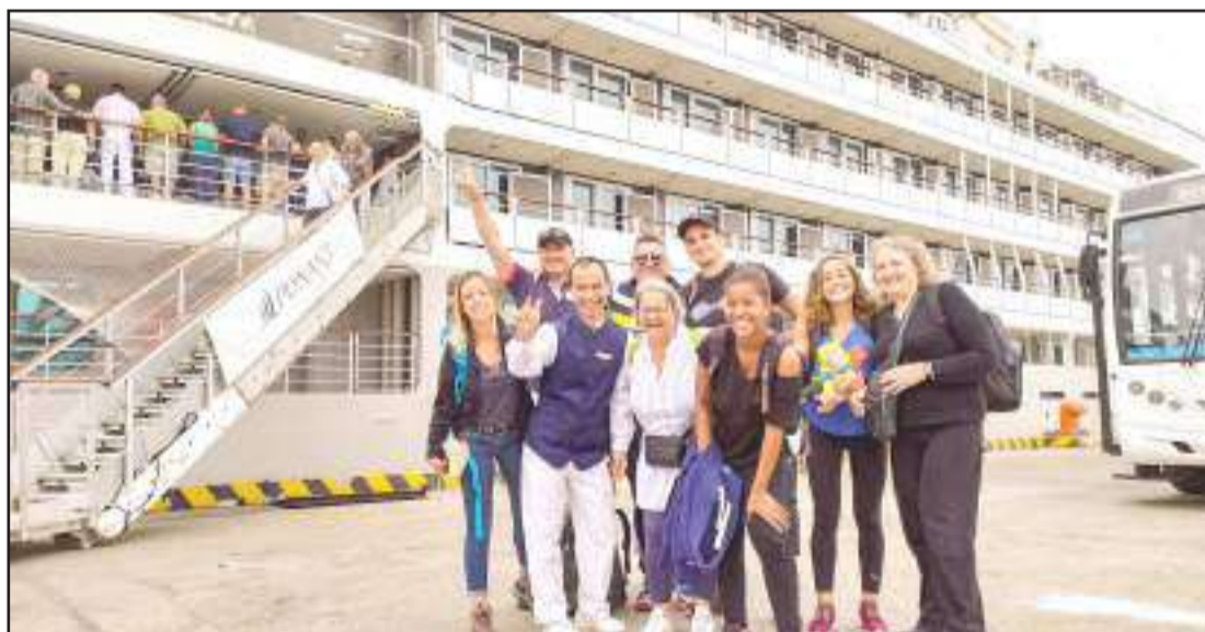
El Puerto Principal, hasta diciembre de este año, prevé recibir al menos seis embarcaciones que trasladan a cientos de visitantes de diversas partes del mundo.