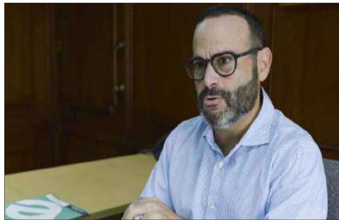
Un hombre trabaja en Las calles lucen desoladas en Quito tras anuncio de toque de queda.