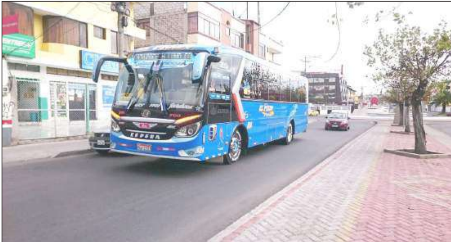
► Al momento, el servicio de transporte público no está circulando debido a las manifestaciones dentro del cantón.

La Agencia Nacional de Tránsito emitió la resolución 081 reformativa a la 077, en donde la institución dispone el incremento de 0,10 centavos a la tarifa de transporte urbano, dejando al sistema de transporte comercial a un análisis