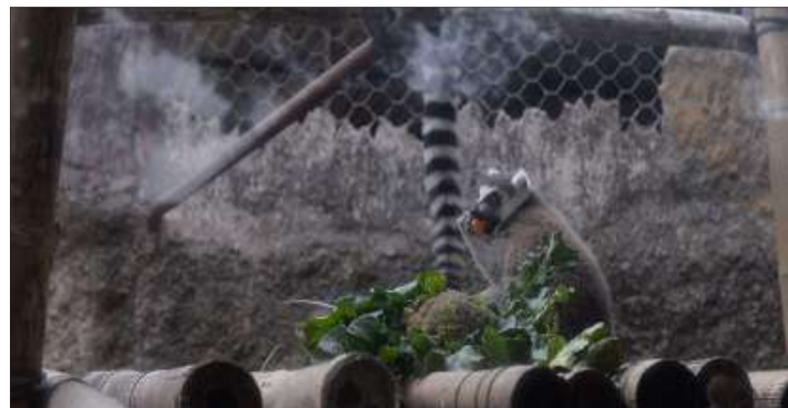
El lemur es una de las 1.000 especies que habitan en el "zoo" El Pantanal, de Guayaquil. Su dieta está basada en coliflor, zanahoria y otros vegetales.