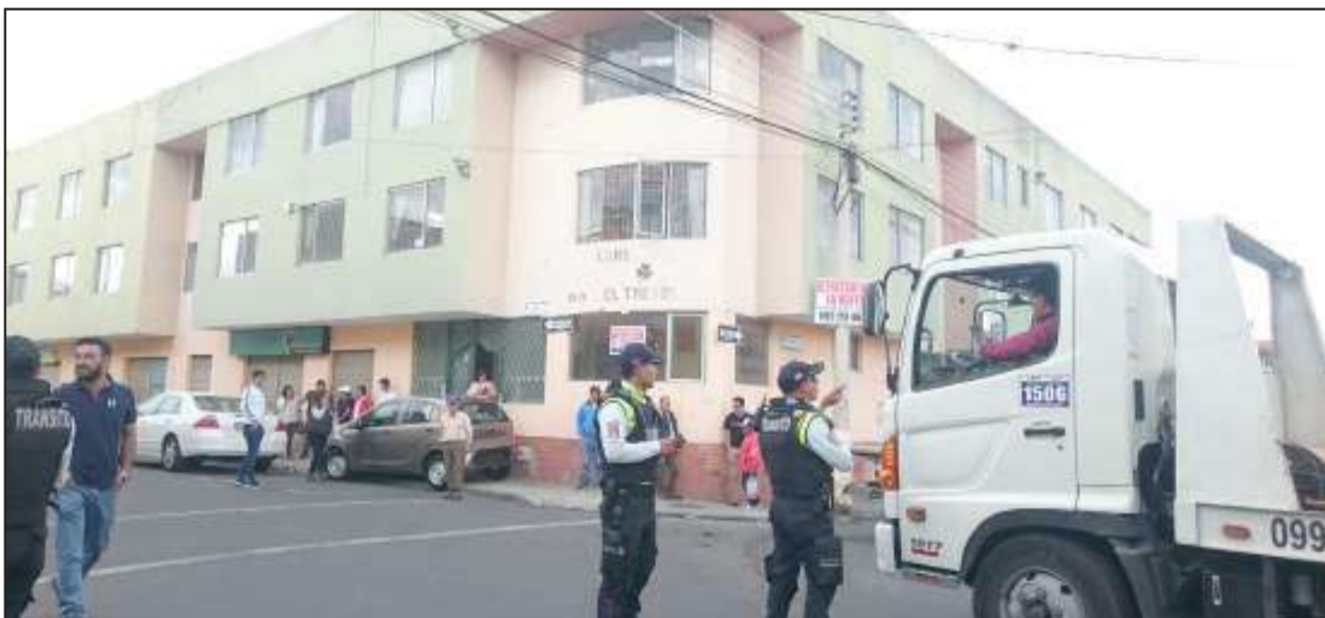
Uno de los últimos accidentes de tránsito dejó daños de consideración.