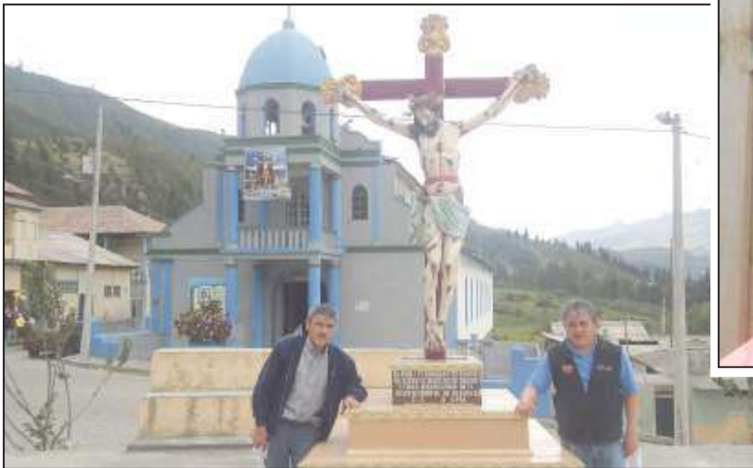
Imagen del Señor de la Buena Muerte junto a sus devotos en Guanando.

Añadió, que se reunieron este jueves quienes forman y han formado parte de estas