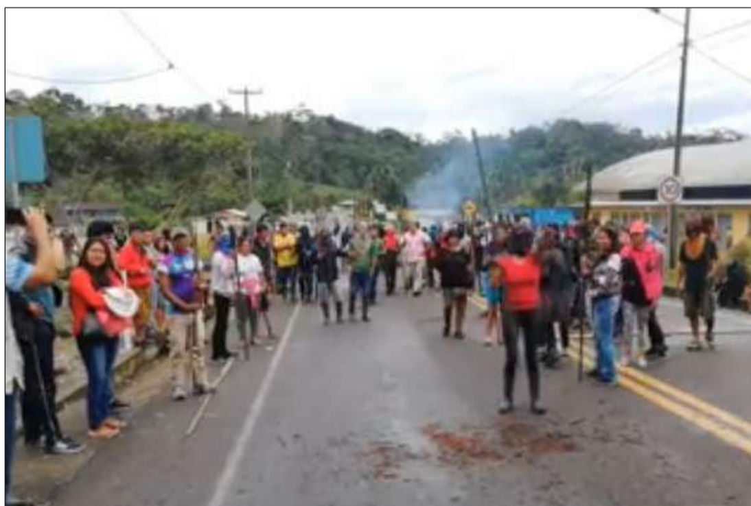
► Manifestantes habrían cobrado por dejar pasar a la gente.

tido a sus bases que esta medida de hecho no debe empañarse con estas acciones, porque existen personas infiltradas, o sea porque otras razones, se han dado estas anomalías.