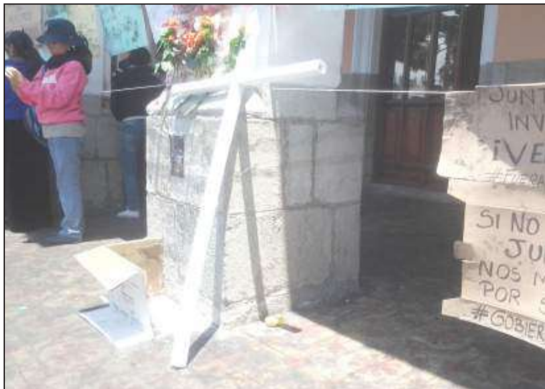
Ceras y una cruz blanca se colocó en los bajos de la Gobernación de la provincia.