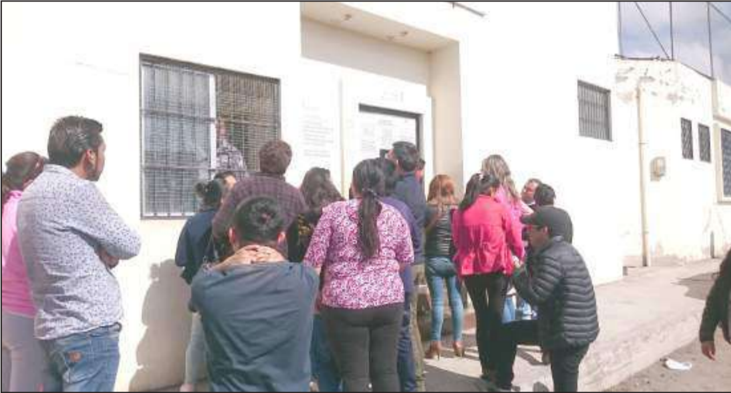
Las personas que han sido detenidas por las manifestaciones han sido procesadas conforme la ley indica.

La mayoría de las marchas, principalmente indígenas, han sido pacíficas, además según Baquero, los dirigentes indicaron que si existieran infiltrados que generan caos, ellos los detendrán.