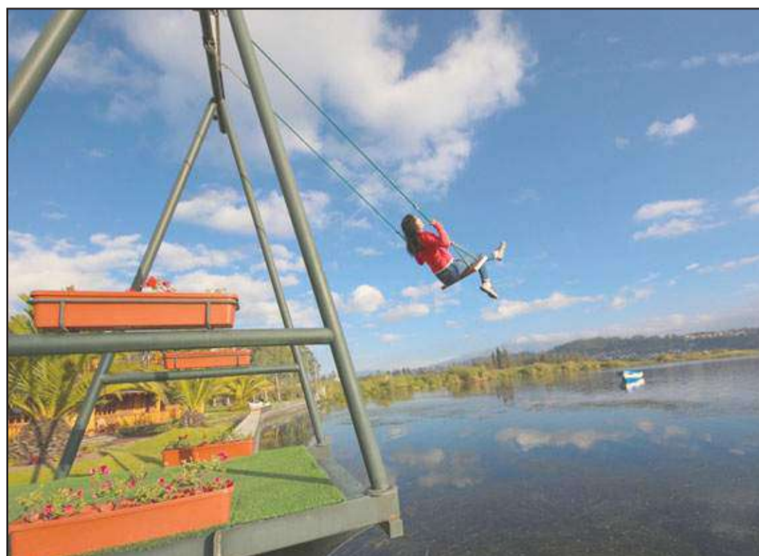
Estos juegos divertidos se han convertido en miradores espectaculares desde los cuales se admiran los diversos paisajes que rodean al país.