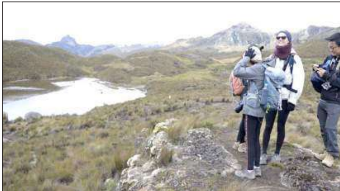
Las lagunas del Cajas se han convertido en el mayor atractivo para los turistas nacionales y extranjeros. Se puede caminar en sus alrededores.

El motocross, el ciclismo y el uso de polaris se han incrementado en el macizo, contaminando los páramos con aceites o dañando la vegetación. En este sitio existen 4.265 lagunas, entre grandes y pequeñas que son vigiladas diariamente.