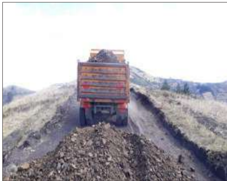
Los trabajos se cumplen con normalidad.