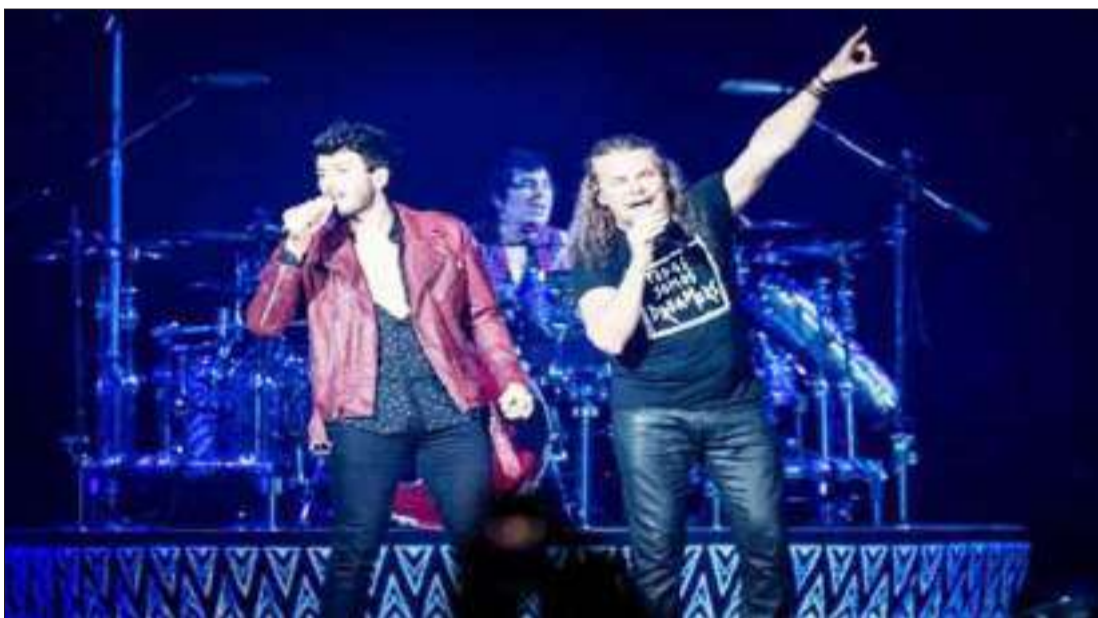
▶ MANÁ, banda mejicana se toma la ciudad de los Ángeles—California.