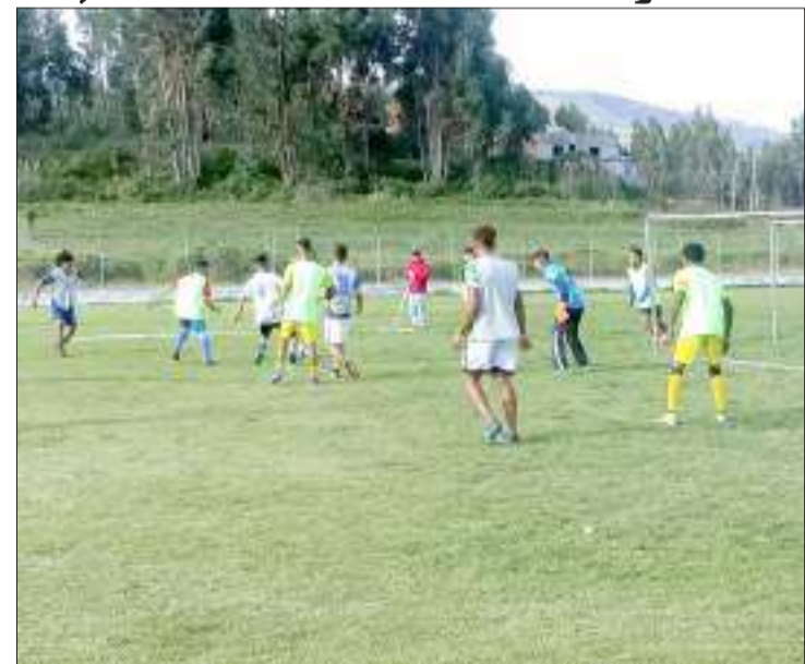
▶ Equipo del Deportivo Guano en pleno entrenamiento.

"El equipo está trabajando de muy buena manera, los muchachos al igual que nosotros