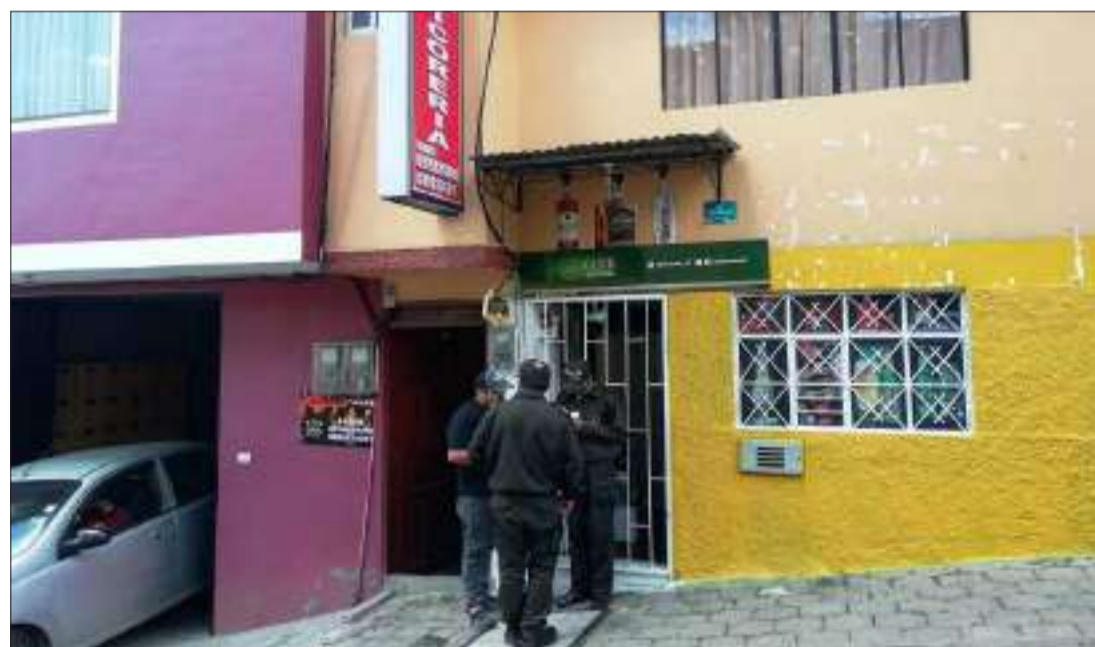
Este tipo de acciones son bien recibidas por los moradores.