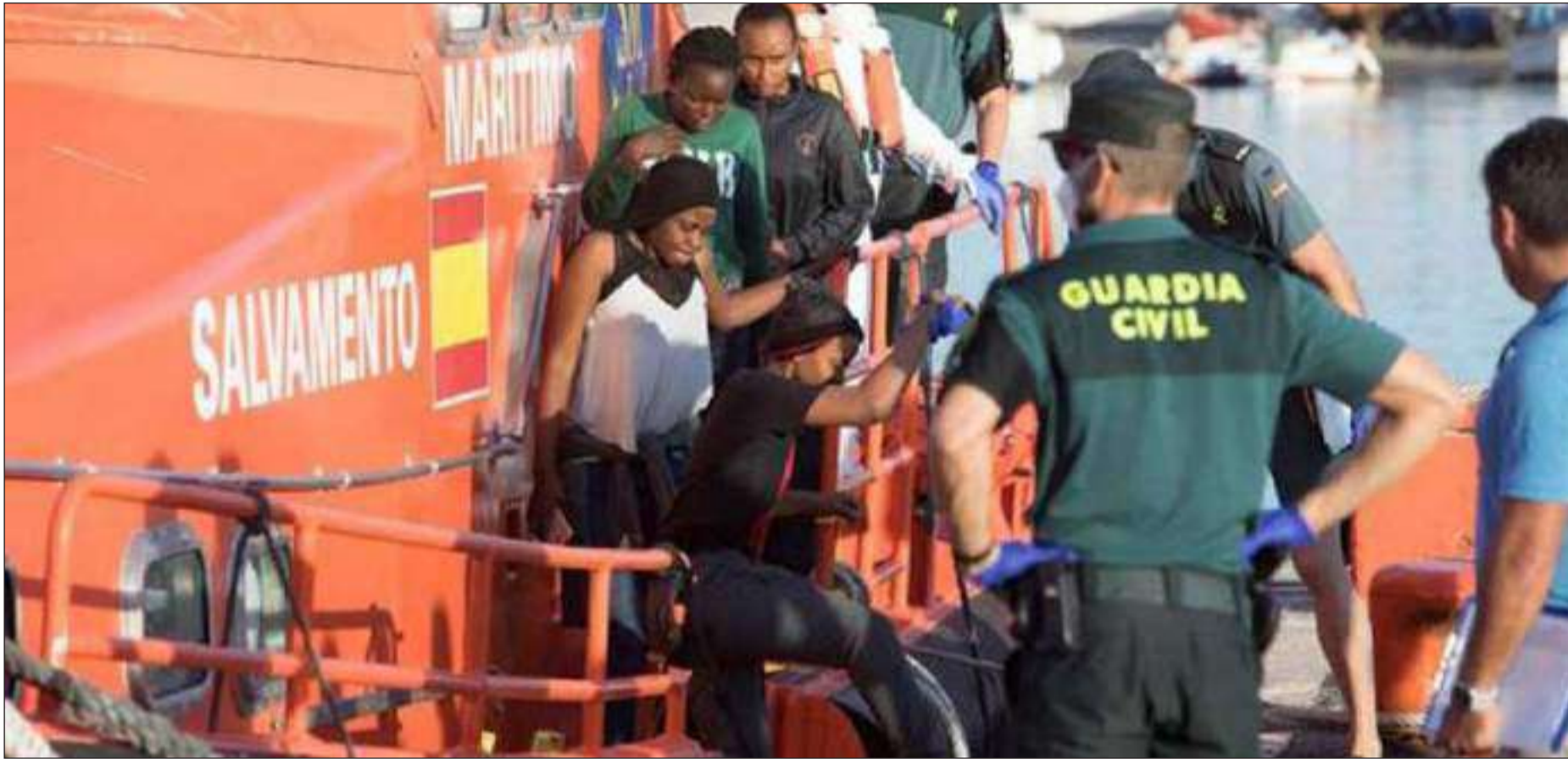
► Llegada de 58 inmigrantes al puerto granadino de Motril rescatados trece millas al noroeste de la isla de Alborán de Zaruma, en Granada.

Las muertes de migrantes irregulares en el Mediterráneo llegaron a 1.071 en los primeros diez meses de este año, un 55% menos que en el mismo período de 2018, según cifras de la Organización Internacional de las Migraciones (OIM), que advirtió de que pese a ello las condiciones y el riesgo para los que migran están empeorando. En un comunicado, emitido ayer, la organización vinculada a la ONU cifró en 76.558 el número de personas que sortearon los peligros y los obstáculos de la ruta migratoria y lograron arribar a las costas de Europa, lo que supone un 13% menos que en el mismo período de 2018. Como entonces, la mayor parte de los migrantes llegaron a Grecia (19.443 personas) y España, el país de destino preferido con 41.321 personas en los primeros diez meses de 2019. La tendencia es negativa para Grecia, que ha visto cómo las llegadas a sus