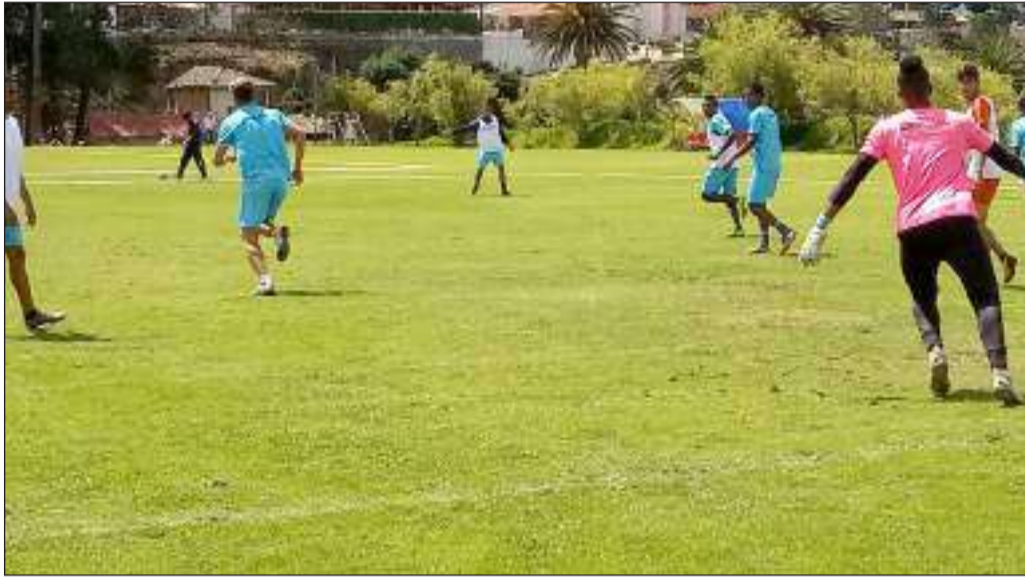
▶ Entrenamientos del equipo olmedino inician hoy en el complejo deportivo.

El cuadro olmedino sigue su preparación hoy a partir de las 09H30 en el estadio del Complejo Deportivo y lo hará buscando estar listo para enfrentar dos partidos seguidos, el miércoles ante Independiente y el fin de semana ante la Universidad Católica.