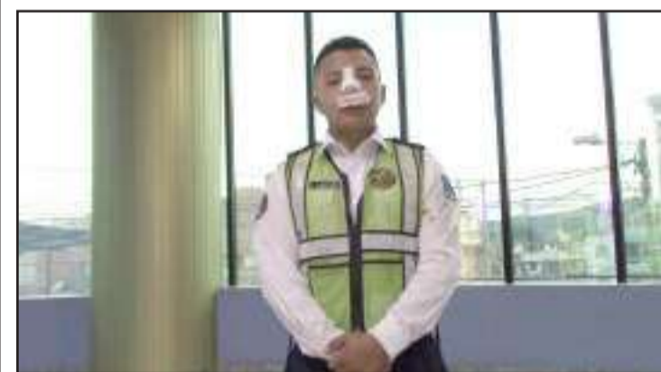
El agente que fue agredido comentó algo de lo que le pasó.