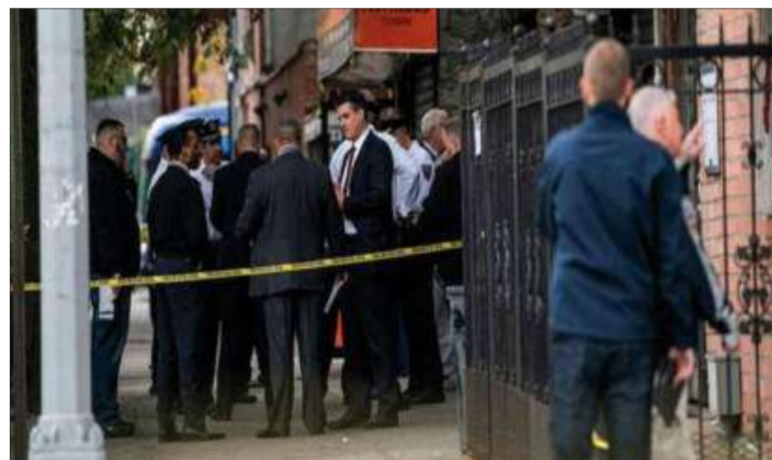
► Un tiroteo en un club de eventos de Nueva York dejó cuatro muertos.