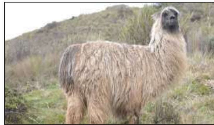
En el Parque Nacional Cajas, la flora y la fauna son elementos protegidos, pero en el macizo los ciudadanos realizan actividades deportivas.

La contaminación y daño al páramo de zonas cercanas al Parque Nacional Cajas, en las afueras de Cuenca, preocupa a las autoridades de la Empresa de Telefonía, Agua Potable y Alcantarillado, (ETAPA), como también a los ciudadanos.