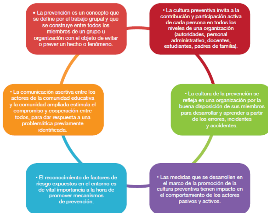
Ilustración 1: Cultura Preventiva

Para mayor detalle sobre cultura preventiva y algunos ejemplos de emprendimientos, es necesario que el docente facilitador pueda realizar investigaciones bibliográficas o net gráficas adicionales.