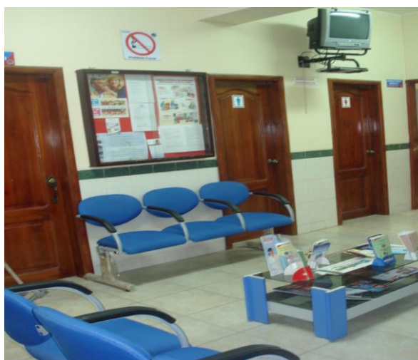
Sala de espera. Campus Edison Riera.

Los usuarios para obtener nuestra atención deben acercarse a los dos locales del Departamento Médico, en el Campus Ms. Edison Riera y Campus la Dolorosa.